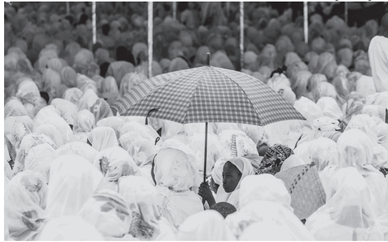
Les fidèles pendant le pèlerinage

intéressant de s'intéresser à la pratique religieuse au Sénégal. Bien que la tendance s'oriente vers un renforcement strict et rigoureux de la pratique, la religion musulmane au Sénégal montre une pratique assez libre d'environ 95% de la population, bien qu'encadrée par des chefs spirituels de différents mouvements religieux. Elle est globalement empreinte de tolérance, excepté en ce qui concerne la question de l'homosexualité. Les Sénégalais restent partagés entre leur culture animiste, leur religion musulmane, leur caste traditionnelle et la modernité. Les femmes, au sein de la population, occupent un statut particulier en Afrique : fières, fortes, certaines d'entre elles montrent une réelle intelligence dans l'art de combiner tous les aspects de ce « métissage » sénégalais.