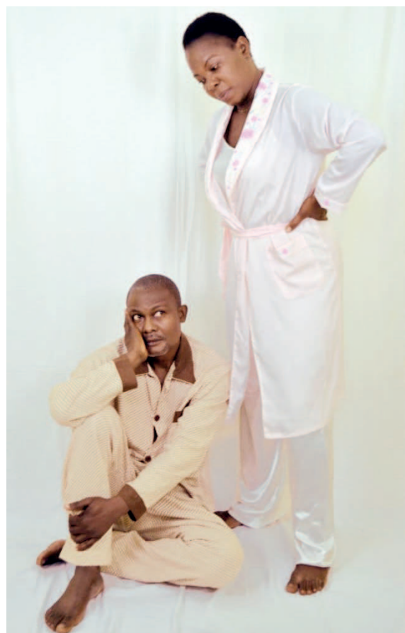
Les deux acteurs