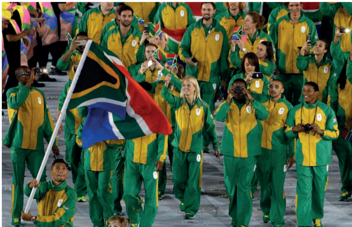
L'Afrique du Sud compte seulement deux médailles en argent

Les pays africains ne séduisent pas et n'arrivent pas à s'afficher sur le tableau d'honneur de ces jeux qui se déroulent sans public à cause du coronavirus. Sur les cinquante-quatre pays africains présents à Tokyo, presque rien de bon, à l'exception de la Tunisie et la Côte d'Ivoire qui se cherchent encore. En date du 28 juillet, l'Afrique ne comptait même pas dix médailles dans sa gibecière mais continue à multiplier les échecs, réduisant ainsi ses chances de rivaliser les autres continents.