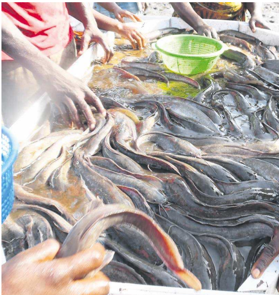
Du poisson frais à l'étalage

Il faut noter que depuis 2018, le Congo a amorcé la réforme des activités de la mer, afin de moderniser et mieux encadrer le secteur de la pêche. Le pays a introduit le concept « écosystémique » pour pouvoir à terme garantir une pêche durable et permettre à celle-ci de contribuer à la diversification de l'économie. Cette réforme ad-