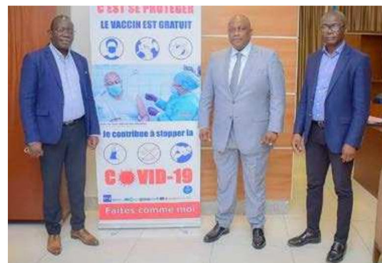
Le ministre Mbungani et ses hôtes

Core Group-USA est le seul acteur dans son domaine qui rassemble les praticiens et les professionnels de la santé communautaire mondiale en vue de partager des connaissances, des preuves et des meilleures pratiques.