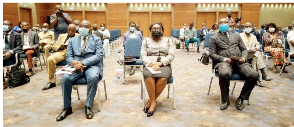
La cérémonie de sensibilisation aux nouveaux programmes (Adiac)

Le ministère chargé de l'Enseignement primaire et secondaire vient d'initier des journées de sensibilisation de la communauté éducative à la révision des programmes scolaires qui seront en vigueur à la prochaine rentrée scolaire 2021-2022.