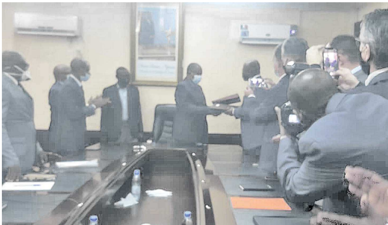
Échange de parapheurs entre les deux parties

Les techniciens de Lincoln W Ltd vont travailler d'arrache-pied pour pouvoir rendre l'électricité stable au profit des entreprises et des ménages congolais. « Il faut d'abord commencer par les travaux de la première phase, dont nous avons une estimation du coût. Mais, il faut une étude de faisabilité afin de déterminer le coût réel des travaux de la seconde phase », a laissé entendre le directeur général de