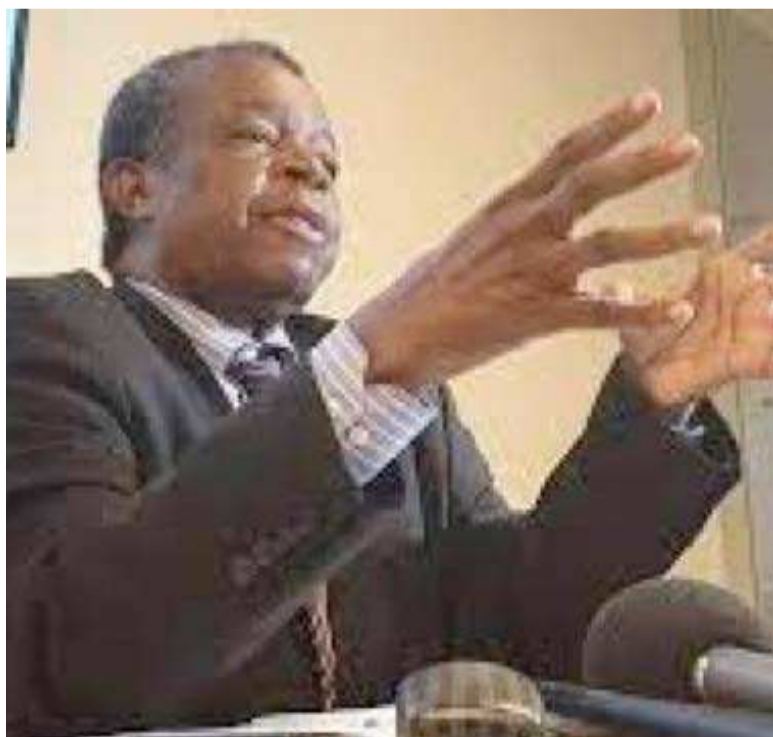
Le Pr Muyembe