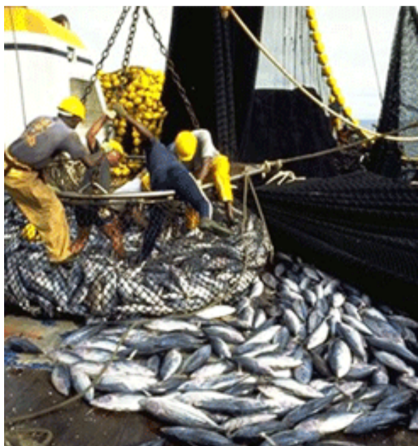
Du poisson frais/Adiac

En vue d'accroître la production du poisson en nette baisse depuis quelques années au niveau de la pêche maritime, les acteurs de ce secteur sollicitent l'appui du ministère de tutelle pour une plus grande implication afin de booster la pêche industrielle au Congo.