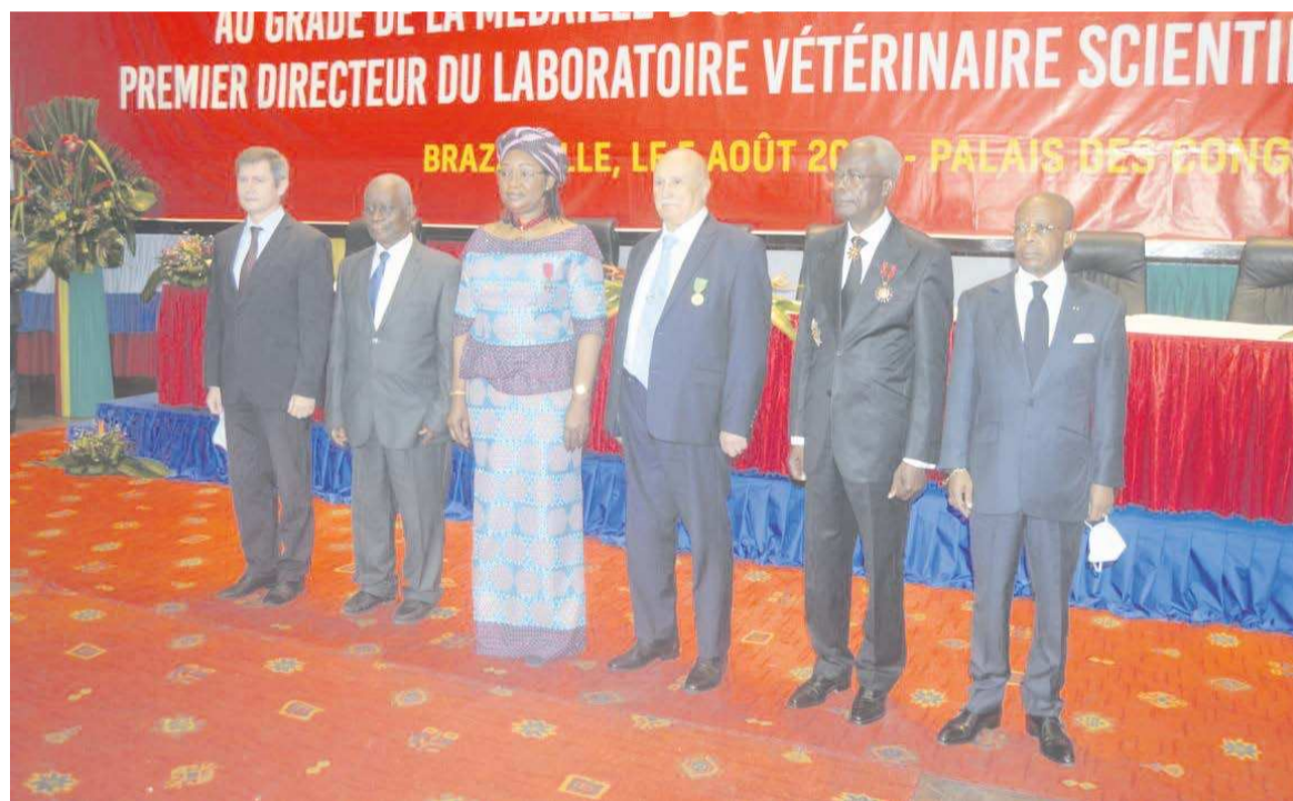
Le chercheur russe avec les officiels après sa décoration

le premier directeur du laboratoire vétérinaire de Brazzaville dans les années 1970. Il a contribué, entre autres, au travail scientifique de diagnostic des maladies animales qui affectent aussi l'homme, du fait