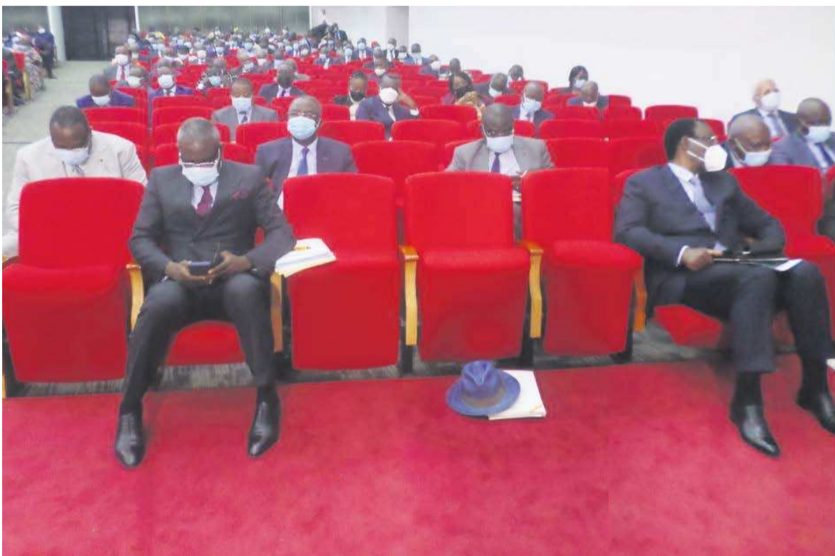
Les membres du gouvernement lors de la séance

Onze ministres conduits par le Premier ministre Anatole Collinet Makosso ont répondu le 4 août à Brazzaville aux questions des sénateurs à l'occasion de la séance des questions orales avec débats.