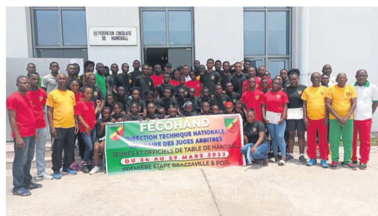
Les participants au séminaire

La Fédération congolaise de handball (Fécohand) a organisé, du 24 au 27 mars à Brazzaville, un séminaire de formation au profit des jeunes attirés par les métiers d'officiels de table et de l'arbitrage. Divisés en deux catégories, ces futurs acteurs du handball congolais ont pour certains 15 ans, d'autres 20 ans.