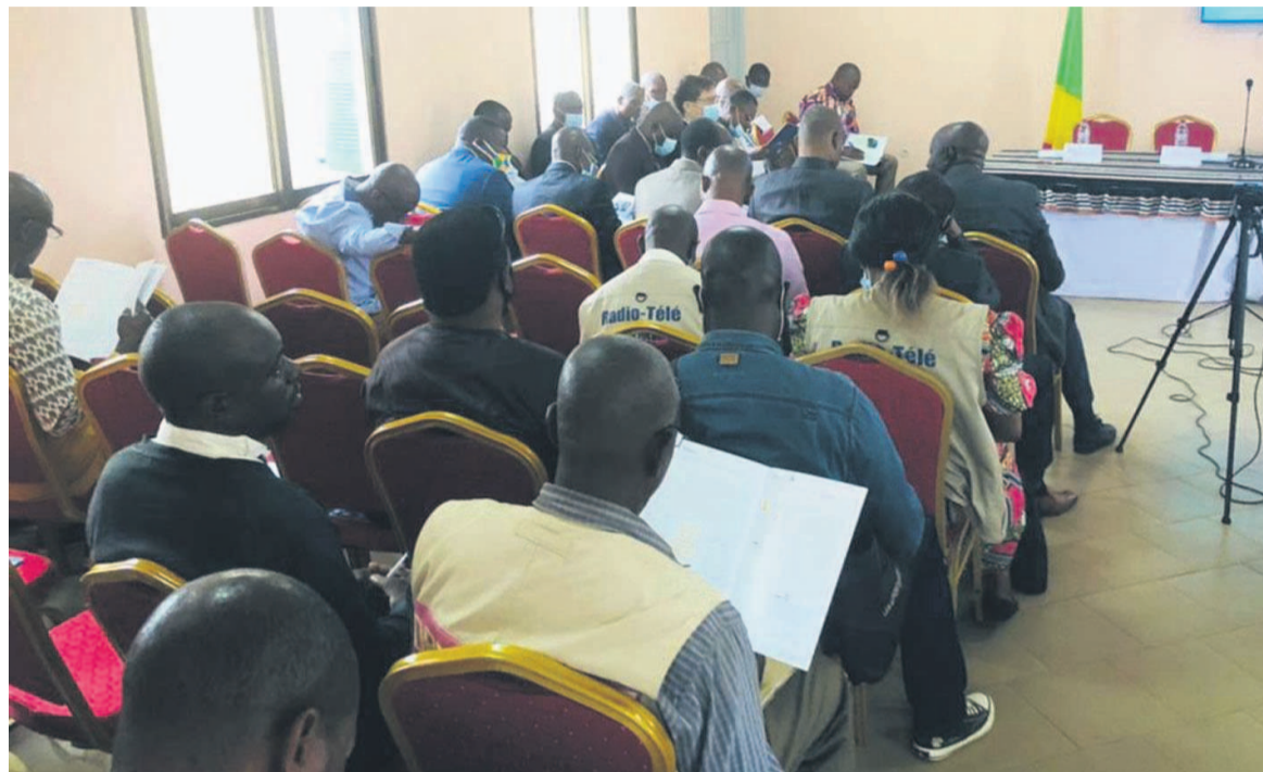
Les journalistes en pleine formation.

Dans la perspective de la tenue des élections législatives et locales de juillet prochain, l'Union européenne et le Conseil supérieur de la liberté de communication (CSLC) ont organisé récemment à Mouyondzi, dans la Bouenza, une formation spéciale pour donner aux journalistes de cette partie du pays des outils nécessaires leur permettant d'assurer la couverture médiatique équilibrée de ces scrutins.