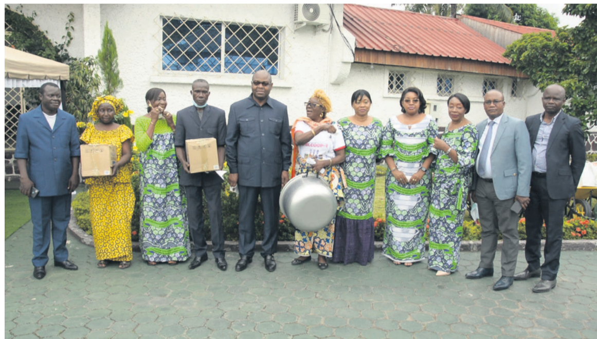
La délégation de la FCA posant avec les responsables des groupements

Dans leur mot respectif prononcé devant le secrétaire de la FCA, représentant l'épouse du chef de l'Etat, les responsables de chaque groupement ont exprimé leur satisfaction et remercié la première dame du Congo pour « le geste louable » qui contribue à la réduction de la pénibilité du travail des femmes. « Ce don que vous venez de nous remettre va