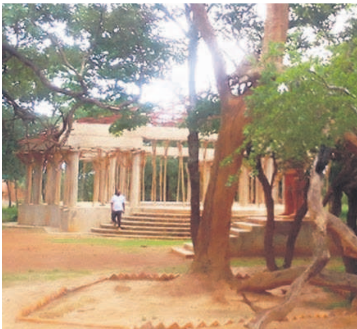
L'arbre où le héros national fut attaché et assassiné.