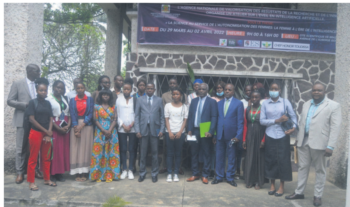
Les participantes à l'atelier sur l'intelligence artificielle et les encadreurs

L'Agence nationale de valorisation des résultats de la recherche et de l'innovation (Anvri) organise, du 29 mars au 2 avril, un atelier en faveur des femmes et filles de science sur le thème « La science au service de l'autonomisation des femmes : la femme congolaise à l'ère de l'intelligence artificielle ».