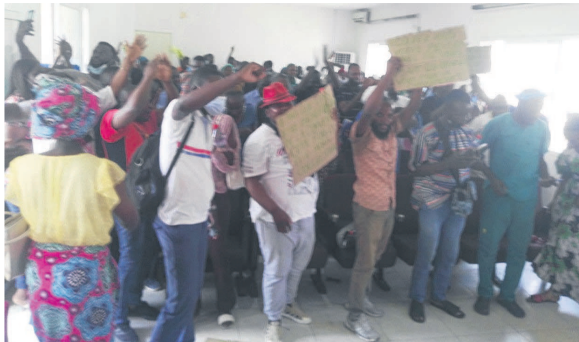
Les participants à l'assemblée générale après la lecture du communiqué final faisant état du préavis de grève