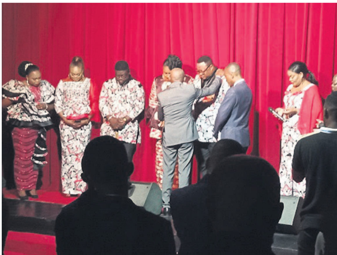
Le patriarche Charles Nkelani bénissant le collectif One gospel press

Le collectif One gospel press s'est ainsi constitué en « un réseau de journalistes et animateurs culturels qui s'est assigné pour but l'évangélisation à travers les médias ». Il entend dès lors prêter « dans les règles de l'art