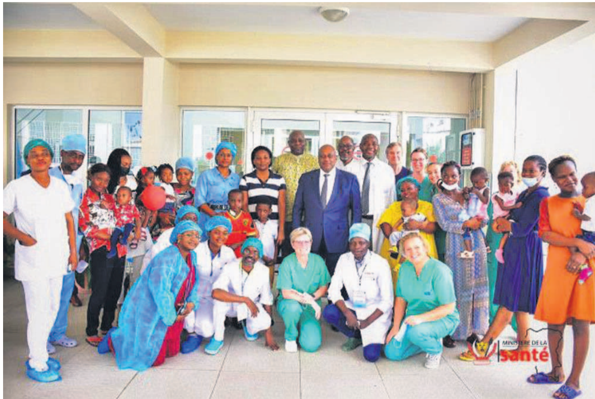
Le ministre de la Santé posant avec l'équipe des médecins et des parents des enfants opérés

« Je tiens aussi à féliciter les enfants parce qu'ils ont tenu bon pour passer cette épreuve difficile ; les parents également pour l'accompagnement dans ce processus qui a commencé depuis longtemps, mais