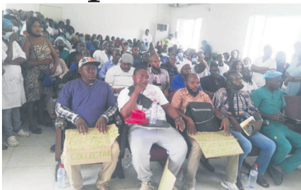
Vue de la salle lors de l'assemblée générale du 25 mars

Le personnel de l'Hôpital général Adolphe-Sicé a déposé à la tutelle un préavis de grève allant du 29 mars au 12 avril, en cas de la non prise en compte de leurs revendications sociales.