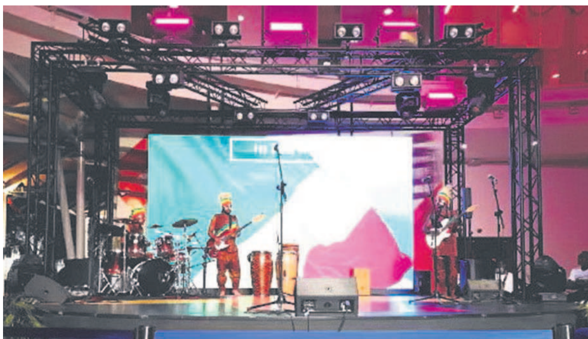
Un artiste congolais sur scène au pavillon angolais

« Ce devoir de promouvoir la culture congolaise est plus que jamais un pari pour nous », déclaré le promoteur qui ne s'être pas produit au pavillon du Congo. Il s'est tout de même dit satisfait