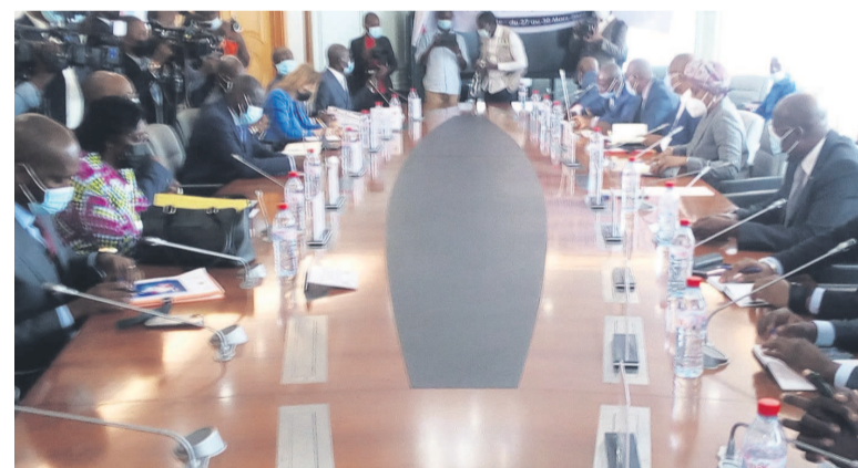
La rencontre des experts de la Banque mondiale avec les autorités congolaises

Le vice-président de la Banque mondiale pour l'Afrique de l'ouest et du centre, Ousmane Diagana, a annoncé lundi, au cours d'une rencontre avec les ministres sectoriels, les syndicats patronaux et les bénéficiaires des projets structurants, la possibilité de son institution d'accorder un financement supplémentaire pour accroître leur impact sur le terrain.