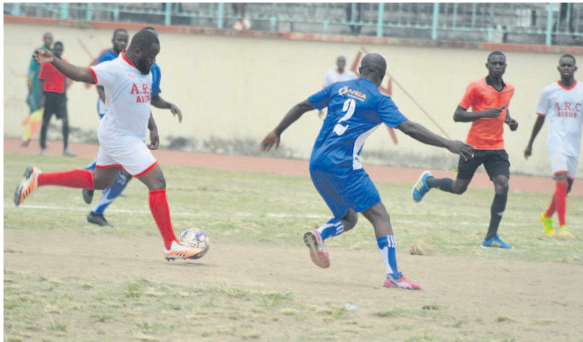
Le match opposant l'ARC à NSIA/Adiac

Après avoir concédé une lourde défaite dans le derby des assurances, l'équipe de NSIA promet de rectifier le tir pour aller de l'avant lors du championnat organisé par la Ligue départementale du sport de travail de Brazzaville