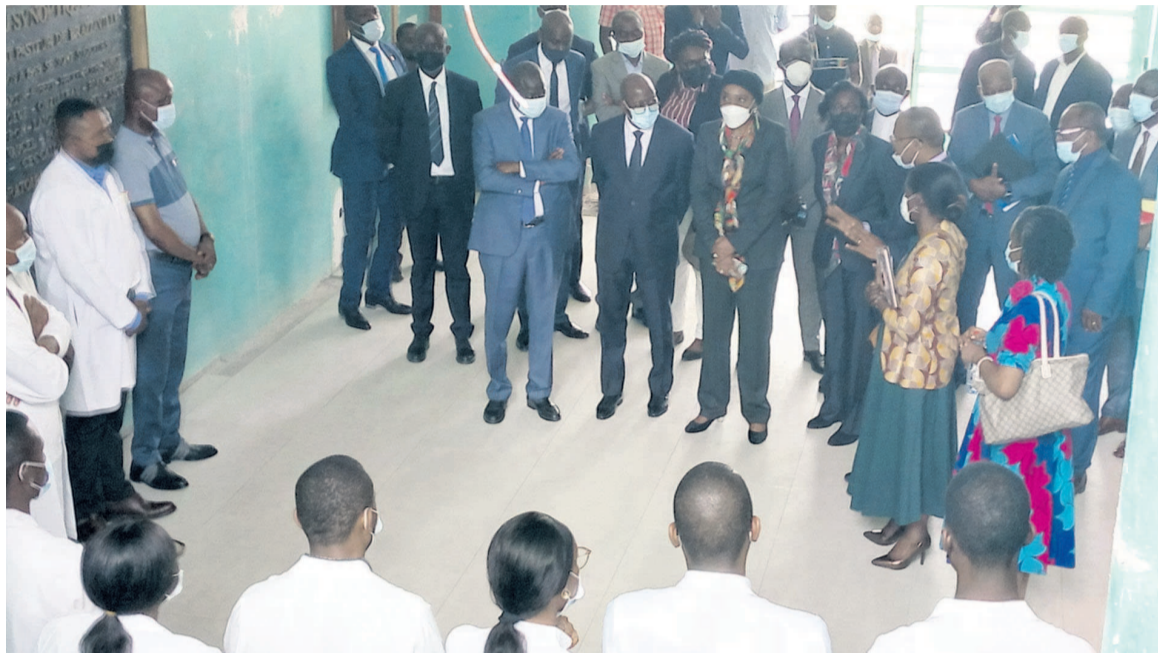
Le vice-président de la Banque mondiale en compagnie des deux ministres s'entretenant avec le personnel

Au cours de cette visite, la délégation a saisi l'occasion pour apprécier les travaux qui se font avec un accent