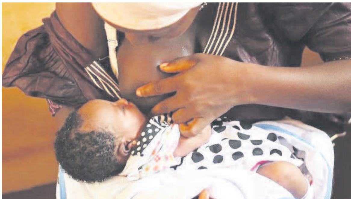
Une maman allaitant son enfant

D.M.K : Les mères sont encouragées d'allaiter leurs enfants jusqu'à au moins l'âge de 2 ans. En fait, cette façon de faire présente des avantages aussi bien pour les en-