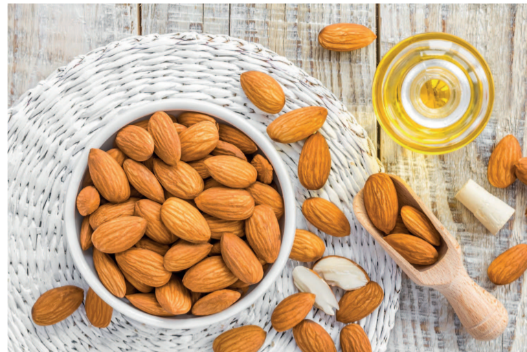
Des amandes

Produit naturel et non transformé, cet oléagineux est facile à transporter et donc à consommer. Il suffit d'une poignée, soit environ 30g, pour