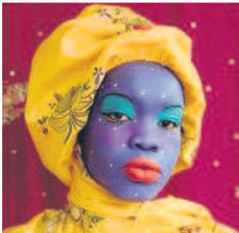
La photographe sud-soudanaise

La photographe sud-soudanaise, Atong Atem, a récemment remporté le premier prix artistique « La Prairie Art Award 2022 », organisé par la maison de cosmétique de luxe suisse La Prairie, en étroite collaboration avec l'Art Gallery of New South Wales.