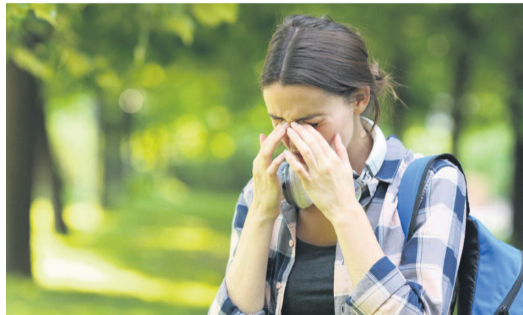
Jeune dame manifestant des signes de fatigue

Écoulement nasal, larmoiements..., les symptômes de la rhinite allergique, plus connues sous le nom de rhume des foins ou de l'allergie aux acariens, sont bien identifiés. Mais il en est un que l'on néglige parfois : la fatigue. Pourquoi pollens et poussière nous mettent-ils sur les rotules ?