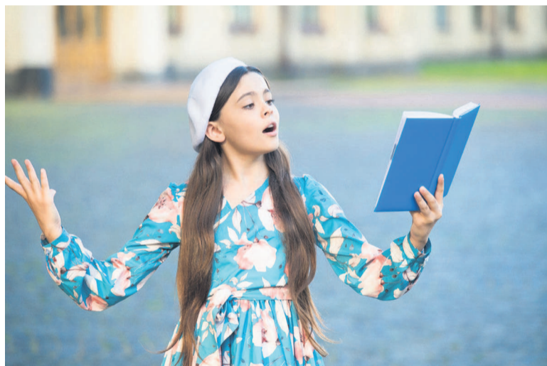
Une fillette faisant de la poésie

Comme « la poésie d'un peuple est l'élément de son progrès », à en croire Victor Hugo dans «Les Misérables», rimes, quatrains et autres allitérations constituent-ils aussi un réservoir de santé et de bien-être ? La réponse prend la forme d'un grand oui. C'est même la science qui le dit !