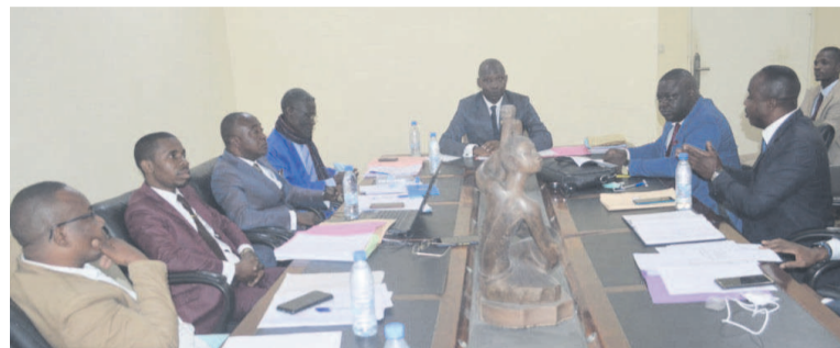
Les membres du Comité de direction Adiac

Réuni le 14 avril à Brazzaville en session inaugurale, le Comité de direction du Bureau congolais des droits d'auteur (BCDA) a demandé aux créateurs et inventeurs d'œuvres d'esprit de les protéger afin de profiter des acquis en vigueur.