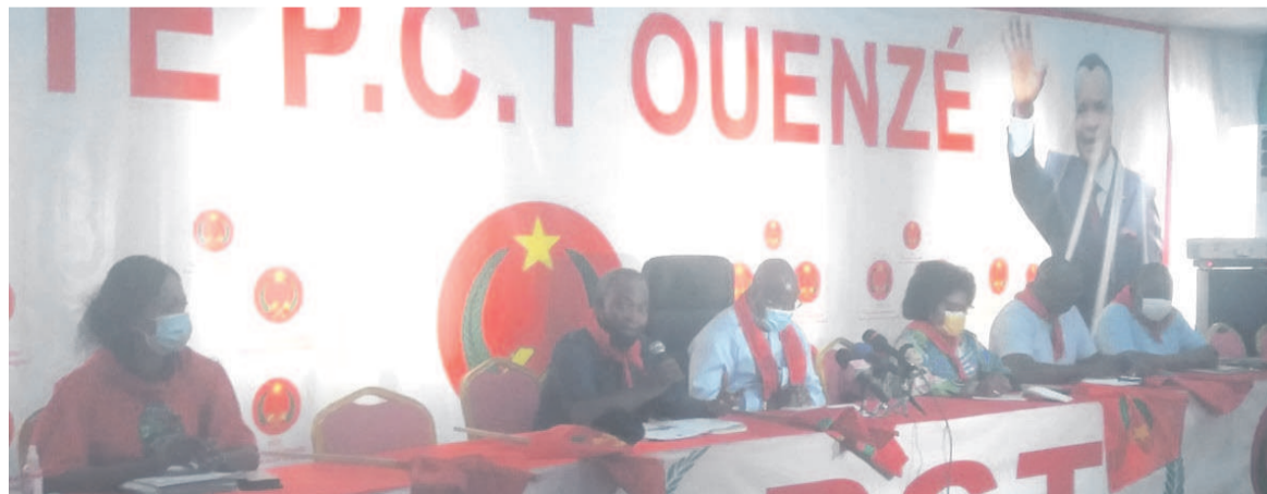
Les membres du comité PCT Ouenzé lors de la réunion

Le comité du Parti congolais du travail (PCT) du cinquième arrondissement de Brazzaville, Ouenzé, a tenu le 17 avril une réunion ordinaire au cours de laquelle il a décidé du lancement de la campagne porte-à-porte, pour pousser les électeurs à se faire enrôler sur les listes électorales.