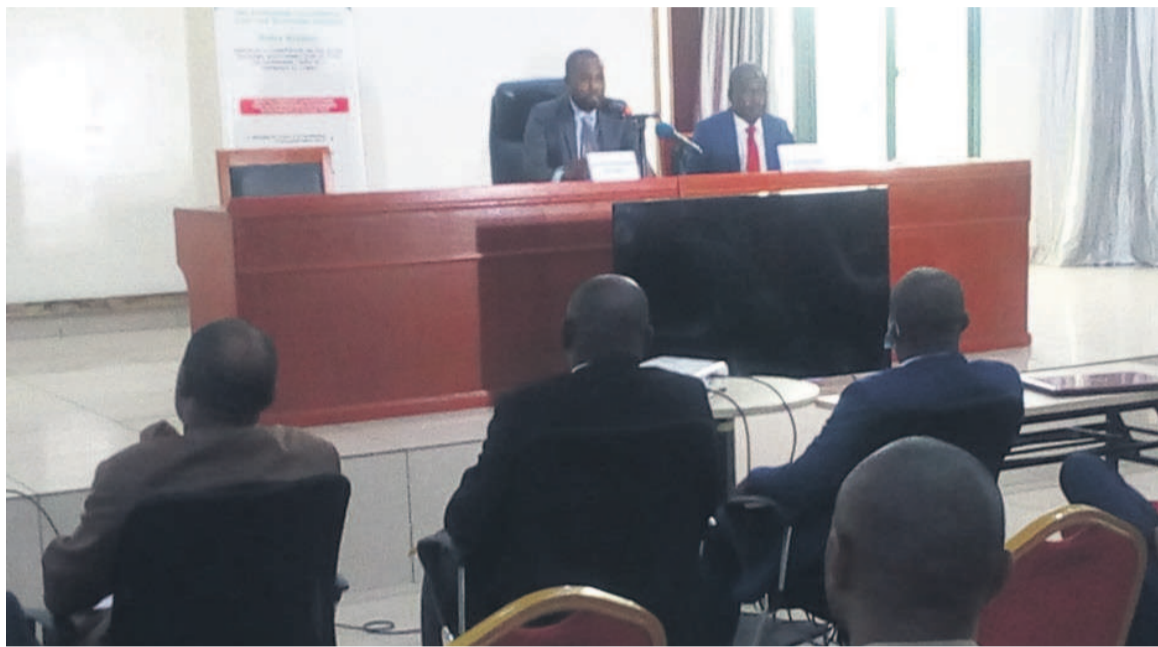
Les membres du Comité de pilotage du Padec/Adiac

Le projet a promis également d'appuyer les ministères sectoriels et les institutions intervenant dans l'accompagnement du secteur privé national. C'est le cas du Comité interministériel sur la réforme du climat des affaires qui va bénéficier du soutien du Padec dans l'organisation des travaux des groupes thématiques pour la formulation des textes de réformes, le recrutement d'un consultant pour la mise en place du registre des sûretés mobilières, la conception d'une application mobile pour faciliter la création d'entreprise, l'harmonisation des procédures de création d'entreprises entre l'Agence congolaise pour la création des entreprises et les administrations partenaires... Le ministère des Zones écono-