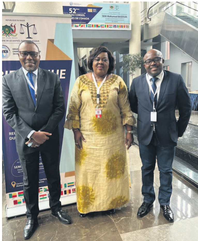
Au milieu, la ministre d'Etat Rose Mutombo lors de la clôture de la 52e session du Conseil des ministres de l'Ohada/DR

Le juge sortant, Robert Safari, a de prime à bord exprimé toute sa gratitude aux plus hautes