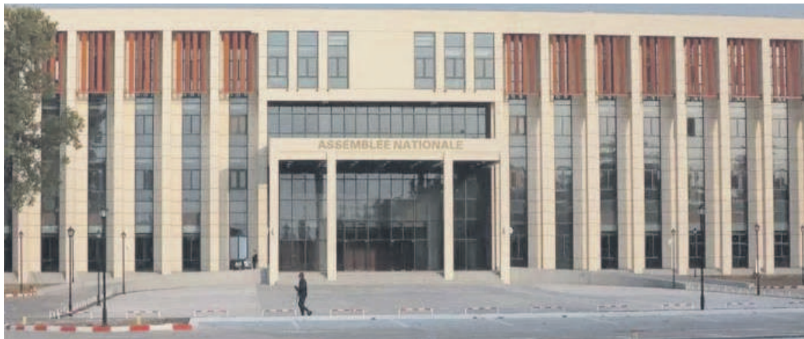
Façade principale du Parlement

Visant à protéger les couches sociales vulnérables, la Convention n°128 de l'OIT sur les prestations d'invalidité, de vieillesse et de survivants a été adoptée le 29 juin 1967. La protection consiste à leur attribuer respectivement des prestations d'invalidité, de vieillesse et de survivants. Concernant les prestations d'invalidité, l'éventualité est couverte lorsque l'incapacité d'exercer une activité professionnelle est soit permanente, soit temporaire, soit initiale. Quant aux prestations de vieillesse, l'éventualité couverte est la survivance au-delà d'un âge prescrit. Il ne doit pas dépasser 65 ans. S'agissant des prestations de survivants, l'éventualité couverte doit comprendre la perte de moyens d'existence subie par la veuve ou la famille. Les personnes protégées