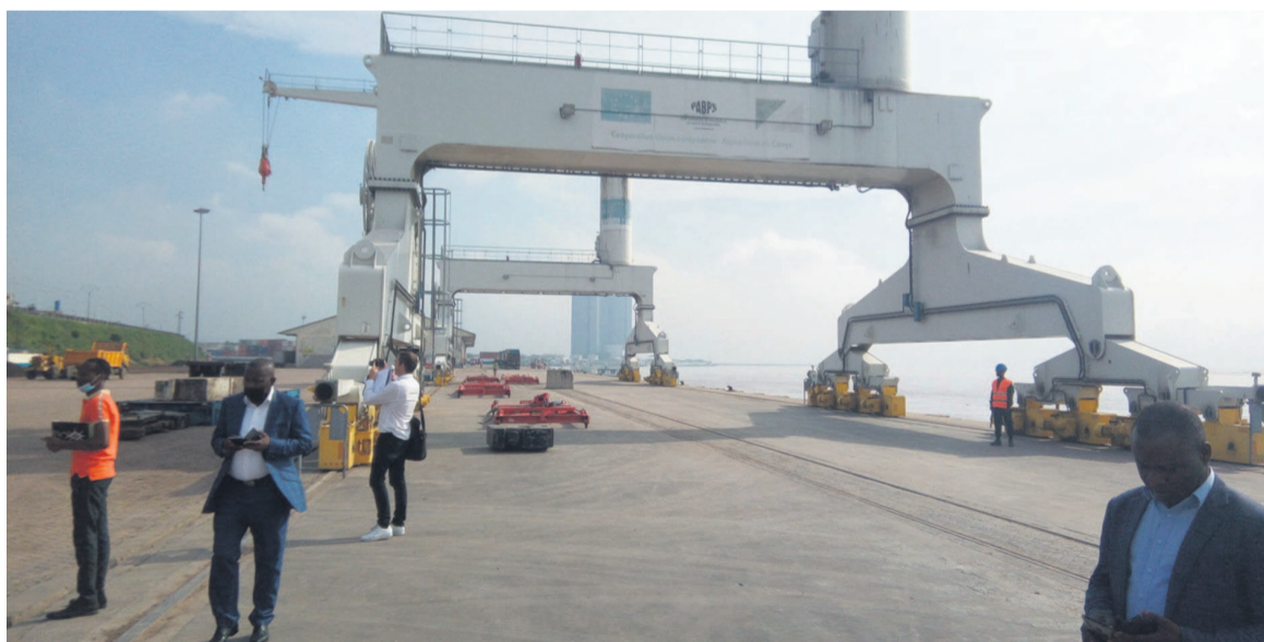
Une vue des installations de TBC au port autonome de Brazzaville

Les difficultés auxquelles font face les TBC s'inscrivent, au plan technique, par la non finalisation des travaux au niveau du Port autonome de Brazzaville, ce qui ne favorise pas un véritablement dynamisme des activités comme envisagé dans la convention tripartite signée avec le Chemin de fer Congo Océan