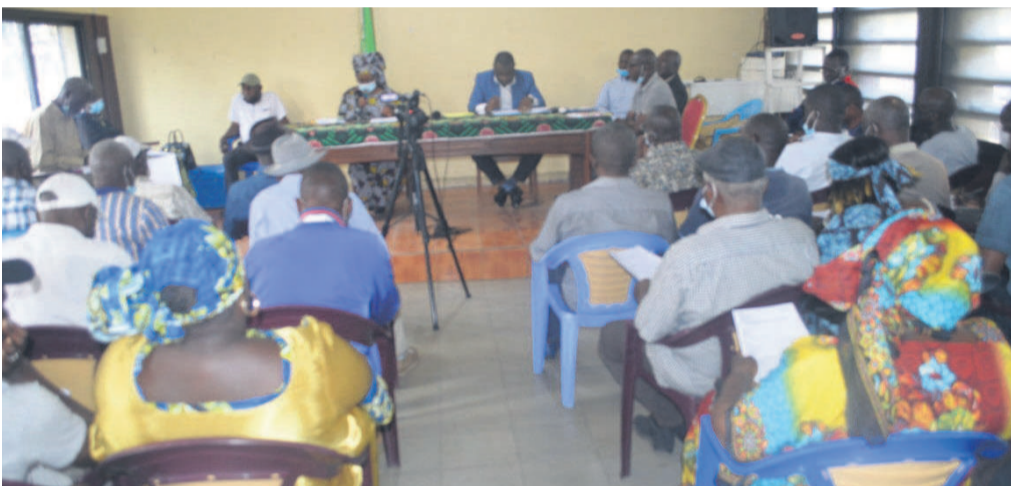
Une vue des participants à la formation Adiac

Le préfet du département de la Likouala, des nouveaux sous-préfets et administrateurs-maires d'arrondissements et des communautés urbaines ont été nommés le 15 avril par décrets présidentiels. Page 4