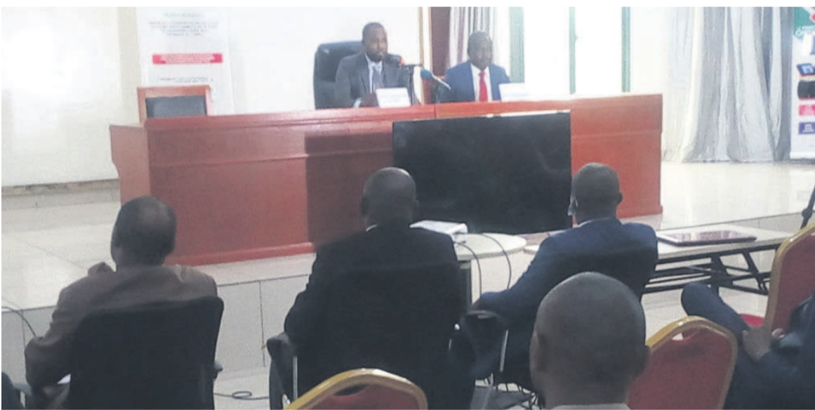
Les membres du Comité de pilotage du Padec/Adiac

L'État congolais va accorder, dans le cadre du Projet d'appui au développement des entreprises et la compétitivité (Padec), une subvention de plus de 4,5 milliards FCFA pour soutenir cent micros, petites et moyennes entreprises locales au titre de la reconstitution de leur fonds de roulement productif post covid 19.