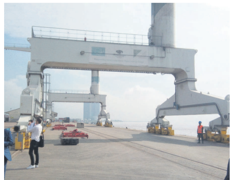
Un vue des installations de TBC au port autonome de Brazzaville

Concessionnaire du Port autonome de Brazzaville et ports secondaires depuis fin 2017, après la faillite déclarée de la société Necotrans, les Terminaux du Bassin du Congo (TBC), filiale du groupe Bolloré transport et logistics fait face à une concurrence déloyale du fait des ports pirates qui ne garantissent pas un retour sur investissement du concessionnaire.