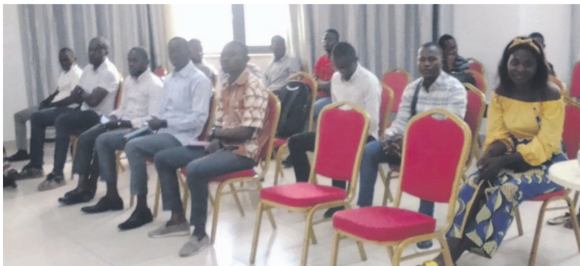
Une vue des participants à l'atelier

De manière interactive, il a détaillé au bénéfice des auditeurs le mécanisme de suivi