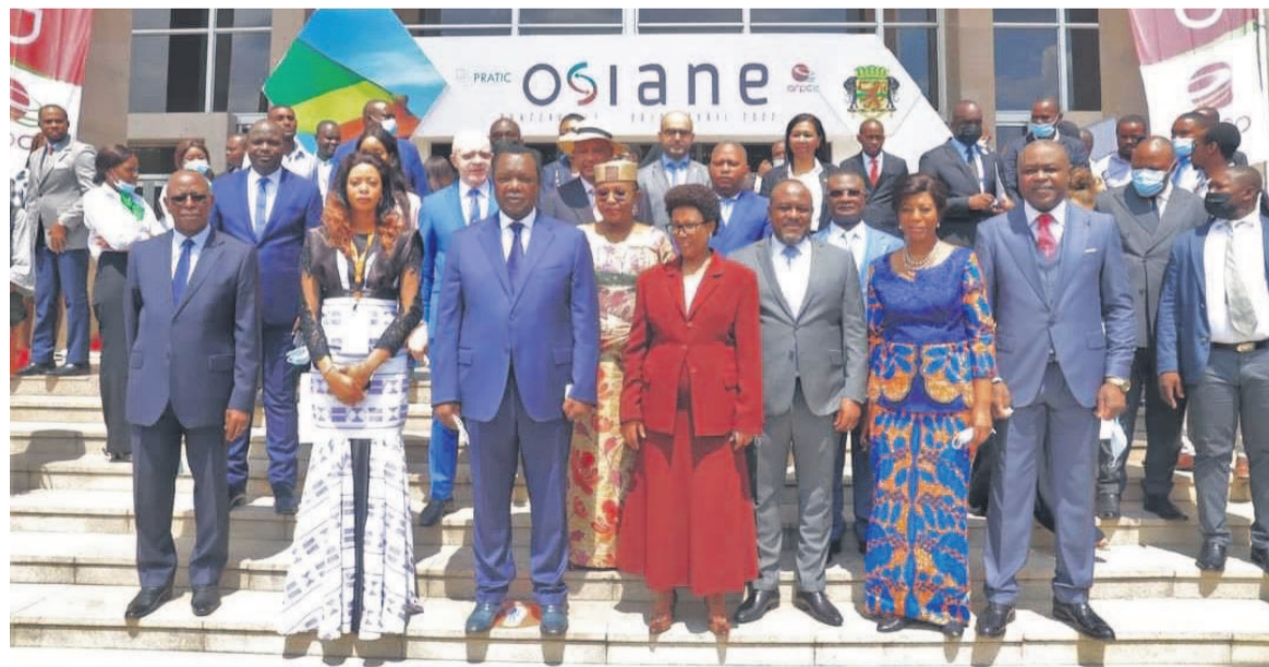
Les participants à l'ouverture du salon Osiane 2022

Les jeunes utilisateurs, notamment congolais, ont été invités à enrichir le contenu numérique et à s'engager en faveur de la transformation digitale en lien avec le respect des normes environnementales. Les domaines censés contribuer à la transformation digitale sont principalement l'écologique, l'énergétique, le numérique culturel et agricole. L'innovation aujourd'hui repose sur la technologie et la technologie repose sur le numérique électro-