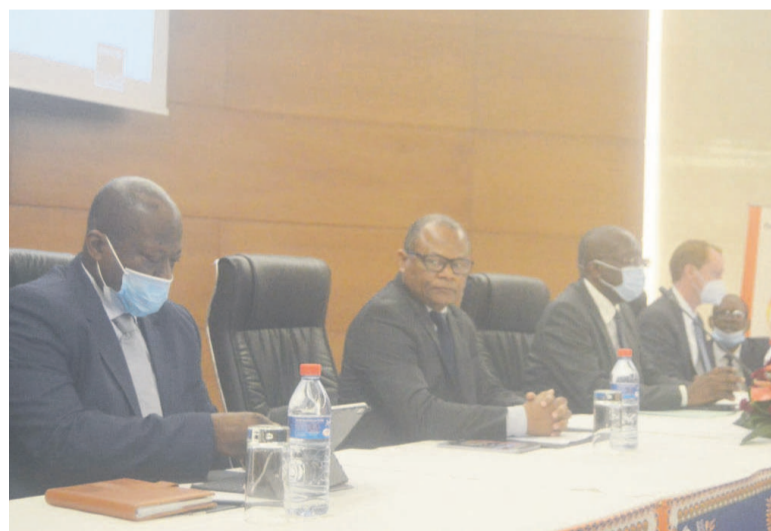
Le présidium lors de la restitution de l'étude

Les résultats d'une étude engagée par la Société nationale des pétroles du Congo (SNPC) sur l'évaluation et la certification des réserves du bassin côtier congolais révèlent la nécessité de transformer les ressources contingentes en réserves.