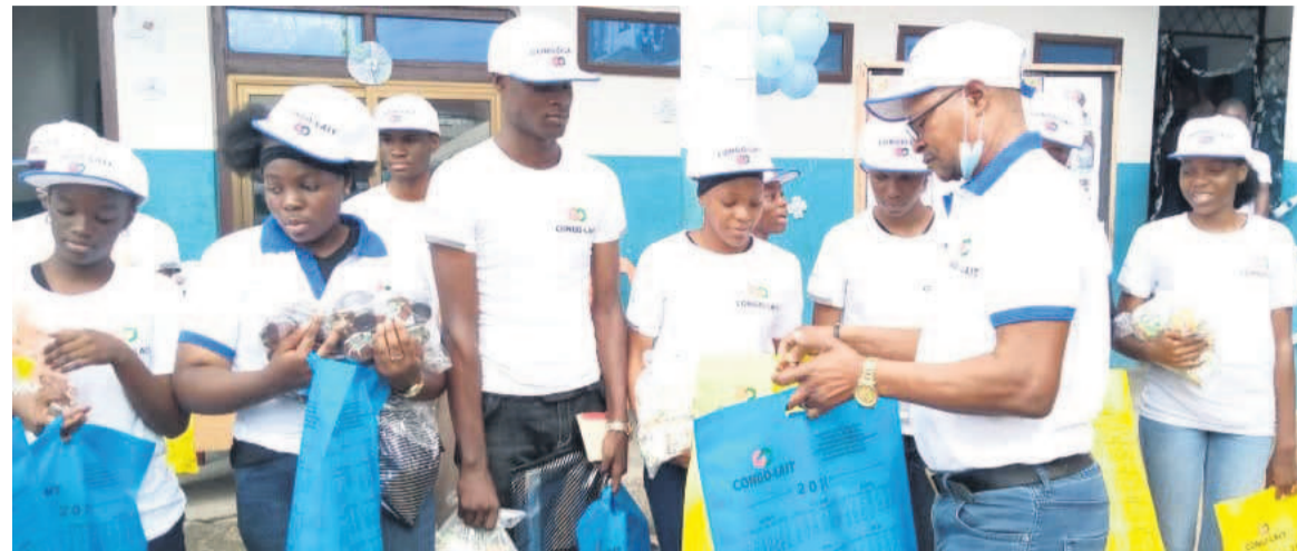
Les élèves-acteurs distingués recevant leurs prix.

A l'occasion de la célébration de la Journée mondiale du livre, le Club des amis du livre et des arts de l'école Joseph perfection éducation, en collaboration avec la direction départementale du Livre et de la Lecture publique, a organisé, le week-end dernier, des activités culturelles au sein de cette école.