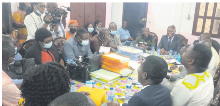
L'intersyndicale en réunion

La signature, par le gouvernement, du deuxième protocole d'accord soumis par l'intersyndicale depuis un mois fait partie des demandes formulées par le collège intersyndical de l'Université Marien-Ngouabi à l'issue de sa réunion tenue le 20 avril à Brazzaville. L'objectif étant de maintenir le dialogue et un climat social apaisé. A cela s'ajoute « le versement des deux quotités restantes pour l'exécution intégrale du protocole d'accord du 1er août 2019, qui seront réparties, par les syndicats, en conformité avec le protocole d'accord », peut-on lire sur la déclaration de l'intersyndicale. Le protocole d'accord du 1er août 2019 était, en effet, arrivé à terme le 30 juin 2021.