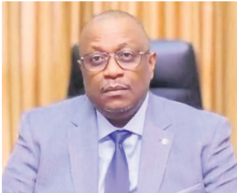
Le ministre de la Santé publique, Jean-Jacques Mbungani

« Je tiens, d'abord, à féliciter les dirigeants de cette industrie pharmaceutique. Il est important que le ministère de la Santé publique, Hygiène et Prévention puisse