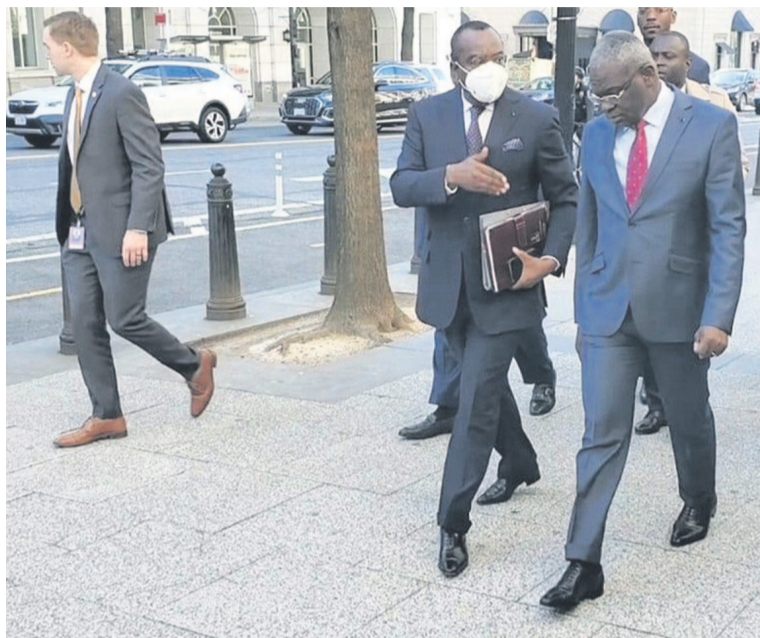
La mission du Premier ministre à la Banque mondiale et au FMI, avril 2022

Pour le chef du gouvernement, l'enjeu lié au redressement de l'économie congolaise à recréer les conditions d'une attractivité économique, à résoudre les problèmes sociaux et à redorer l'image du Congo, demeure une priorité et un objectif majeur dans les négociations avec le FMI, voire même avec l'ensemble des bailleurs bilatéraux ou multilatéraux, afin de renouer la confiance, tant au plan interne qu'au plan externe. Pour passer du désenchantement à la relance de son économie, le Congo a observé une sévère discipline budgétaire et entend, grâce à son Plan national de développement, se remettre