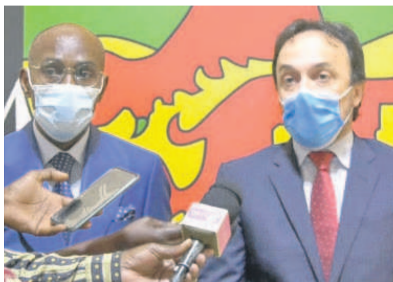
Le ministre et le directeur général de Likouala Timber devant la presse