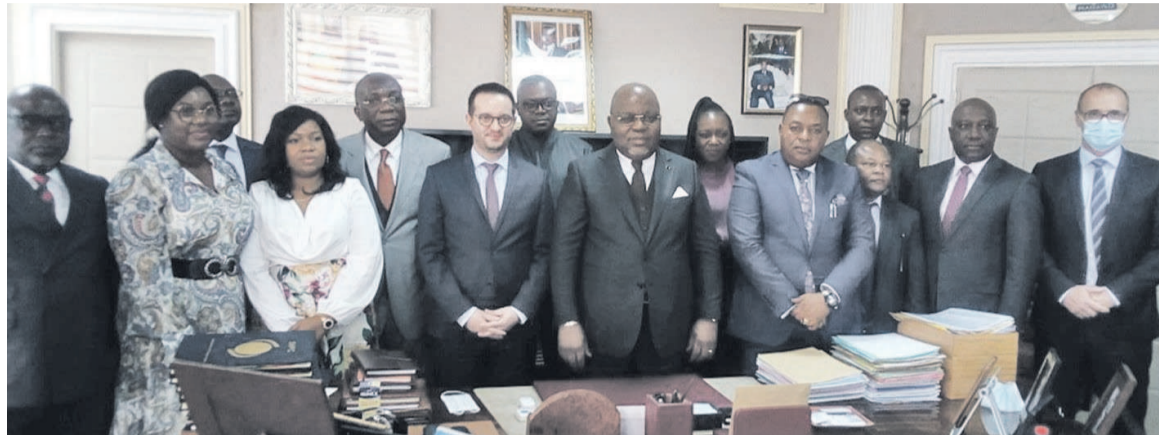
Le directeur général de TotalEnergies et le ministre des Hydrocarbures posant avec les collaborateurs

« Il était important, suite à l'abrogation de la convention d'établissement, de pouvoir avoir un cadre réglementaire clair relatif à la fiscalité de droit commun, au tarif douanier et à la réglementation de change. Nous avons enfin un cadre réglementaire qui nous permet d'avoir de la visibilité,