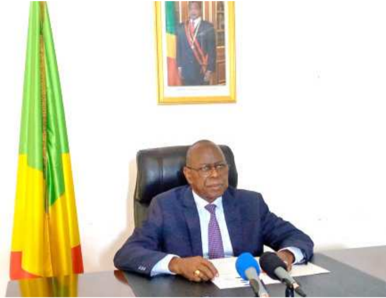
Le ministre Gilbert Mokoki lisant la déclaration

Dans une déclaration lue le 28 avril à Brazzaville par le ministre de la Santé et de la Population, Gilbert Mokoki, il ressort que les épidémies de rougeole et de fièvre jaune sont présentes dans la plupart des départements du pays.