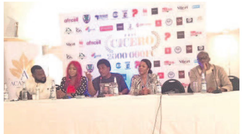
Des membres de l'organisation du Prix Cicero.