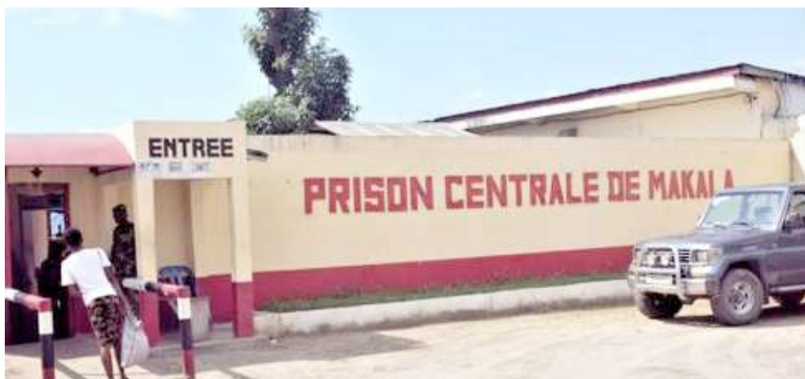
L'entrée principale de la prison centrale de Makala/DR