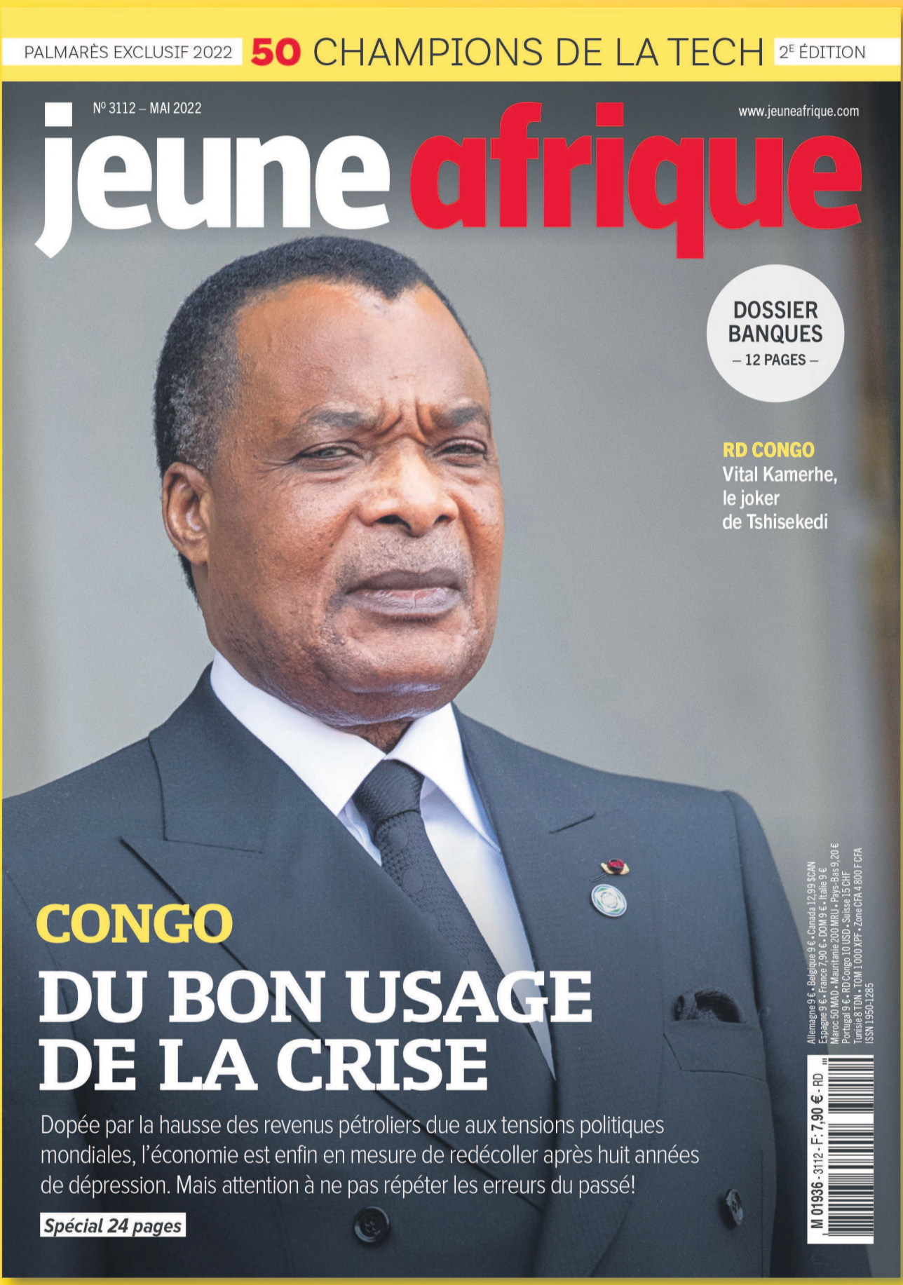
JEUNE AFRIQUE N° 3112 - MAI 2022

Retrouvez également toute l'actualité africaine sur le site et les applications de Jeune Afrique