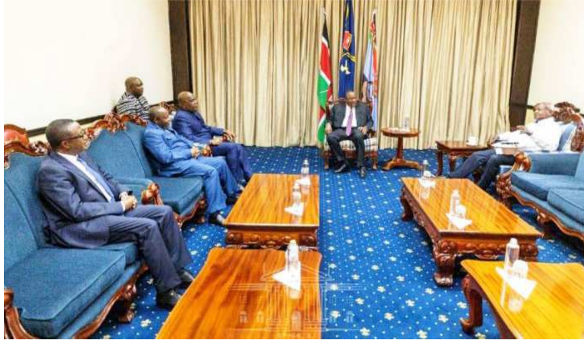
Les Chefs d'Etats membres de l'EAC en concertation à Nairobi

Près de trente délégués représentant les groupes armés de l'Ituri, du Nord et du Sud-Kivu ont pris part à ces échanges qui se sont déroulés en présence des observateurs du Rwanda, de l'Ouganda, du Burundi, des Nations unies, de la Conférence internationale sur la région des Grands Lacs, des États-Unis et de la France. Ceux qui n'ont pas rallié Nairobi pourraient rejoindre le processus