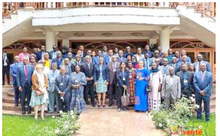
Les participants à la reunion du Fond Mondial pour la région de l'Afrique