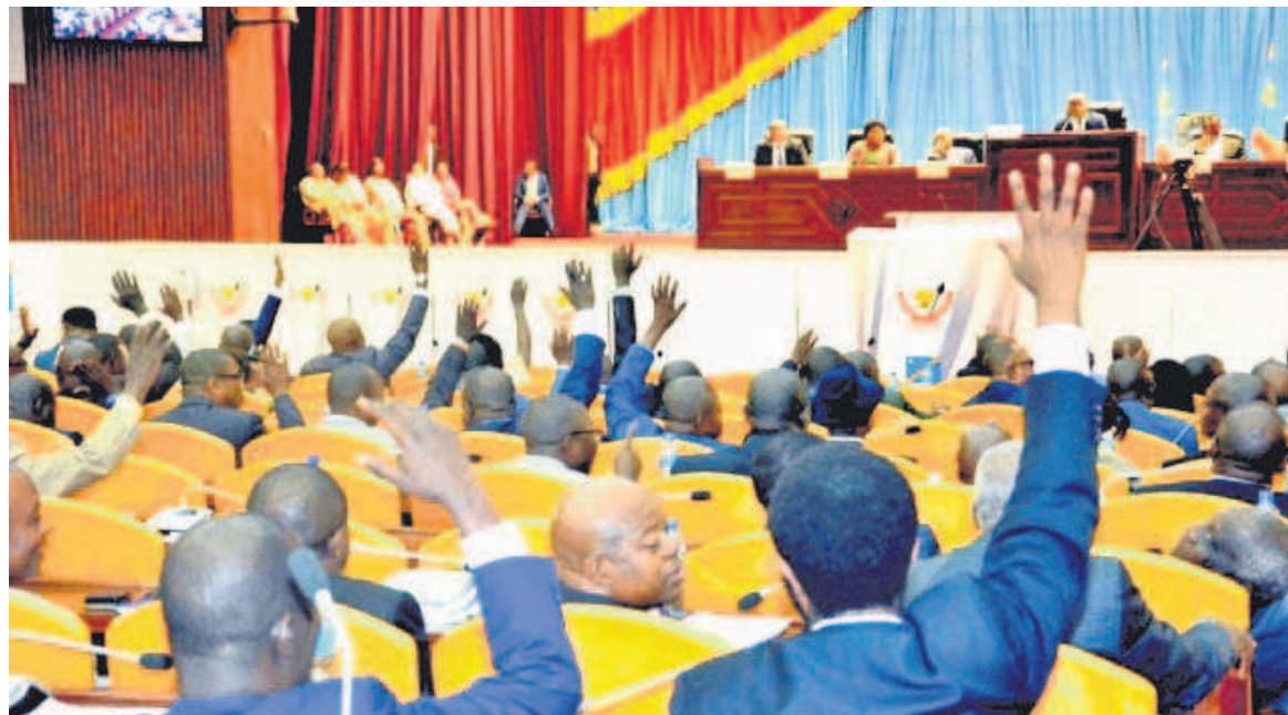
Les députés nationaux lors d'une plénière à la Chambre basse

Décidément, on n'est pas encore sorti de l'auberge concernant l'examen et l'adoption de la proposition de loi modifiant la loi électorale à l'Assemblée nationale. Depuis que l'opposition parlementaire a claqué la porte en boycottant le débat sur la réforme de cette loi, les choses semblent stagner.