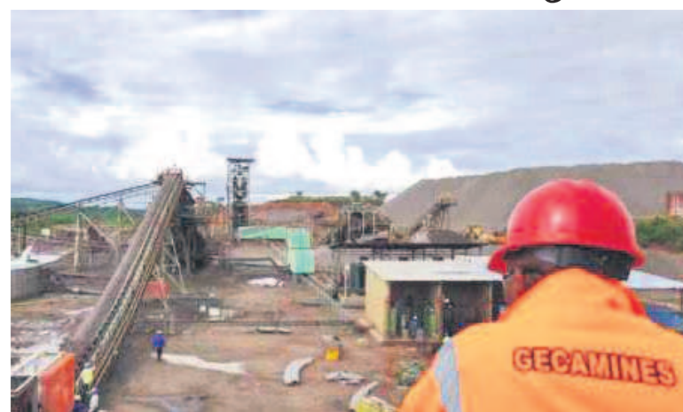
Un site minier de la Gecamines

La rencontre baptisée de la « Reprise » se tient après deux ans et deux mois d'arrêt du Forum international Mining Indaba à cause de la crise sanitaire mondiale. Les thèmes abordés, dont la transition énergétique et la production des batteries, contribuent à placer la République démocratique du Congo (RDC) au