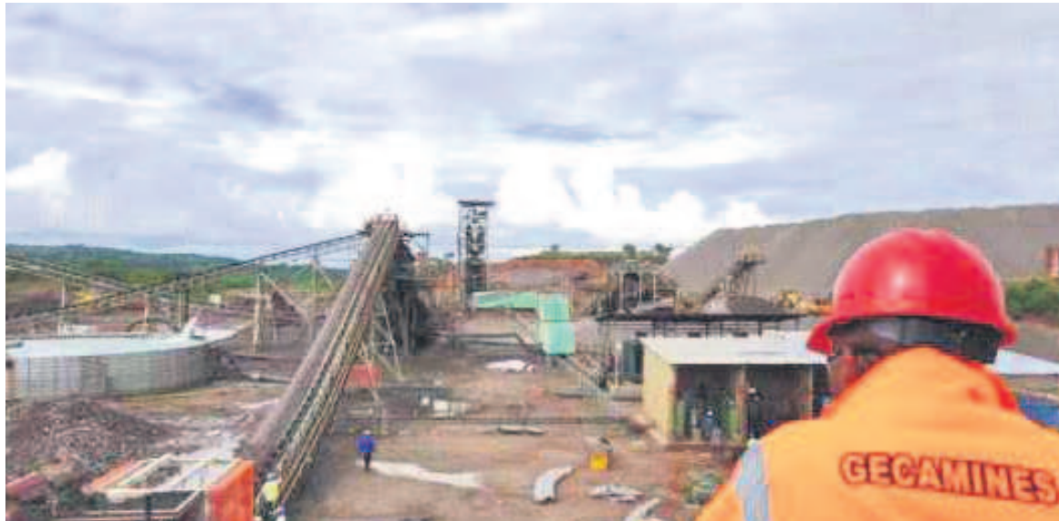
Un site minier de la Gecamines

Placé sur le thème « Evolution du secteur minier africain : investir dans la transition énergétique, ESG et les économies », le Forum Indaba Mining réunit une nouvelle fois les experts venus des quatre coins du monde. Les différents échanges et réflexions concourent à booster les investissements miniers afin de favoriser le développement du continent africain. « Pour nous comme gouvernement, il a été important et c'est ce qui justifie la participation du Premier ministre lui-même, à haut niveau, pour montrer que nous voulons profiter de cette plateforme pour passer le message de la République