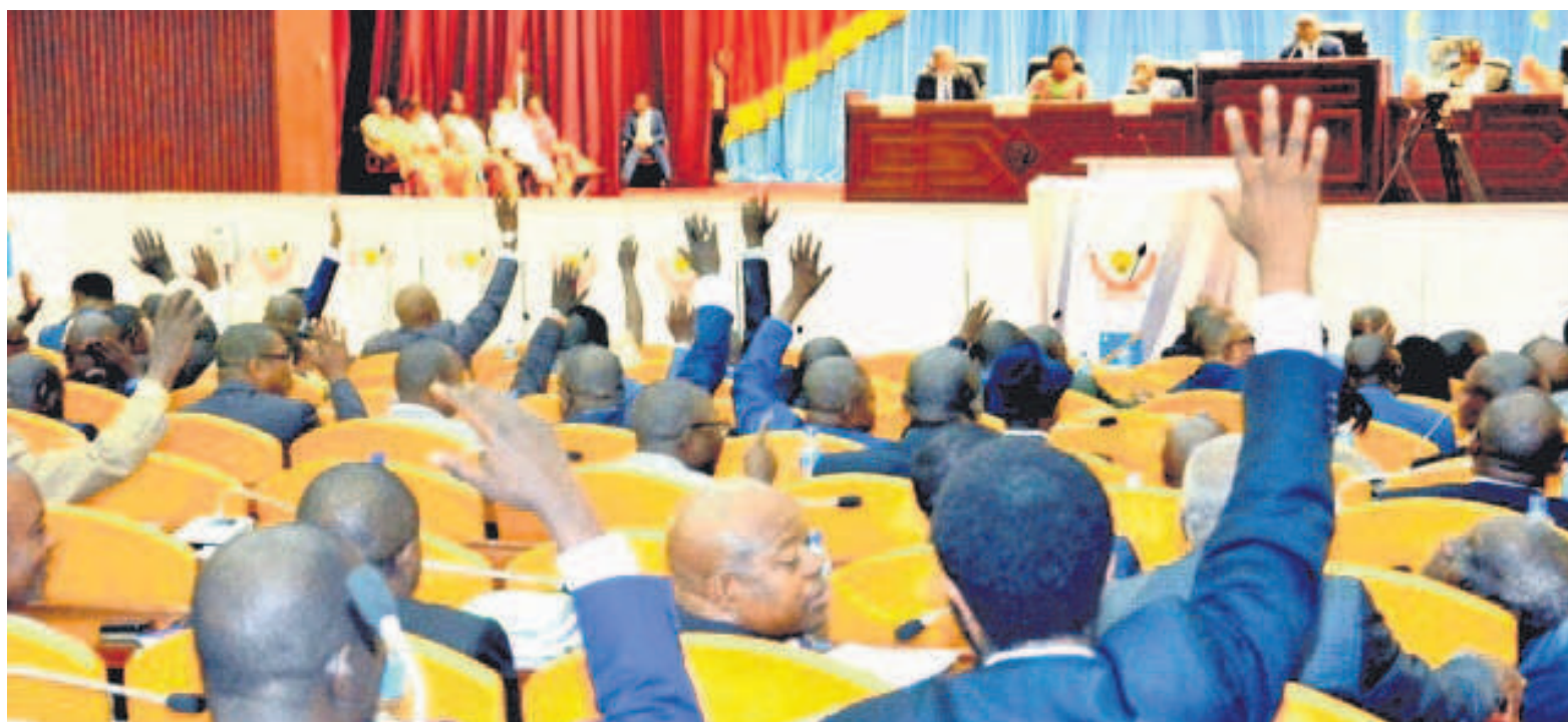
Les députés nationaux lors d'une plénière à la Chambre basse

Alors que l'opposition parlementaire continue de boycotter le débat sur la réforme de la loi électorale en exigeant un dialogue en dehors des institutions, la conférence des présidents de l'Assemblée nationale a décidé de foncer sans elle. Elle vient de convoquer pour ce 12 mai une plénière d'où sortiront les grandes options en rapport avec la loi électorale sur les modifications de certaines dispositions en vigueur proposées par le groupe G13. Le texte sera ensuite envoyé à la Commission politique administrative et juridique pour toilettage avant son adoption par les députés nationaux.