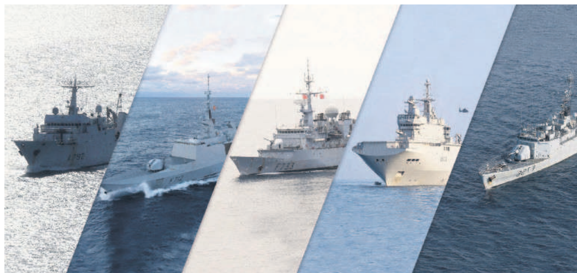
Les cinq bâtiments de la marine