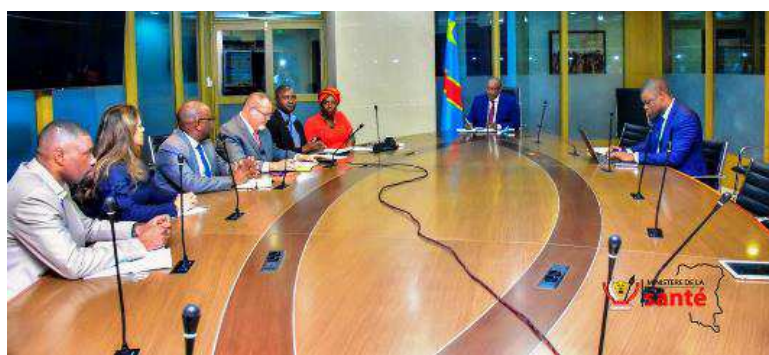
Le ministre de la santé présidant la réunion avec l'Usaid et Path

Le ministre de la Santé publique, le Dr Jean-Jacques Mbungani, a échangé récemment à son cabinet de travail avec une délégation de l'Agence américaine pour le