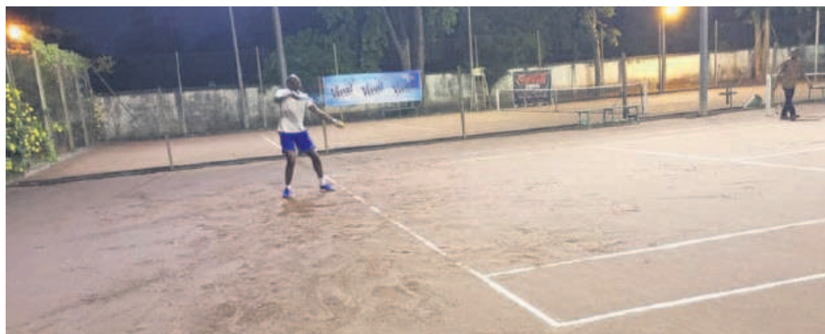
Un athlète lors des premiers matches

Le collectif des Congolais de la diaspora et amoureux du tennis a ouvert, le 10 mai à Brazzaville, la deuxième édition du tournoi international de la discipline. Jusqu'au 22 mai, les amateurs et professionnels, notamment les tennismen et tennismen issus de plusieurs pays s'affronteront en individuel et en équipe.