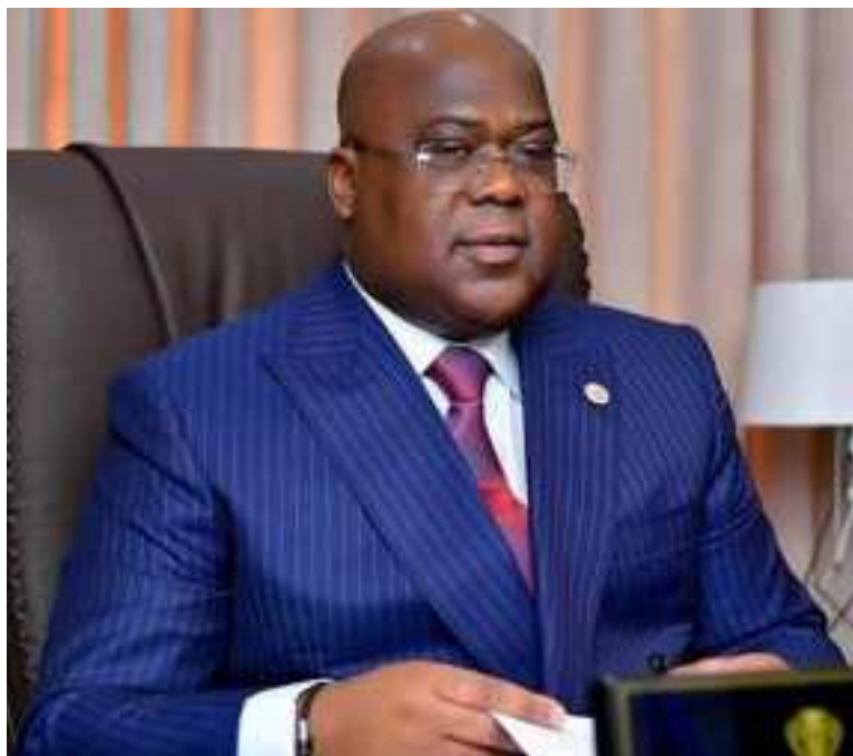
Le président Félix Tshisekedi

Les membres du bureau de la conférence de l'UA ont parlé de l'accès aux vaccins produits en Afrique aux plateformes internationales d'achat et de distribution, de l'impact de la crise russo-ukrainienne sur l'Afrique, des élections au Parlement panafricain (PAP) ainsi que des consultations pour compléter la composition du bureau de la conférence de l'UA pour l'exercice 2022.