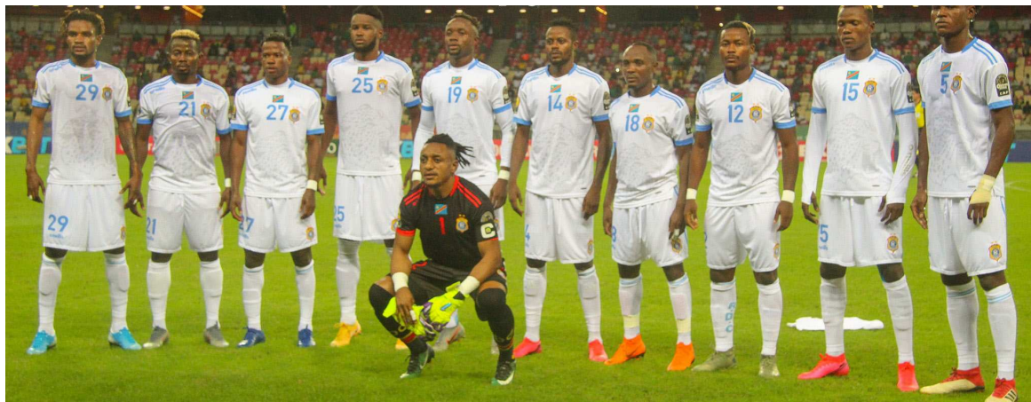
Les Léopards locaux au Chan 2020 au Cameroun