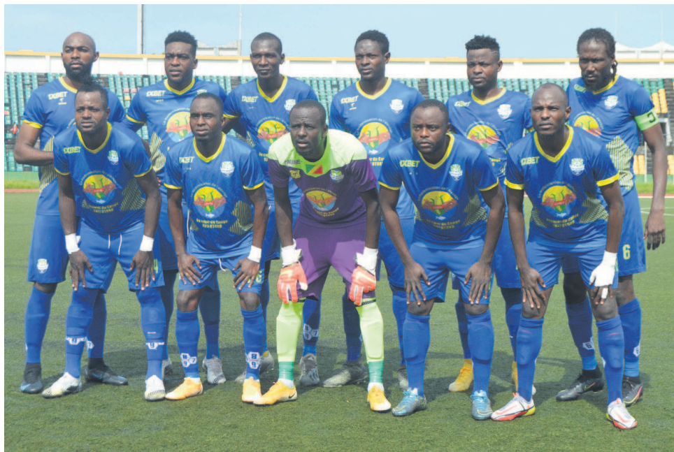
L'As Otohô championne du Congo pour la 5e fois consécutive

L'As Otohô représentera la saison prochaine le Congo à la Ligue africaine des champions avec l'ambition d'aller le plus loin possible dans cette compétition. Depuis qu'elle y participe, elle n'a jamais atteint la phase de poules. Au cours de cette saison, le représentant congolais a été éliminé à la porte de la phase de poules. Il a su rebondir à la Coupe africaine de la Confédération (C2) en terminant à la troisième place de la phase de poules après le