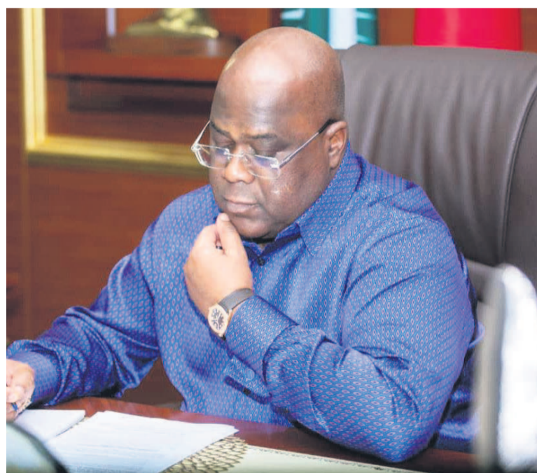
Félix Tshisekedi compatit avec le peuple Emirati

Le communiqué de la Présidence de la République précise, par ailleurs, que l'illustre s'est également investi à l'initiative de la coopération renforcée entre les Emirats Arabes Unis et la République démocratique du Congo