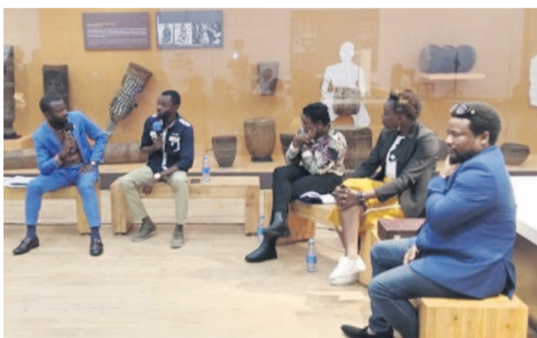
Une rencontre d'artistes dans une des salles du musée national

En marge de la Journée internationale des musées célébrée le 18 mai, le bâtiment en briques rouges qui longe le boulevard Triomphal, à quelques encablures du Palais du peuple, sera d'accès gratuit du 20 au 22 mai, aux Kinois et touristes en séjour dans la capitale. L'Institut des musées nationaux du Congo met beaucoup d'entrain