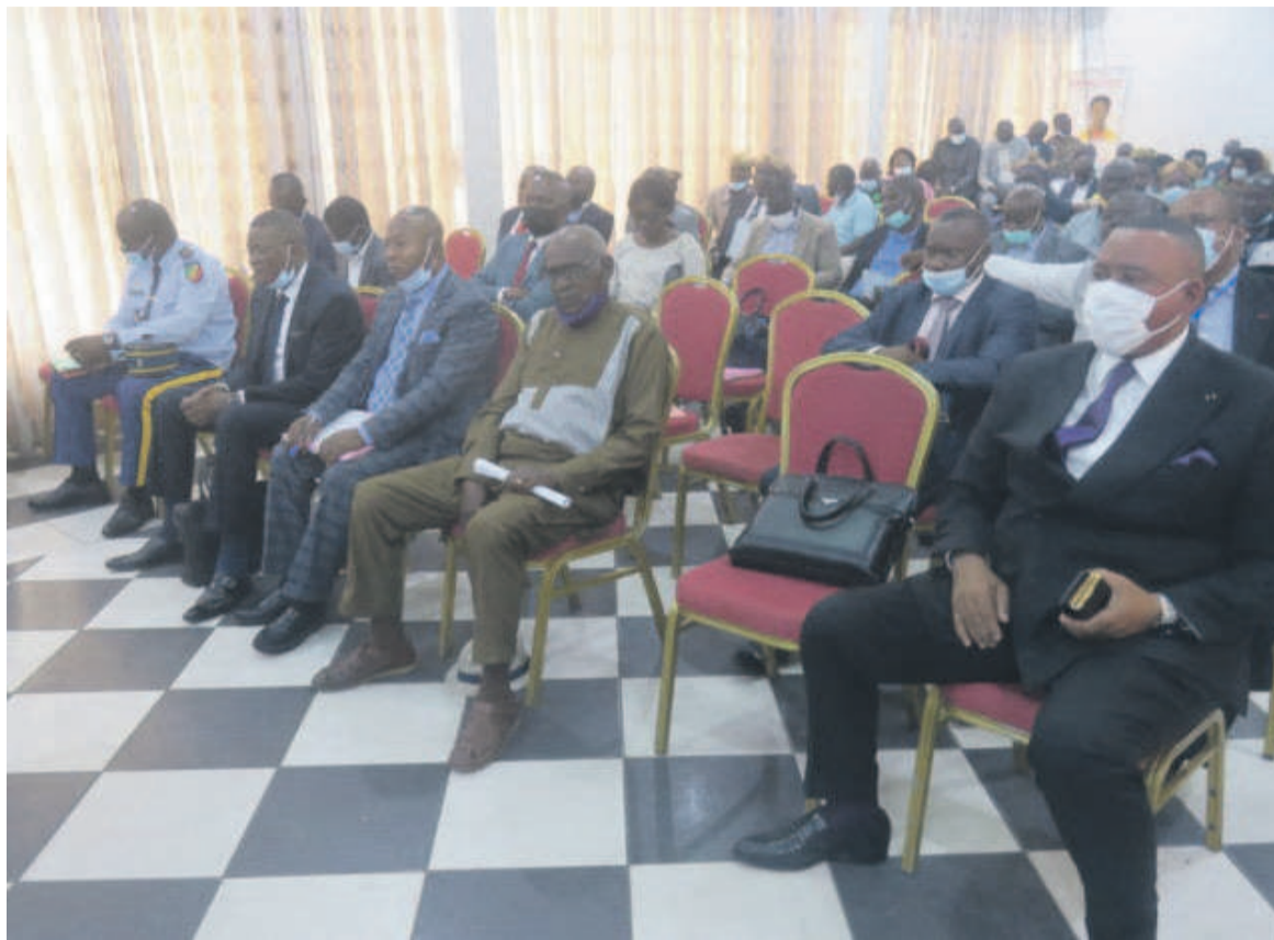
Des participants à la session

La loi n°21-2018 du 13 juin 2018 fixant les règles d'occupation et d'acquisition des terres et terrains en ses articles 12, 13 et 44 stipule que les terres coutumières sont interdites de lotissement, de cession à titre onéreux ou gra-