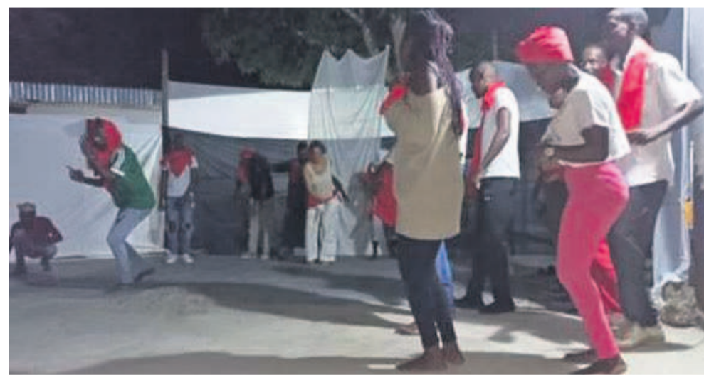
Une vue du spectacle joué au Centre de ressources du conte