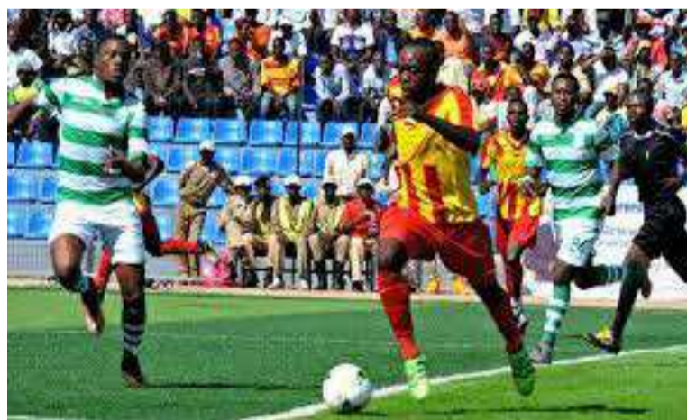
Vue d'une rencontre entre DCMP et Sanga

le 22 mai au Stade des martyrs de Kinshasa et à Lubumbashi avec le choc entre le DCMP et Sa Majesté Sanga Balende de Mbuji-Mayi. Le même jour, au stade Frédéric-Kibassa -Maliba