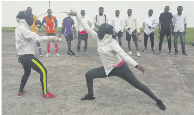
Les athlètes en pleine démonstration

Il a profité de l'occasion pour inviter tous les Congolais qui pratiquent l'escrime à venir participer aux entraînements, pour permettre, d'après lui, aux entraîneurs de