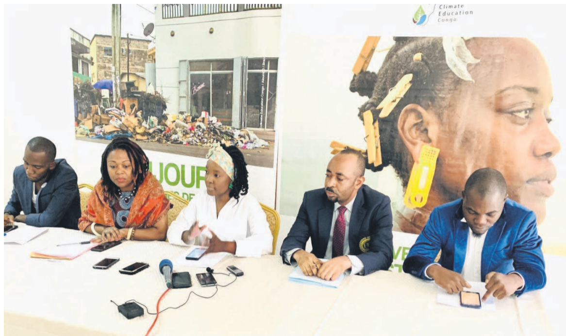
Le comité de coordination lors des échanges

En parallèle, ces candidats participeront à une panoplie d'autres activités : conférence débat sur le thème « Crise écologique : pourquoi agir pour l'environnement ? Et quels enjeux pour le développement économique du Congo ? » ; projection des films ;