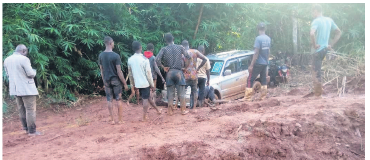
En dépit du mauvais état de la route dans le Congo profond, les experts ont accompli leur mission

la pré validation des guides méthodologiques vont débiter cette semaine. Le draft de six guides méthodologiques? à savoir diagnostic et orientations, options, propositions, consultation, suivi-évaluation et communication sera donc enrichi avec des inputs formulés par les différents participants à ces ateliers provinciaux avant sa validation finale qui se fera au cours d'un atelier national à Kinshasa. L'organisation des ateliers de prévalidation des guides méthodologiques pour l'élaboration des plans provinciaux et locaux d'aménagement du territoire a été un grand succès au regard de l'implication de différentes parties prenantes qui y ont pris part. L'on a noté la participation du gouvernement provincial, des ministères sectoriels, des autorités locales et traditionnelles, des organisations de la société civile, les partenaires techniques et financiers, le secteur privé ... Dans