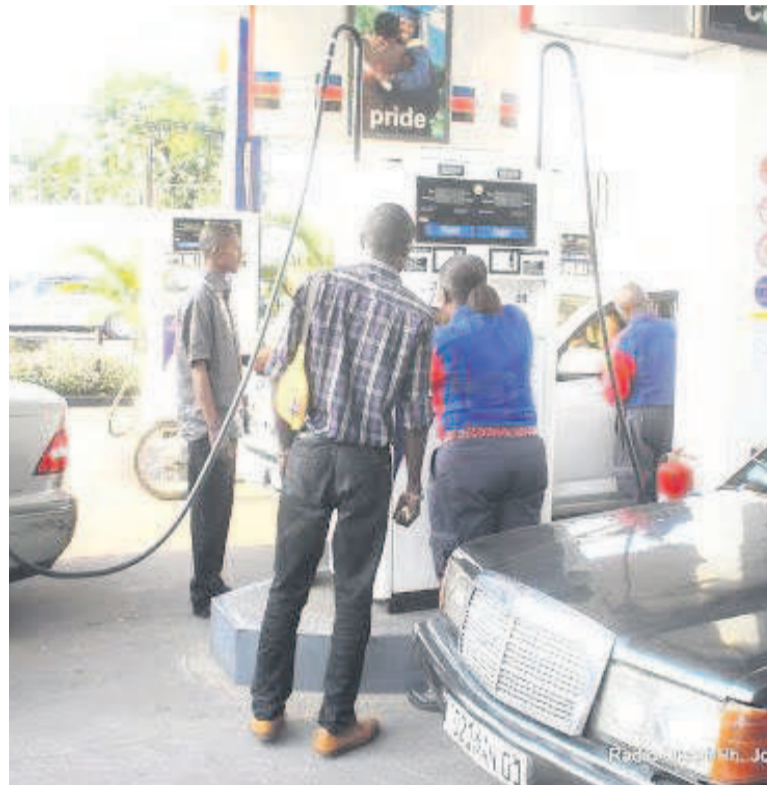
Un setation service en RDCDR

Ce réajustement des prix, apprend-on, est consécutif à la persistance des chocs exogènes liés à la hausse des prix du carburant sur le plan international. Le