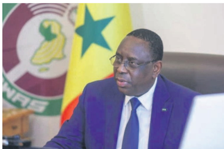
Le président de l'UA «gravement préoccupé», appelle «au calme»

D'après elle, Macky Sall est en contact avec les présidents rwandais et congolais. «Nous avons bon espoir d'arriver au moins à ce que les armes se taisent en attendant d'arriver à la solution politico-diplomatique