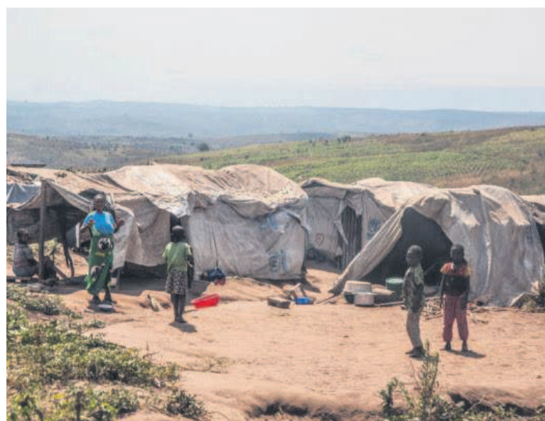
Un camp des déplacés à l'est de la RDC

Le Mouvement des indignés de la situation sécuritaire en République démocratique du Congo (Miss-RDC) encourage les Fardc à aller jusqu'au bout de la légitime défense pour contraindre l'ennemi à respecter la souveraineté du pays. Il exhorte la population à s'approprier les mécanismes pa-