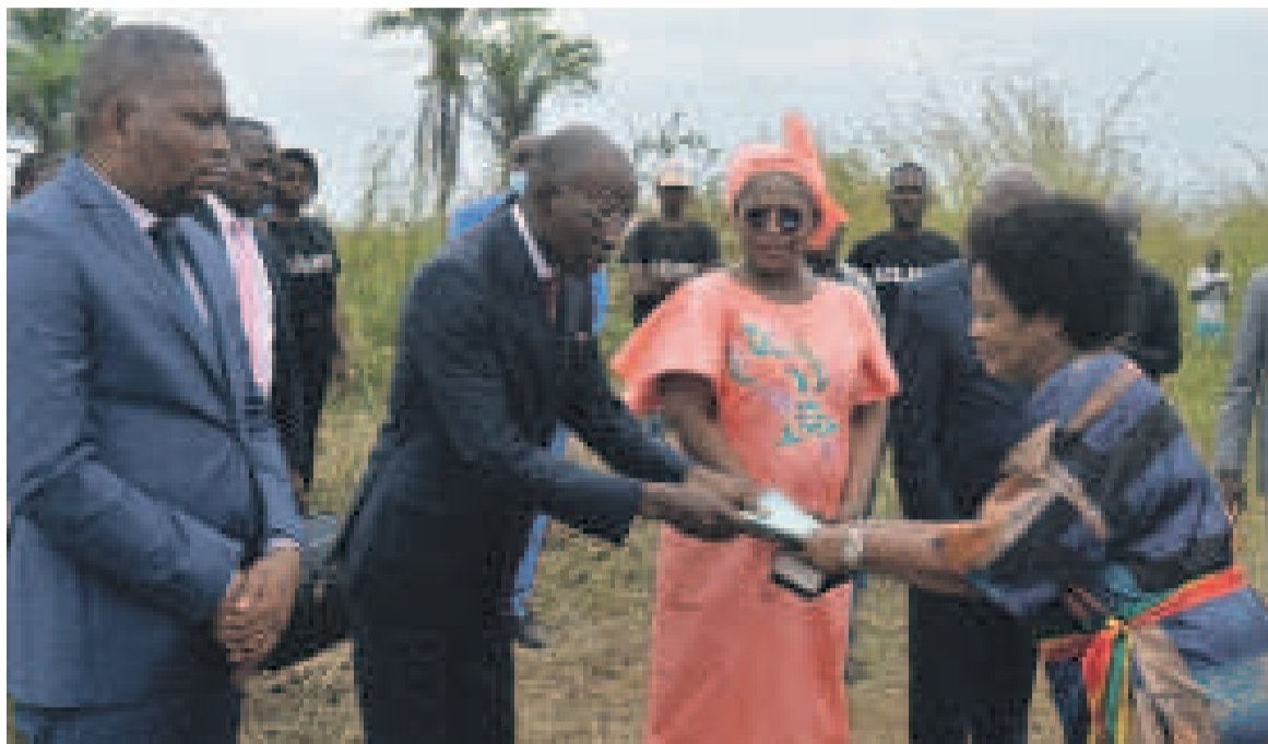
Remise des actes de cession de terres pour la construction du lycée et de l'école primaire de Mouyondzi/DR

« Connaissons les principes universels suivant lesquels toute personne a droit à l'éducation, nous venons vous faire tenir