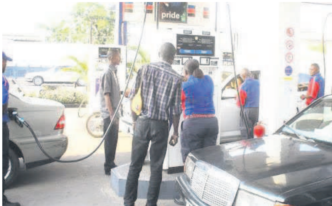
Un setation service en RDC/DR

Le spectre d'un emballement des prix intérieurs se dessine après l'annonce officielle de l'augmentation du litre à la pompe dès ce 30 mai par le ministère de l'Économie nationale. Par ailleurs, le Premier ministre, Jean-Michel Sama Lukonde, a évoqué l'approvisionnement imminent de la capitale congolaise en produits pétroliers lors de la réunion du gouvernement du 27 mai.