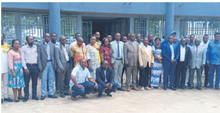
Photo de famille lors de l'ouverture de l'atelier à Kisangani

Des équipes d'experts du ministère de l'Aménagement du territoire, parties de Kinshasa, ont organisé dans plusieurs