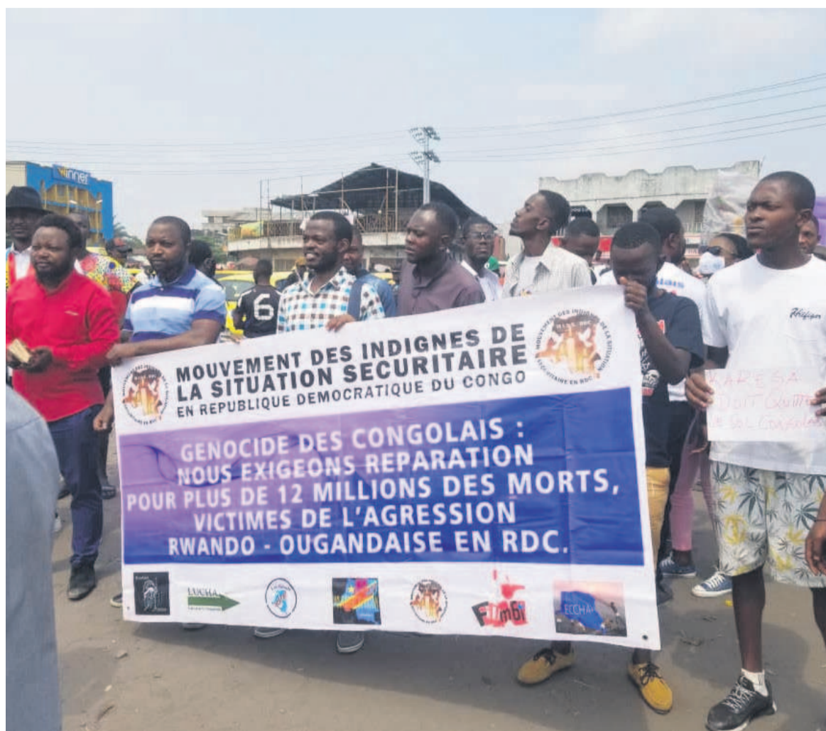
Des membres du Mouvement des indignés