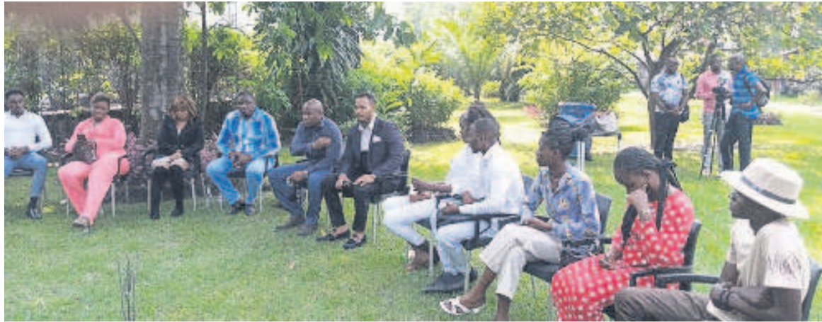
Une vue des participants à l'atelier