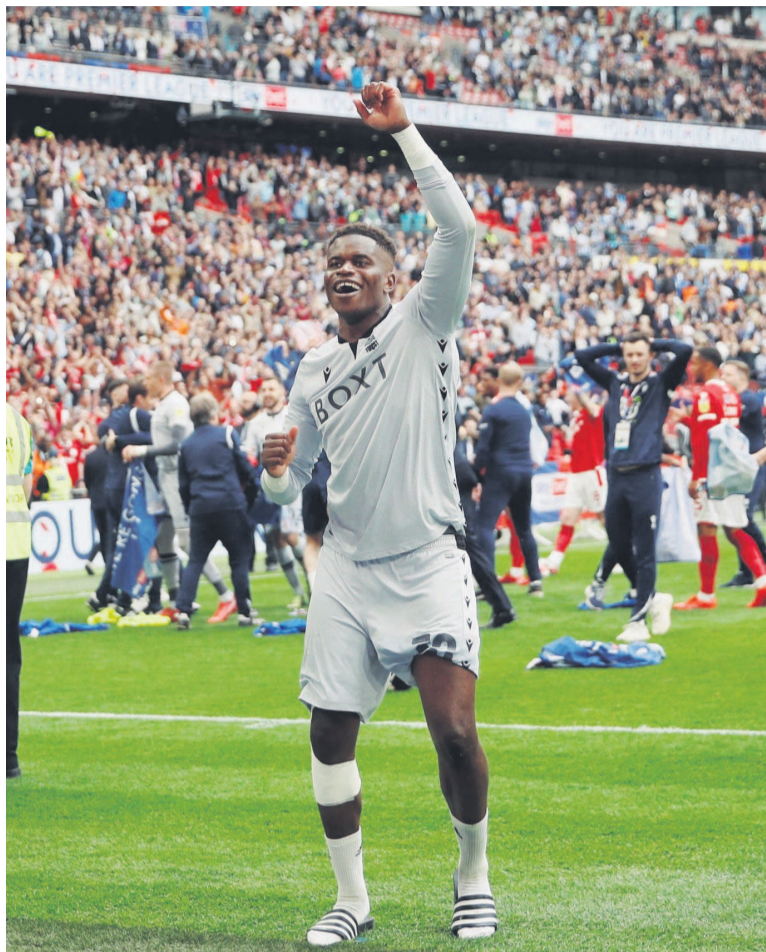
Fortunes diverses pour Samba et Illoy-Ayyet en barrages d'accession à la première division