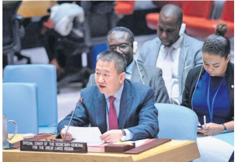
En avant-plan, Huang Xia, Envoyé spécial du Secrétaire général pour la région des Grands Lacs