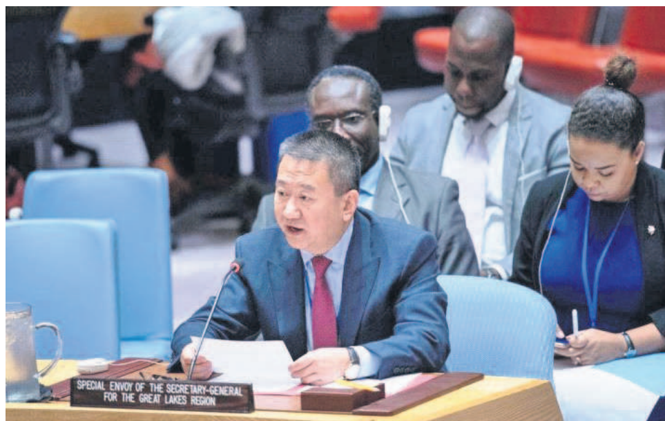
En avant-plan, Huang Xia, Envoyé spécial du Secrétaire général pour la région des Grands Lacs diplomatie congolaise s'est posé devant le Conseil de sécurité.

Pourquoi les rebelles du M23 reviennent-ils en ce moment ? Qui les arme ? D'où tirent-ils l'armement lourd avec lequel ils attaquent les Fardc et la Monusco alors qu'ils étaient défaits depuis 2013 ? Pourquoi choisissent-ils de s'attaquer à Kibumba, lieu choisi pour accueillir le pape François ? Pourquoi à chaque fois le Rwanda apparaît clairement aux côtés de ce groupe armé ? Est-ce la poule qui cache les poussins ? Autant de questions que le patron de la