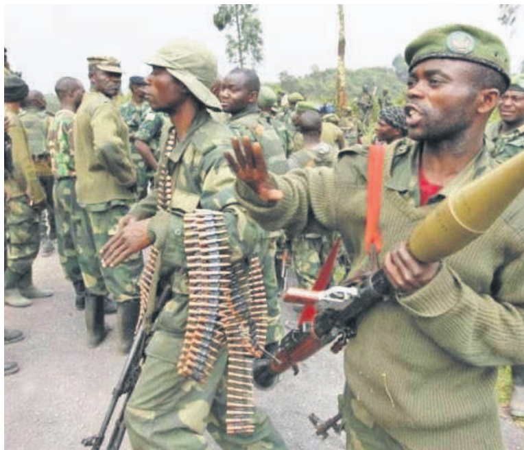
Des éléments des FARDC au fron