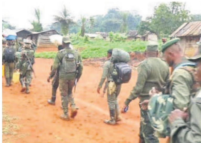
Une patrouille des Fardc

Toujours sur ce même registre, le président de la République a exhorté ses concitoyens à une mobilisation générale ainsi qu'à une union des cœurs et d'esprits pour faire face à cette situation qui impose des défis existentiels à la République. Bien plus, il a invité les Congolaises et Congolais à apporter