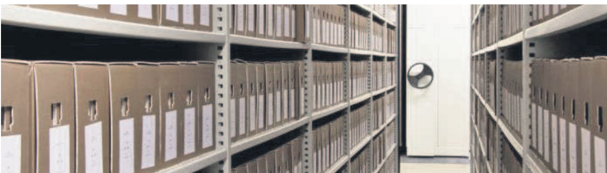
Une vue des archives de l'Etat belge

Malik Ben Achour, député du Parti socialiste belge, a présenté, le 31 mai, à l'Assemblée nationale belge (La chambre), une proposition de loi pour faciliter l'accès aux archives coloniales aux quatorze mille à vingt mille métis nés de la colonisation.