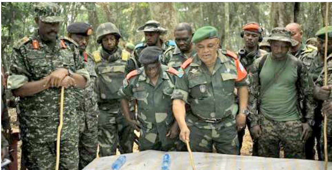
Des responsables militaires congolais et ougandais

La République démocratique du Congo (RDC) et l'Ouganda ont décidé, le 1er juin, de prolonger de deux mois les opérations militaires conjointes menées dans l'est de la RDC par les armées des deux pays.