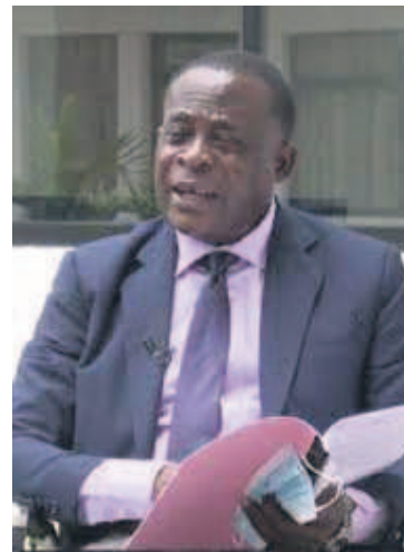
Pr Ange Antoine Abena

Par ailleurs, quatre docteurs ont présenté les productions scientifiques avec vingt publications tirées de leurs travaux de thèses. En effet, la leçon inaugurale a été