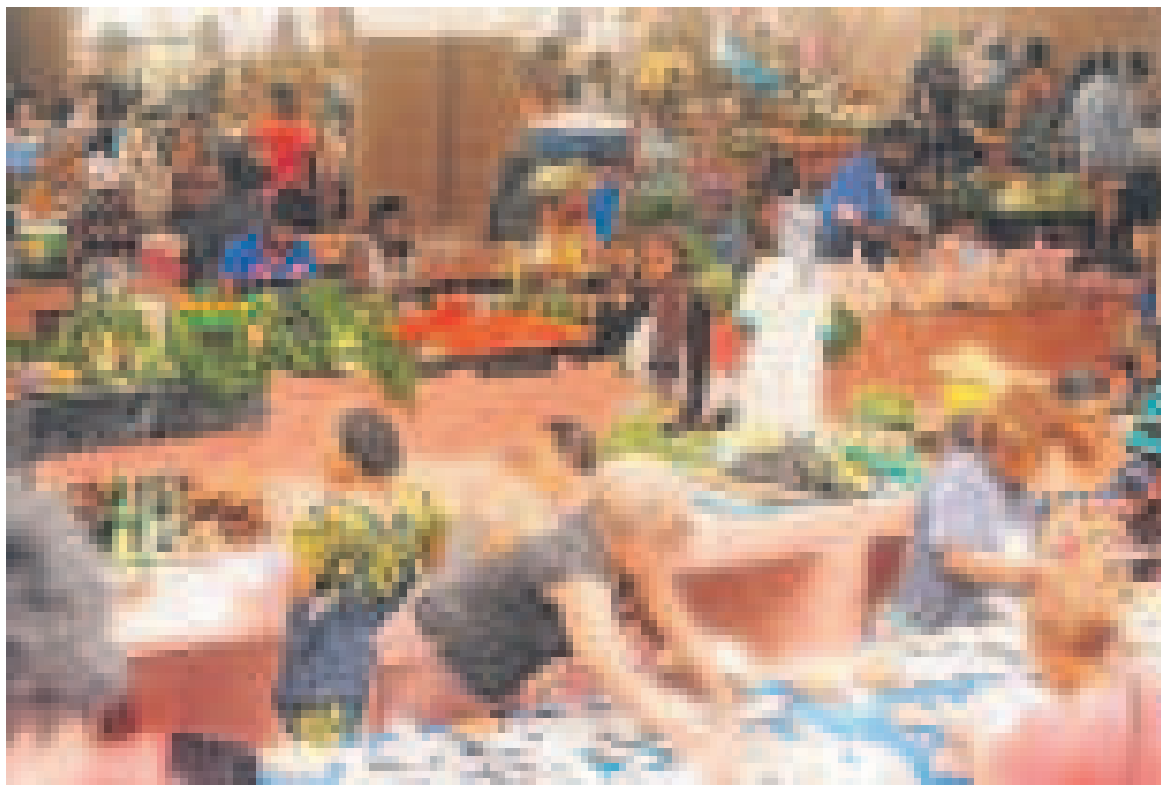
Un des marchés domaniaux de la capitale

Pour tenter de contrer l'augmentation des prix des denrées de première nécessité et baisser la pression sur le panier de la ménagère, le gouvernement a adopté en mars dernier un plan de résilience avec vingt-trois mesures. Ce plan visait, d'après le ministre d'État, chargé du Commerce, des Approvisionnements et de la Consommation, Claude Alphonse N'Silou, à anticiper pour