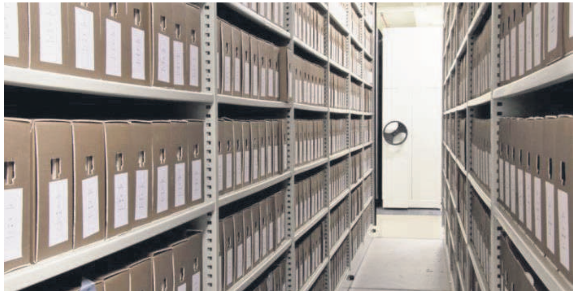
Une vue des archives de l'Etat belge

En adoptant la proposition de résolution, co-écrite par le PS, à l'origine de cette reconnaissance, la Belgique a pris plusieurs engagements, dont la garantie d'un accès aux archives coloniales pour les personnes qui souhaiteraient connaître leur histoire et retracer leur appartenance familiale. Pour ce faire, une cellule de recherche a alors été spécialement créée, au sein des Archives du royaume, afin de répertorier tous les éléments susceptibles de reconstituer les parcours individuels et collectifs de ces métis. « Le hic, c'est que, à cause de la loi sur la protection des données, cette cellule ne peut divulguer l'identité des personnes recherchées sans leur consentement. Or, dans la majorité des cas, elles sont