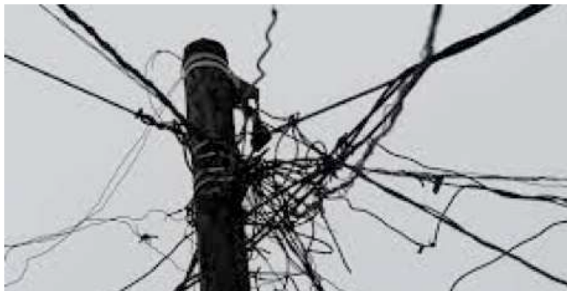
Des fils électriques à Kinshasa

La société civile admet également que la réforme du cadre légal et institutionnel a abouti à un grand résultat qui est la pro-