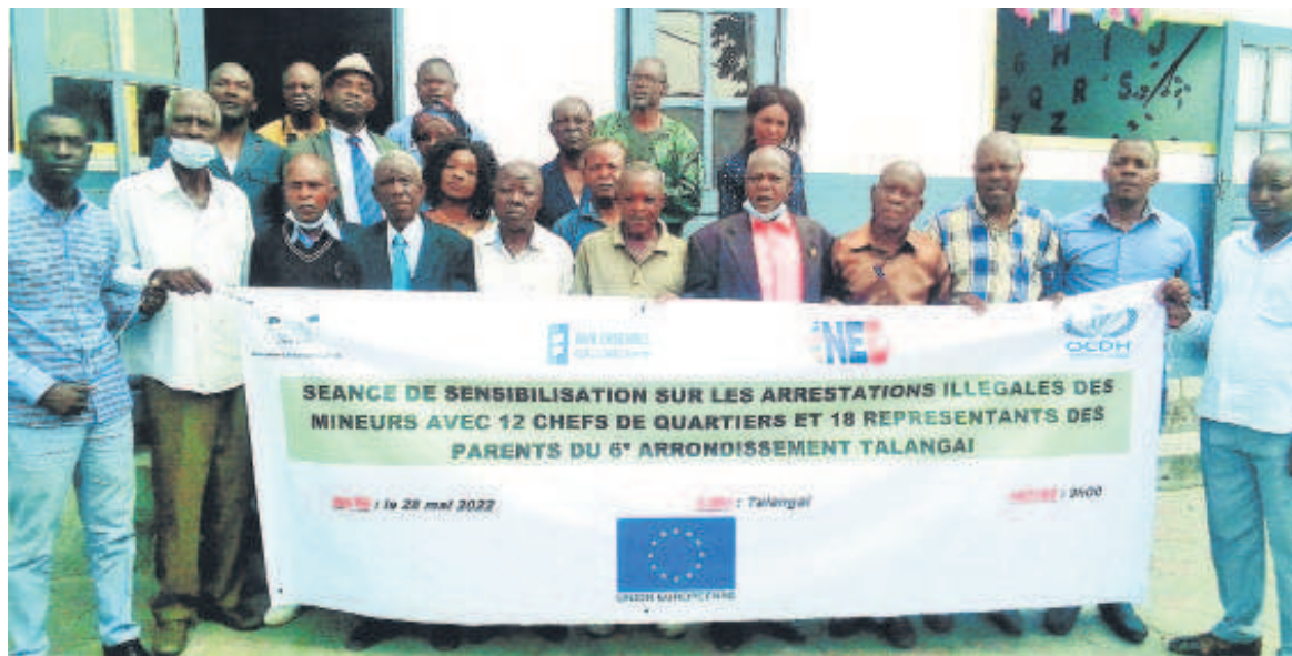
Les participants à la séance de sensibilisation de Talangai/DR

L'Association les amis des enfants (AAE) a constaté, au terme des séances de sensibilisation des chefs de quartier et des parents aux arrestations illégales des mineurs à Brazzaville, que les « bébés noirs ou kulunas » étaient à 90% des orphelins et enfants vulnérables, incarcérés dans les postes de police.