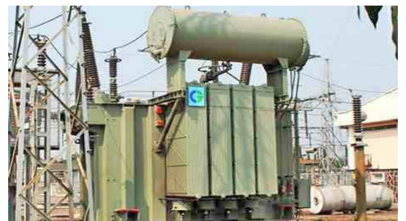
Un transformateur de la Snel

La société civile congolaise organise, ce 2 juin, à Kinshasa une marche pacifique qui partira de rond-point des Huileries pour aboutir à l'immeuble de la Régideso, sur l'avenue éponyme, où un mémorandum sera déposé au ministère des Ressources hydrauliques et Electricité.