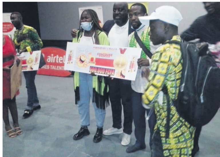
Le duo révélation, lauréat du concours d'humour, recevant sa cagnotte