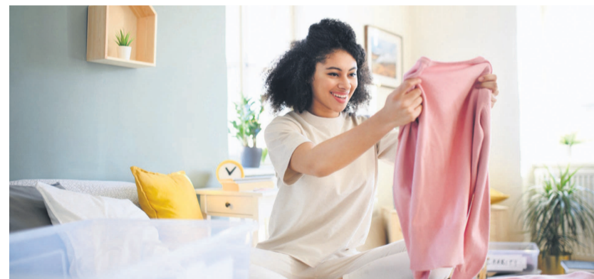
Une jeune dame nettoyant sa chambre

La chambre à coucher et le salon représentent autant d'espaces de bien-être. Notre chez-nous influe-t-il pour autant sur notre état d'esprit ? Les avis scientifiques tendent vers un grand oui. Voilà pourquoi, si votre espace apparaît encombré et mal rangé, il peut être pertinent d'y mettre de l'ordre ! Prêt à vous libérer l'esprit ?