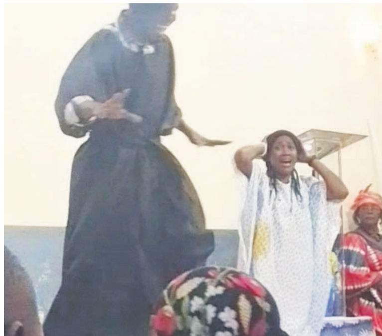
Une vue des comédiens lors du déploiement de la pièce de théâtre

Homme indépendant, Dernière chance, Double vie, Cœur fidèle, des personnages venus d'horizons divers se retrouvent de manière soudaine devant le trône du jugement et tentent de se justifier en mettant en exergue leurs bonnes œuvres. Le premier arrogant et sûr de lui table sur les bonnes actions qu'il a faites en croyant que celles-ci suffiraient pour qu'il accède au royaume des cieux. Erreur ! Homme indépendant avait négligé la bonne part, celle de recevoir Christ dans sa vie et il est envoyé sans égard en enfer.