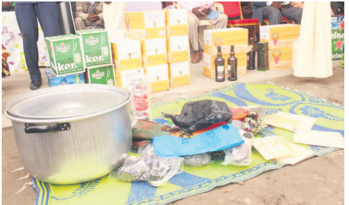
Quelques présents que requiert la dot au Congo/DR

La difficulté de se marier à l'âge nubile pose ainsi un problème pour le couple, particulièrement pour les femmes qui recherchent l'honneur ou le besoin d'une relation exclusive que seul le mariage garantit la reconnaissance sociale, le soutien matériel et financier, les joies du mariage et de la vie de