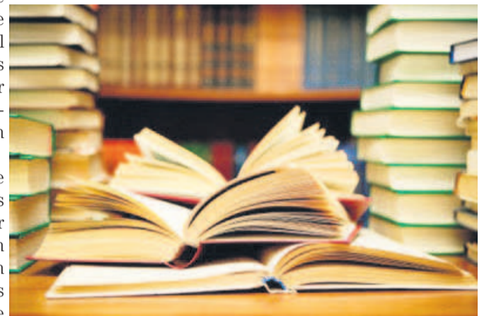
Une vue de livres

tion pour qu'elle aille de l'avant afin que les œuvres soient lues tout en permettant aux écrivains africains de se rencontrer et discuter. Des tables rondes thématiques, des échanges sur les œuvres ainsi que des dédicaces sont inscrits au programme. Pour cette première édition, deux prix sont mis en exergue dont le prix international de poé-