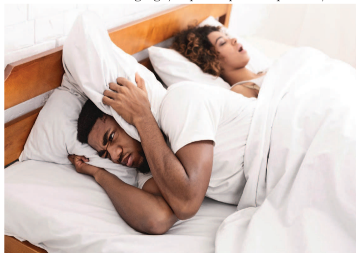
Un homme dérangé par le ronflement de sa conjointe

la voile du palais, la luette et la langue ne font pas exception, prennent davantage de place et obstruent les voies respiratoires. Lorsque nous inspirons, l'air a plus de mal à passer et fait vibrer le pharynx, provoquant un bruit de tracteur.