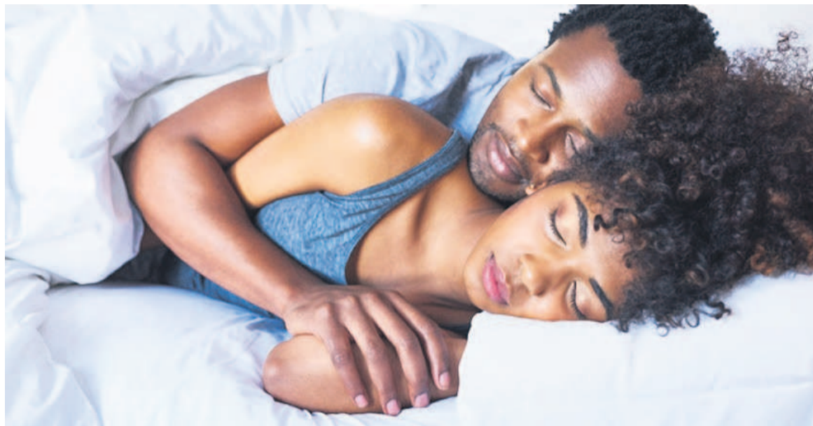
Un couple profitant d'un sommeil paisible

Stress, fatigue, apnée du sommeil. Résultats, celles et ceux qui dorment à deux sont moins exposés aux épisodes d'insomnie et éprouvent moins de fatigue au quotidien que les personnes dormant seules. Les dormeurs accompagnés trouvent aussi le sommeil plus rapidement et présentent