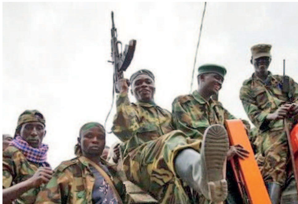
Les rebelles du Mouvement M23