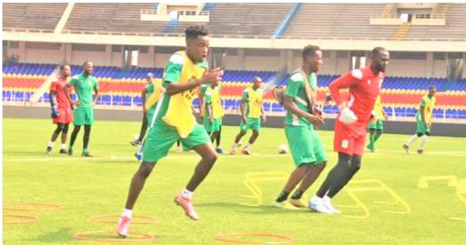
DCMP de Kinshasa

Mazembe avait fait le déplacement de Lubumbashi vers Kinshasa en perspective de cette rencontre. Mais les Corbeaux de Lubumbashi vont repartir dans le Haut-Katanga