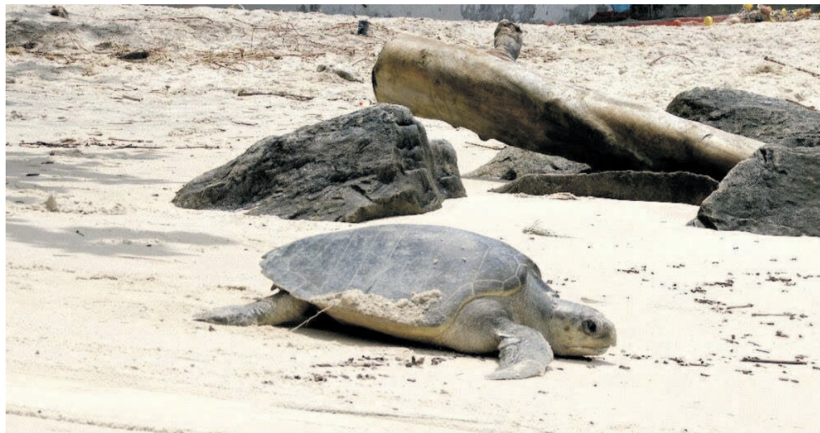
Une espèce de tortue marine à la baie de Loango

Le site de l'aire protégée marine des tortues est aménagé au bord de l'océan Atlantique, à Loango, dans le département du Kouilou. Cette première aire marine protégée, qui sera lancée sous peu, vise à sauvegarder les tortues menacées de disparition.