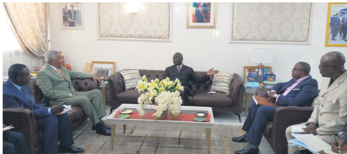
L'échange entre le maire et l'ambassadeur du Venezuela

L'accord sera signé à Caracas, au Venezuela, dans les jours à venir dans un quartier en majorité noire.