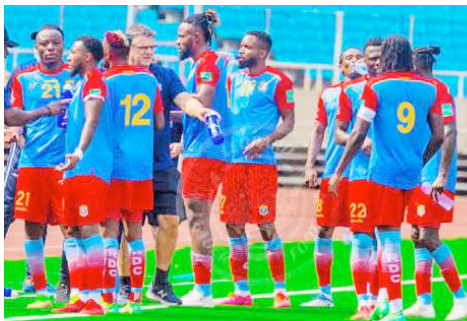
Les Léopards de la RDC.

La RDC est actuellement dernière de son groupe avec zéro point derrière la Mauritanie, le Gabon et le Soudan. Deux autres prochaines journées des éliminatoires sont prévus