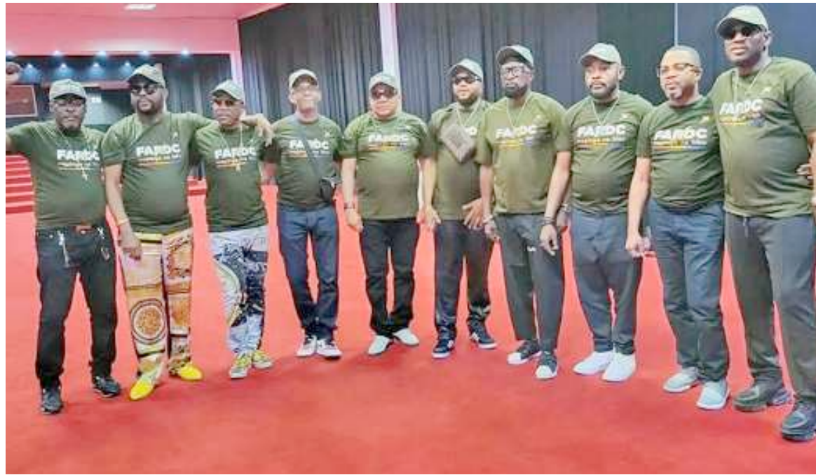
- Les chanteurs affirment leur soutien aux FARDC au front dans l'Est du pays/DR

Par ailleurs, l'orchestre recomposé lui-même semble avoir trouvé la bonne parade face à l'agitation autour de l'événement. Le 17 juin, le chargé de communication de «Ya biso Wenge» avait annoncé, sur les ondes de la «Radio Top Congo», qu'une partie des bénéfices participerait à soutenir l'effort de guerre. Une bonne part des recettes reviendrait aux Forces armées de la Ré-