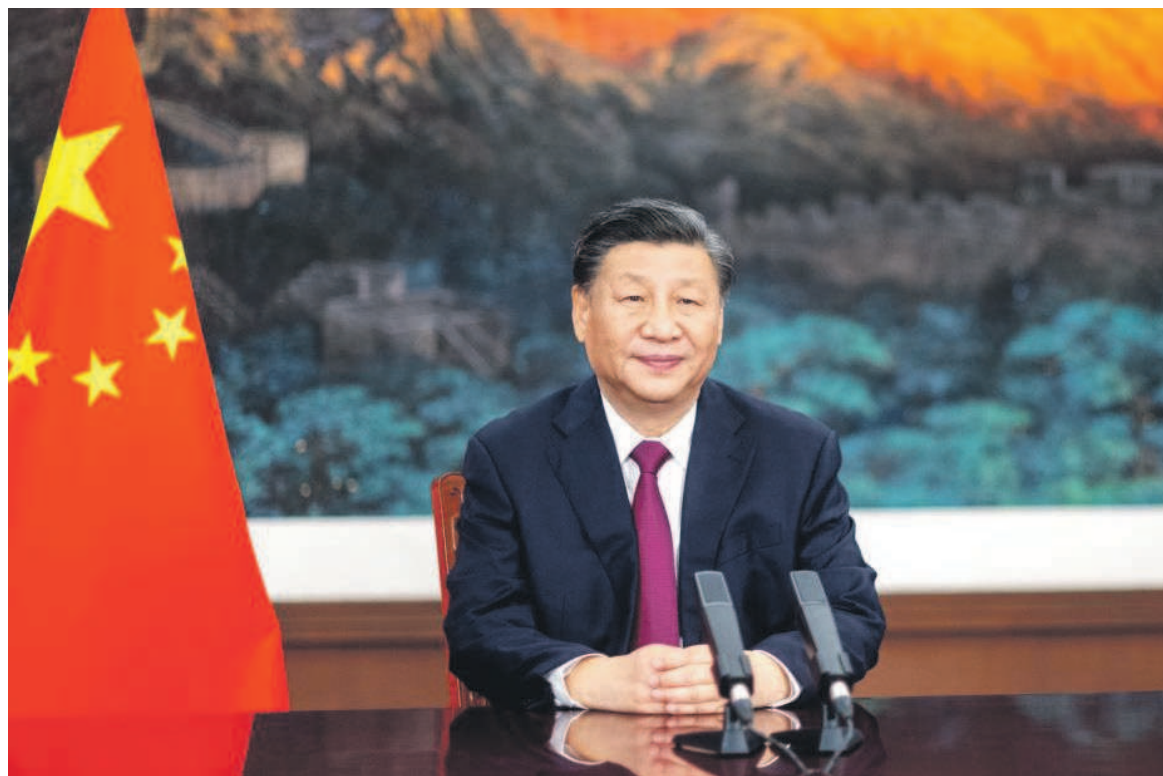
Xi Jinping prononçant son discours par liaison vidéo

Xi Jinping a, par ailleurs, souligné que l'histoire et la réalité actuelle enseignent que la recherche de