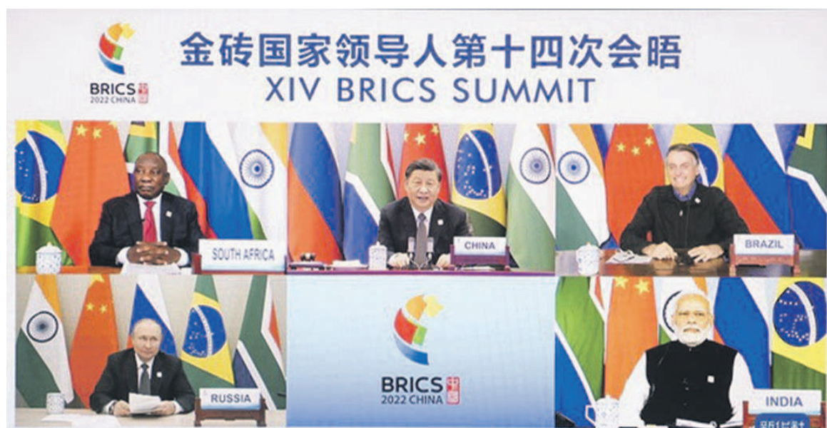
Les chefs d'État des pays des BRICS lors de la 14e session.

« Les pays des BRICS doivent se soutenir mutuellement sur les questions touchant à leurs intérêts vitaux, poursuivre le véritable multilatéralisme, défendre la justice, l'équité et la solidarité et rejeter l'hégémonie, l'intimidation et la division », a indiqué le président chinois. Il a précisé que son pays entend travailler avec ses partenaires des BRICS (Brésil, Russie, Inde, Chine, Afrique du Sud) dans la mise en œuvre de