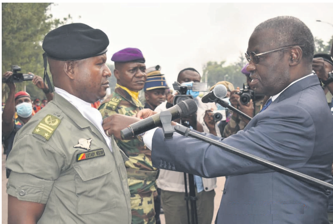
Le ministre de la Défense décorant des agents de la force publique.

Quelque huit cents militaires ainsi que plusieurs véhicules ont participé à l'édition 2022 du défilé de près d'une heure organisé autour du thème « Dans la cohésion et la complémen-