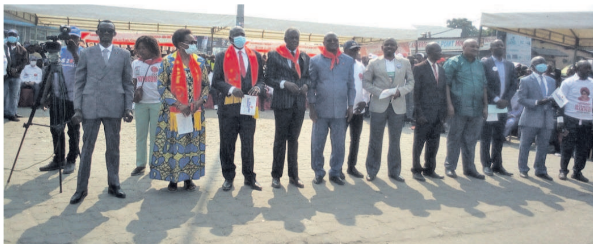
Claudia Ikia Sassou N'Guesso et les candidats du PCT aux locales Talangai/Adiac

Le Parti congolais du travail (PCT) a lancé, le 24 juin, sa campagne électorale comptant pour les législatives et locales des 4 et 10 juillet prochains, à travers un meeting organisé au rond-point Mikalou, dans le 6e arrondissement de Brazzaville, Talangai.