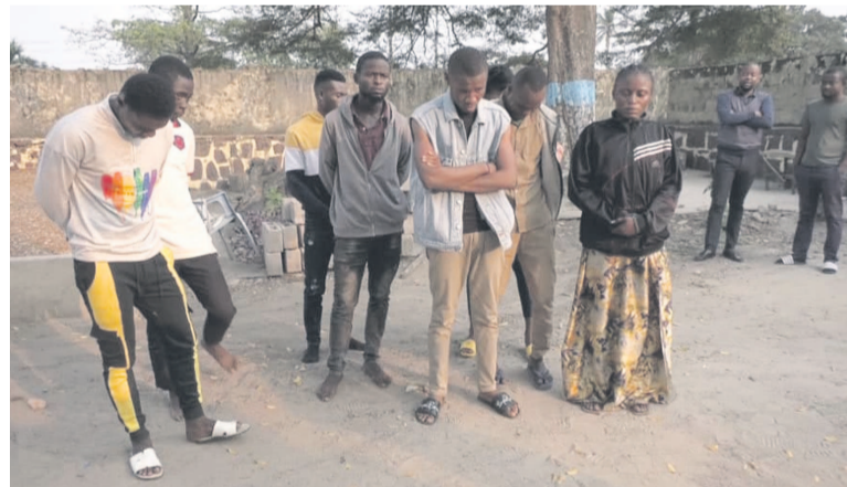
Les fraudeurs interpellés

La commission antifraude en milieu scolaire a mis la main sur une vingtaine de fraudeurs à Brazzaville, Ignyé, Mindouli, lors des épreuves du baccalauréat général session de juin 2022.