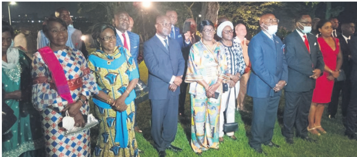
La ministre des Affaires sociales, le chef d'état-major général des FAC et bien d'autres personnalités assistant à la cérémonie.

Il a poursuivi qu'avec son défunt époux, Alfred Raoul, ils ont tous les deux incarné le visage d'un nouveau Congo, qui s'est progressivement reformé de l'intérieur pour s'ouvrir au monde. Mais la guerre est ensuite arrivée, marquée par le déchainement des pires passions des hommes, et conduisant dans