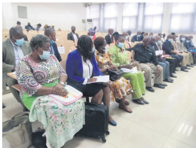
Réunion de la commission administrative paritaire Adiac

La ministre de l'Enseignement supérieur, de la Recherche scientifique et de l'Innovation technologique, Delphine Edith Emmanuel, a ouvert les travaux de la commission administrative paritaire, le 23 juin à Brazzaville, avec sur la table 382 dossiers. Promotions (194), promotion pour les agents retraités (20), avancements (47), titularisations (42), reconstitution de carrière (65), validation (1), mises en stage (5), dossiers rectificatifs (8).