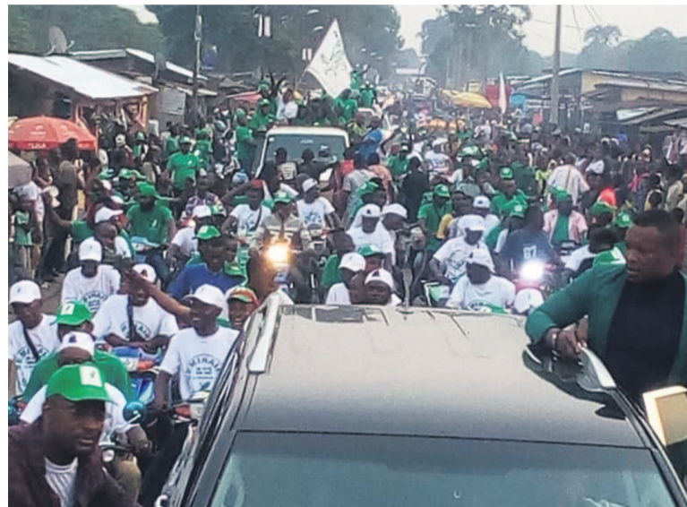
Un carnaval de campagne