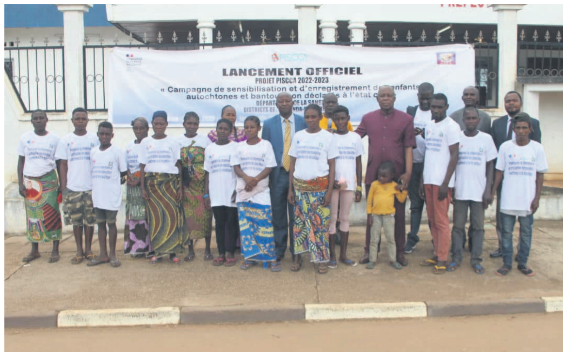
Les participants au lancement du projet.

Les membres de cette structure procéderont à la formation des