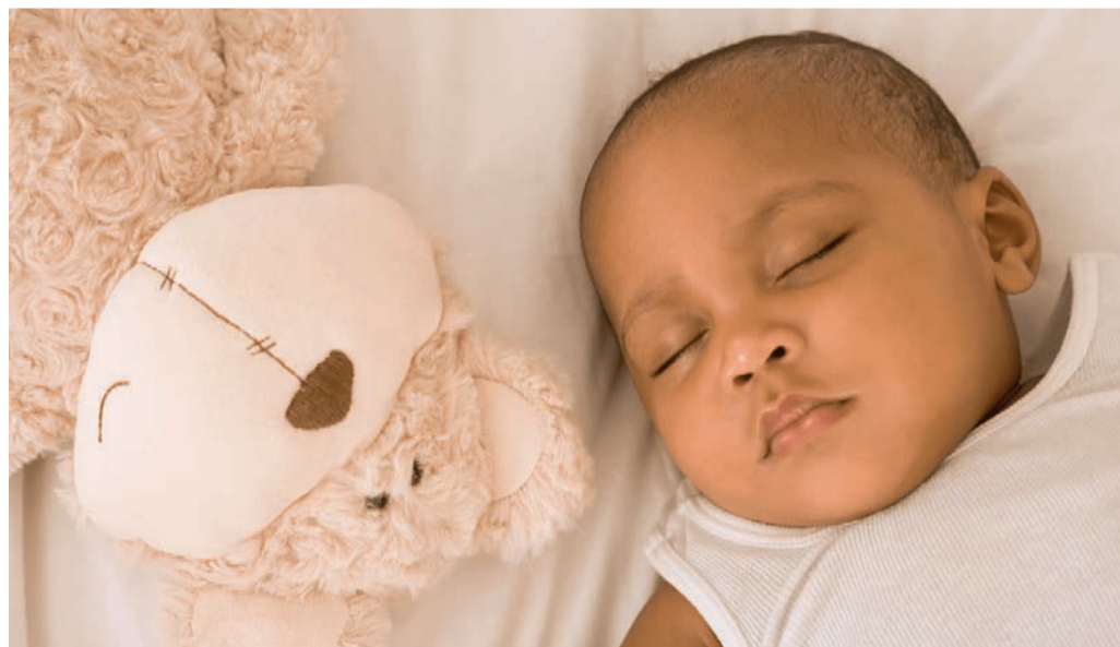
Un bébé endormi

Si le lien entre un sommeil insuffisant et une prise de poids est bien établi chez les adultes, il serait aussi valable pour les nouveau-nés. C'est ce que suggère une étude américaine publiée dans l'American Journal of Nursing.