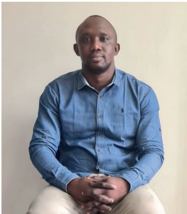
Denis Sassou N'Guesso ?

L.D.B.C. : Qu'est-ce qui spécifie ce livre par rapport aux autres écrits sur le président