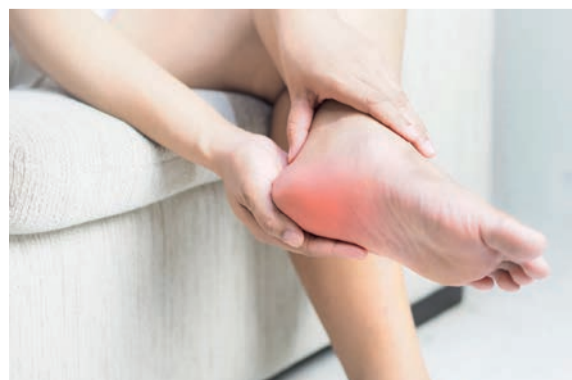
La plante des pieds