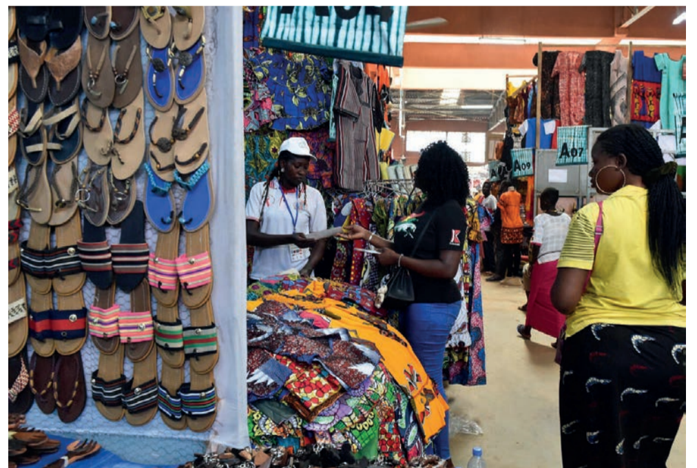
Une vue des stands

Le Salon international de l'artisanat de Ouagadougou (Siao) se tiendra du 28 octobre au 6 novembre prochain. Il va offrir un espace économique aux artistes producteurs qui viendront de différents pays africains pour promouvoir et commercialiser leurs produits auprès des professionnels et susciter des investissements nationaux et internationaux pour l'écllosion du secteur de l'artisanat en Afrique.