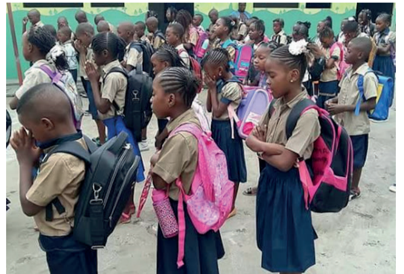
Des élèves congolais

La situation socio-économique de la République du Congo laisse de plus en plus à désirer et la fragilisation de l'accès à l'éducation entraînerait des problèmes plus profonds encore que ceux qui défraient actuellement la chro-