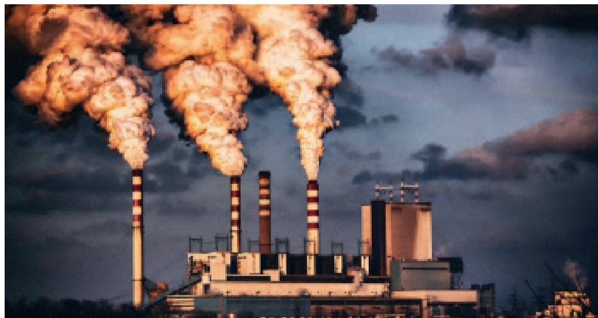
Une fumée polluante

La principale méthode en matière de surveillance des émissions consiste à demander aux émetteurs combien ils ont émis. La plupart des entreprises dans le monde choisissent de ne pas faire de rapport. En outre, il faut parfois dix ans pour obtenir les informations de certains pays, qui sont alors dépassées. Depuis l'adoption de la convention des Nations unies sur le climat à Rio de Janeiro, en 1992, 193 pays sont tenus de rendre compte de leurs émissions tous les deux ans aux Nations unies. Ces rapports sont supervisés par le groupe d'experts intergouvernemental sur l'évolution du climat, le GIEC. Mais certains scientifiques affirment que la procédure est parfois lente, dépassée et imprécise. « Climate Trace », une coalition d'organisations à but non lucratif, d'universités et d'entreprises technologiques qui utilisent des satellites et d'autres technologies de