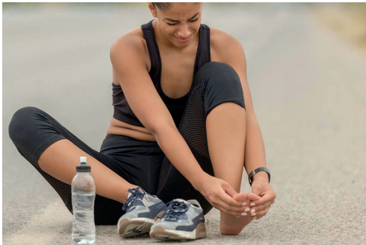
Une sportive ayant des crampes au pied

Lorsqu'un exercice musculaire est trop intense, qu'il se prolonge ou que vous êtes mal préparé, une contraction musculaire involontaire peut survenir. C'est la crampe. Comment la prendre en charge ? Et surtout, comment l'éviter ?