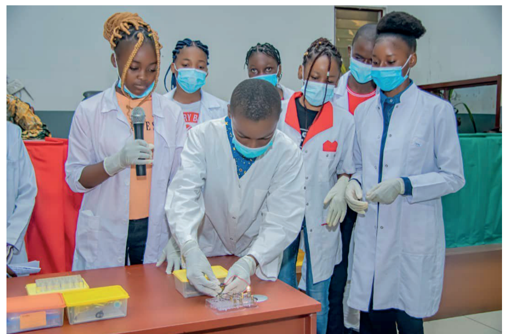
Les élèves dans un laboratoire

La plateforme de promotion éducative qui travaille depuis plusieurs années avec des écoles publiques et privées au Congo s'engage dans la proposition des alternatives au coût élevé des laboratoires scientifiques classiques.