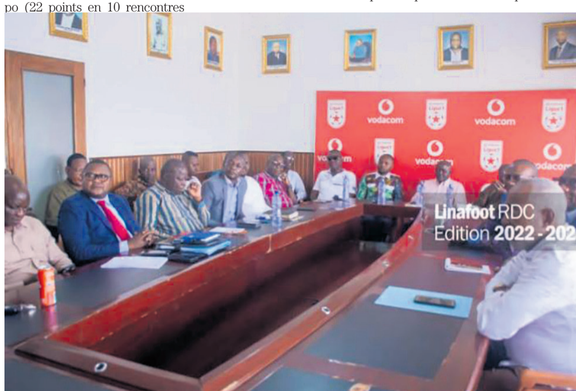
La réunion entre la Linafoot et l'Adfco/DR

Somme toute, c'est le football congolais qui marque un moment de régression. Et cela est bien perceptible lors de participation des clubs congolais et les sélections nationales dans les compétitions continentales, avec un lot des contreperformances.