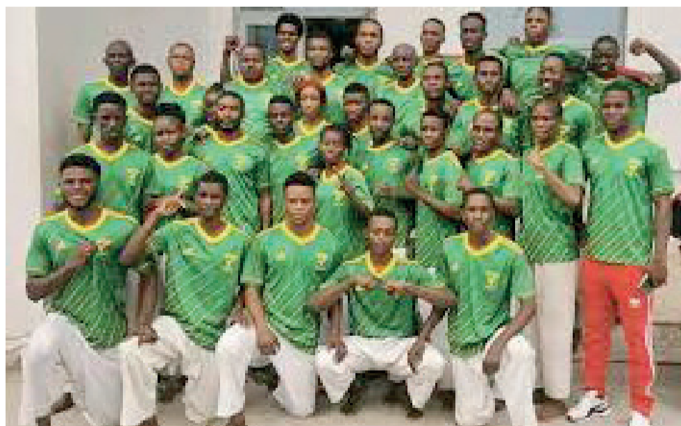
Les Diables rouges lors d'un stage DR

Le sélectionneur national des Diables rouges karaté, Me Fiston Moussa Trebissé, vient de publier la liste des athlètes qui vont représenter le Congo aux compétitions africaines. Les budokas retenus affûtent leurs armes dans la perspective de ces échéances.