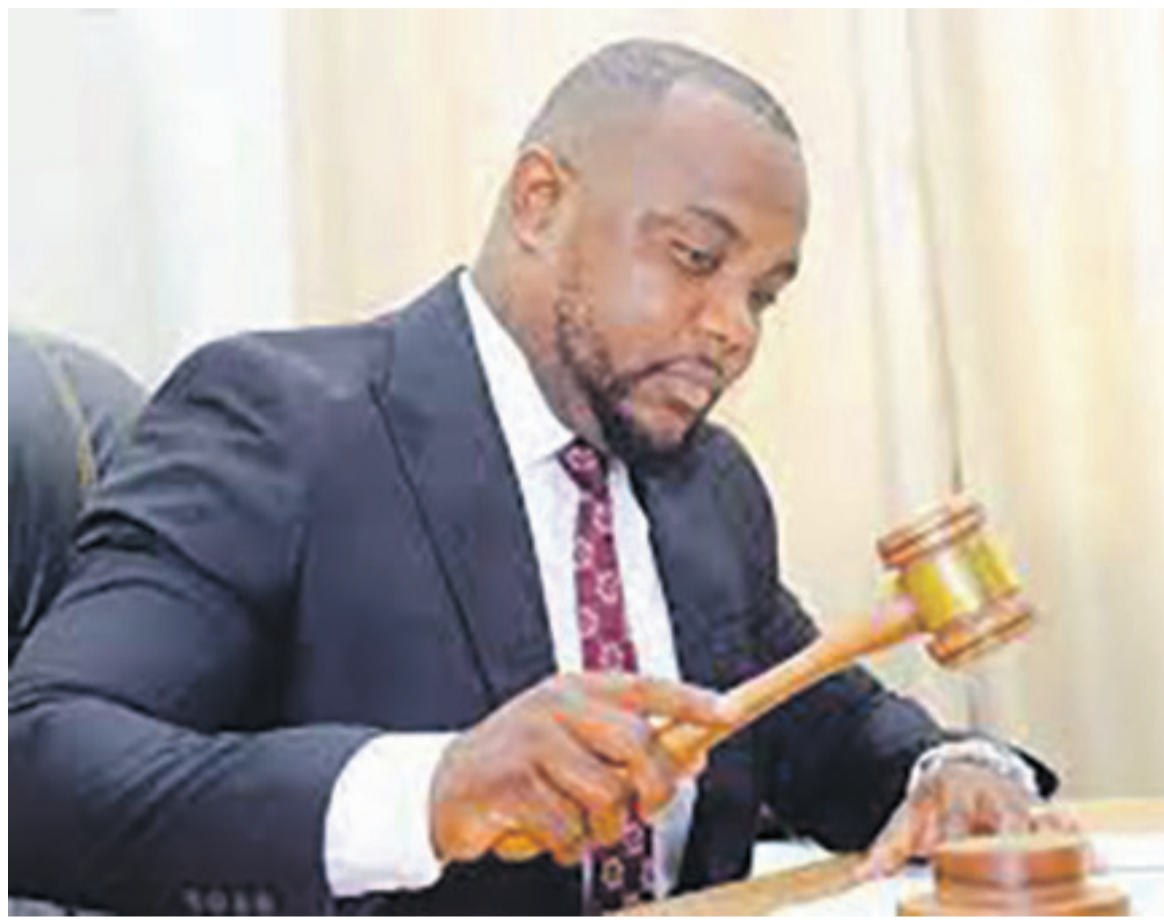
Le président du CSAC/DR

Le CSAC accuse, en effet, les médias rwandais de démotiver les forces de défense de la RDC au bénéfice du M23. « Les mêmes chaînes sacrifient la culture de la paix dont la RDC fait son cheval de bataille dans la Région des Grands Lacs », explique cette institution. Pour l'autorité de régulation des médias en RDC, « ces chaînes rwandaises s'emploient à l'intox, à l'incitation à la désobéissance civile, à l'insurrection générale contre l'autorité publique de la RDC et le dénigrement systématique des institutions nationales et de leurs animateurs, ainsi qu'à l'apologie de la