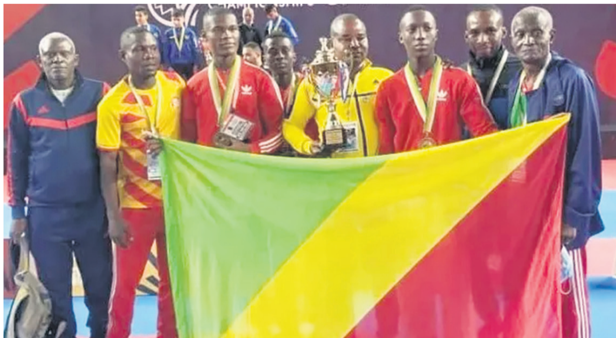
Les Diables rouges lors des championnats d'Egypte

Les quatrièmes Jeux africains de la jeunesse devaient se dérouler à Maseru, au Lesotho, désignée comme ville hôte le 17 juillet 2018 par l'Association des comités nationaux olympiques d'Afrique. Le retard dans les