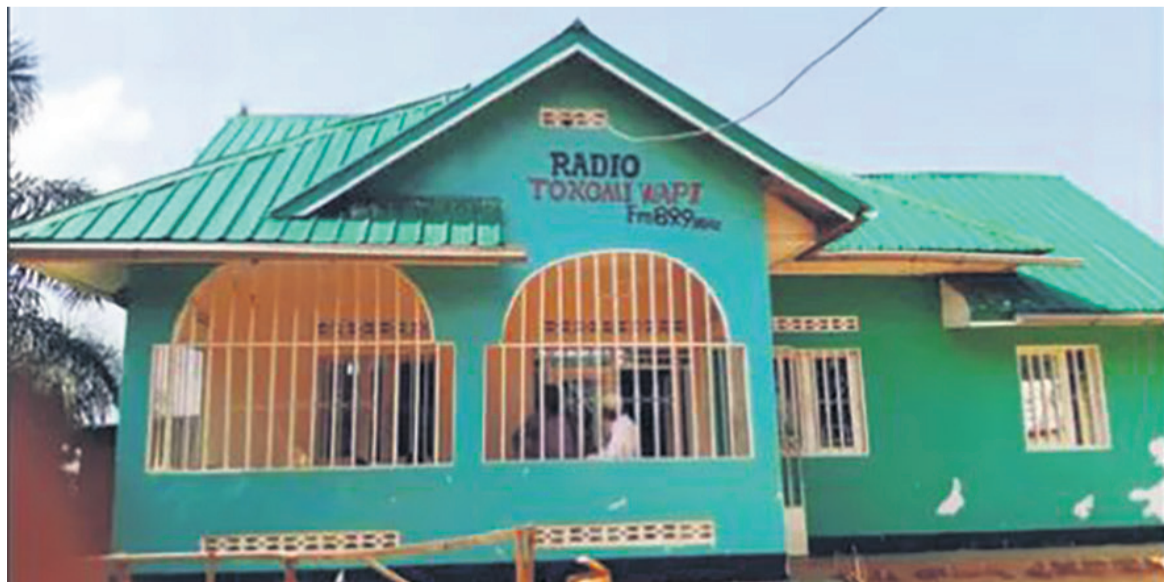
Le siège de «Radio tokomi wapi» à Kabinda/DR