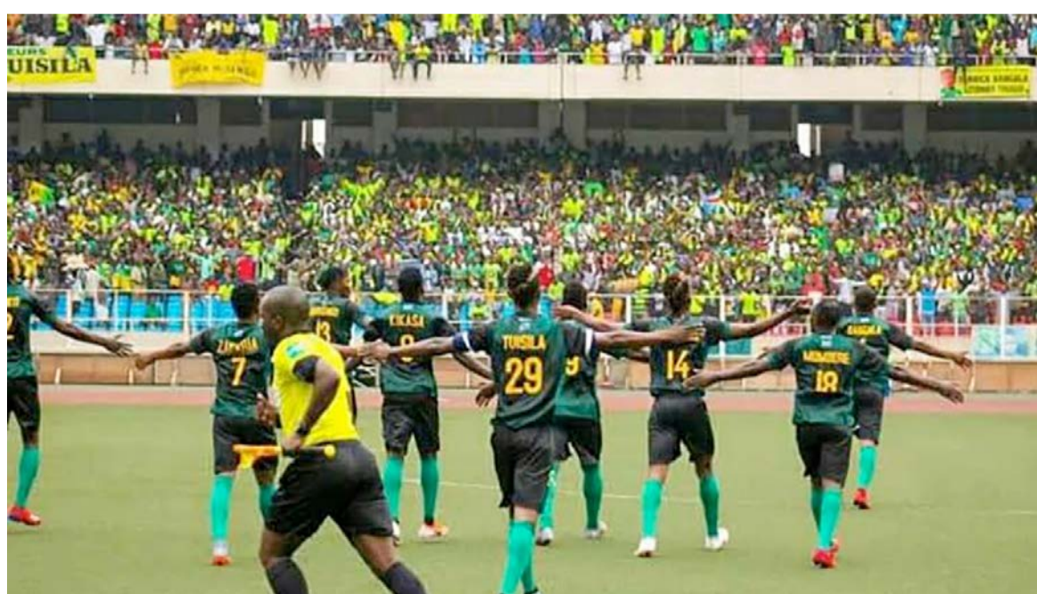
Le public autorisé à assister aux matchs dans les stades en Afrique/DR

« A tout moment, en raison des problèmes de sûreté et de sécurité, médicaux, de conformité du stade, ou en raison de cas de force majeure et de circonstances imprévues, la CAF se réserve le droit de ne pas autoriser ou de limiter la présence des spectateurs à un match spécifique. Auquel cas, une communication devra être envoyée à l'association membre ou au club concerné », fait observer la circulaire.