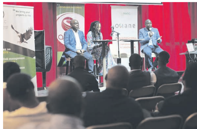
La conférence de presse du lancement officiel du salon international Osiane 2023

Après le lancement officiel au Congo de la septième édition du Salon international des technologies de l'information et de l'innovation – Osiane –, les organisateurs mettent le cap sur Paris et Bruxelles avant la promotion des écosystèmes d'innovation et la valorisation des start-up.