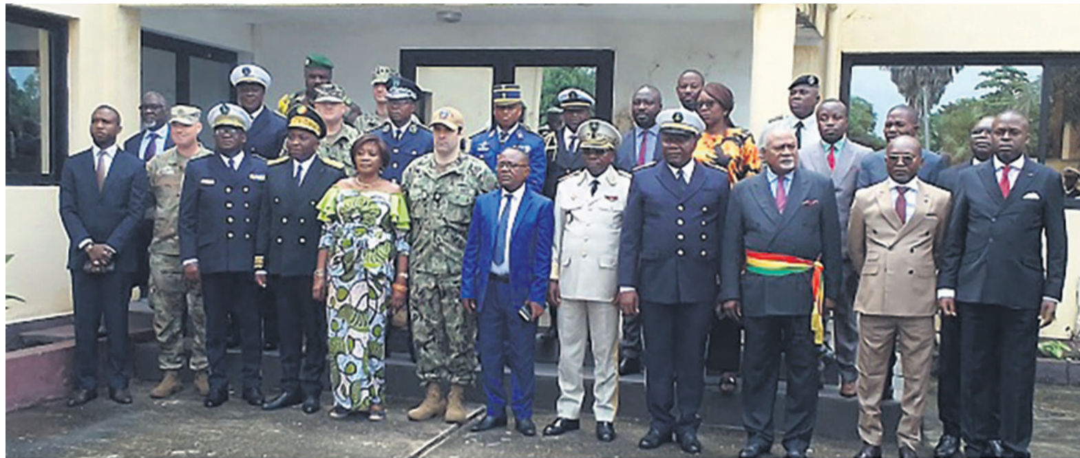
Photo de famille lors du lancement de l'exercice Obangamé express 2023

Le but d'Obangamé 2023 a été de développer les capacités des structures de coordination à conduire les moyens engagés au large, de parfaire la chaîne de communication des forces congolaises, de poursuivre