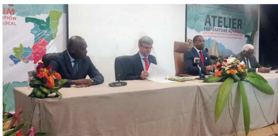
Lancement de l'atelier préparatoire

de l'accord de Facilité élargie de crédit, permettant à la République du Congo de tirer l'équivalent d'environ 53 milliards FCFA », précise le communiqué.