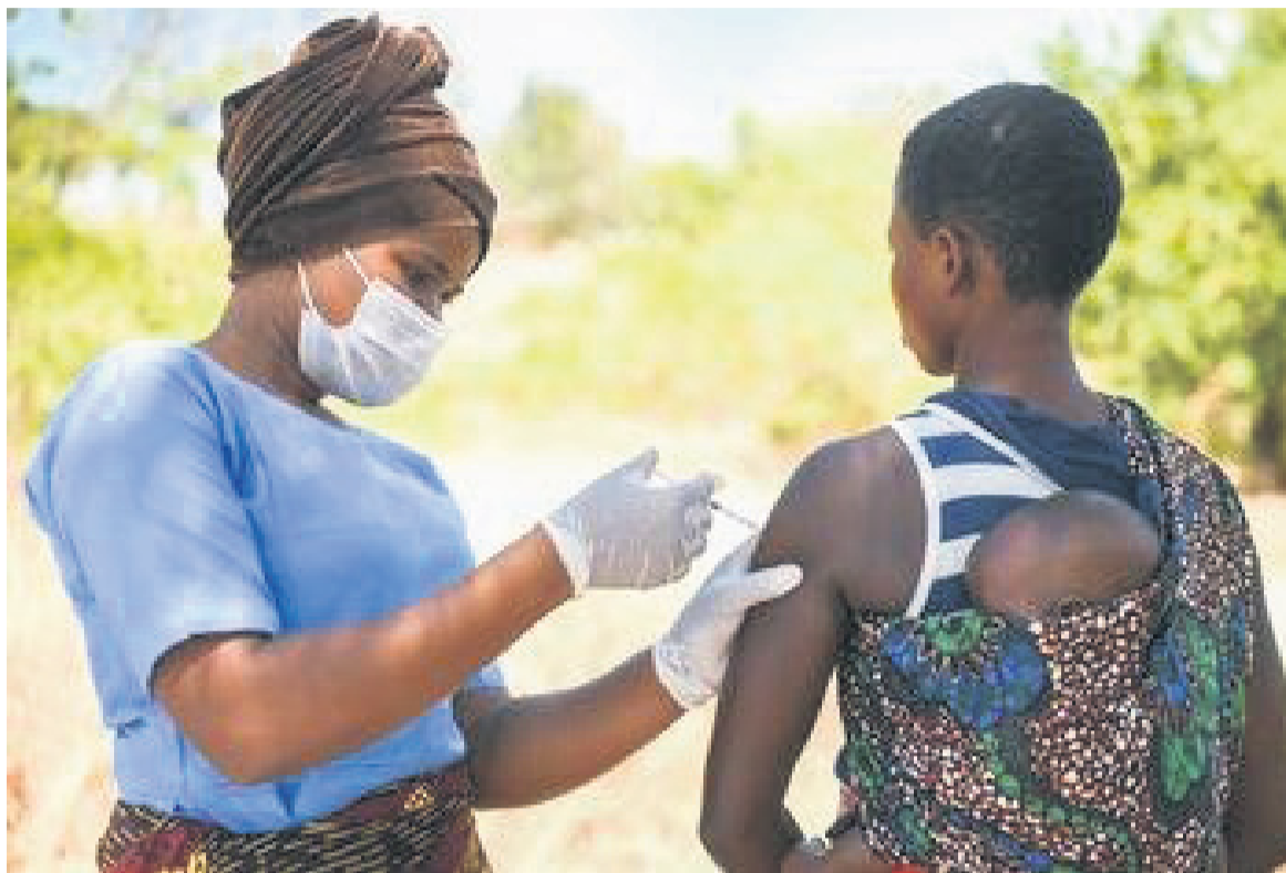
Une campagne de vaccination

La même source note, par ailleurs, que 25,2% d'agents de santé ont été complètement vaccinés. Il faut noter que parmi eux, il y a 25,4% de personnes d'au-moins 55 ans vaccinées et 22,9% de personnes avec comorbidités. L'objectif de la