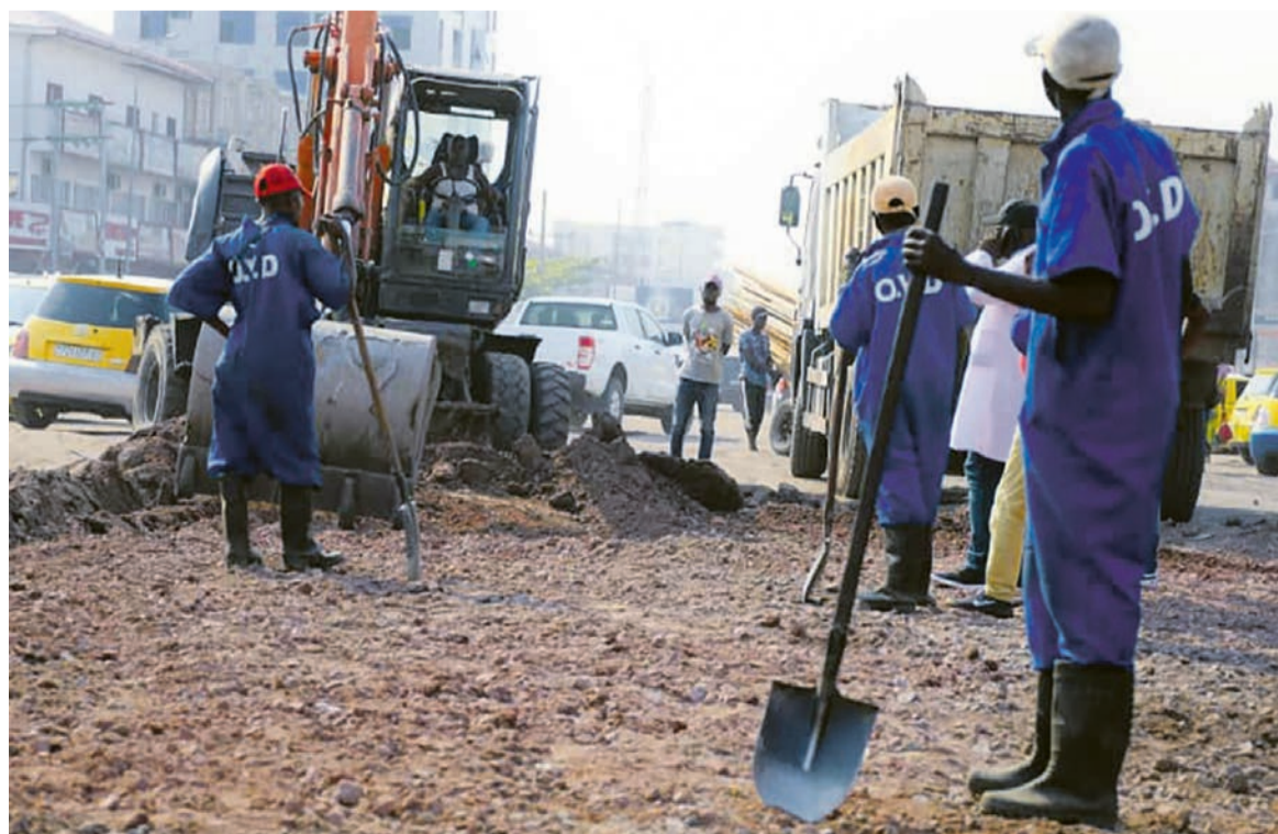
Le rond-point des Huileries en pleine réhabilitation

L'objectif de cette opération est d'évacuer les emprises publiques de tout encombrement occasionné par des marchés pirates et des stationnements anarchiques des véhicules de transport en commun. Ce programme qui s'inscrit dans le cadre de l'opération Kinshasa-Bopeto vise le respect et la restauration des normes urbanistiques à travers toute l'étendue de la ville de Kinshasa.