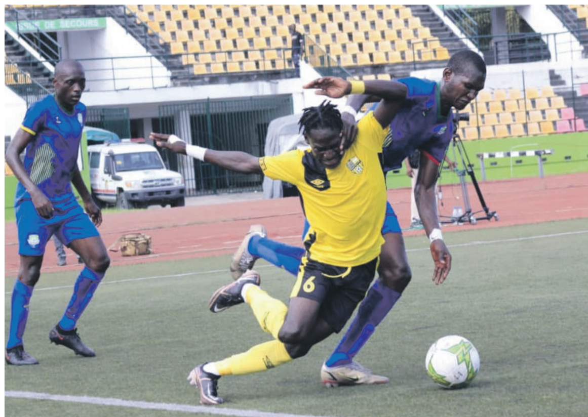
Les Diabes noirs accrochés à domicile par l'AS Otohô/Rogalvy

« C'était un derby mais dimanche est une autre paire de manches. Nous avons vu des faibles aujourd'hui mais aussi de bonnes choses, comme notre réaction. Nous allons nous mettre à travailler là-des-