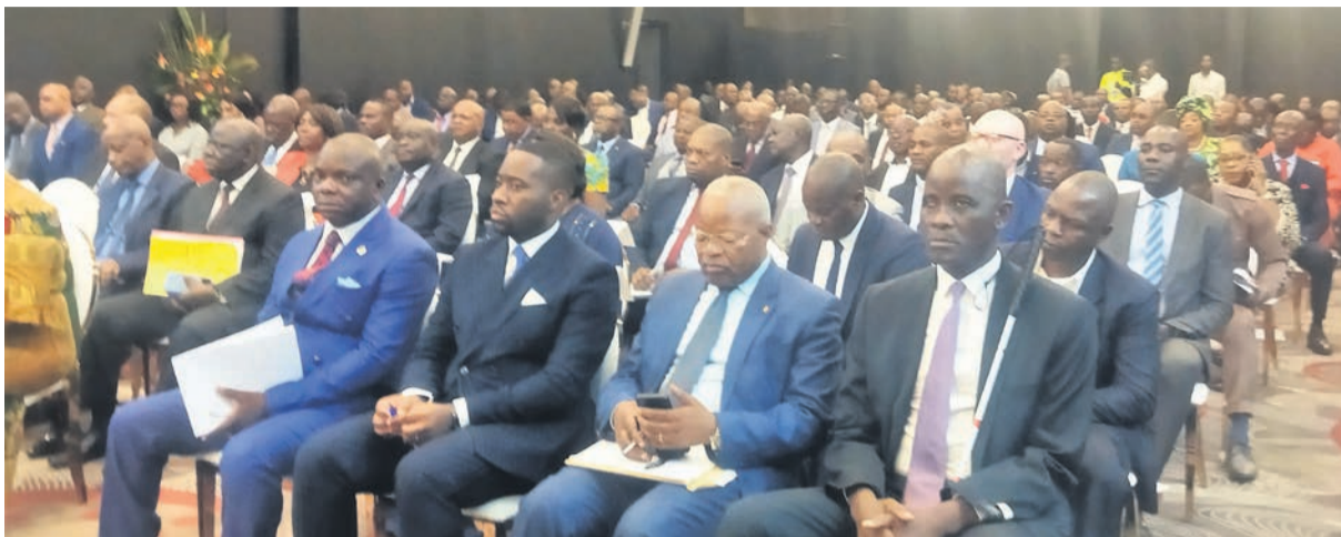
Les invités et les responsables des collectivités locales pendant les travaux

Ouvrant les travaux, le ministre de tutelle a rappelé l'intérêt de cette rencontre préparatoire. « Le présent atelier vise à préparer toutes actions nécessaires et utiles pour la mise en oeuvre effective d'un développement local équitable et harmonieux au Congo. Nous devons nous poser des questions de savoir, quels sont les obstacles à surmonter pour rendre effective la décentralisation, quel mécanisme d'appui faut-il mettre en place