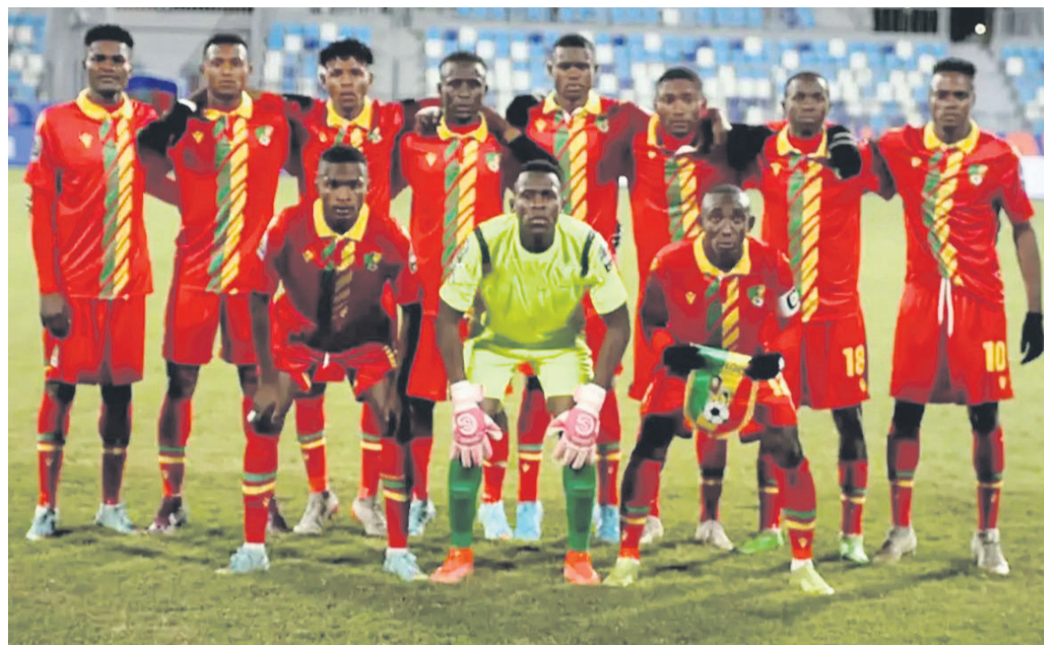
Les Diables rouges U-20 qualifiés pour les quarts de finale de la CANDR

Les Diables rouges ne doivent cependant pas dormir sur leurs lauriers. Le plus dur reste à faire puisqu'ils sont à un match