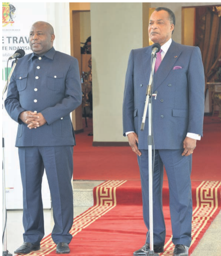
Les présidents Denis Sassou N'Guesso et Evariste Ndayishimiye

De son côté, le président Evariste Ndayishimiye, qui préside la Communauté des Etats de l'Afrique de l'Est, a fait savoir que les chefs d'Etat de la région étaient solidaires pour le retour du climat de paix dans la partie orientale de la RDC. « En RDC, on a les difficultés à gérer la sécurité à l'est du pays. Nous