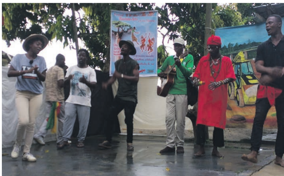
Une vue du lancement de Racont'arts

La première édition du festival Racont'arts de Kabylie, version congolaise, a lieu du 22 au 25 février, au quartier Côte matève, dans le 6e arrondissement de Pointe-Noire, Ngoyo.