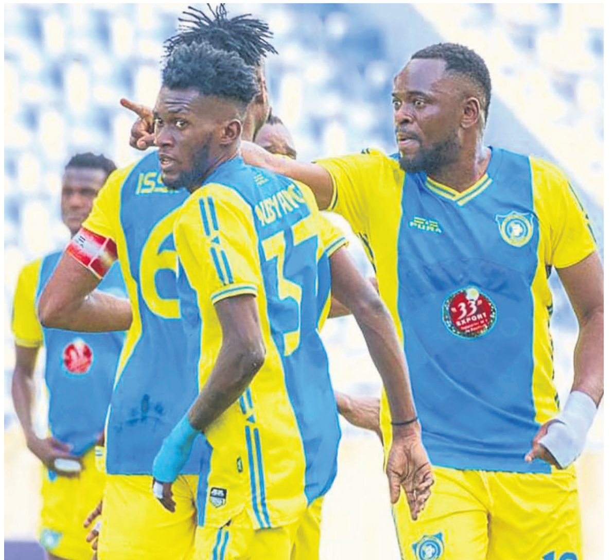
Lupopo a battu Al-Akhdar de Libye, le 26 février 2023 à Ndola, en Zambie.