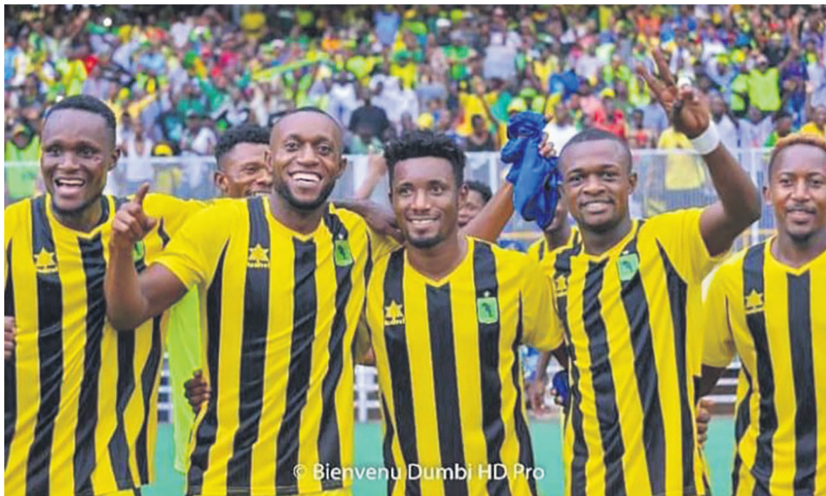
V.Club victorieux de la JS Kabylie, le 25 février 2023, à Brazzaville