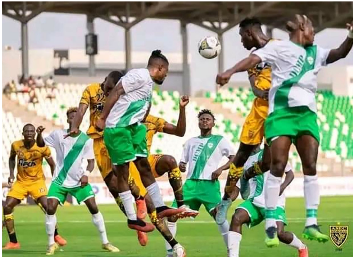
DCMP battu par Rivers Utd du Nigeria, le 26 février 2023, en Angola/DR