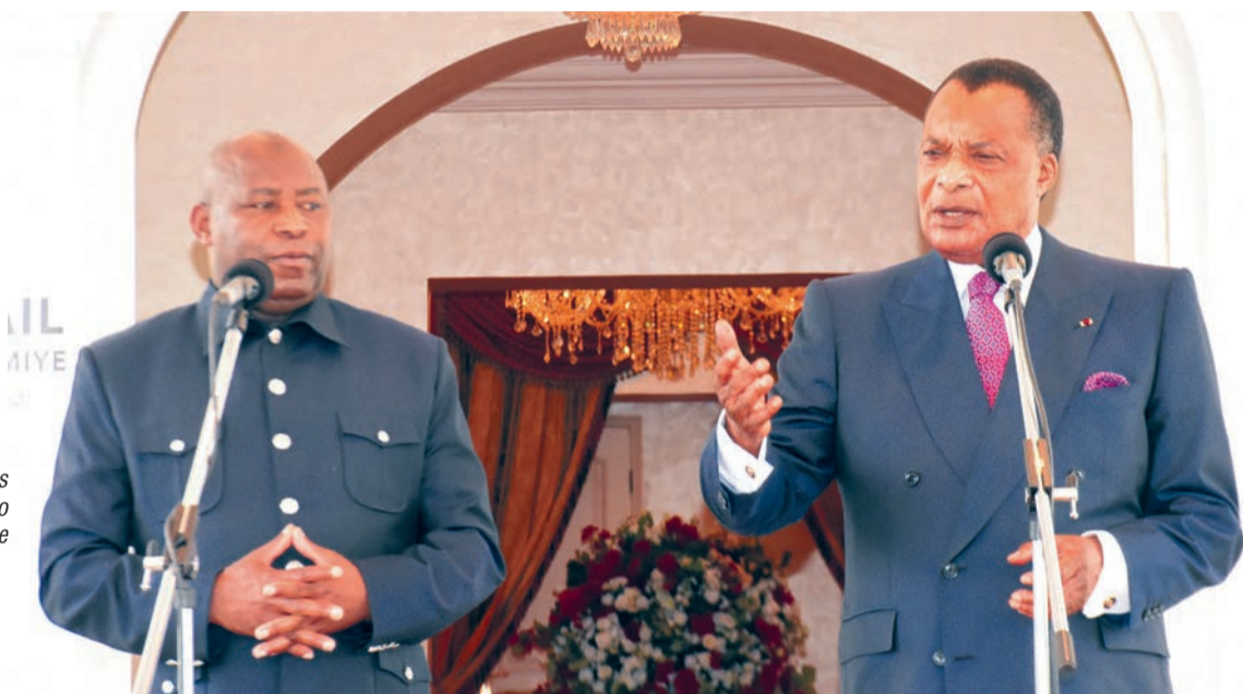
Les présidents Denis Sassou N'Gusso et Evariste Ndayishimiye