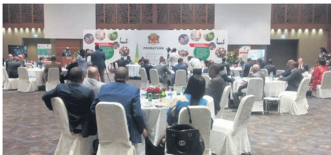
Le Premier ministre, les membres du gouvernement et les investisseurs lors du déjeuner d'affaires

La même enquête relève aussi un grave harcèlement fiscal, perpétré par une multiplicité de taxes, avec succession de contrôles administratifs qui s'effectuent sur une longue période et qui, du reste, portent préjudice sur le fonctionnement normal de leurs entreprises.