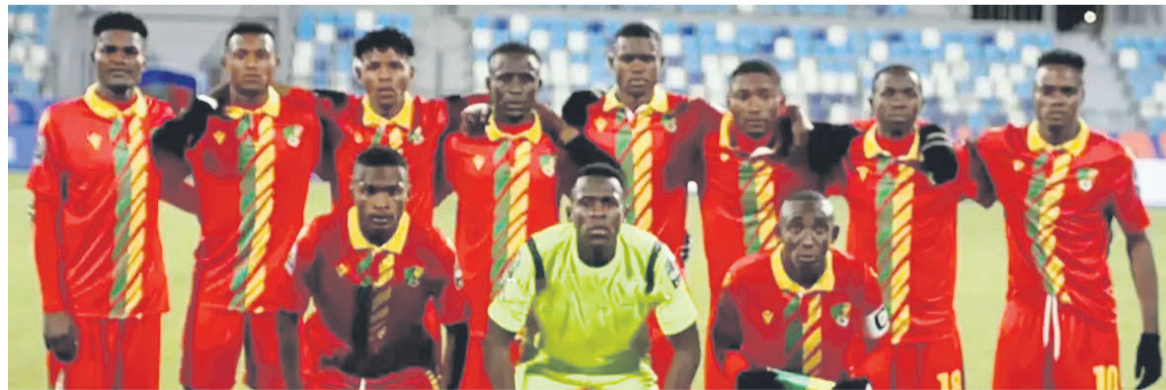
Les Diables rouges U-20 qualifiés pour les quarts de finale de la CANOR

Les Diables rouges des moins de 20 ans ont confirmé, dimanche, leur qualification en quarts de finale de la Coupe d'Afrique des nations (CAN) de la catégorie, à l'issue du