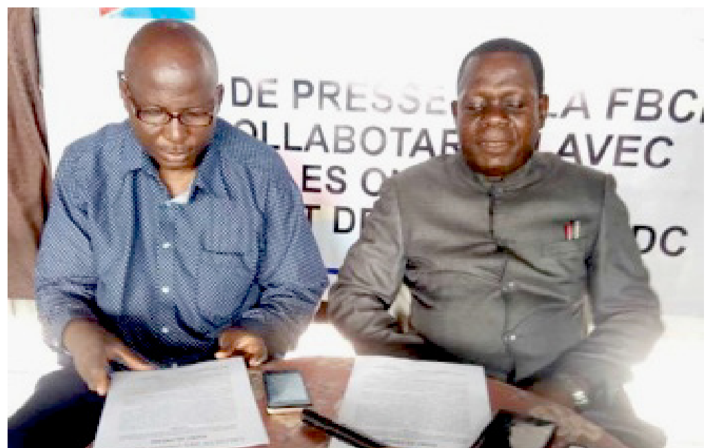
Le président de la FBCP et son collègue, lors d'un point de presse sur le monitoring dans les prisons du pays