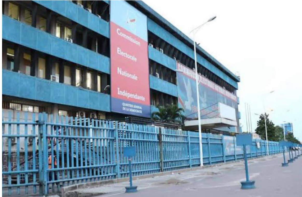
Le siège de la Céni à Kinshasa

Les dernières atteintes portées aux matériels et kits électoraux dans certaines contrées du pays ainsi que les recours aux méthodes de déportation des électeurs sont de nature à entraver la fiabilité du fichier électoral. Il en est de même des pratiques de violence, de stigmatisation, d'exclusion et de discrimination dont seraient victimes certains compatriotes. Très préoccupé par ces faits déplorables, le président de la République, Félix-Antoine Tshisekedi Tshilombo, y est longuement revenu au cours du 89 e conseil des ministres qu'il avait présidé, en visioconférence, le 3 mars. Tout en exprimant son satisfécit par rapport à l'avancement du processus électoral tel que piloté par la Commission électorale nationale indépendante (Céni), avec, à la clé, un chronogramme lié aux opérations d'identification et d'enrôlement des électeurs - clôturée dans certaines aires opérationnelles et en cours dans d'autres -, le chef de l'Etat n'a pas manqué de relever quelques déficiences dans la sécurisation proprement dite du processus électoral. Une situation qui appelle des institutions étatiques impliquées dans la protection et la sécurisation dudit processus, une réponse rigoureuse et sans complaisance dans le cadre du