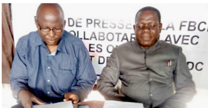
Le président de la FBCP et son collègue, lors d'un point de presse sur le monitoring dans les prisons du pays