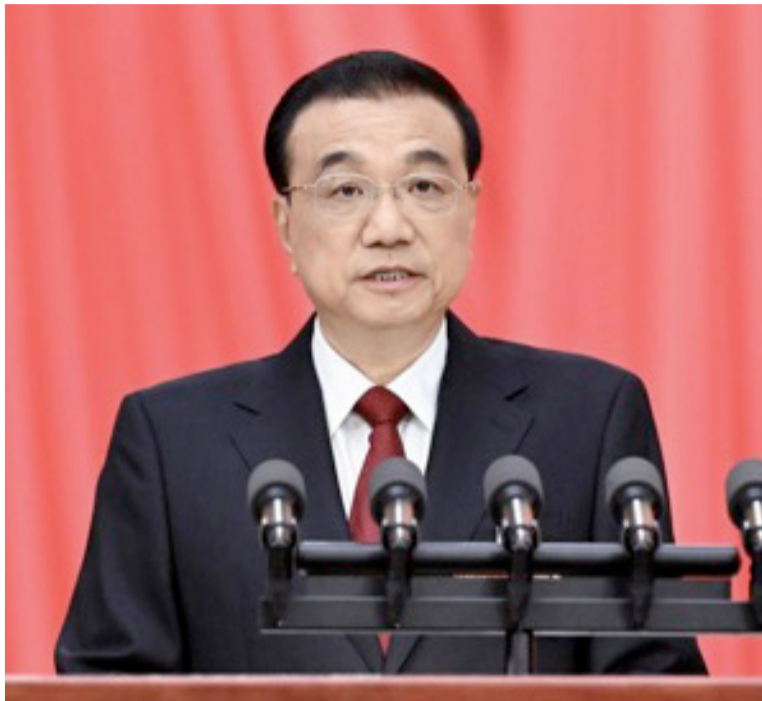
Li Keqiang, Premier ministre du Conseil des affaires d'État, intervenant à l'ouverture de la 14e APNDR

Outre le volet écologique, Li Keqiang a fait mention d'autres secteurs qui constitueront la priorité du gouvernement lors du prochain quinquennat. Il s'agit de faire de plus grands efforts pour accroître la demande intérieure ; accélérer la mise en place d'un système industriel moderne ; mettre réellement en œuvre le principe dit « consolider et développer sans relâche l'économie publique, encourager, soutenir et orienter avec détermination le développement de l'économie non publique » ; introduire et utiliser davantage d'investissements étrangers en élargissant notamment l'accès au marché et