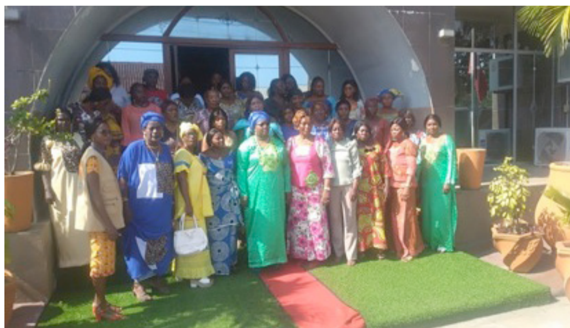
La photo de famille lors de la sortie officielle de l'AFD/Adiac

Composé d'une dizaine de membres, le bureau de l'AFD a été présenté à l'assistance et