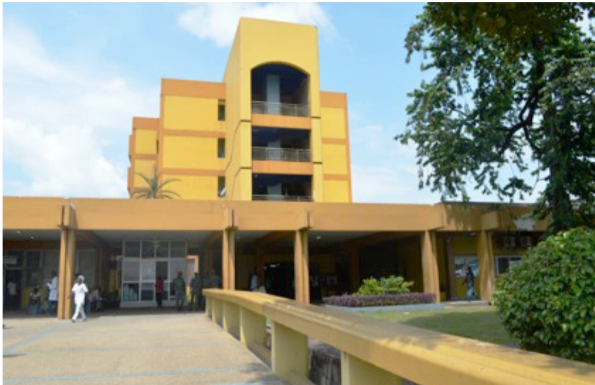
Une vue extérieure du CHU de Brazzaville

La commission à mettre sur pied a pour mission de mener officiellement au CHU de Brazzaville une enquête pour collecter