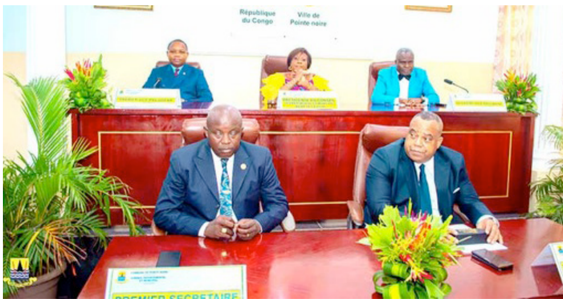
Le présidium des travaux

Il faut dire que la tenue régulière des sessions constitue le baromètre permettant d'évaluer la vitalité d'un Conseil et par la même occasion sa bonne marche. C'est