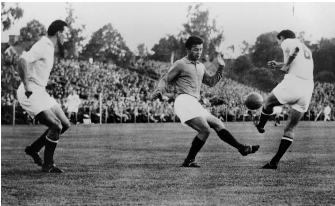
Le buteur français reste détenteur du record de buts inscrits lors d'une Coupe du monde: 13 lors de l'édition 1958, dont un doublé contre la Yougoslavie à Vasteras le 11 juin 1958