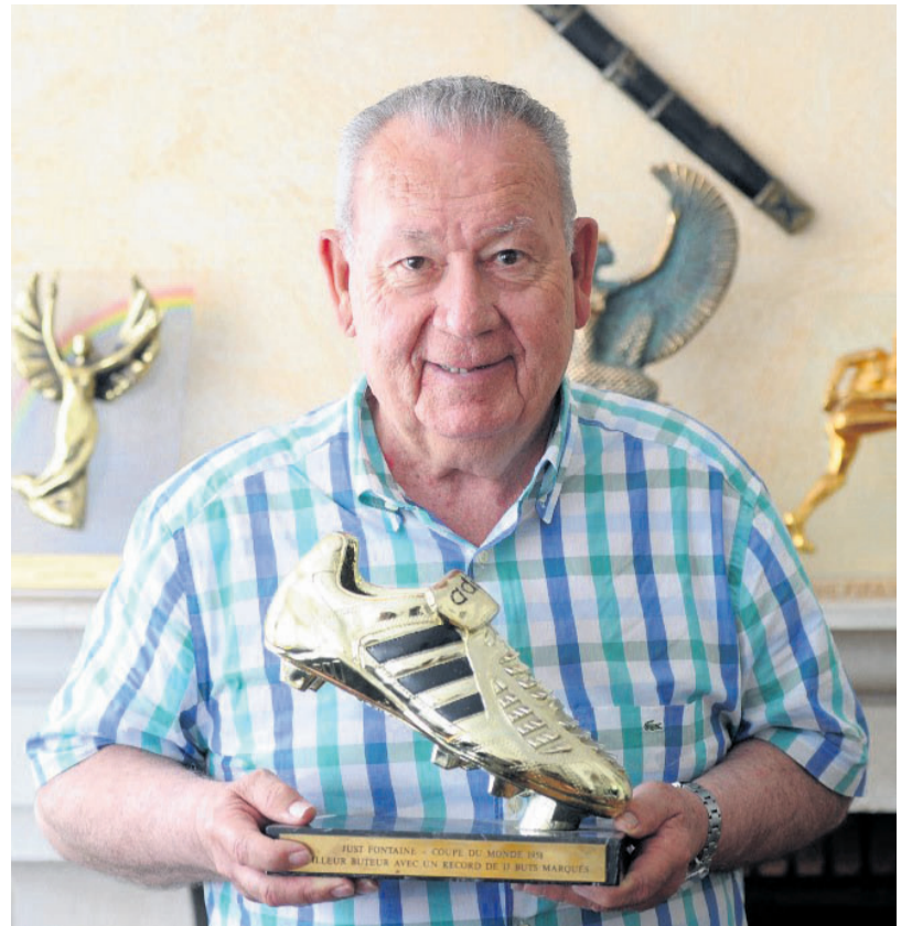
Just Fontaine et son trophée de meilleur buteur du Mondial 1958, chez lui en juillet 2013

Il a signé un triplé au premier tour lors de la victoire de la France 7-3 face au Paraguay. Il inscrit les seuls buts français (2-3) face à la Yougoslavie et participe à la victoire de sa sélection devant l'Ecosse 2-1 en marquant un but. En quarts de