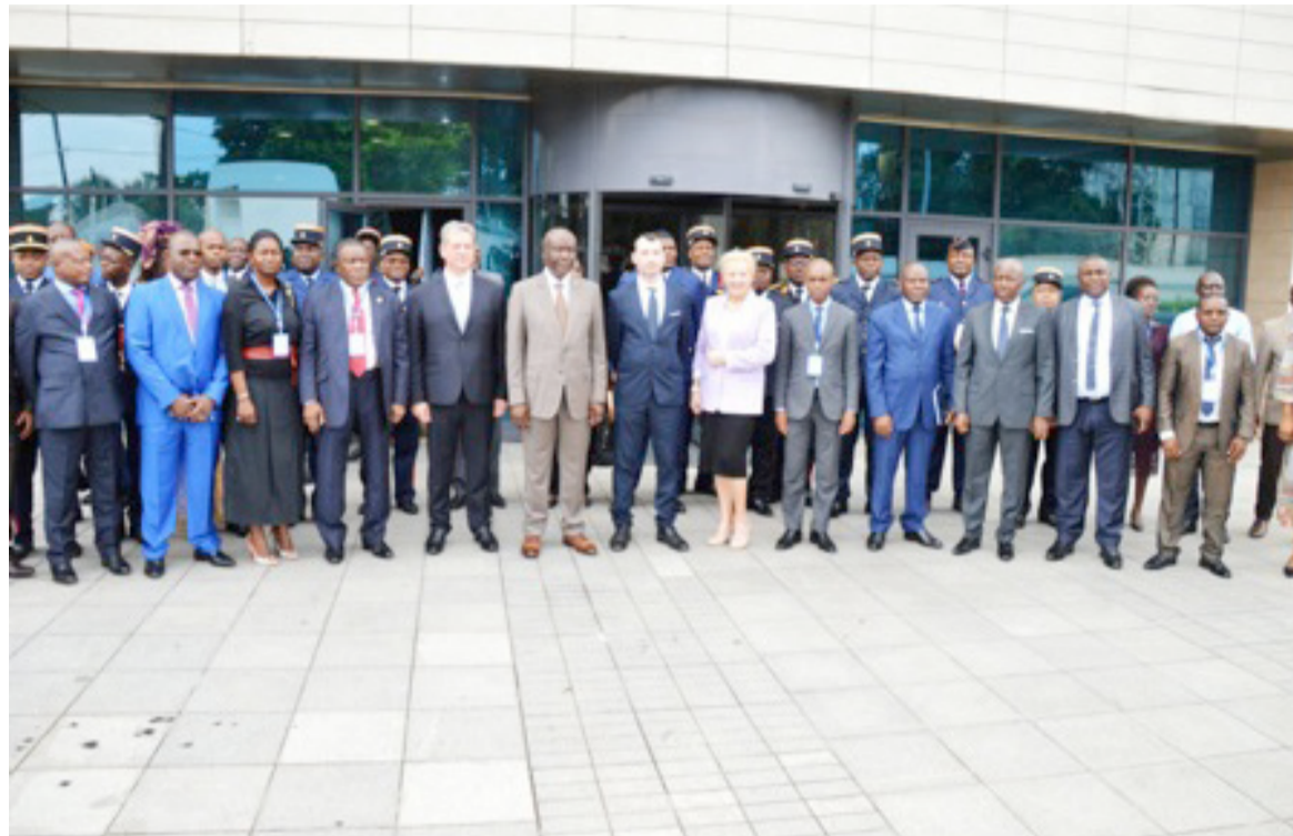
La photo de famille des participants à l'atelier régional

Sensibiliser les douanes de la Communauté économique et monétaire de l'Afrique centrale (Cémac) aux nouvelles exigences (79 et 333) du code des douanes communautaires relatives à l'exonération sous condition de destination particulière, appuyer les douanes de la Cémac à développer et consolider les instruments de mise en place de l'union, assister les douanes de la communauté d'Afrique de l'Est (Burundi et République démocratique du Congo) font également partie de cet atelier