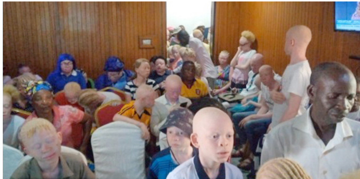
Des personnes atteintes d'albinisme/AJCA