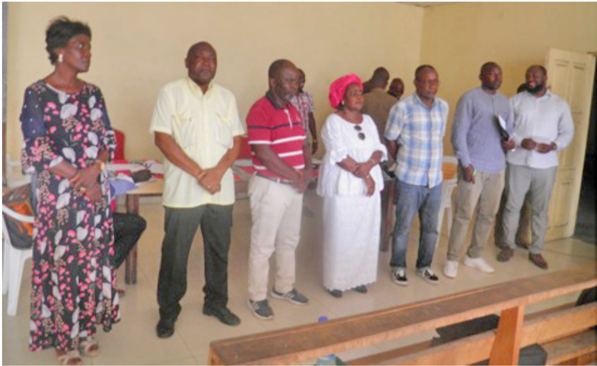
Vue des membres du bureau

« Je suis sportif et j'aime la gagne. Le sport c'est notre vie, ça nous permet d'être en bonne santé dans le milieu professionnel, c'est une source d'énergie. Bien que parents, nous devons nous donner un peu de temps pour le sport. Je suis jeune et dynamique, je vais travailler avec tous ceux qui veulent travailler, car seul on ne peut rien faire. Soyons ouverts les uns envers les autres et prônons ensemble le dialogue pour avancer »