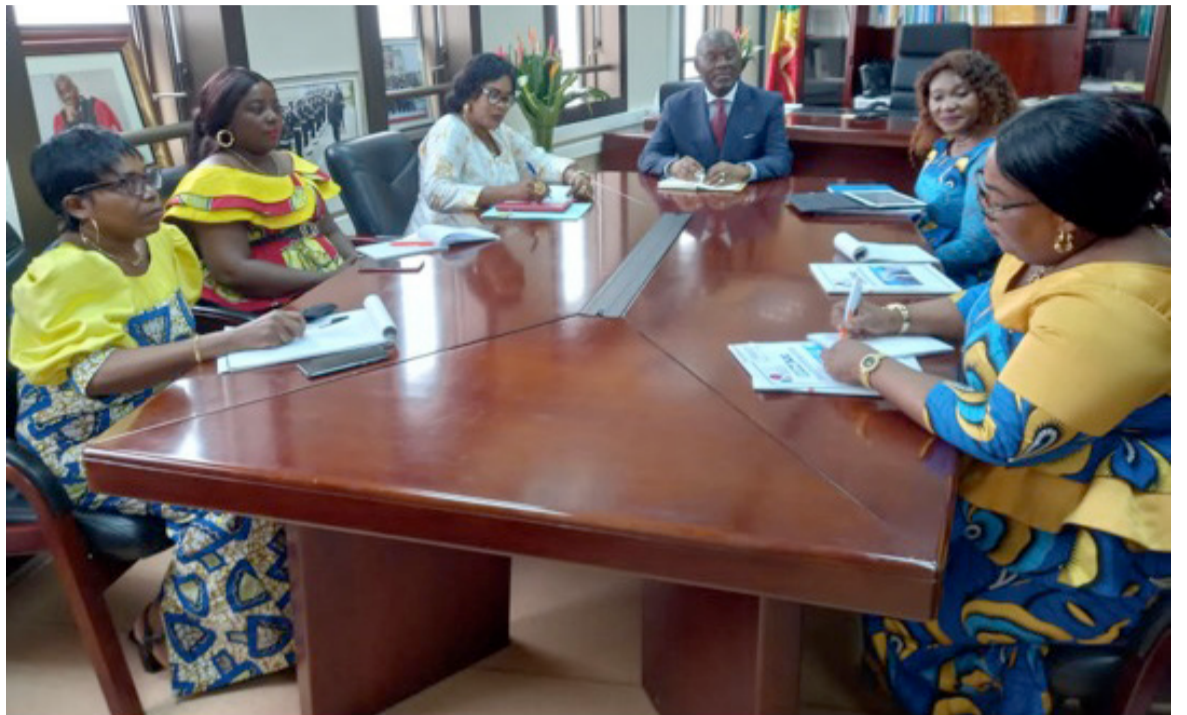
Le Réseau des femmes échangeant avec le secrétaire permanent du comité interministériel de l'action de l'Etat en mer

Les défis au sein du Secrétariat permanent ont été également évoqués, notamment le prochain atelier régional qui sera organisé en partenariat avec l'Office des Nations unies contre la drogue et la criminalité, les 22 et 23 mars à Brazzaville. Cette initiative vise la législation congolaise qui a montré ses limites en ce qui concerne le jugement des pirates en haute mer. D'où la nécessité pour le Congo d'atteindre la compétence universelle. Il y a également la réunion du Comité interministériel de l'action de l'Etat en mer et dans les eaux continentales dans les prochaines semaines. Laquelle réunion aura pour toile de fond