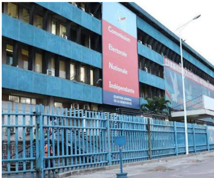
Le siège de la Céni à Kinshasa