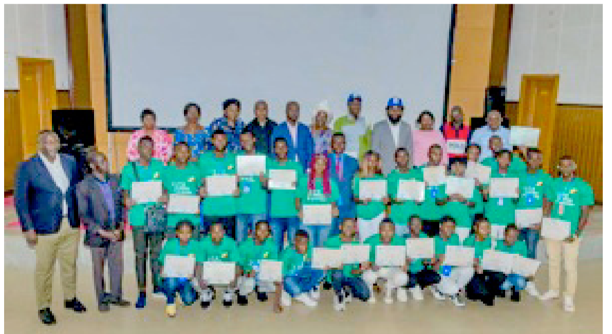
Les jeunes formés en langue anglaise

La plateforme ILTG est une association socio-culturelle et éducative composée essentiellement de jeunes congolais formés en Afrique du Sud. A travers des initiatives diverses dans le cadre éducatif et socio-pro-