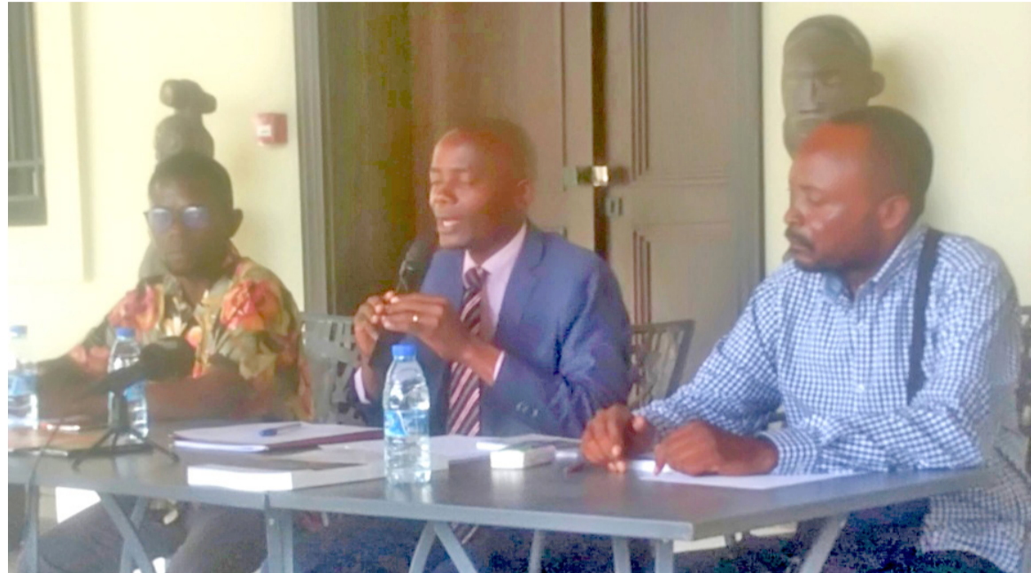
La tribune lors de la réunion de l'IIT Congo/Adiac

« En présentant l'anthologie des auteurs congolais