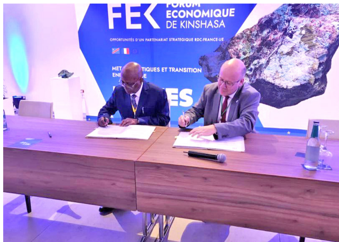
La signature du protocole d'accord