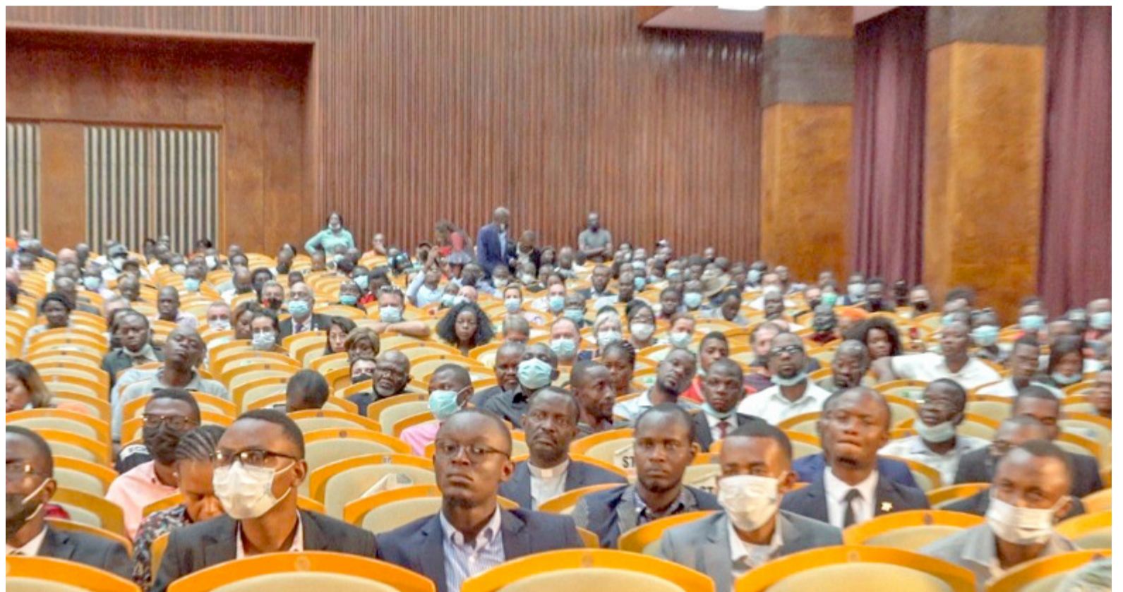
Le dernier ciné-débat de «L'empire du silence» à la cathédrale Notre-Dame du Congo, organisé au Palais du peuple en octobre 2021

Plusieurs de ceux qui ont vu le film lors de ses projections précédentes au Palais du peuple, puis au Centre Wallonie-Bruxelles, avaient souhaité sa projection en cité. Les enjeux politiques du moment, avec les élections qui pointent à l'horizon, laissent croire que la vue de «L'empire du silence» ne sera pas sans conséquence. Le moins que l'on puisse dire, c'est que la présence de Denis Mukwege, pressenti ou du moins jusqu'ici souhaité comme candidat président, va rajouter à l'intérêt qu'on va lui porter.