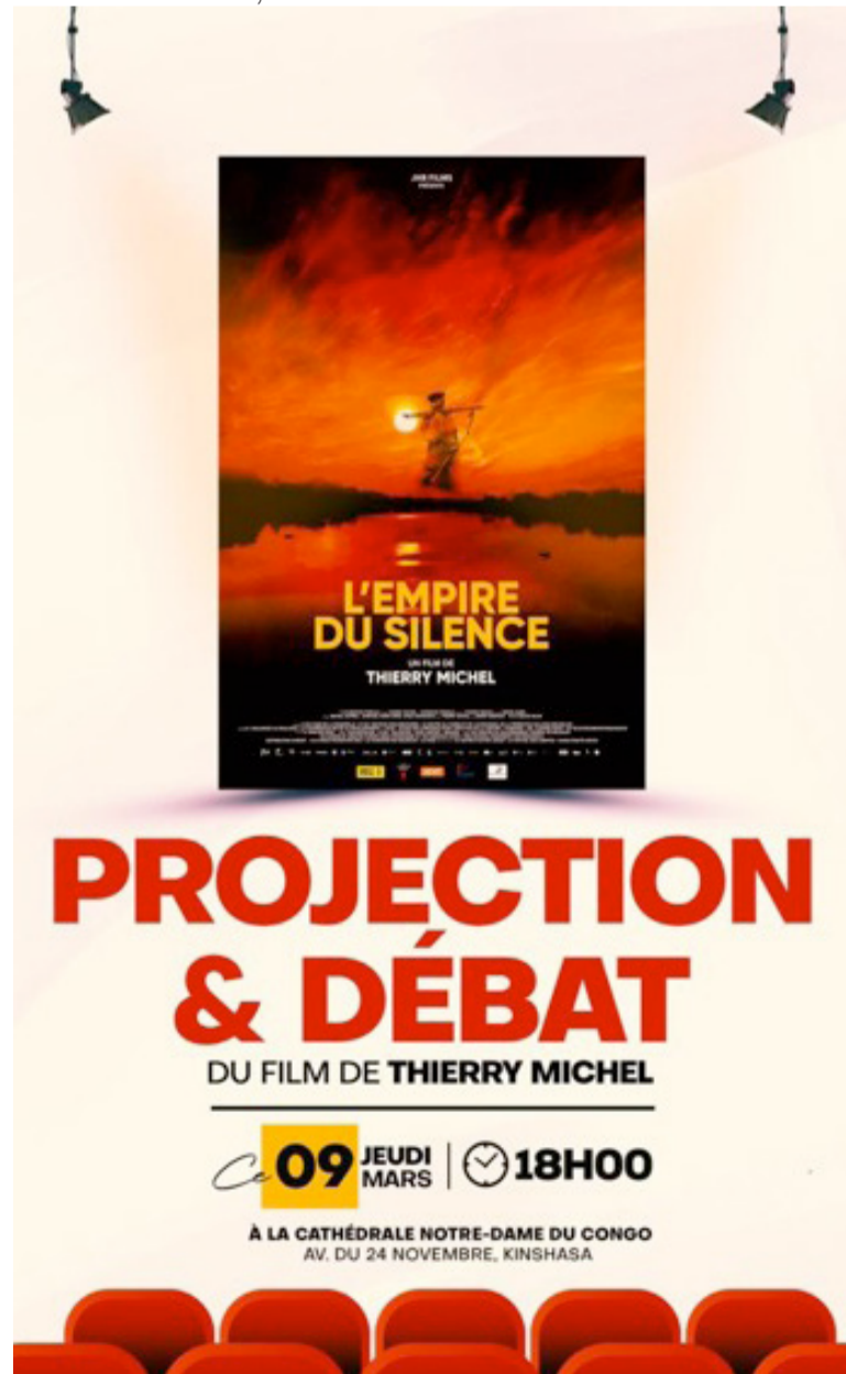
Ciné-débat autour de «L'empire du silence» à la cathédrale Notre-Dame du Congo