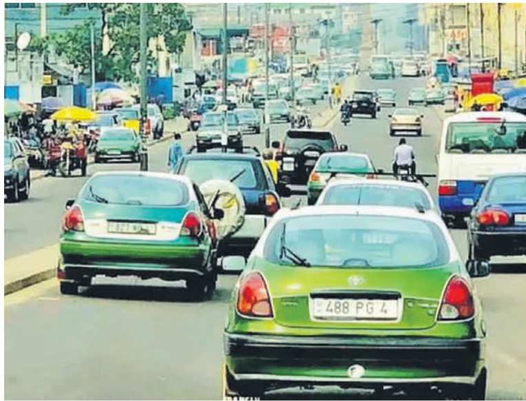
Une vue de la circulation à Brazzaville

« Cette année, la DGTT va devoir se déployer sur l'ensemble du territoire national. Nous allons prendre notre temps avant de démarrer cette opération parce que ces recettes doivent avant tout être sécurisées au risque de travailler au profit des individus », a expliqué le DGTT. Les nouvelles dispositions de la DGTT s'inscrivent dans le cadre des modifications des dispositions relatives aux droits, taxes, redevances et