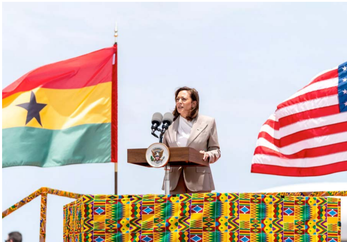
La vice-présidente des États-Unis, Kamala Harris, au Ghana

Tanzanie et la Zambie. Depuis l'arrivée de Joe Biden à la tête de la plus puissante économie du monde, le continent africain est redevenu une priorité pour la diplomatie américaine. Sous le règne de Donald Trump, l'Afrique a été largement ignorée et considérée par Washington comme une zone problématique. Un choix que la nouvelle administration veut gommer pour se tenir aux côtés du continent africain face à ces défis comme partenaire privilégié. «Le président Biden et moi-même avons clairement établi que les États-Unis renforcent leurs partenariats sur l'ensemble du continent africain et que nous ne sommes pas guidés par ce que nous pouvons faire pour l'Afrique, mais par ce que nous pouvons faire avec l'Afrique et nos partenaires africains sur