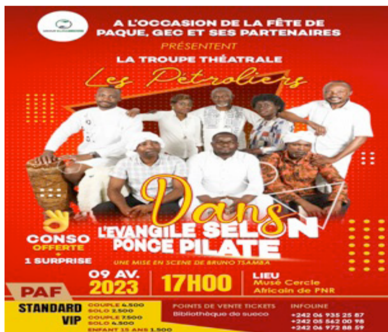
L'affiche du spectacle de la troupe théâtrale «Les Pétroliers»

La troupe théâtrale «Les pétroliers» jouera, le 9 avril, au musée Cercle africain, la pièce «L'évangile selon Ponce Pilate», en ouverture de son année culturelle.