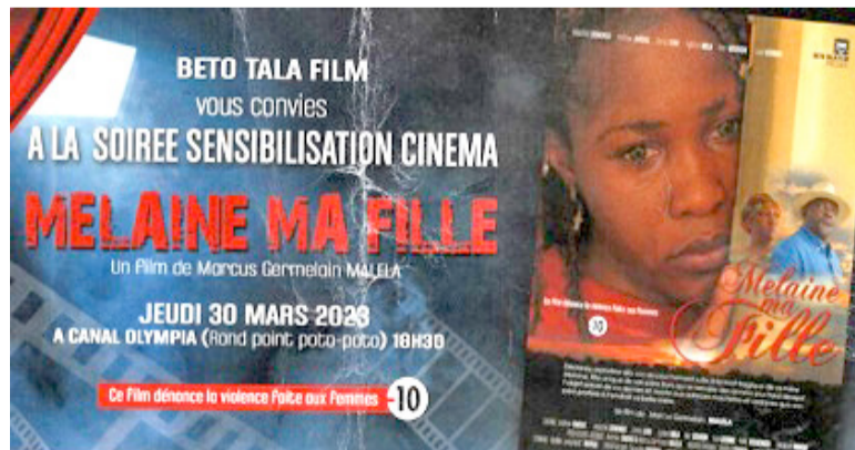
L'affiche du film « Melaine ma fille »

« Melaine ma fille » sera projeté le 30 mars par Beto tala film à Canal Olympia, au rond-point de Poto-Poto, dans le troisième arrondissement de Brazzaville. Le film dénonce les violences faites aux femmes.