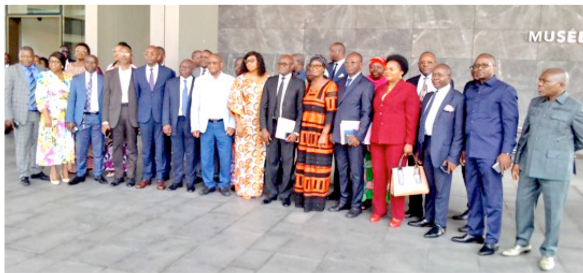
La photo de famille des participants à l'atelier

Il s'agit donc, au cours de cet atelier qui réunit une quarantaine de participants, d'identifier des éléments du référentiel à corriger, d'y apporter les modifications, de concevoir les états de restitution des données du référentiel, enfin,