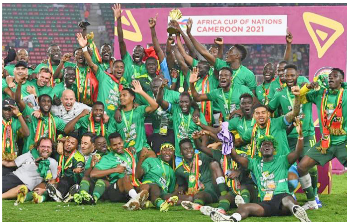
Les Lions de la Teranga remettent leur titre en jeu en Côte d'Ivoire

Dans un groupe K à trois, le Maroc, demi-finaliste de la Coupe du monde, était la première sélection à se qualifier à la CAN. Les Lions de l'Atlas ont respectivement battu l'Afrique du