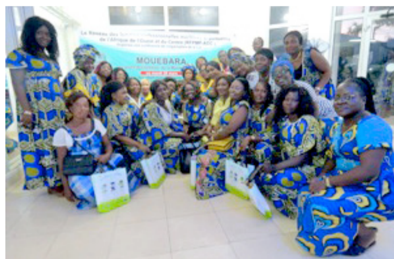
La photo de famille après la rencontre

S'appuyant pour sa part sur les violences faites en milieu professionnel formulées dans cette loi, la coordonnatrice du point focal Congo du RFPMP-AOC a expliqué que la vision de ce réseau est d'être une force motrice d'émancipation et de promotion des carrières professionnelles des femmes dans le secteur maritime et portuaire congolais. « L'objectif principal du