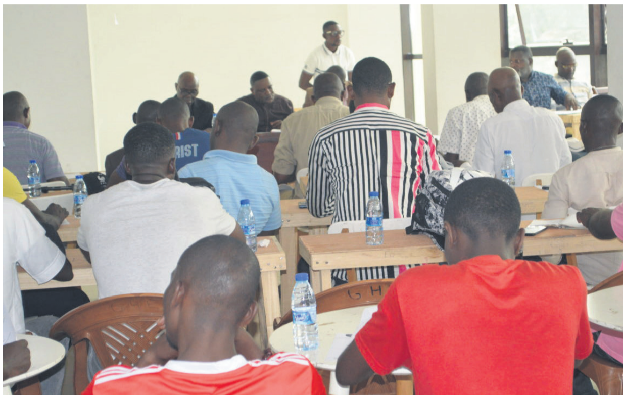
Une vue de la salle lors de l'assemblée générale Adiac

Le président de la Fécoboxe, Gaétan Nkodia, a salué le dynamisme et l'engagement des conseillers fédéraux dans la mise en place des initiatives salvatrices. « J'ai pu me