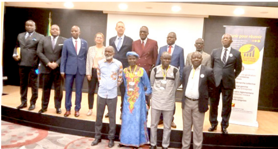
<Sans données à partir du lien>

Tout comme ses collègues responsables des clusters, la vice-présidente du CFAB sollicite un accompagnement supplémentaire du PRCCE II, notamment du principal bailleur qui est l'Union européenne (UE). Il s'agit de former les producteurs aux nouvelles techniques de production et