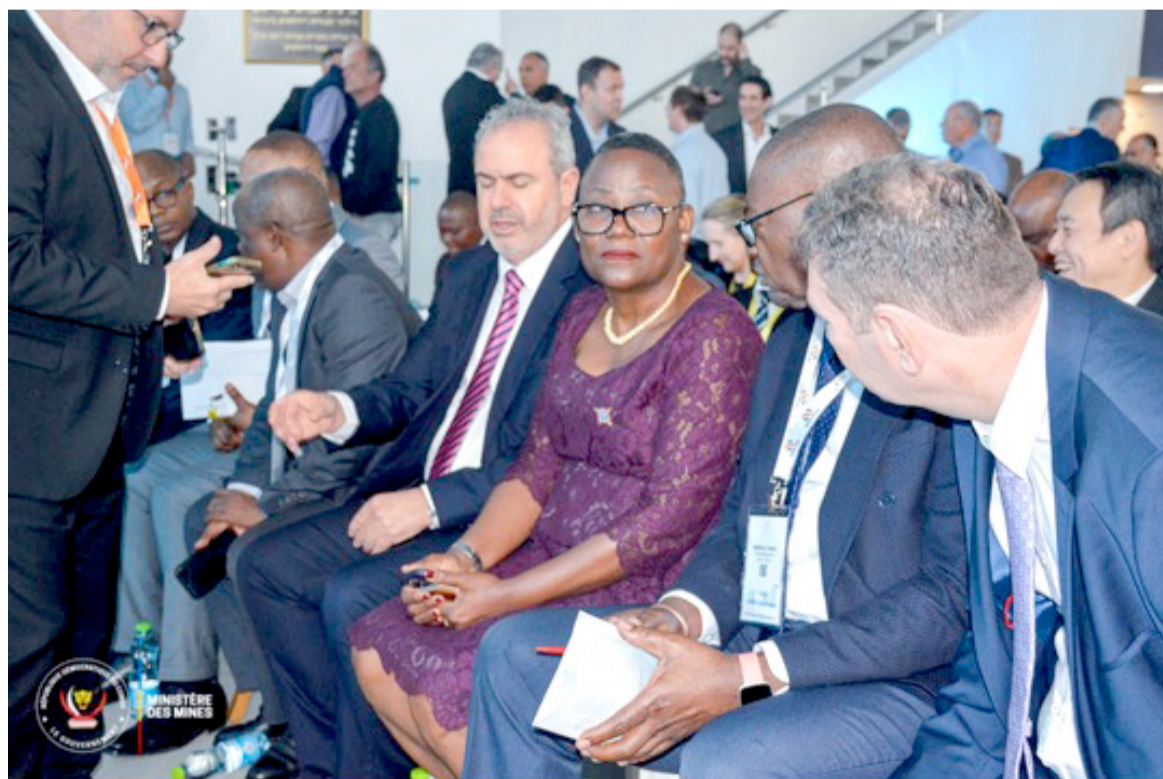
La ministre Antoinette N'Samba Kalambayi à la cérémonie d'ouverture

à la pandémie de la covid-19, la conférence des présidents de quarante bourses du monde et le lancement d'une nouvelle usine de transformation des diamants de Tel-Aviv. Signalons que près de mille participants prennent part au 40 e congrès mondial du diamant dont le lancement a eu lieu dans le centre d'exposition et de traitement des diamants bruts, en présence de nombreux professionnels des diamants parmi lesquels les exposants, les vendeurs et les conférenciers venus de la Chine, des États-Unis d'Amérique, du Brésil, de la France, de la Belgique, des Emirats arabes unis, de l'Inde