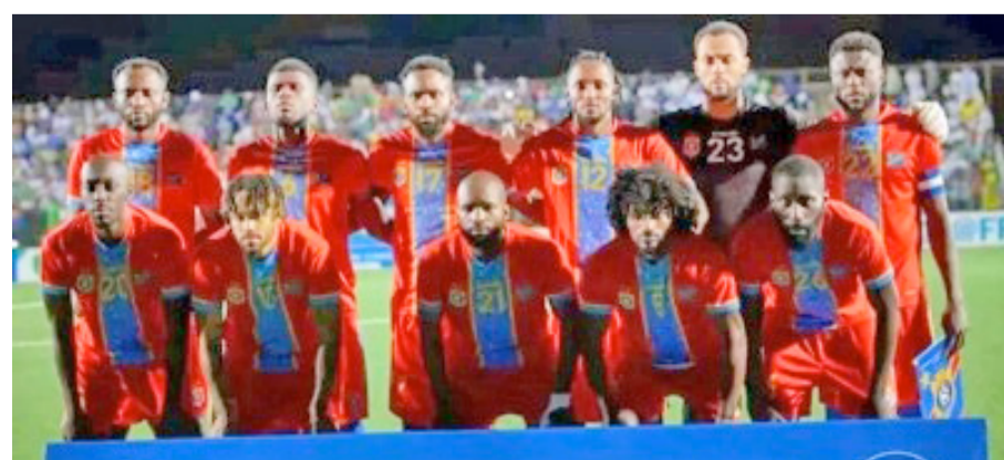
Les Léopards de la RDC avant le coup d'envoi du match contre les Mourabitounes de Mauritanie à Nouakchott