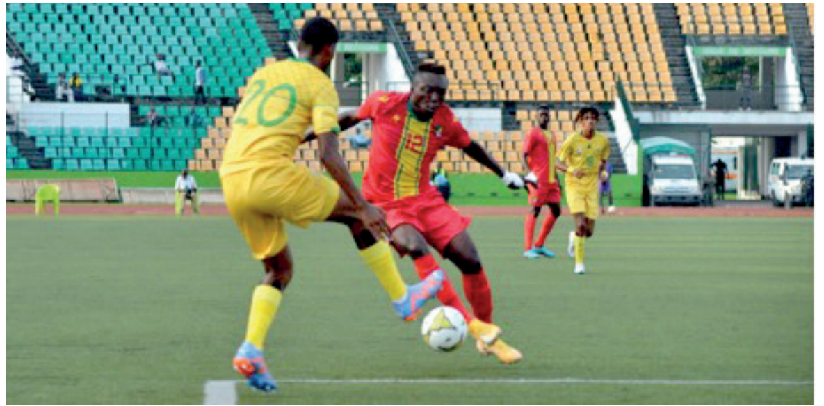
Le Congo éliminant l'Afrique du Sud/Adiac

Le Congo, l'Égypte, le Gabon, le Ghana, la Guinée, le Mali et le Niger ont rejoint le Maroc, pays organisateur de la Coupe d'Afrique des nations (CAN) des moins de 23 ans, à l'issue du dernier tour des éliminatoires.