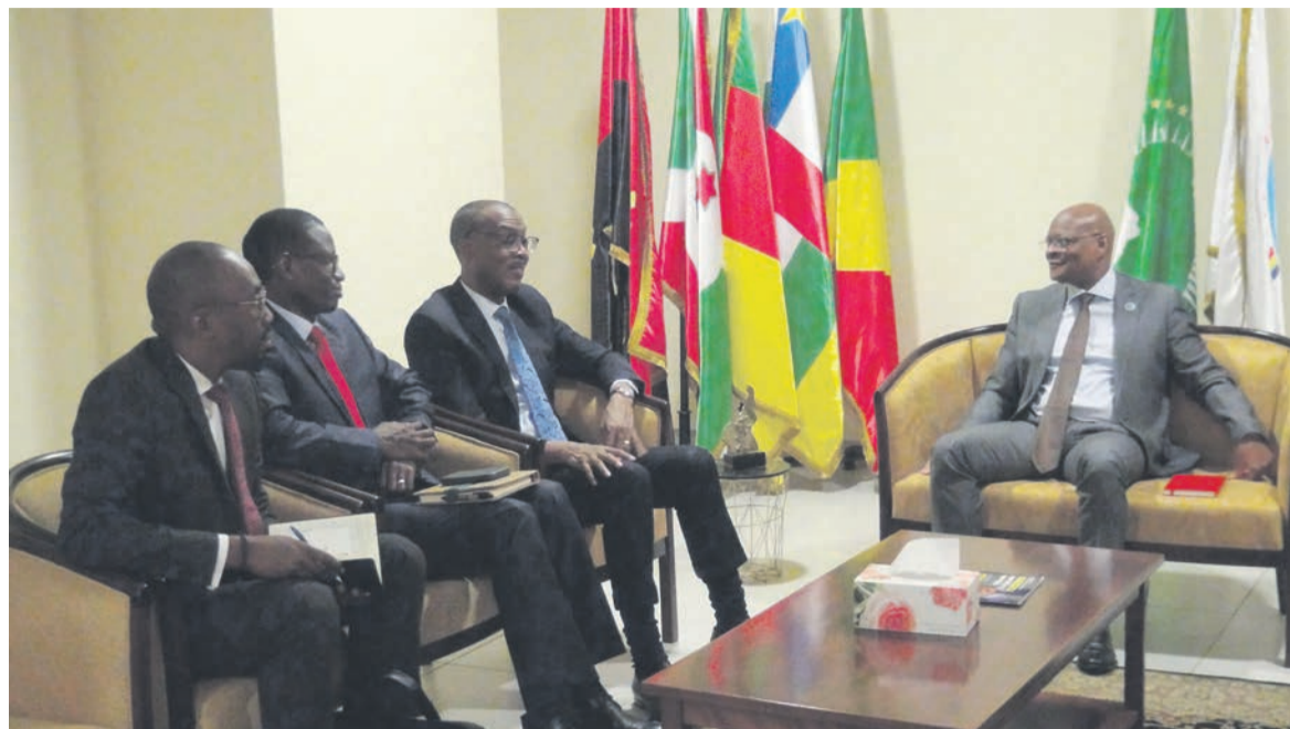
Une vue de l'audience entre le Directeur Général de la BAD et le Président de la Commission de la CEEAC

Abordant les questions des infrastructures de transports, le président de la Commission de la CEEAC a annoncé la tenue d'un prochain sommet des chefs d'Etat, au cours duquel un état des lieux sur les infrastructures en lien avec le Plan directeur consensuel des transports en Afrique centrale sera fait et de nouvelles orientations seront données pour relancer les projets bancables en vue de sauver ce qui peut encore l'être de ce Plan qui bat de l'aile depuis sa création en 2002, « avec son lot d'exi-