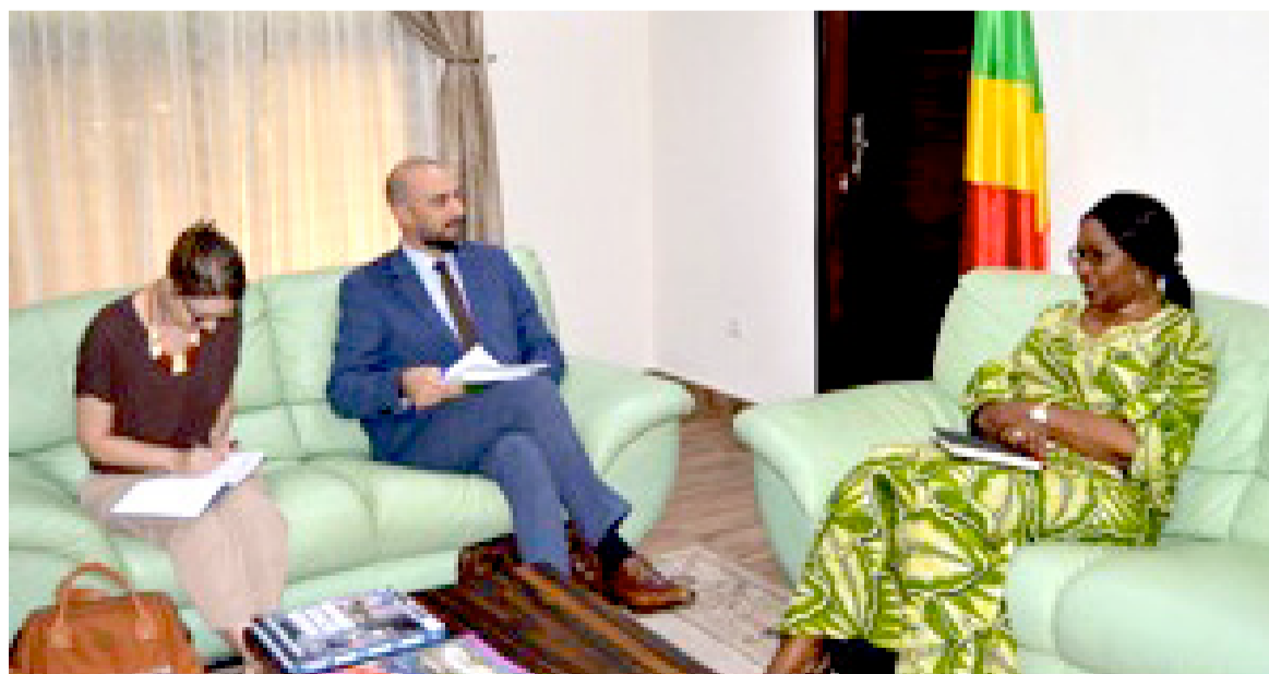
La ministre échangeant avec le directeur de l'AFD

Il convient de rappeler qu'en janvier 2023, dans une communication à l'endroit de la communauté universitaire, la ministre Delphine Edith Emmanuel avait annoncé des perspectives pour l'année en cours. Lesquelles perspectives consistent, entre autres,