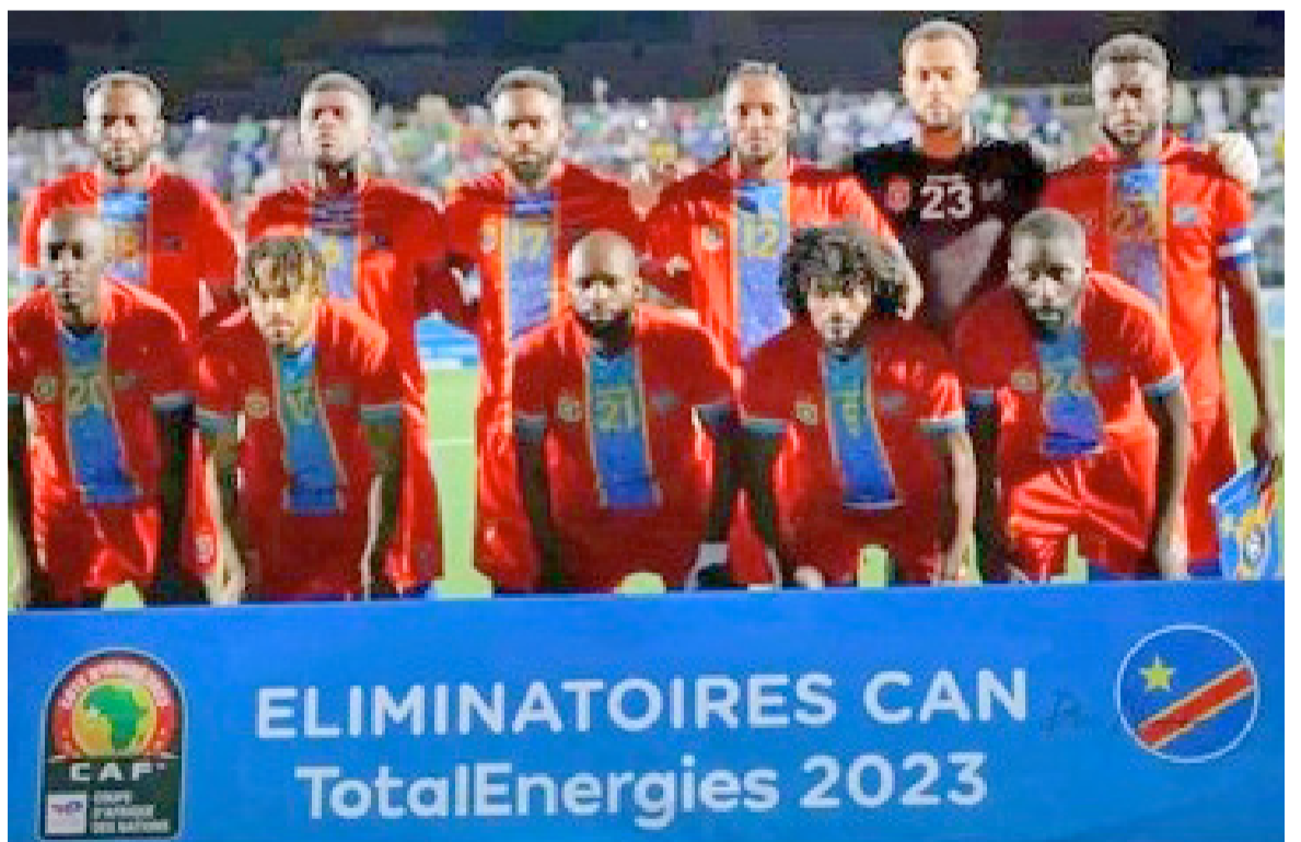
Les Léopards de la RDC avant le coup d'envoi du match contre les Mourabitounes de Mauritanie à Nouakchott