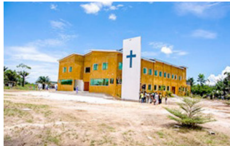
Une vue du temple de l'Eglise évangélique à Yanga

La paroisse évangélique de Bilala, dans le district de Madingo-Kayes, compte désormais un nouveau temple.