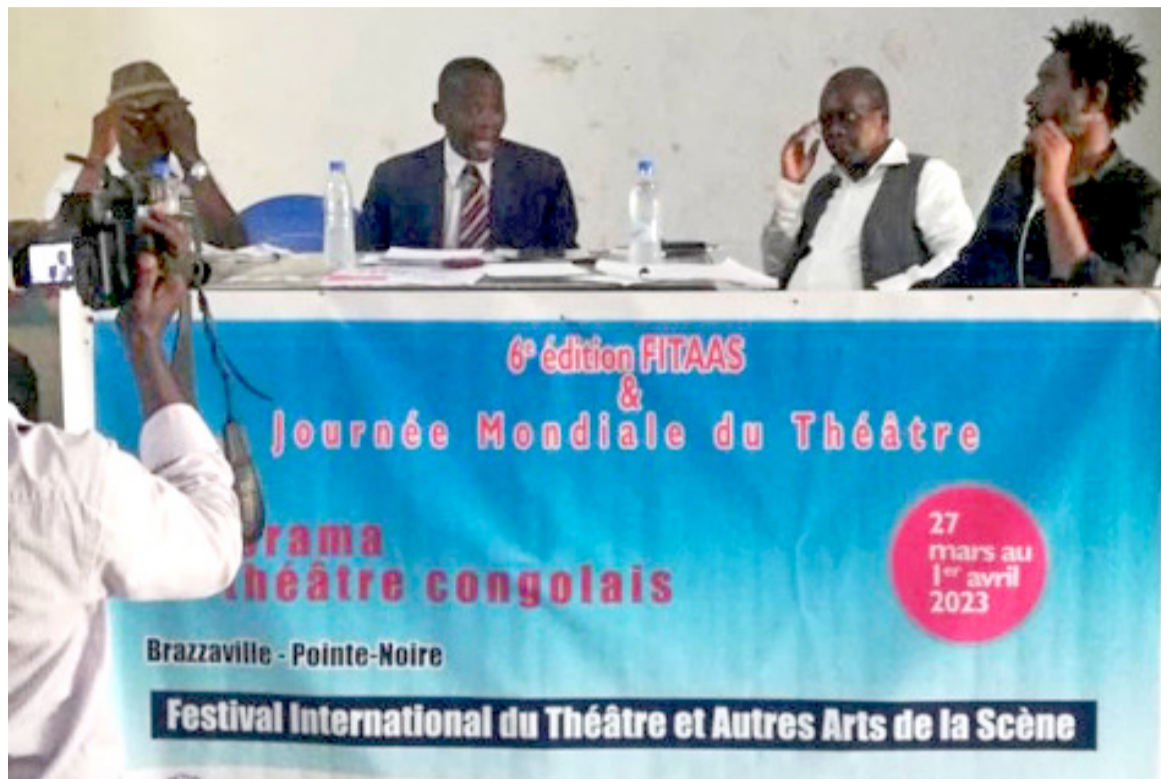
Vue de la tribune lors du lancement de la 6e édition du Fitaas

ce site, le festival prévoit un atelier de formation des comédiens, une animation