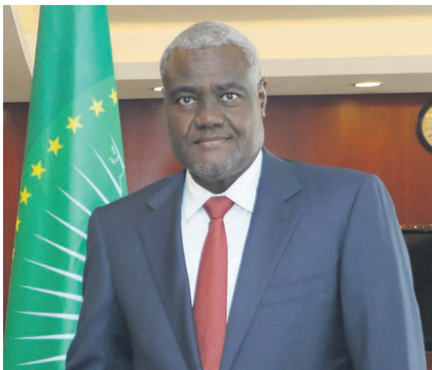
Moussa Faki Mahamat

Moussa Faki Mahamat « a exprimé sa profonde inquiétude à propos de la violence qui a provoqué un décès, entraîné des dégâts matériels et interrompu certaines ac-