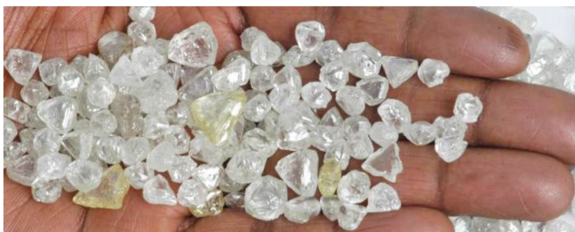
Le diamant au cœur des échanges à Tel-Aviv

Le quarantième congrès mondial du diamant a ouvert ses travaux, le 28 mars, dans la salle Israël Diamond Exchange