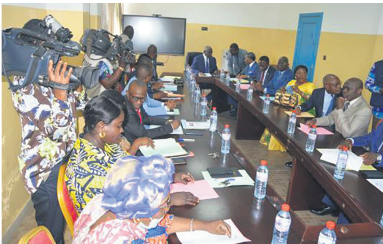
Une vue des membres de la commission d'enquête parlementaire

Celle-ci a aussi la responsabilité de déterminer le mécanisme de contrôle de mise en œuvre des mesures correctives et doit produire un rapport d'enquête à soumettre au gouvernement en vue de trouver des solutions idoines aux dysfonctionnements constatés dans ce centre hospitalier.