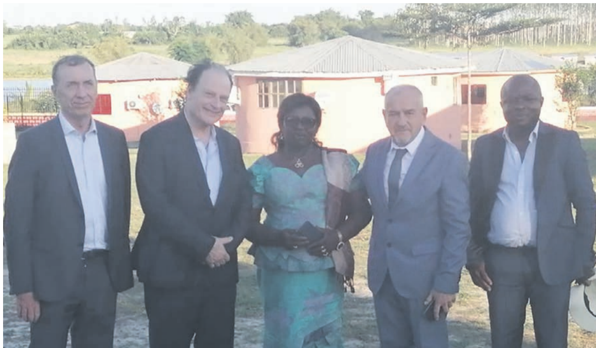
Photo de groupe à l'issue d'une séance de travail entre EBS, le maire de Madingo-Kayes et le Premier ministre, Anatole Collinet Makosso, le 25 mars 2023

Pour cette problématique de développement durable, Anne-Marthe Nombo, maire de la communauté urbaine de Madingo-Kayes, a amorcé une série de consultations avec EBS, représentée par son président, Alain Arnaud, qui permettront par la suite d'établir un partenariat dans la sous-région favorable aux sous-produits de la forêt non utilisés par l'industrie de la première transformation, par exemple le sciage, et, l'indus-