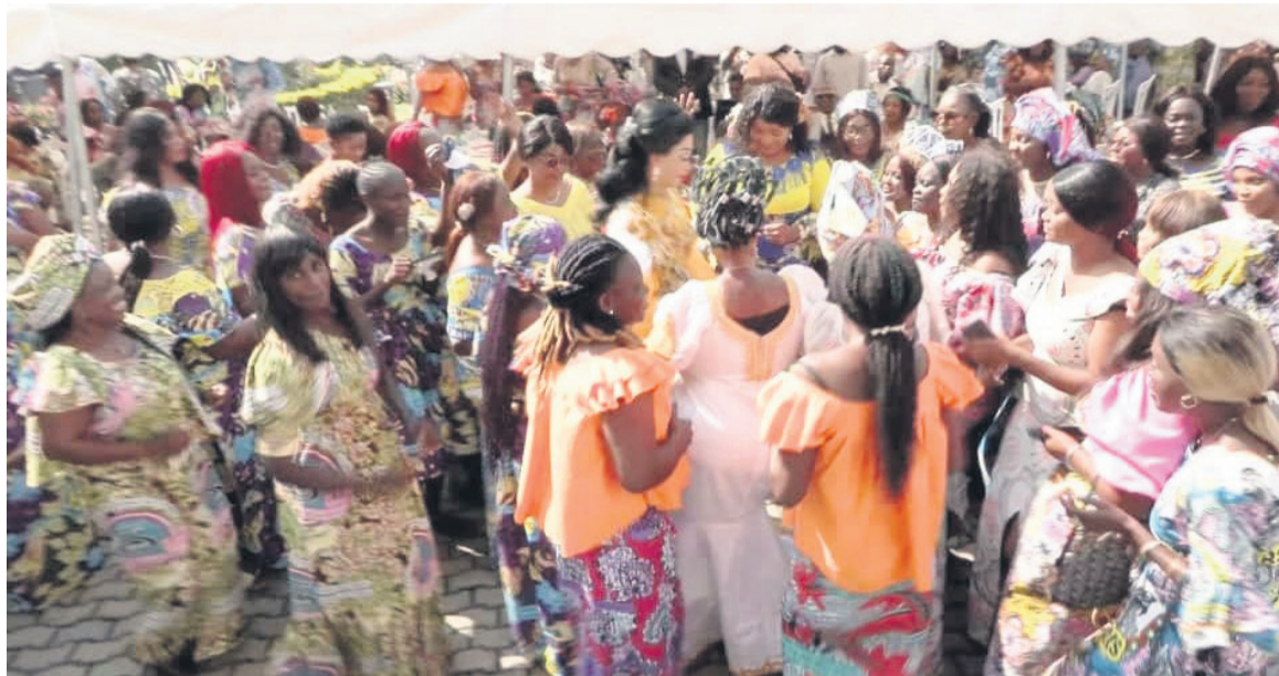
Les femmes en joie sous la musique de Diane Moucayot/DR

« Vous ne pouvez imaginer la joie immense qui m'inonde de vous accueillir ici, au mémorial Pierre-Savorgnan-de-Brazza. C'est une fierté pour moi. J'ai voulu que les dames des quatre circonscriptions de Makélékélé soient là, qu'on puisse se retrouver au moment où nous clôturons le mois de mars ..., pour non