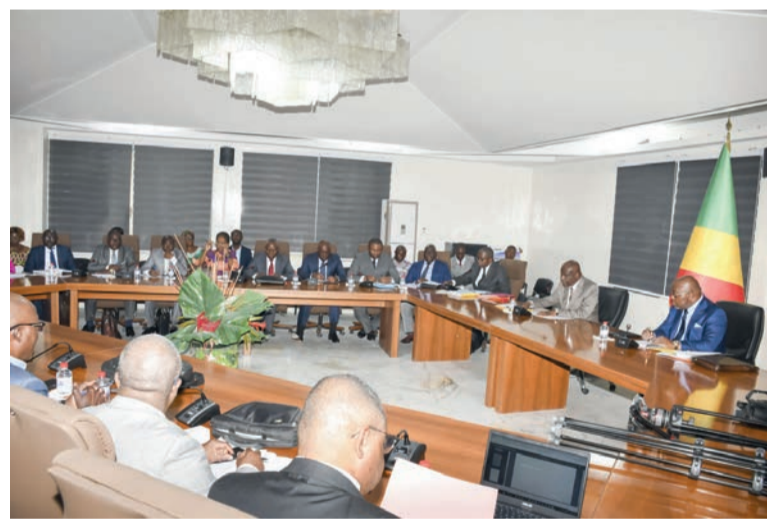
Vue de la salle lors de la première session de l'ITIE

Le comité national de l'Initiative pour la transparence dans les industries extractives (ITIE) a procédé, le 30 mars dernier à Brazzaville, à l'adoption d'un plan de travail 2023-2025. Ce nouveau cadre comporte des mesures correctives relevées lors de la troisième validation de la République du Congo par le conseil d'administration de l'ITIE international. Au nombre des mesures figurent le renforcement de la transparence dans la gouvernance des secteurs extractifs et forestiers, la relance de la mise