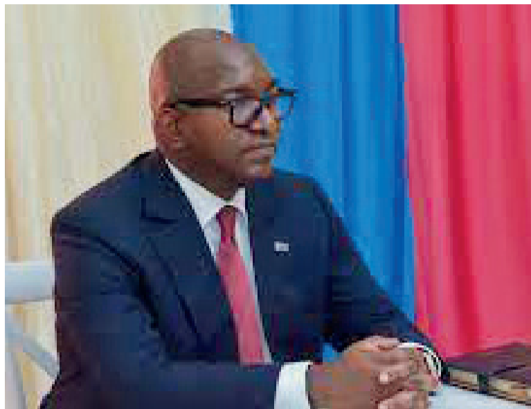
Le Premier ministre Sama Lukonde

nistre Peter Kazadi Kankonde, qui a fait le point à la presse, il était question pour le chef du gouvernement de présenter à l'assistance un certain nombre d'informations à mettre à la disposition des députés nationaux membres de la Commission défense et sécurité de l'Assemblée nationale.