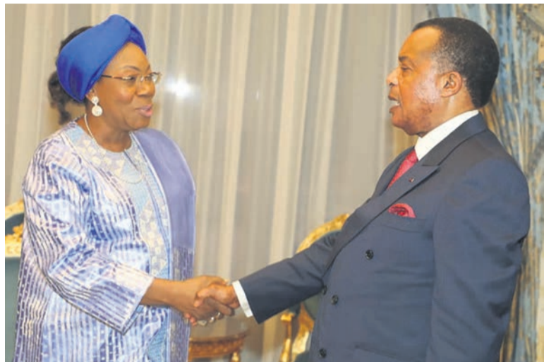
Le président Denis Sassou N'Gouesso et Catherine Samba Pandza

L'ancienne présidente de la transition en République centrafricaine, Catherine Samba Pandza, a salué le 31 mars la tenue en terre congolaise de Brazzaville international leader youth forum.