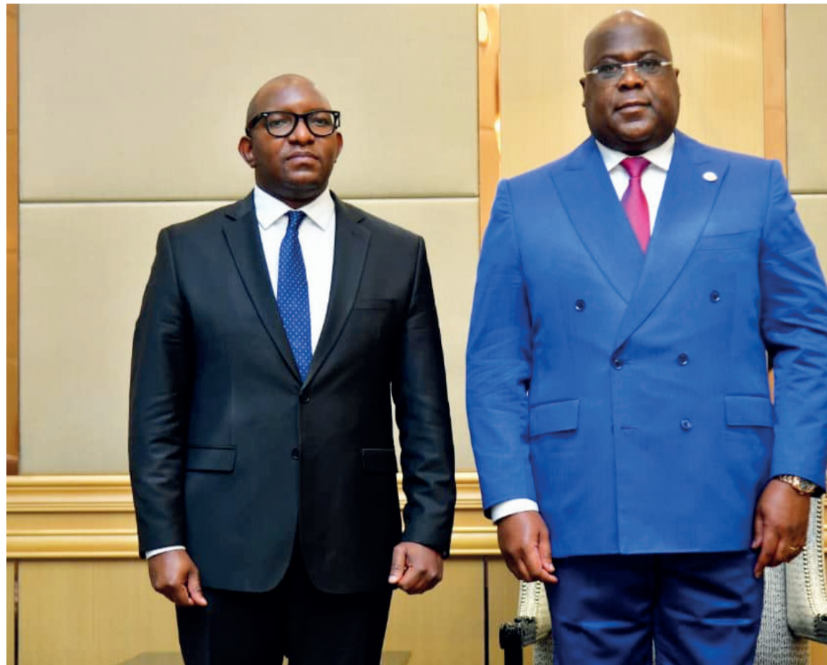
Le Président Félix Tshisekedi, et le Premier ministre, Sama Lukonde

Selon le compte rendu ayant sanctionné ce Conseil, le président de la République a insisté sur l'observance stricte des quatre principes directeurs de l'action de chaque membre de l'exécutif, à savoir la solidarité gouvernementale, le secret des délibérations, la subordination hiérarchique et la collégialité. A cet effet, il a rappelé quelques instruments essentiels sur lesquels se