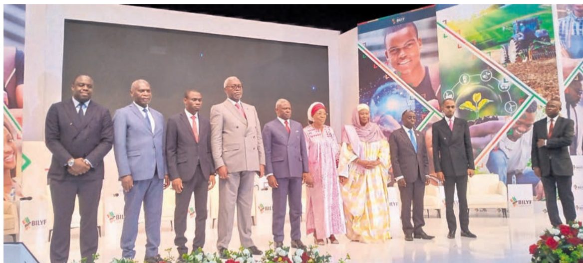
Les officiels à l'ouverture de Bilyf 2023

La première édition de Brazzaville international leadership youth forum (Bilyf) a réuni, les 30 et 31 mars, environ 500 jeunes, des leaders, des innovateurs et célébrités africaines. L'événement a permis aux participants d'échanger autour des défis de développement de l'Afrique et de susciter leur implication.