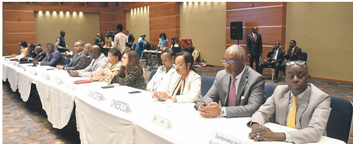
Les partenaires techniques et financiers du CongoPrimate

Insistant sur l'une des thématiques à aborder, le Premier ministre a reconnu que l'émergence d'une conscience nationale est le résultat de nombreux facteurs qui tiennent tant à l'évolution historique qu'aux faits sociologiques et anthropologiques. « Cependant, dans le contexte actuel où la perte de l'éthique fait le lit des antivaleurs dans la société congolaise, il est urgent de réfléchir aux voies et moyens de construire un sentiment fort, collectivement partagé, d'appartenance à une même réalité sociale qui est portée par l'État. Chez nous, la réforme de l'État, d'où sortiront des organes et des mécanismes fédérateurs, est assurément l'instrument politique de construction d'une conscience nationale qui transcende