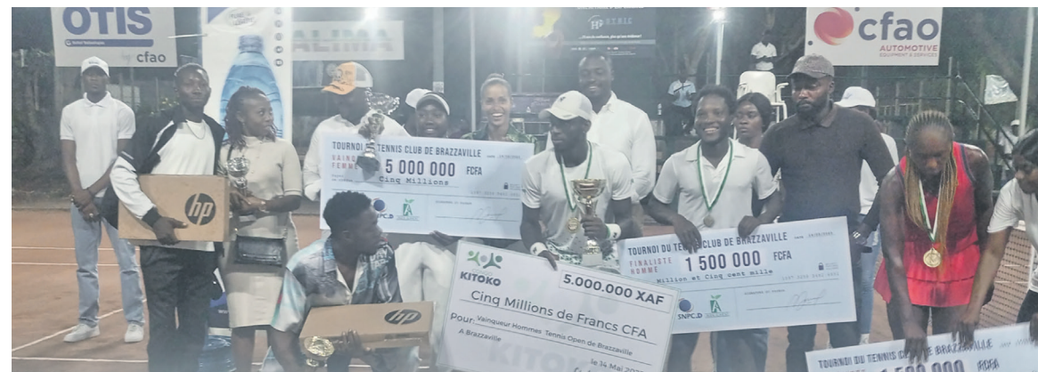
Les officiels avec les gagnants

« Je suis certes jeune mais je pratique ce sport depuis plusieurs années et je me donne à fond afin de sauver l'image de l'Afrique qui n'est pas trop positive dans ce sport. Mon secret réside dans le travail et