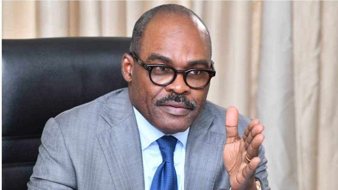
Le ministre des Finances, Nicolas Kazadi

Prise de participation de la RDC Pour l'AFC, les prises de participation du Bénin et de la RDC renforcent la répartition panafricaine de l'actionnariat de la société, qui comprend des gouvernements, des institutions de financement du développement