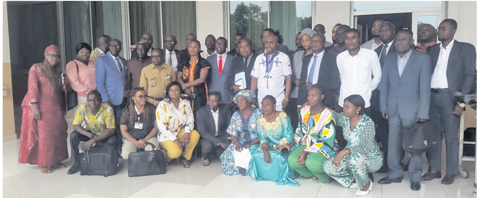
La photo de famille des experts

Au Congo, les MTN ne bénéficient pas d'un financement adéquat et les personnes qui en souffrent payent un lourd