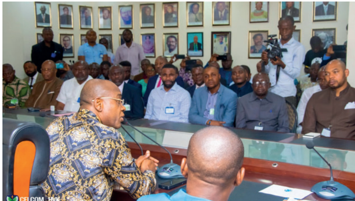
Le gouverneur Gentiny Ngobila lançant la plateforme numérique

Le gouverneur de la ville-province de Kinshasa, Gentiny Ngobila mbaka, a présidé, le 13 mai, dans la salle polyvalente de l'Hôtel de ville, la cérémonie de présentation et de lancement de la plateforme de mobilisation et maximisation des recettes de la ville afin d'assainir les finances.