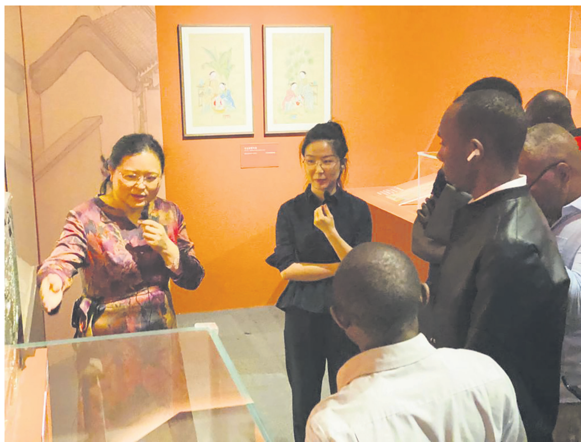
Des journalistes lors de la visite de l'exposition Adiac

La visite de l'exposition a ainsi permis aux journalistes africains et d'autres continents d'en savoir plus sur cette médecine traditionnelle chinoise. Elle regorge, entre autres, de