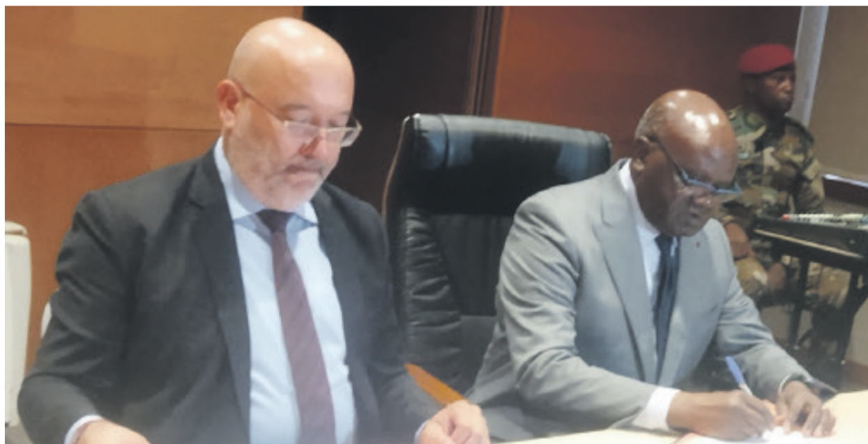
Emile Ouosso (à droite) signant l'accord avec le représentant de la société Hydro opérations SA/Adiac

Le ministère de l'Énergie et de l'Hydraulique, Emile Ouosso, a signé, le 24 mai à Brazzaville, un accord de concession du barrage hydroélectrique du Djoué avec la société Hydro Opérations Djoué SA, un opérateur privé.