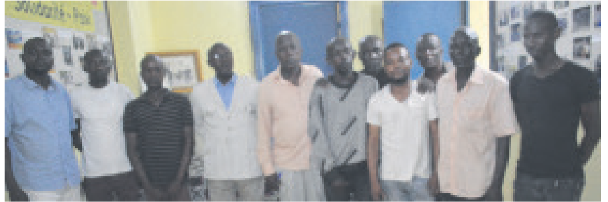
Des membres de l'Acap/Adiac

Les membres de l'Association congolaise d'amitié entre les peuples (Acap) ont organisé, le 24 mai, à Brazzaville, une conférence-débat marquant la célébration du mois de l'amitié entre les peuples, un moment de symbiose qui valorise le vivre-ensemble.