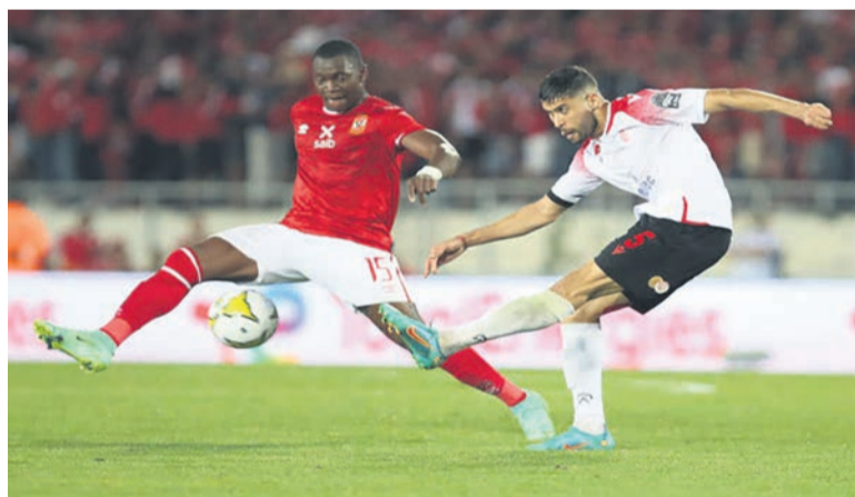
La dernière finale opposant le WAC à Al Ahly/CAF

La finale de la Ligue africaine des champions mettra aux prises, le 4 juin, au Caire, pour le match aller, et le 11 juin, pour le retour à Casablanca, Al Ahly d'Egypte à Wydad Athletic de Casablanca (WAC). Une rencontre aux allures d'une revanche ou d'une confirmation puisque c'est le remake de la dernière finale remportée par les Marocains, 2-0, sur leurs propres installations.