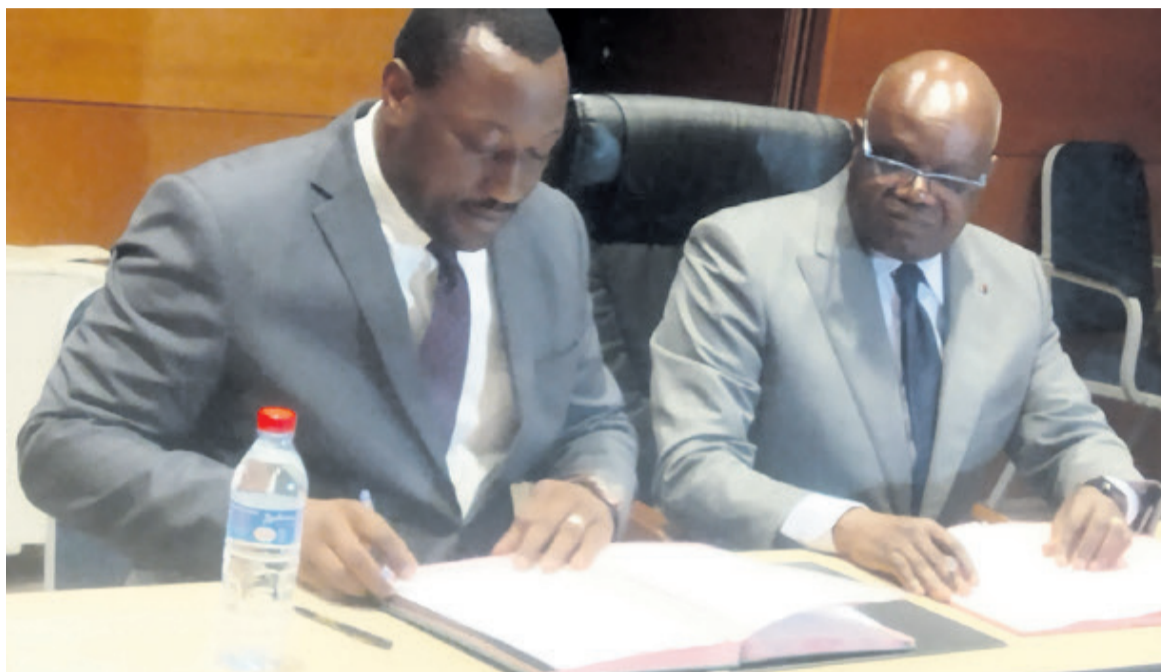
Le ministre de l'Énergie et de l'Hydraulique paraphant l'accord de partenariat avec le responsable de la société Builders/Adiac

« Il s'agit d'une mise en concession et non de la vente de l'infrastructure. Ces avenants concernent la formation du capital de la société avec la participation de l'E2C à 15% afin qu'elle puisse jouer son rôle de société de patrimoine. Dès maintenant, l'entreprise peut commencer les investissements pour que rapidement nous ayons un peu plus de 15 megawatts pour desservir la ville de Brazzaville afin de la