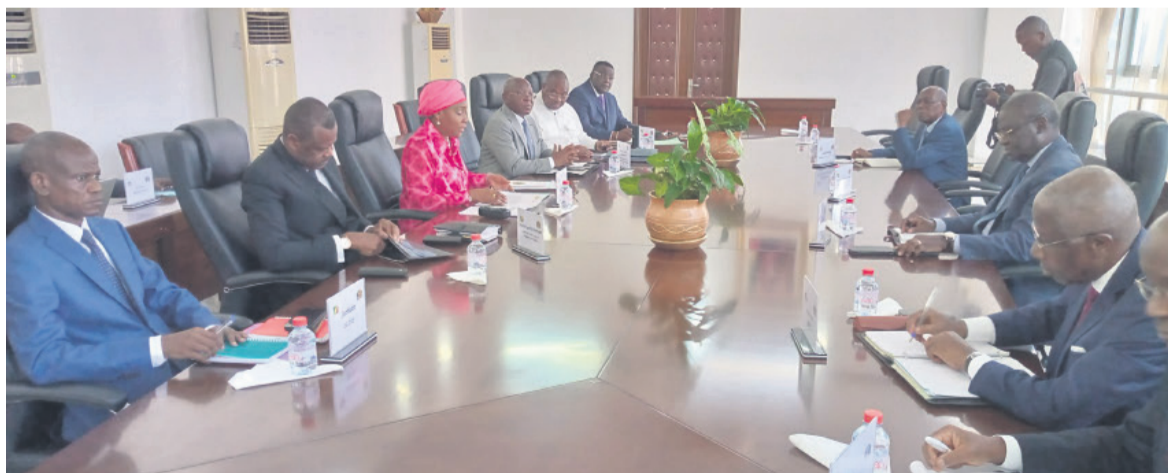
Les membres de la coordination nationale du RGPH-5/Adiac

Il y a eu aussi des problématiques en termes d'outils, surtout que le dénombrement principal repose essentiellement sur la tablette numérique. Les agents recenseurs étaient confrontés au manque de couverture internet dans certaines localités et les tablettes se déchargeaient à une vitesse qui ne permettait pas de faire un travail performant. La méthode choisie pour les jours supplémentaires consiste à redéployer les équipes sur le terrain et les renforcer en termes de matériel. Dans ce sens, la collecte des données se fait désormais à l'aide de