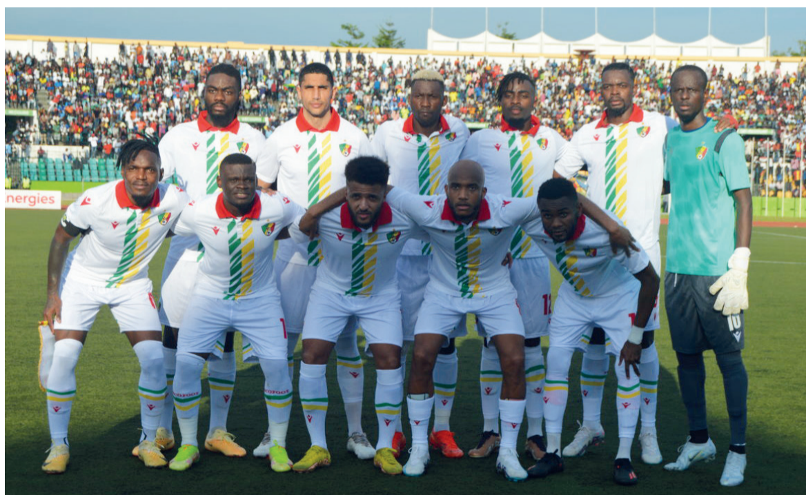
Les Diables rouges sans plusieurs de leurs cadres contre le Mali/Adiac

Les Diables rouges du Congo seront aux prises avec les Aigles du Mali, le 18 juin à Brazzaville, en match comptant pour la cinquième journée des éliminatoires de la Coupe d'Afrique