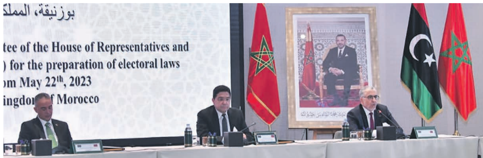
Le présidium des travaux

Convaincue des résultats obtenus, la Manul a réaffirmé son engagement de continuer à travailler avec toutes les institutions libyennes compétentes, y compris le Conseil présidentiel, pour faciliter un processus entre tous les acteurs. Le but étant « d'aborder les éléments contestés du cadre électoral, obtenir l'accord politique nécessaire sur la voie des élections et permettre des règles du jeu équitables pour tous les candidats ». C'est ainsi qu'elle « appelle tous les acteurs