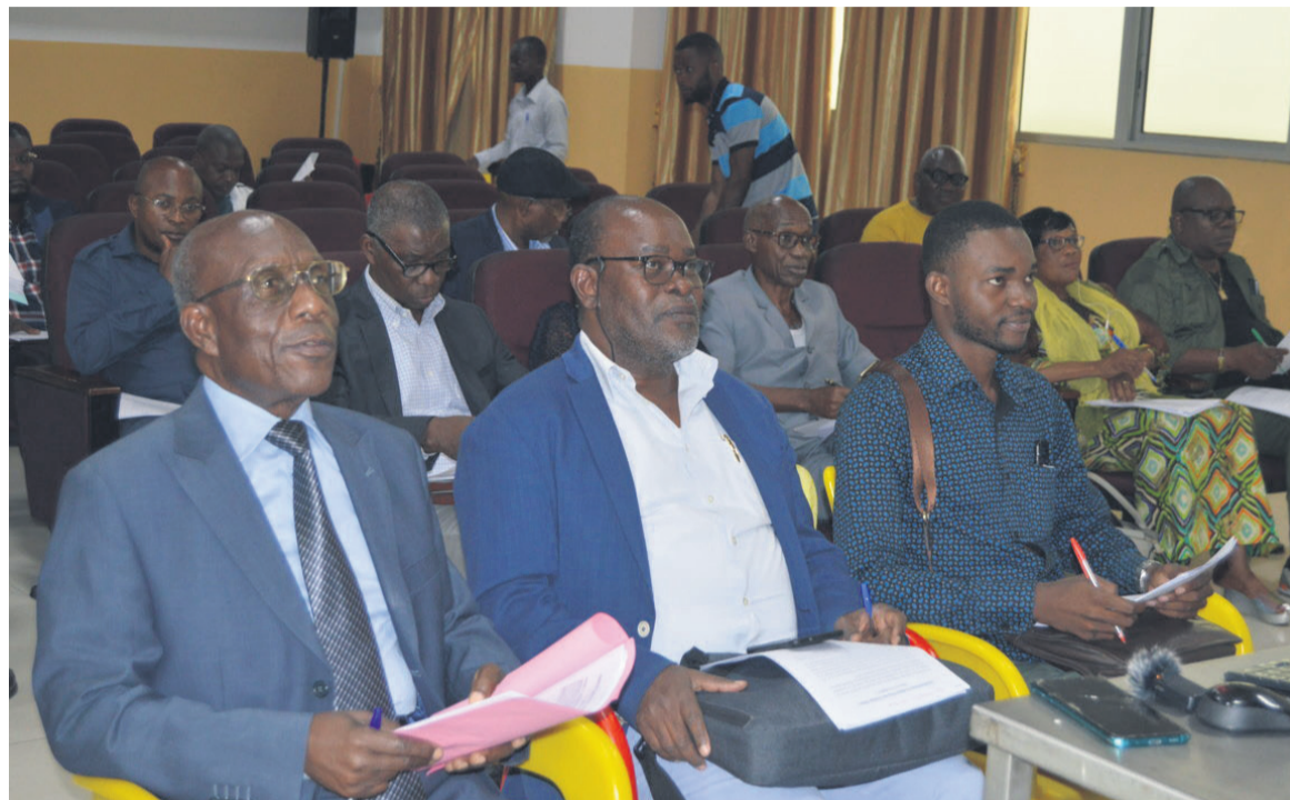
L'Association des médecins du Congo voit le jour/Adiac

tutive du 11 juin, les textes fondamentaux de l'Association des médecins du Congo ont été adoptés et les instances dirigeantes mises en place. Lesquelles instances vont œuvrer pour l'exécution du plan d'action de l'association qui se résume