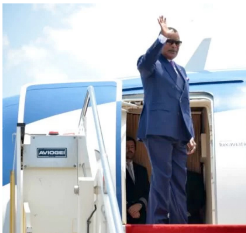
Le président de la République, Denis Sassou N'Guesso

Le président de la République, Denis Sassou N'Guesso, effectue, du 12 au 14 juin, une visite d'Etat en Côte d'Ivoire où il sera fait citoyen d'honneur de la ville d'Abidjan.