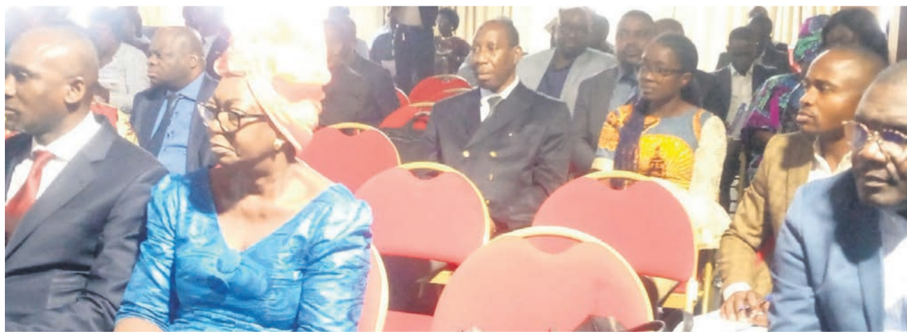
Une vue des participants à la session

Les experts sur les questions environnementales ont adopté, le 9 juin, à Brazzaville, un projet portant attributions, contribution et composition du secrétariat permanent de la Commission nationale de développement durable, à l'issue de la session extraordinaire.