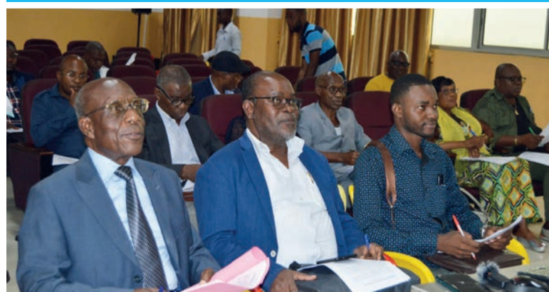
L'Association des médecins du Congo voit le jour