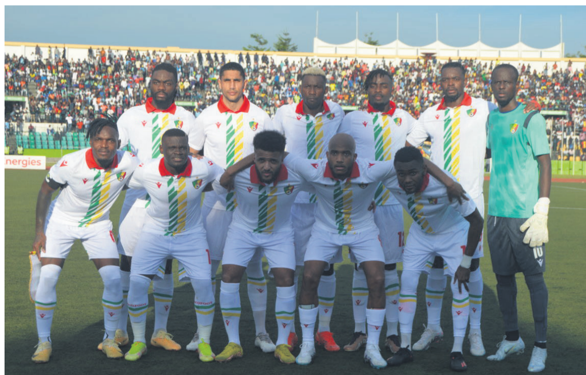
Les Diabes rouges sans plusieurs de leurs cadres contre le Mali