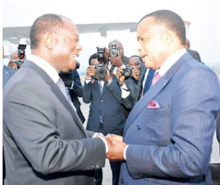
Les présidents Denis Sassou N'Guesso et Alassane Ouattara