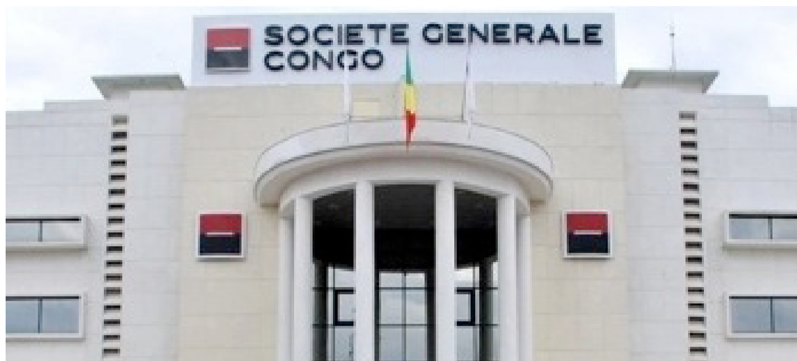
Le siège de la filiale congolaise de Société Générale

Le géant français de la finance avait affiché sa volonté de se retirer de plusieurs pays en Afrique, parmi lesquels la République du Congo. Cette opération qui devrait d'abord être validée par les autorités réglementaires vise, selon la partie congolaise, à garantir la continuité des services bancaires de qualité dans le pays tout en