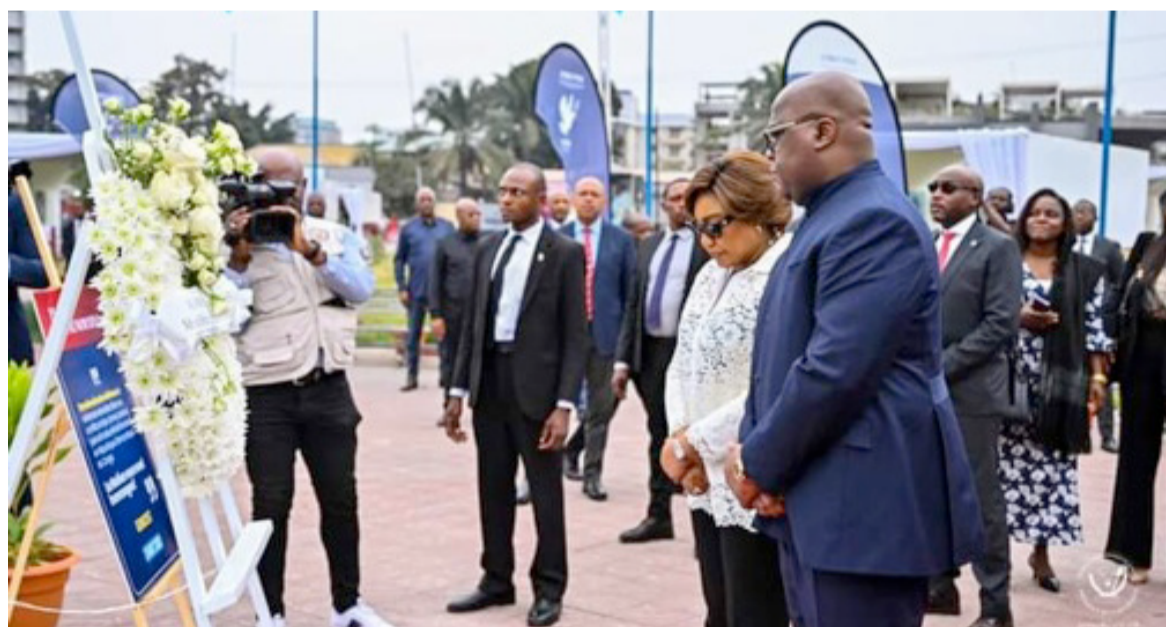
Le couple présidentiel déposant une gerbe de fleurs en mémoire des victimes des guerres

Le chef de l'Etat, Félix Tshisekedi, a pris part, le 1er août, à la « Place des évolués » à Kinshasa à la manifestation organisée à l'occasion de la journée commémorative du génocide congolais. La cérémonie rendait hommage aux compa-