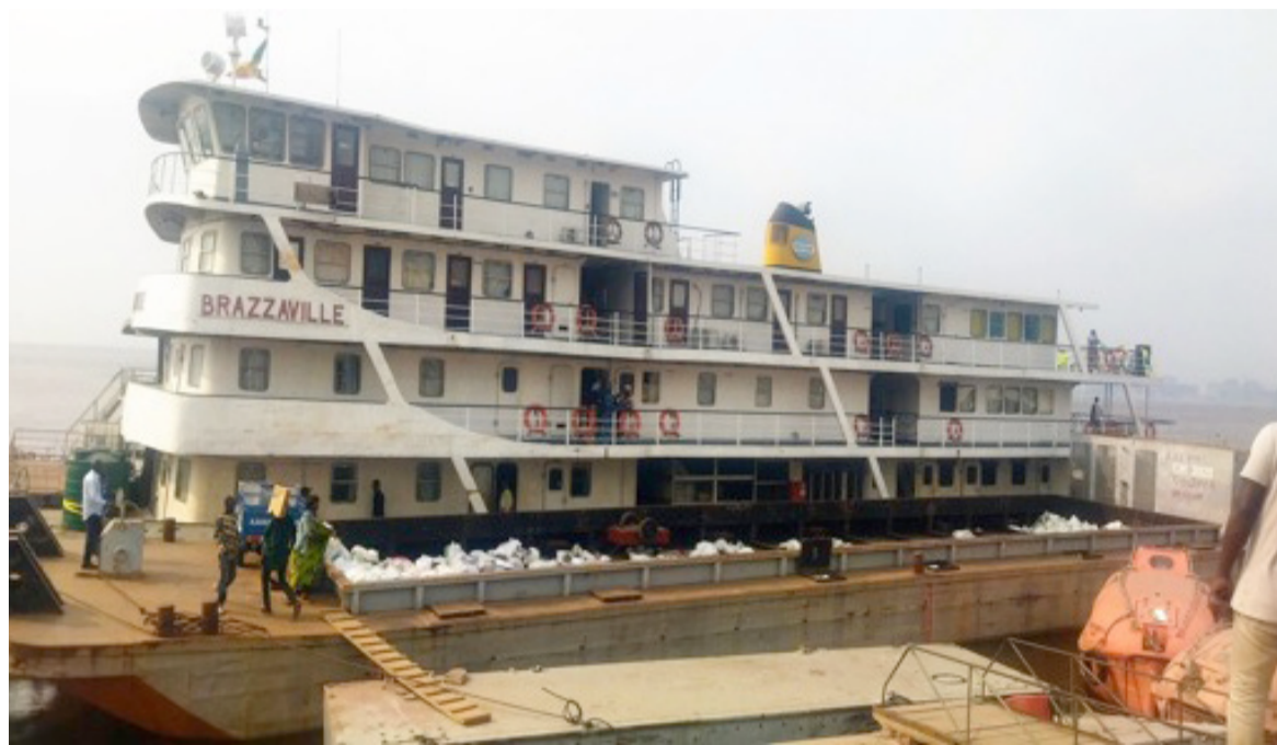
Le bateau Ville de Brazzaville au port à passagers peu avant le voyage Adiac

« Avec le ministre, nous avons discuté de la réhabilitation des unités fluviales en panne, pour reprendre les opérations de navigabilité sur le fleuve Congo. Sur les trois bateaux qui nous avaient été confiés à réfectionner, un seul avait été déjà livré ainsi que ses deux moteurs. Les deux qui restent le seront lorsque l'Etat disposera des moyens. Leurs quatre moteurs sont jusque-là en bon état, il s'agira juste de les réviser