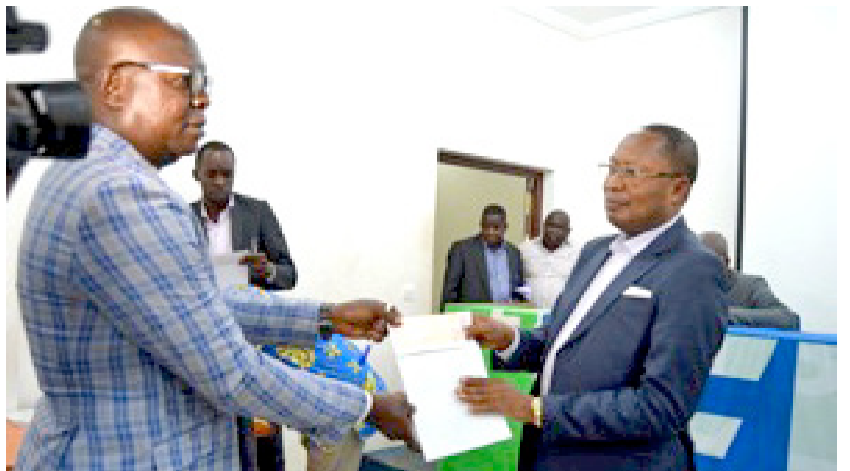
Le président de la Fécofoot remettant le chèque au secrétaire général de l'Etoile du Congo

Les mêmes recommandations sont applicables aux équipes de la Ligue 1 qui vont travailler la saison prochaine avec un nouveau partenaire. « S'il n'y a pas de justificatifs de l'argent pris en amont, vous n'aurez pas la subvention de la saison prochaine sinon on fera comme les autres pays qui ne font pas participer les équipes en compétitions africaines à cause de l'absence de la licence des clubs », a indiqué Jean Guy Blaise Mayolas. La Confédération africaine de football, a-t-il rappelé, est en train de changer beaucoup de chose pour les clubs. Des changements que la Fécofoot