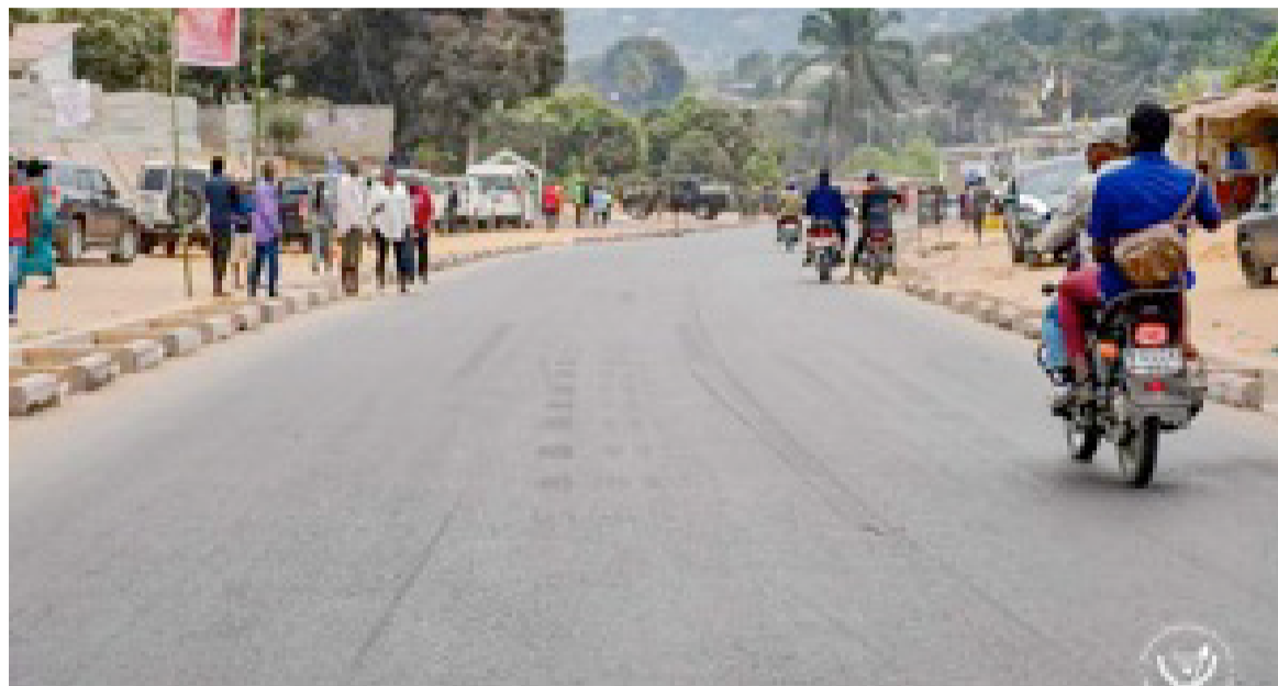
Reprise du trafic sur la route Kimwenza-Kindele

Le chef de l'État, Félix-Antoine Tshisekedi, a procédé le 1er août à la réouverture de la route Kimwenza-Kindele, dans la commune de Mont-Ngafula, impraticable depuis 2016.