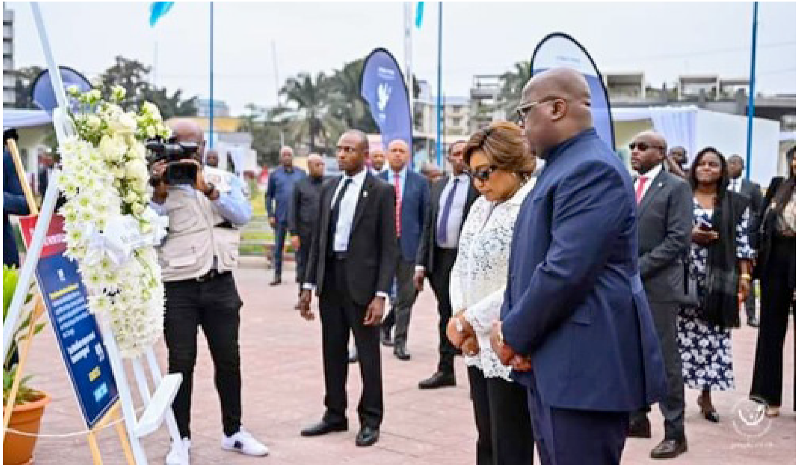
Le couple présidentiel déposant une gerbe de fleurs en mémoire des victimes des guerres