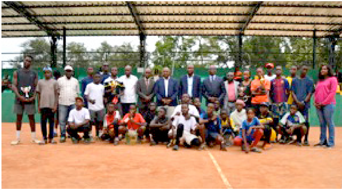
Les officiels et les athlètes après la compétition

« L'édition 2023 n'est qu'une partie remise de nos activités. La Fécoten après avoir organisé deux tournois internationaux « Prize money » a clôturé la saison sportive par le championnat national. Cette année, nous allons relancer les activités de tennis, parce que nous avons réhabilité les infrastructures du pôle tennis. La fédération va mettre à votre disposition tous les moyens techniques pour vous permettre de progresser, de jouer et de compétir avec les autres. Les compétitions vont vous booster pour que l'année prochaine, quand nous allons organiser les Prize