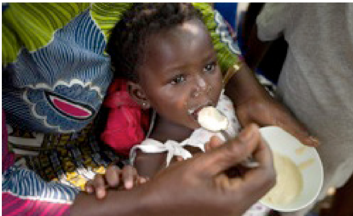
Une enfant nourrie aux recettes locales améliorées moins coûteuse

Ces recherches menées sur les habitudes alimentaires ont été réalisées dans les quatre régions linguistiques de la République démocratique du Congo (RDC), à savoir les régions de