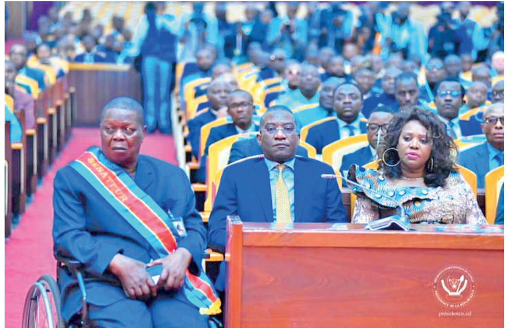
Une vue des participants à l'hémicycle