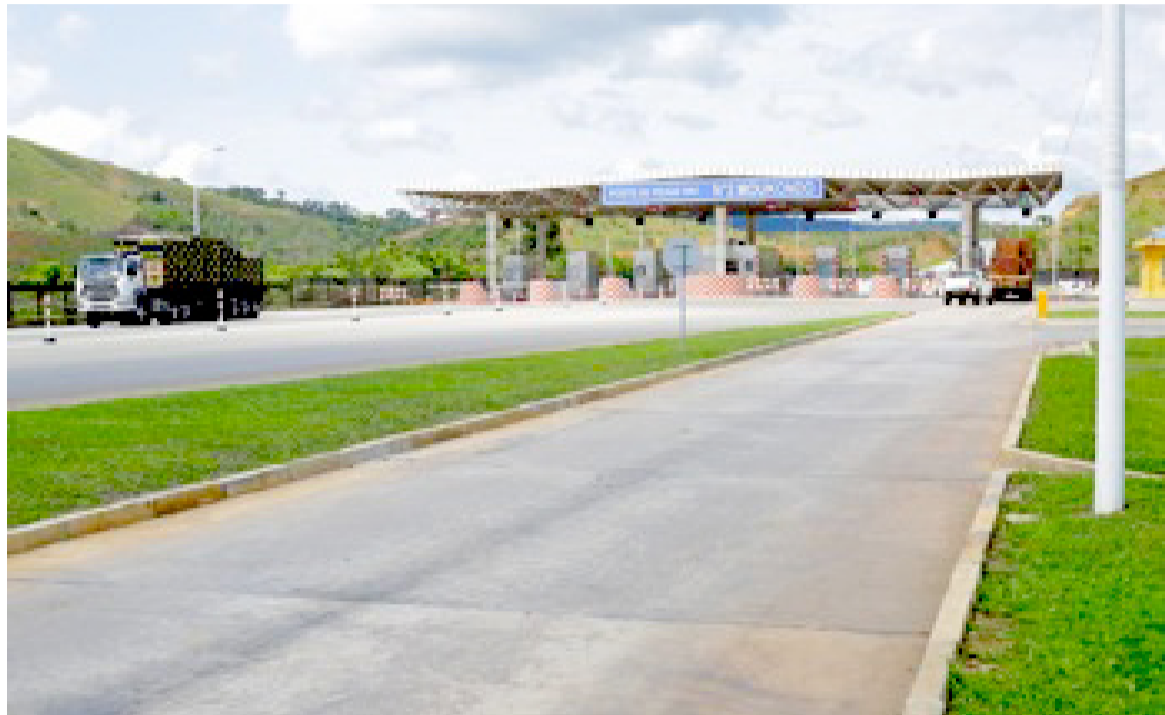
L'un des postes de péage sur la nationale 1

L'approbation de la concession des routes nationales n°1 bis et n°2 autorise le gestionnaire à mettre en place un manuel d'exploitation pour une utilisation optimale des trois corridors. D'après le gouvernement, la décision s'inscrit dans la droite ligne de l'approbation antérieure de la convention de délégation de service public ainsi que du décret instituant un droit de péage sur les axes du réseau concédé. Le décret de délégation de service public au profit de LCR sur la mise en concession des routes nationales n°1, n°1 bis en projet et n°2 a été pris en février 2019 par le chef de l'État. « En vertu de cette convention, le concessionnaire est tenu de soumettre à l'approbation des autorités compétentes un règlement d'exploitation. Celui-ci contient les dispositions essentielles sur les consignes d'intervention des personnels du concessionnaire et des forces de l'ordre. Le règlement fixe également les conditions d'utilisation par les usagers du domaine rou-