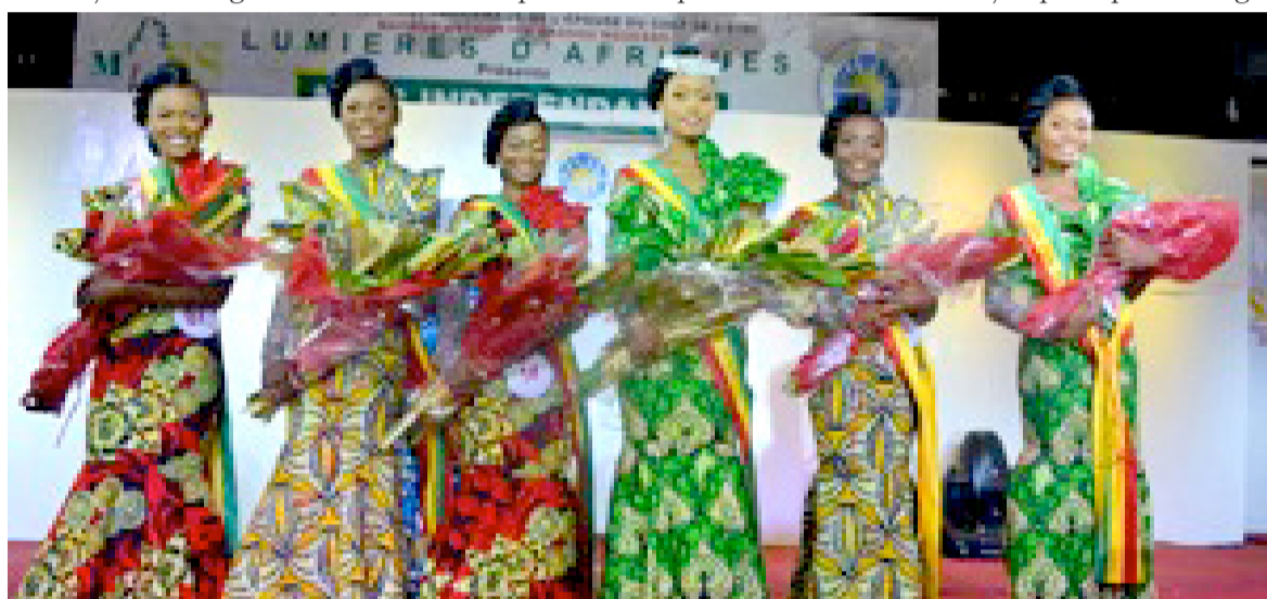
La miss indépendance posant avec ses deux dauphines, et les 3 autres miss (Fairplay, élégance, charme)

Le président de l'association Lumières d'Afrique a exprimé sa gratitude à l'épouse du chef de l'État, Antoinette Sassou N'Gouesso, à qui le public a éga-