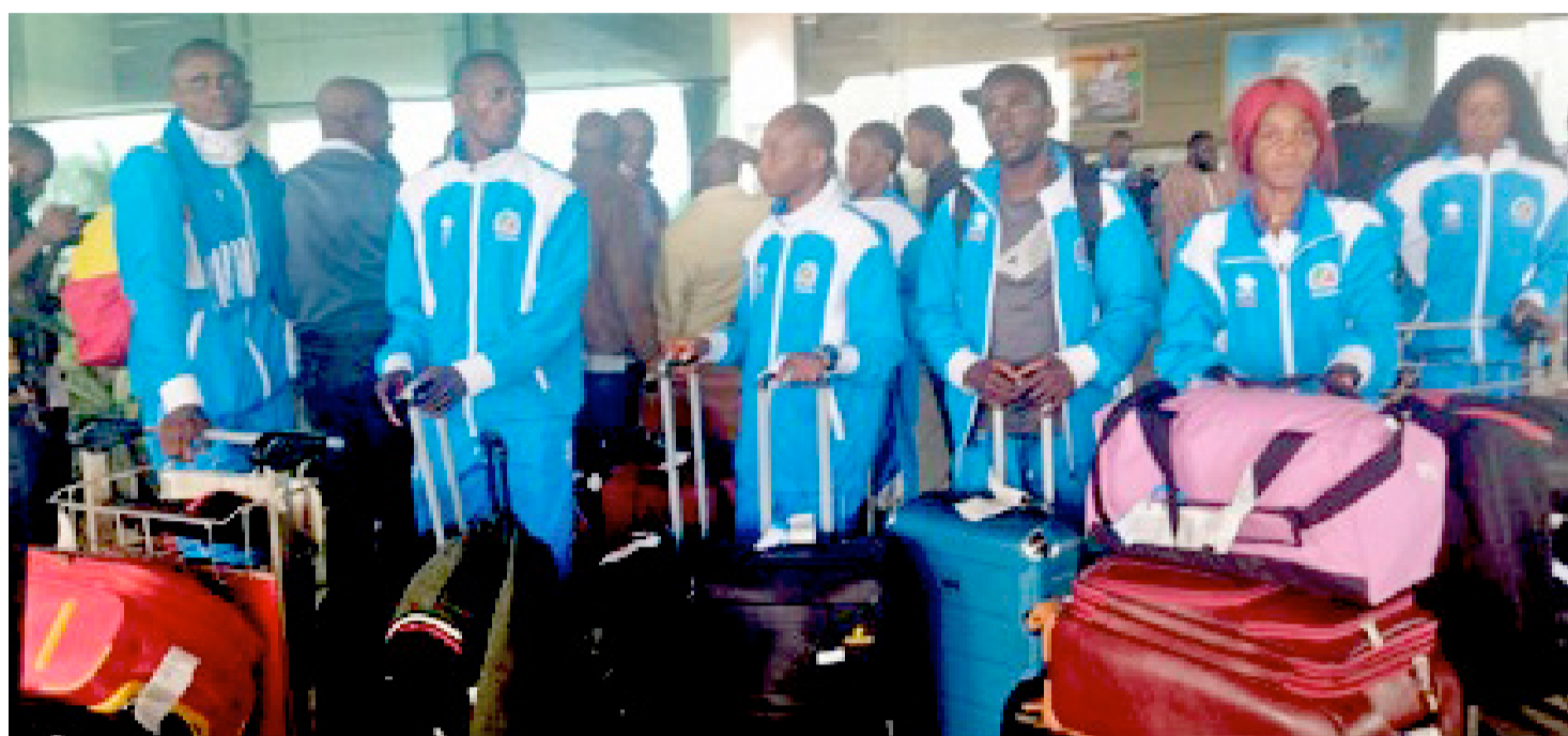
Les huit athlètes congolais revenus d'une mise au vert au Kenya reçus à l'aéroport international Maya-Maya/Adiac

Pendant quarante-cinq jours, les jeunes athlètes congolais ont reçu une formation de haut niveau dans un institut kenyan de renommée internationale, dispensée par des experts formateurs en la matière. En finançant cette mise au vert, l'objectif de la SNPC est de permettre aux athlètes professionnels congolais d'acquiescer de nouvelles aptitudes athlétiques pouvant faire d'eux des athlètes de rang mondial. « Nous avons quitté Brazzaville, le 28 juin, pour participer à une formation pratique qui a eu lieu à Eldoret, afin que nous participions à la 18e édition du semi-marathon international de