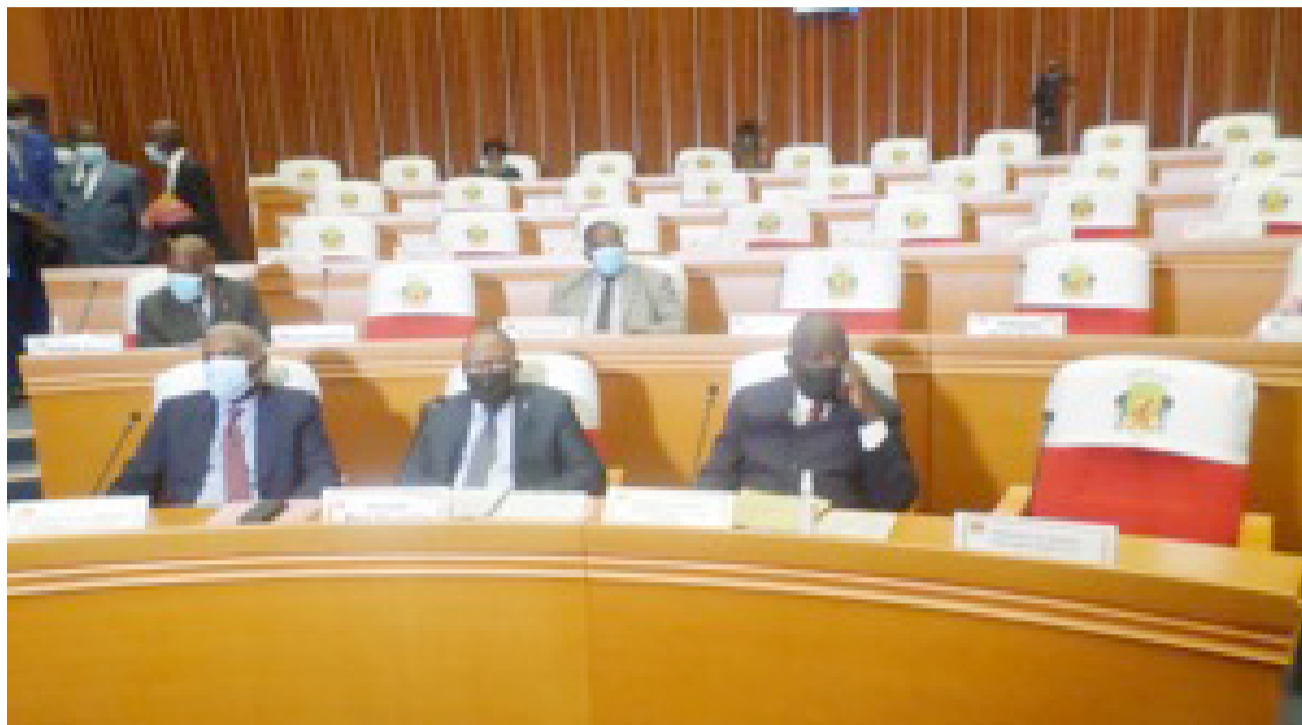
Quelques sénateurs présents à la dernière session ordinaire du Sénat

Les lampions de la dix-huitième et dernière session ordinaire du Sénat couplée à la célébration de la fin de la troisième législature qui avait pris son envol le 12 septembre 2017 se sont éteints le 13 août 2023 à Brazzaville.