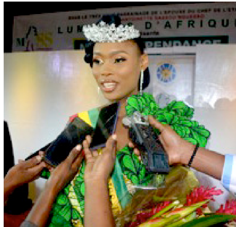
La miss indépendance 2023 répondant aux questions des journalistes

lement rendu hommage pour son soutien en parrainant l'événement durant plus d'une décennie, depuis 2007 à Owando. « Nous ne cesserons de lui rendre un hommage mérité. Notre message sur la diversité culturelle du Congo ne laisse