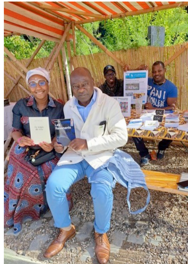
Marché du livre africain de Pantin, France, août 2023

À en croire les visiteurs, l'attrait de ce marché a été rendu possible par sa tenue à la Cité Fertile, ancienne gare de marchandises SNCF de Pantin, endroit dédié au service de la transition écologique et sociale, lieu de balades et de déambulation pour tous les publics.