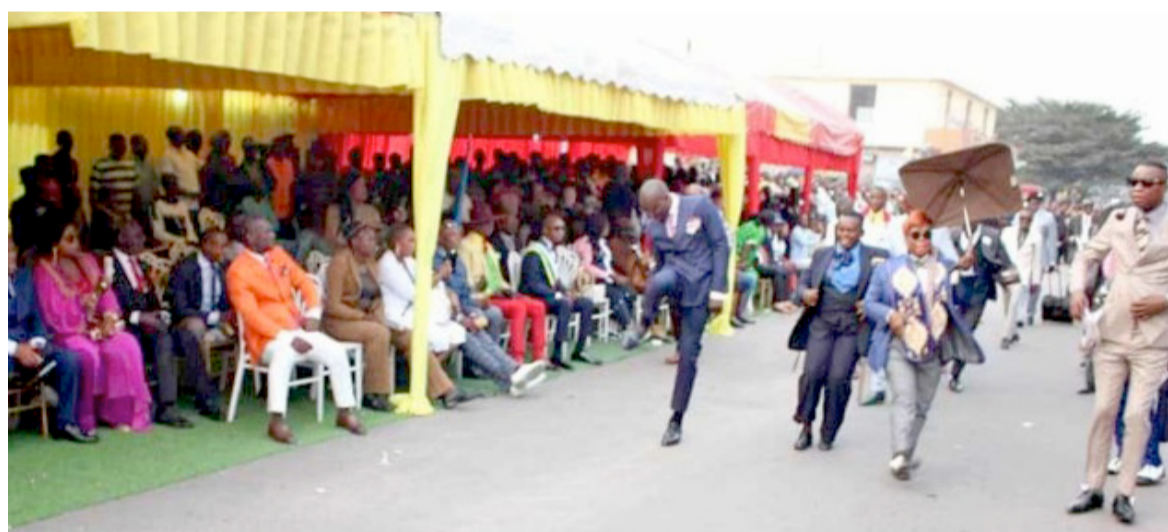
Une parade des sapeurs

En effet, a-t-il poursuivi, ce fut le dimanche 2 juin 2015 que naquit le festival de la sape à la mairie de Ouenzé par la volonté des frères et sœurs sapeurs des neuf arrondissements de Brazzaville. « Vous vous souvenez que, le dimanche 2 juin 2015, je disais dans mon allocution que la date du 28 juin 2015 sera gravée dans les annales de la sape car, comme nous le savons tous, notre pays le Congo a connu plusieurs festi-