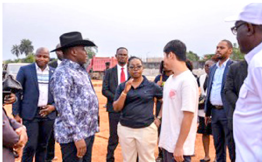
Me Guy Loando satisfait de l'avancement du PDL 145 territoires à Kisangani

Accompagné de la gouverneure de province, Mme Nikomba Sabangu, le ministre a pu constater l'avancement significatif des projets d'infrastructures et de modernisation dans la province. Au cours de sa visite, le ministre d'Etat, Guy Loando, s'est dit satisfait de l'évolution des travaux de la voirie urbaine, du stade Lumumba ainsi que de la modernisation en cours de l'aéroport international de