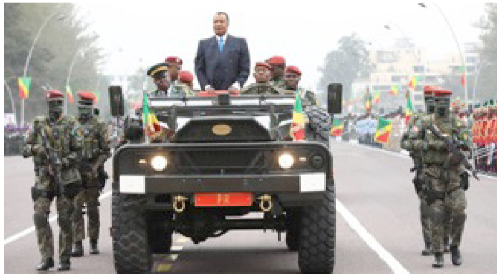
Le chef de l'Etat passant les troupes en revue