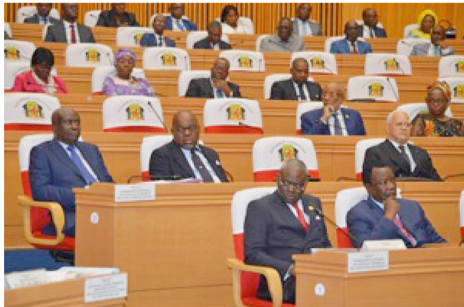
Les membres du gouvernement

« L'atteinte de ces objectifs impliquera la mise en œuvre des mesures de politique budgétaire à moyen terme. Au nombre de ces mesures, nous pouvons noter, en matière des recettes fiscales, l'élargissement de l'assiette fiscale à travers le renforcement de la fiscalisation ; l'amélioration du rendement de l'impôt fon-