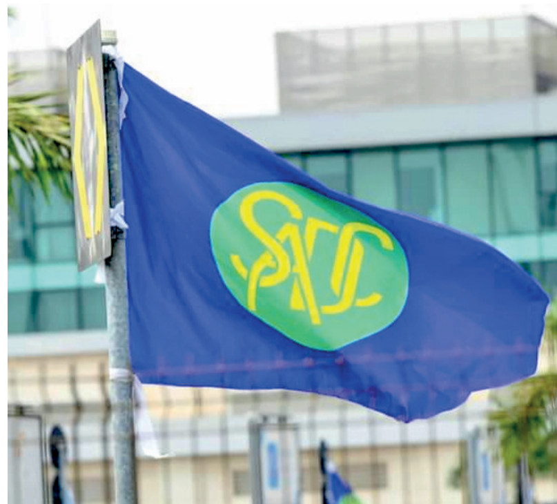
Le drapeau de la SADC