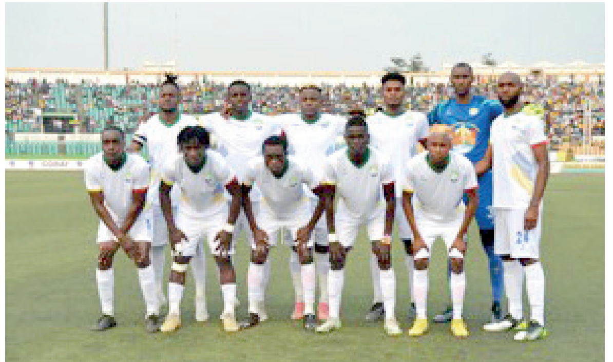
L'AS Otohô doit relever le défi de la qualification face à El Merreikh/Adiadic

« Il faut qu'on tourne la page et penser à El Merreikh. Mais cette finale me rappelle Cape Town où on prend une leçon de réalisme aussi. Sur l'en-semble des deux matches, nous avons trois ou quatre occasions de plus qu'eux... Il faut être plus tranchant et plus concentré », a souligné