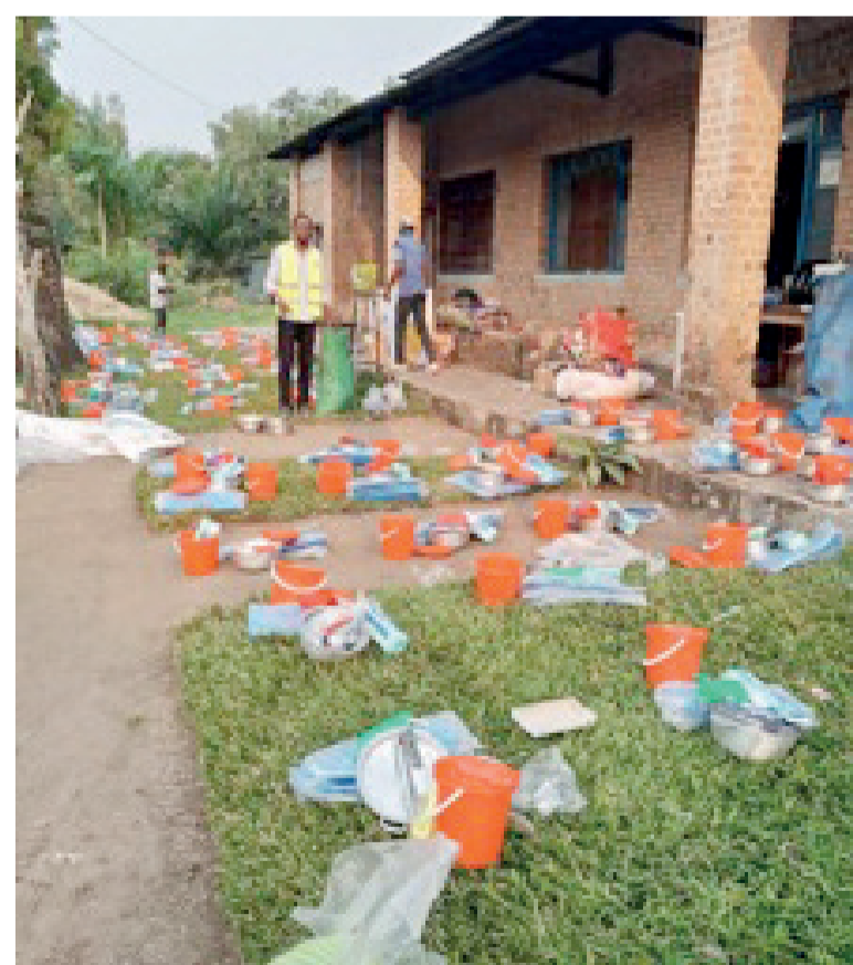
Distribution des non-vivres aux déplacés de Kenge et Popokabaka

Au total, mille quatre cent soixante ménages déplacés et familles d'accueil dans les zones de santé de Kenge et de Popokabaka dans le Kwango ont bénéficié de l'aide des deux institutions. Chaque ménage a reçu du cash pour le loyer et un kit des articles ménagers essentiels (AME).