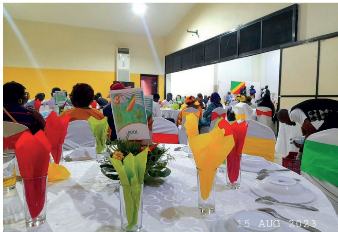
Fête de l'indépendance du Congo 2023, Abidjan, Côte d'Ivoire

À l'initiative de l'ambassade du Congo en Côte d'Ivoire, l'Association congolaise pour la logistique et la Supply Chain - Acolog -, par sa représentation à Abidjan, en Côte d'Ivoire, a participé aux festivités du 15 août, date marquant, depuis 1960, l'anniversaire de l'indépendance de la République du Congo.