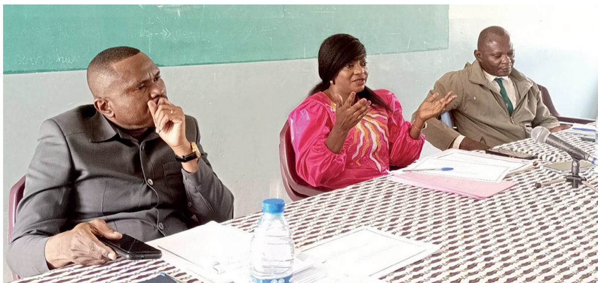
Évaluation de l'action pédago-andragogique dans le Pool/Adiac

Les préoccupations évoquées par les directeurs et les animateurs des centres d'alphabétisation et de rescolarisation