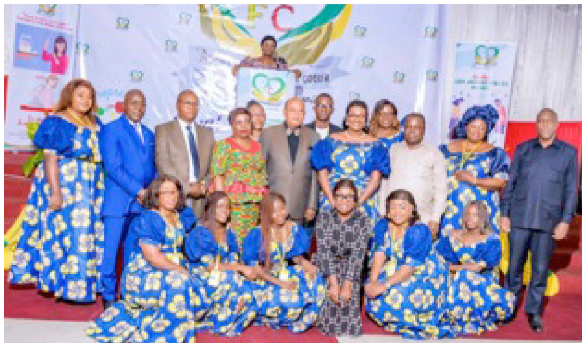
Les femmes de cœur posant avec leurs invités

des campagnes de sensibilisation à l'éducation sexuelle ; faire face au décrochage scolaire en encourageant à la reprise des études, si possible, et d'autres seront orientées vers des activités génératrices de revenus immédiats telles que la coiffure, la couture. Pour financer ses actions, l'association compte organiser chaque année plusieurs événements comme des concerts caritatifs, des repas solidaires et les éditions du "Grand marché de cœur", qui est un projet social de vente de vêtements d'occasion et bien d'autres articles à des prix dérisoires. S'agissant des questions de