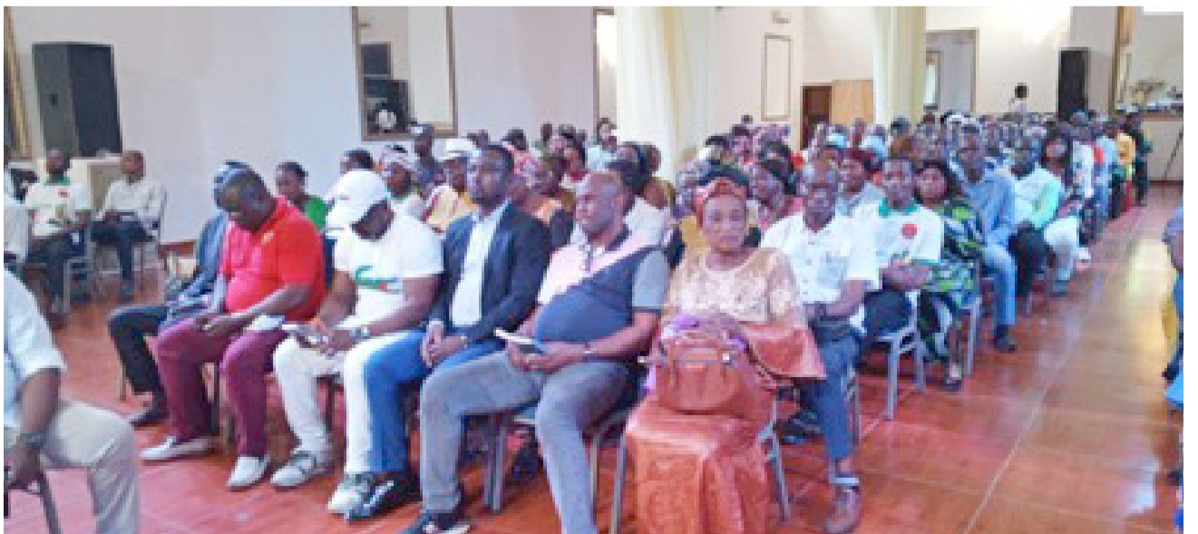
La population de Poto-Poto 1 lors de l'échange