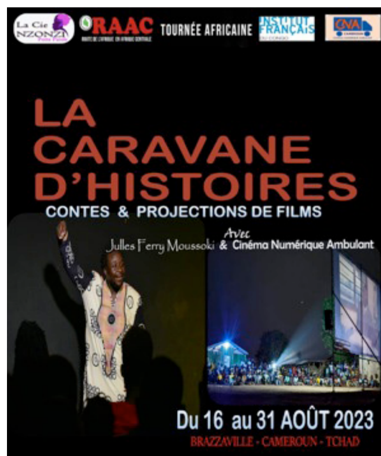
L'affiche du rendez-vous