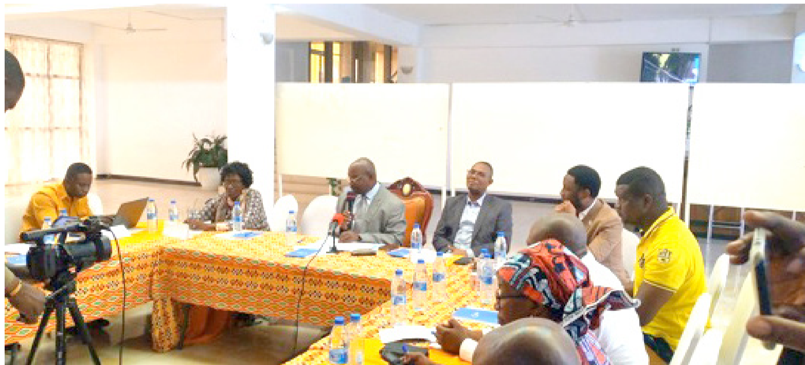
Une vue des participants (ADIAIC)

La campagne gratuite de masse des moustiquaires imprégnées d'insecticide sur l'ensemble du pays a été lancée officiellement à Pointe-Noire en août dernier par le gouvernement en partenariat avec le Fonds mondial à travers Catholic relief services. Le but était de donner à au moins 90% des ménages des moustiquaires imprégnées et de s'assurer qu'ils dorment sous ces moustiquaires, soit