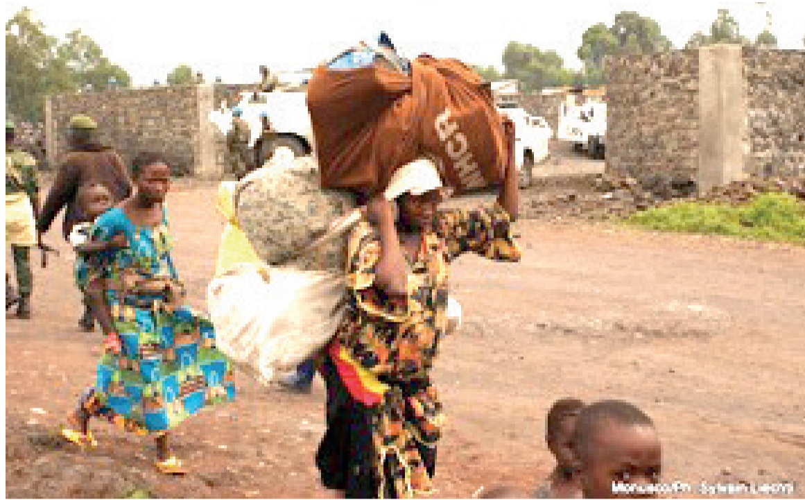
Des habitants fuyant les affrontements à Masisi

Ces massacres et violations des droits de l'homme dont certains constituent des crimes de guerre et des crimes contre l'humanité ont conduit plusieurs observateurs à créditer la thèse d'un génocide congolais. Thèse confirmée, plus tard, par le rapport «Projet Mapping» qui a eu à documenter les violations les plus graves des droits humains et du droit international humanitaire commises en République démocratique du Congo (RDC) entre 1993 et 2003, lesquelles ont toujours été minimisées. Reconnaître le génocide congolais le plus navrant est qu'aujourd'hui en-