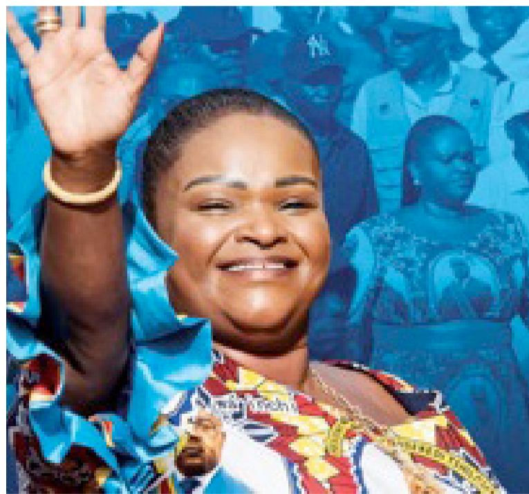
Carole Agito, sénatrice du Bas-Uélé

Dans un premier temps, un lot important des matériels a été acheté par la Fondation Carole Agito pour la réalisation de l'éclairage public de Buta. Les premiers travaux partiront de la place Bois-Rouge, en face l'avenue Mongengeta, jusqu'à la rive gauche de la rivière Rubi. Ensuite, ces travaux se poursuivront sur les autres artères de la ville de Buta. « Toutes les avenues du chef-lieu du Bas-Uélé seront éclairées »,