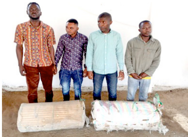
Les quatre condamnés Adiac

L'interpellation de ces trafiquants s'était faite, le 28 juin dernier à Pointe-Noire et, avait été réalisée par les éléments de la section de recherche judiciaire et de ceux de l'Escadron de sécurité et d'intervention de la Région de gendarmerie de Pointe-Noire, en collaboration avec les agents de