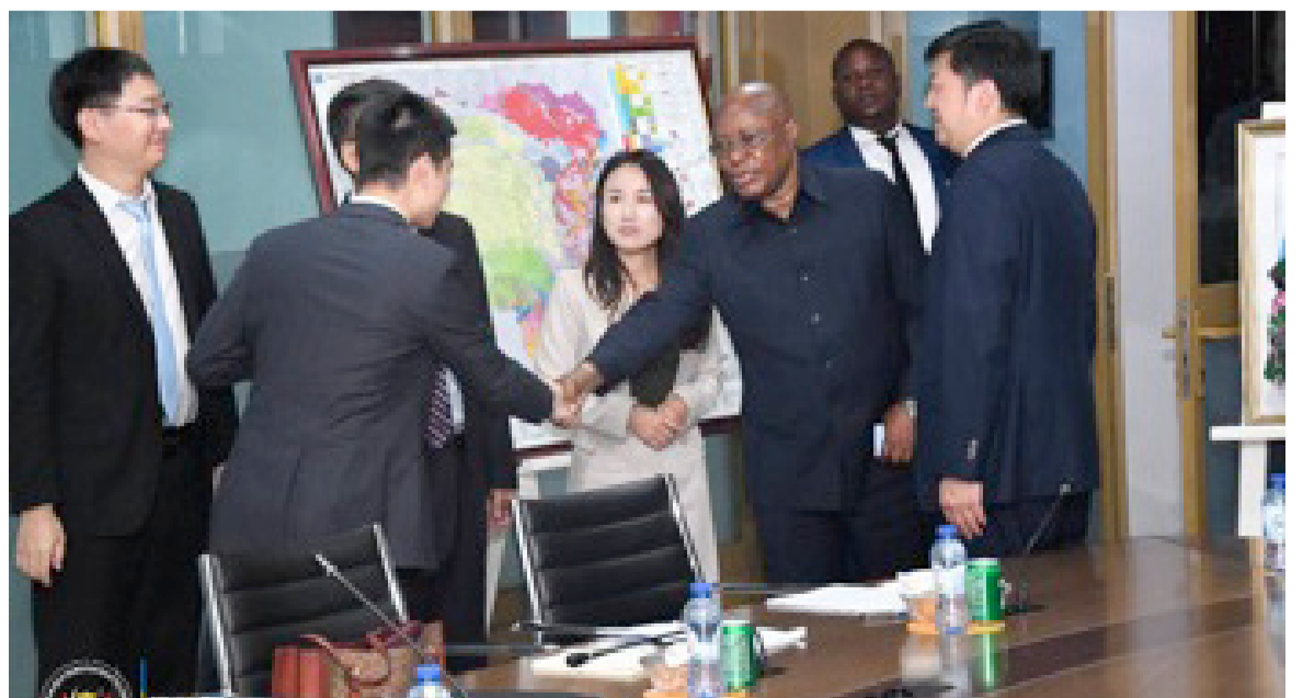
La RDC et la Chine pour une coopération dans le secteur minier