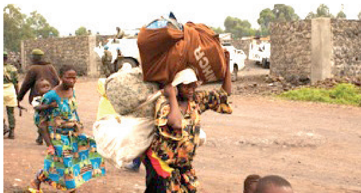
Des habitants fuyant les affrontements à Masisi

Bien d'analystes pensent que le moment est venu de bâtir la mémoire collective autour des crimes commis depuis trois décennies en République démocratique du Congo (RDC). Plus que jamais, la RDC est engagée dans