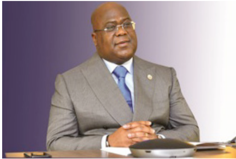
Le président sortant de la Sadc et chef de l'Etat congolais, Félix Tshisekedi

« En tant que communauté régionale unie de 16 États membres, avec un produit intérieur brut combiné d'environ 720 milliards de dollars et une population totale de plus de 360 millions de personnes, dont 75 % sont des jeunes, nous disposons d'un marché dont le potentiel pour l'investissement et le développement économique est considérable »