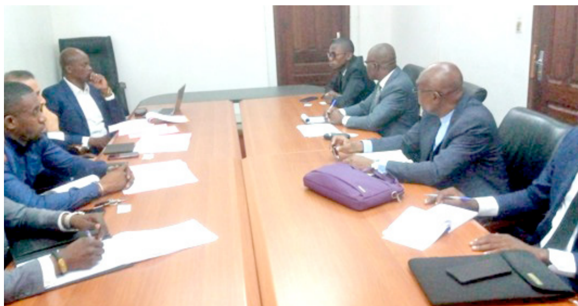
La rencontre entre les experts du Pnud et la Chambre de commerce/Adiac

Cet outil innovant recouvre l'ensemble des sources de financement : nationales et internationales, publiques et privées, bancaires et non bancaires, diaspora, Organisations non gouvernementales, philanthropie, partenariats pu-