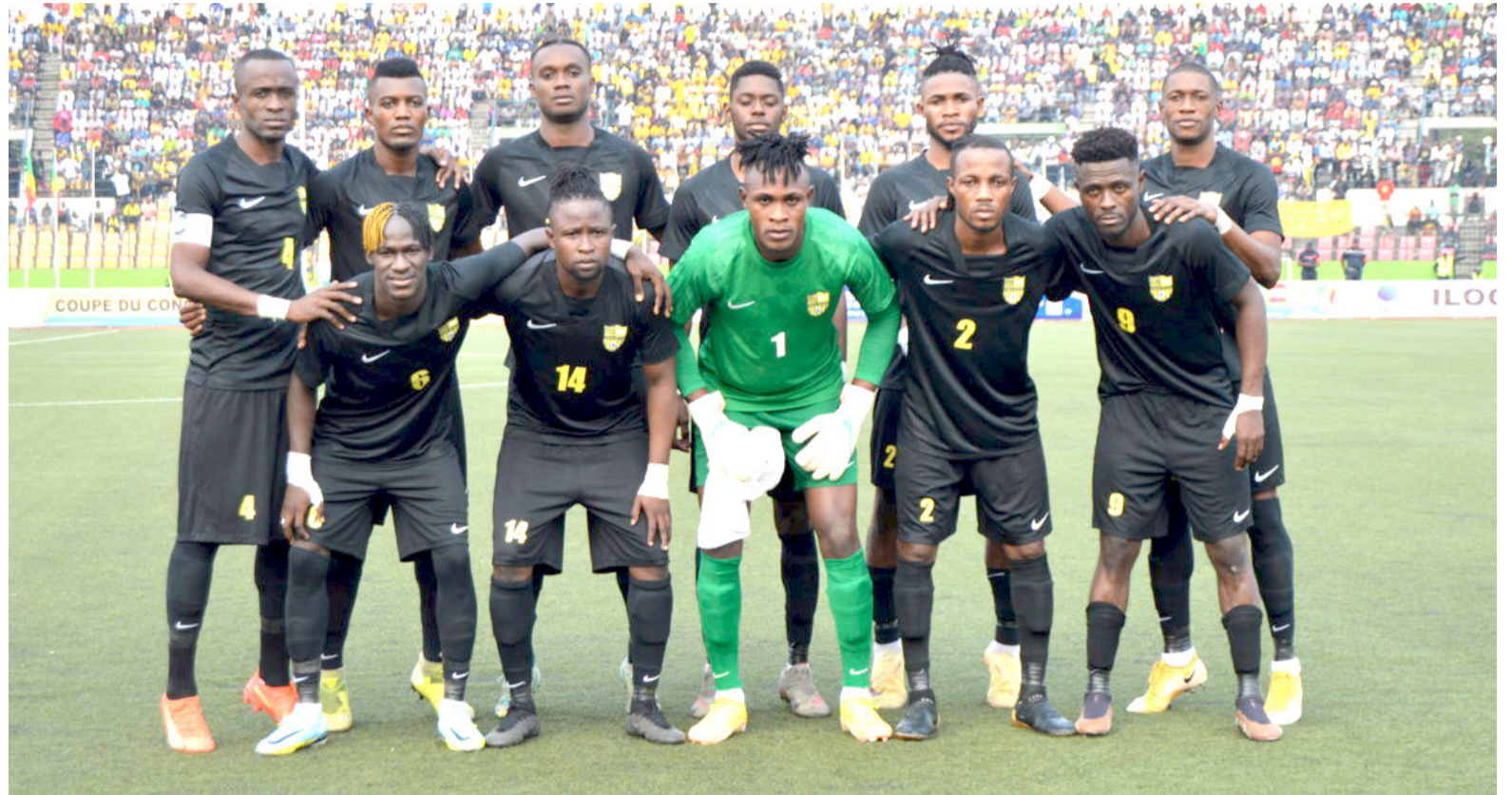
Les Diabes noirs affronteront Muza FC au deuxième tour préliminaire de la Coupe de la Confédération/Afrique

Exemptés du premier tour préliminaire, les Diablotins entraînés désormais par Noel Tosi (ancien sélectionneur des Diabes rouges en 2006-2007) se sont contentés d'un match amical international qui les a opposés aux Aigles du Congo ancienne JSK de la République démocratique du Congo pour préparer cette future double confrontation. Les Diablotins qui ont pris le meilleur 3-1 le 28 août au stade Alphonse-Massamba-Débat rêvent de rééditer l'exploit de la saison dernière où ils ont réussi à disputer la première phase de poules d'une compétition africaine après plus de 70 ans d'existence. Le match aller du deuxième tour préliminaire se disputera le 15