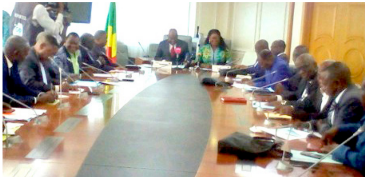
Les participants à la réunion de restitution

A ce titre, il a, entre autres missions, en période électorale, de participer à l'établissement de la liste des formations et groupements politiques habilités à utiliser les antennes du service public de radiodiffusion et de télévision pour les émissions de propagande électorale ; fixer les règles pour la durée