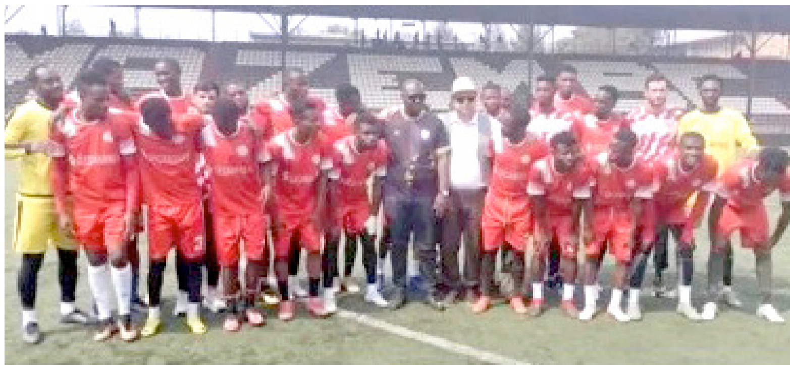
Lubumbashi Sport avant d'affronter Panda le 27 août à Lubumbashi

L'on apprend que la JS Groupe Bazano a sollicité un report pour son match contre le Tout-Puissant Mazembe comptant pour la troisième journée. «Au regard des différends qui opposent nos