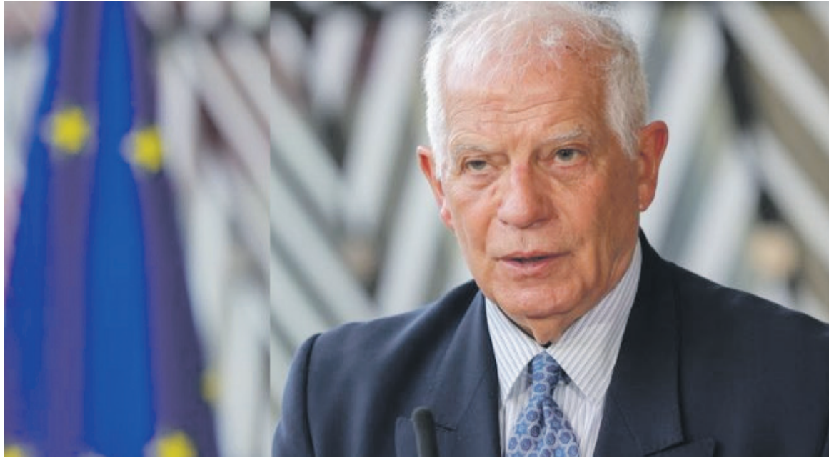
Le chef de la politique étrangère de l'Union européenne, Josep Borrell

Les militaires ont annoncé l'annulation des élections, qui ont eu lieu le 26 août, la dissolution de toutes les institutions de l'État