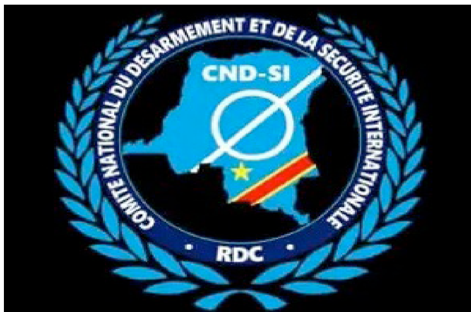
L'enseigne du CND-SI en République démocratique du Congo