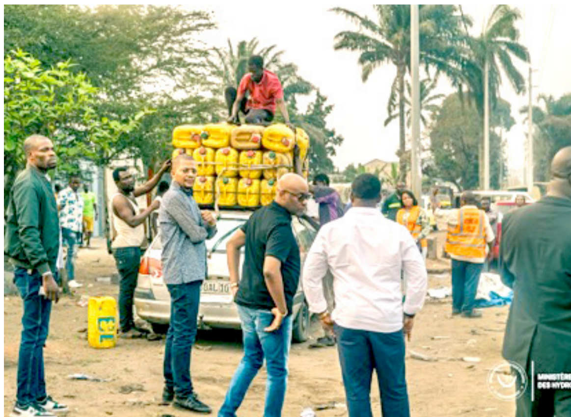
Un véhicule avec des bidons transportant du carburant intercepté par Didier Budimbu

des produits pétroliers. Le ministre des Hydrocarbures s'est opposé à la circulation de ces véhicules qu'il a fait retourner et a montré sa désapprobation au regard du comportement suicidaire affiché par des commerçants qui prennent les risques graves, non seulement pour eux-mêmes mais vis-à-vis des autres qu'ils exposent au danger lié aux incendies. Didier Budimbu, qui avait