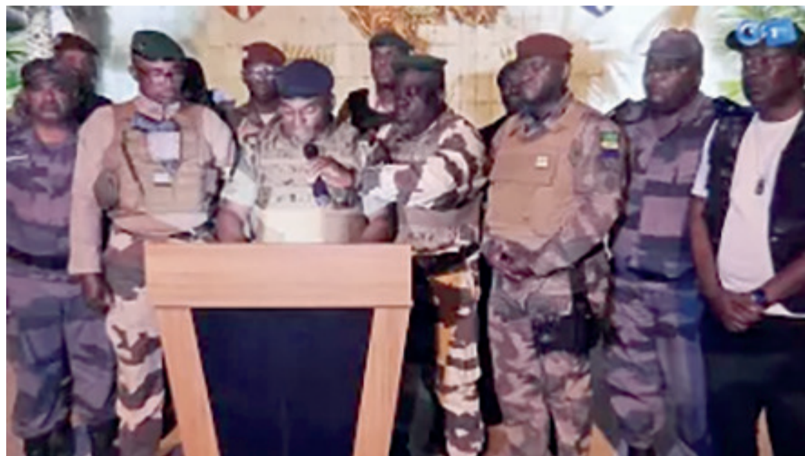
La douzaine de militaires gabonais revendiquant la prise de pouvoir le 30 août sur la chaîne de télévision G24DR

« Ce jour... nous, Forces de défense et de sécurité, réunies au sein du Comité pour la transition et la restauration des institutions -C.T.R. I-, au nom du peuple gabonais, et garants de la protection des institutions, avons décidé de défendre la paix en mettant fin au régime en place », répétait en continu un homme en treillis entouré