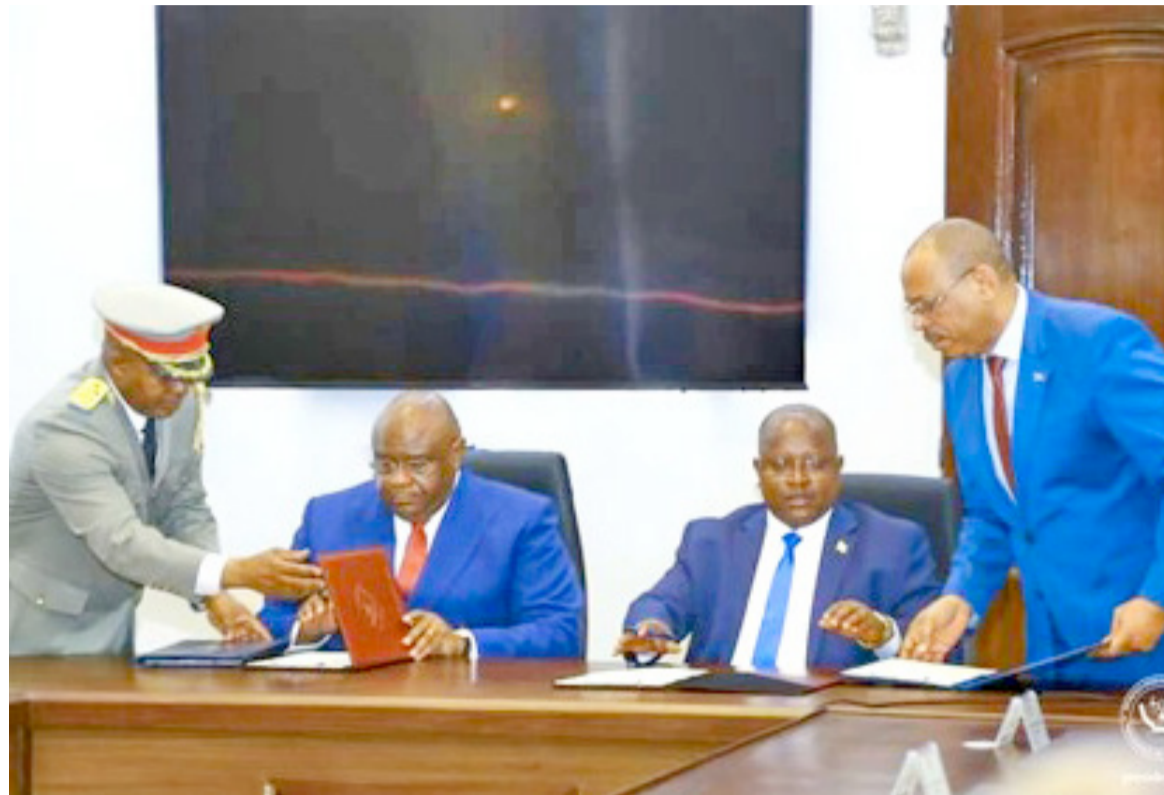
Signature de l'accord de défense et de sécurité entre les deux pays

Des projets intégrateurs ont également attiré l'attention de deux chefs d'État. C'est ainsi qu'il a été décidé que le bénéfice d'urgence soit accordé à la réalisation du pont reliant la province de Cibitoke au Burundi et celle du Sud-Kivu en République démocratique du