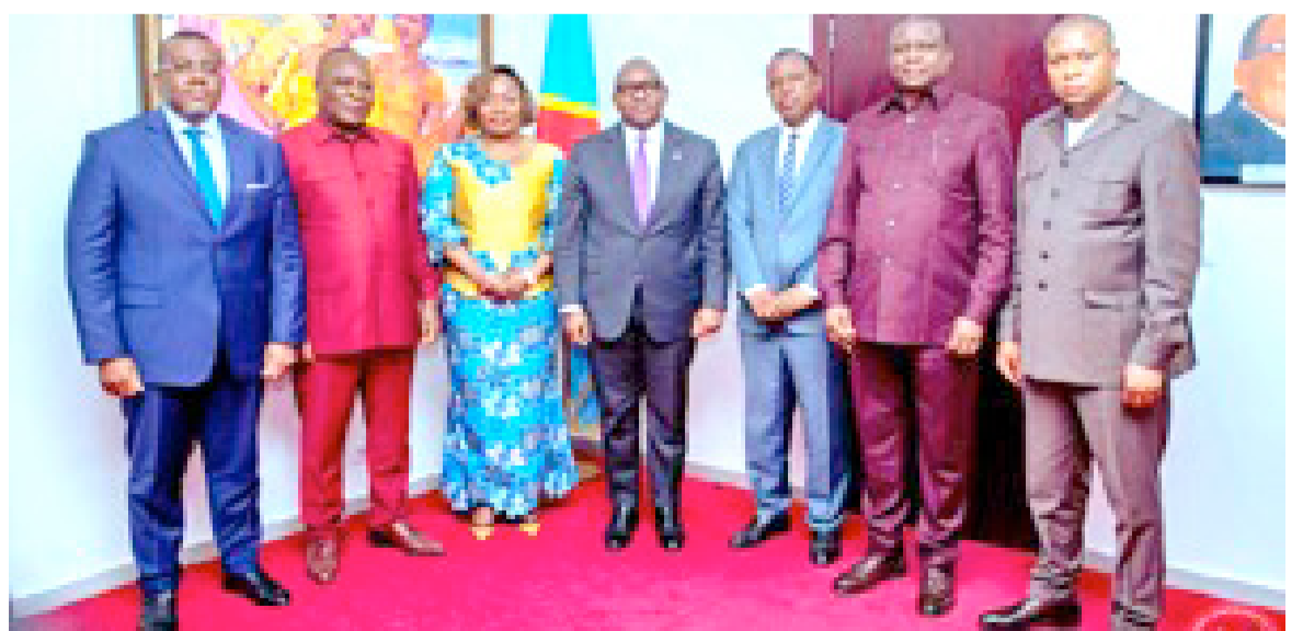
Le Premier ministre Sama Lukonde entouré des six gouverneurs de province