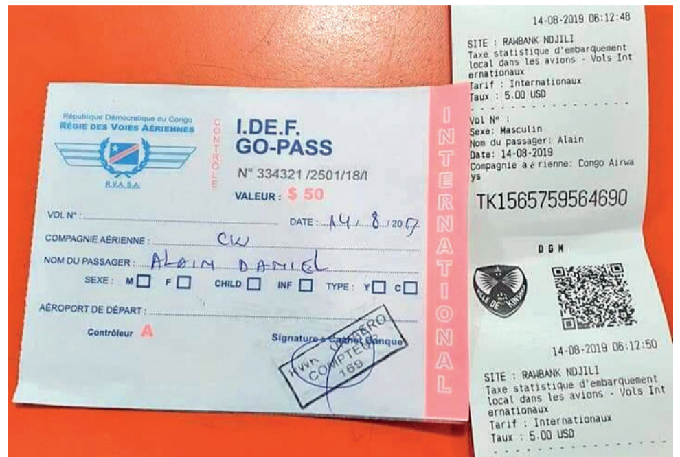
Preuves de paiement de la taxe Go pass

D'où le plaidoyer des activistes des mouvements citoyens qui en appellent à la suppression pure et simple de ladite taxe qui impose une charge financière excessive aux voyageurs. Le Programme multisectoriel de vulgarisation et Sensibilisation est passé à l'action, le 31 août, en orga-