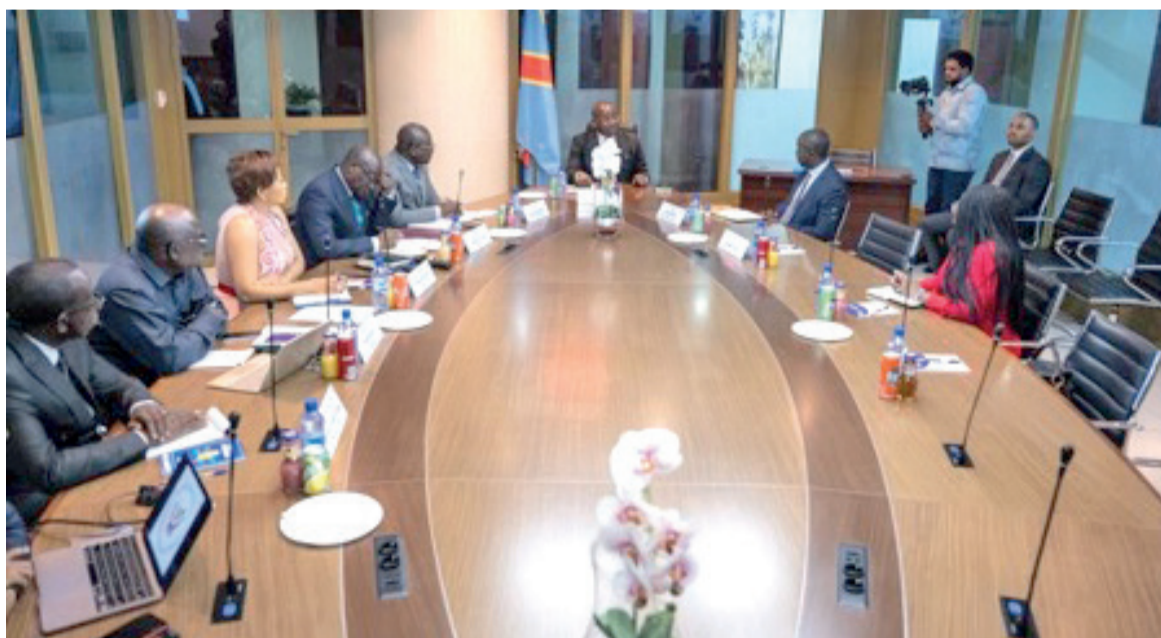
Séance de travail entre le ministre Guy Loando et la SFI

Les discussions ont notamment porté sur l'intégration du secteur privé en vue de soutenir les stratégies de développement en place. L'une des pistes explorées est la participation de la SFI à la réflexion sur l'intégration du secteur privé dans des domaines clés tels que le logement et le transport. La SFI