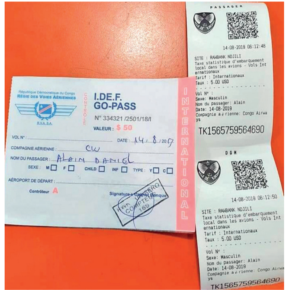
Preuves de paiement de la taxe Go pass