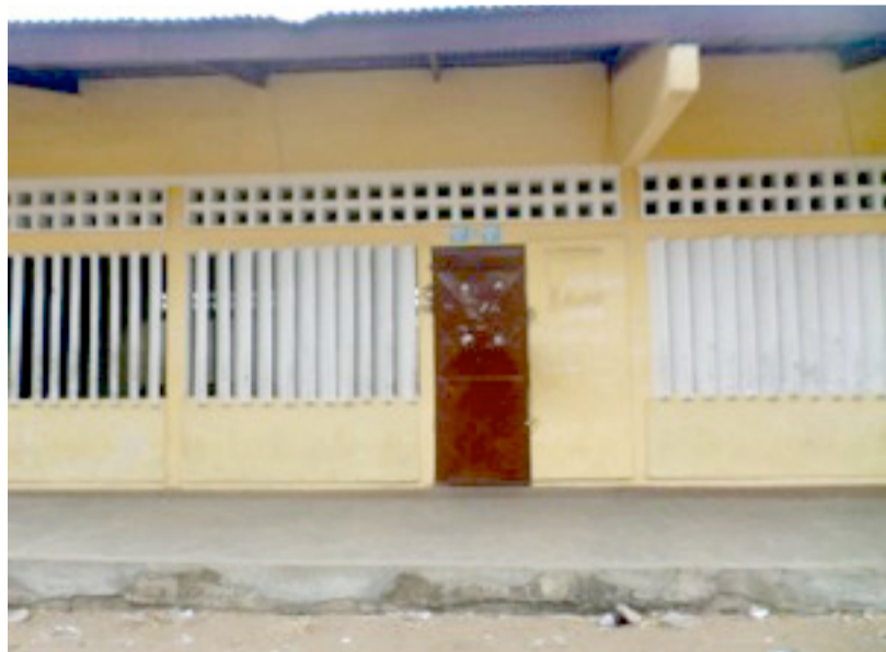
Un des bâtiments abritant le centre d'encadrement de Mbiémo

Initié par le député de Bacongo 1, Préférence Gérald Matsima Kimbembe, le centre d'encadrement pédagogique de l'école primaire de Mbiémo 1 affiche depuis l'année dernière des résultats satisfaisants aux différents examens d'Etat.