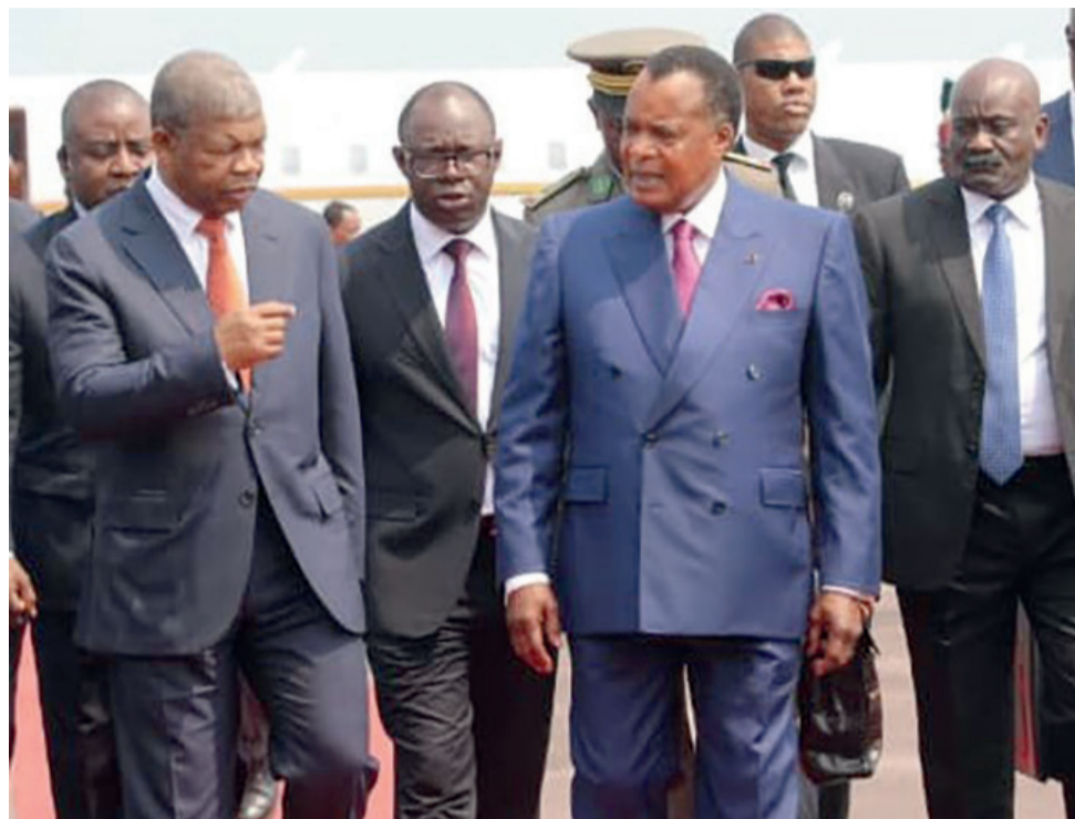
Les présidents congolais et angolais en tête à tête à Oyo, le 31 août