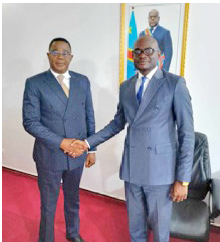
Le président international du Festim Afrique posant avec l'ambassadeur de la RDC en République du Congo

En ce qui concerne les préparatifs sur la tenue de Festim Afrique à Kinshasa, le comité d'organisation devrait tout d'abord transmettre et faire signer le contrat de collaboration. « Pour le moment nous