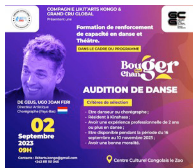
Audition de danse ce samedi 2 septembre au Centre culturel Le Zoo