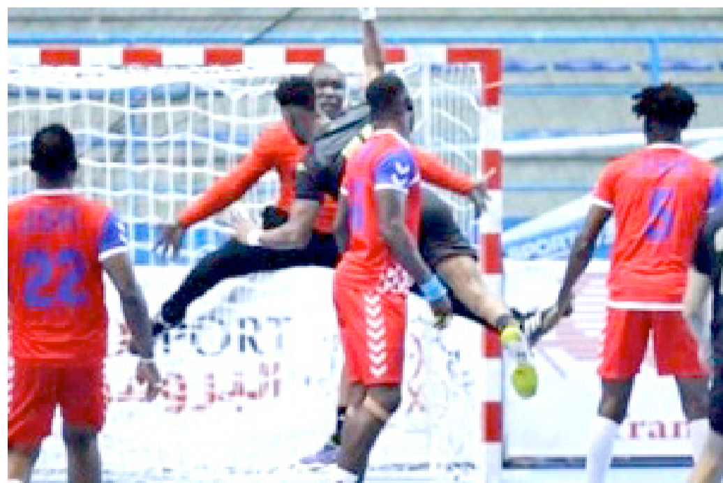
Vue d'un match de handball de la Jeunesse sportive de Kinshasa

Seul club congolais de handball masculin de la République démocratique du Congo qualifié pour la compétition africaine interclubs de la balle dure, la Jeunesse sportive de Kinshasa (JSK) connaît ses adversaires du groupe A. Le tirage au sort des clubs s'est effectué le 28 août à Abidjan en Côte d'Ivoire par la Confédération africaine de handball (Cahb). Le tournoi se déroulera du 28 septembre au 7 octobre à Brazzaville en République du Congo.