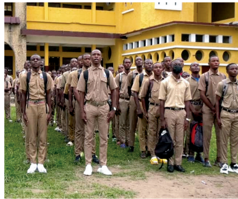
Tenue scolaire uniformisée