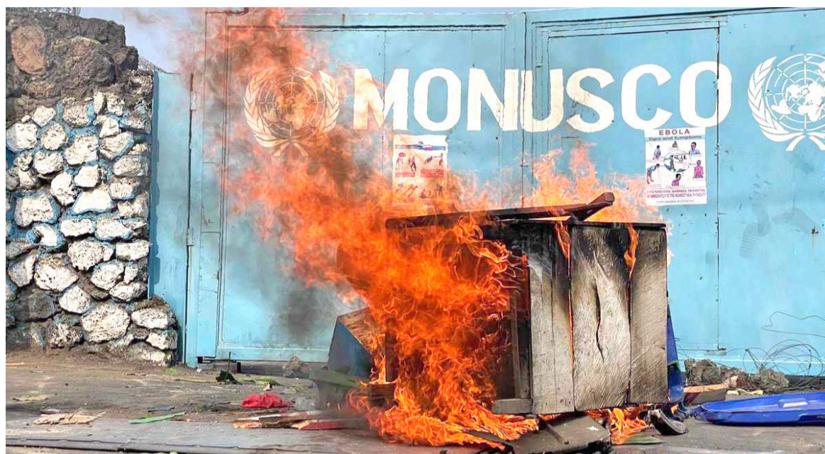
Le feu allumé devant le portail de la Monusco à Goma/DR

L'ONG exige une enquête approfondie et crédible sur ces incidents qui ont fait plus de dix victimes afin que les auteurs de ces crimes soient arrêtés et traduits en justice pour répondre de leurs actes.