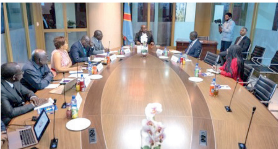
Séance de travail entre le ministre Guy Loando et la SFI