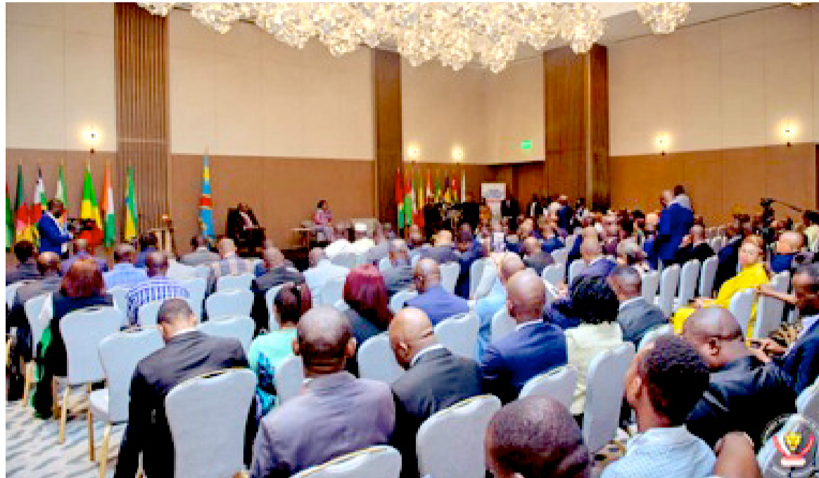
Les participants à la 55 e session du conseil des ministres de l'Ohada

vos États manifestent pour l'atteinte des objectifs que nous nous sommes assignés depuis la signature du traité qui régit notre organisation commune », a-t-il dit. Le chef du gouvernement a, par ailleurs, souligné que la RDC souscrit pleinement à la