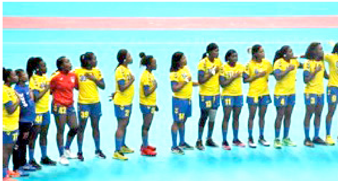
Les Léopards dames handball de la RDC

Le Congo Kinshasa s'est rendu disponible pour abriter cette compétition après le désistement du Cap-Vert qui devait initialement organiser cette joute sportive continentale. La RDC avait été programmée à accueillir la CAN en 2028 comme l'annonçait en avril dernier le président de la Fédération de handball (Féhand) à l'issue de sa réélection à la tête de cette instance nationale de la balle dure. Soulignons que ce sera