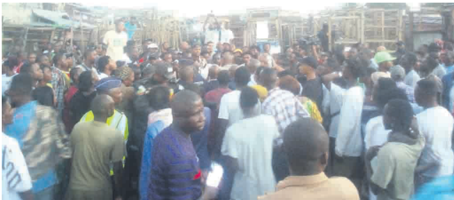
Lancement de l'opération

En effet, l'opération a été lancée en présence de la présidente du Conseil municipal de Pointe-Noire, du président du Conseil départemental de la Sangha, ainsi que des maires de Pokola et de Ouesso et bien d'autres personnalités des collectivités locales ayant assisté au sommet des