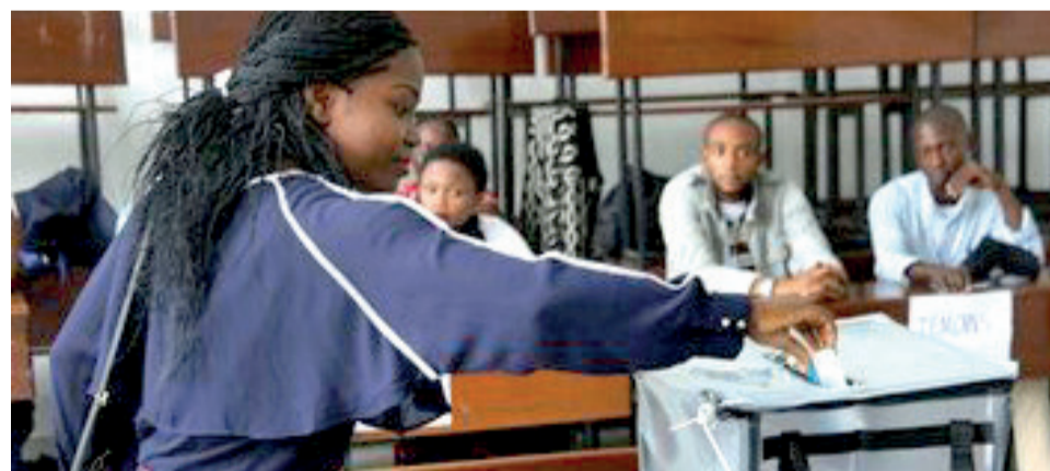
Une congolaise remplissant son devoir civique lors des élections de 2018

Les deux associations notent que le spectre d'une violence intercommunautaire est visible à la veille de l'ouverture des audiences de la Cour constitutionnelle siégeant en matière de contentieux de candidatures à l'élection présidentielle. Et