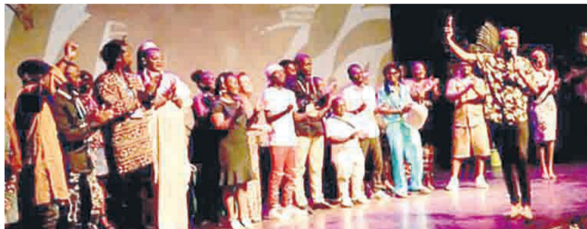
Des artistes à l'ouverture du festival Tuseo 2023

Un autre joyau de la première soirée de Tuseo 2023 fut Jojo la légende. Artiste humoriste congolais, Jojo ne passe pas inaperçu. D'abord en raison de sa petite taille facilement