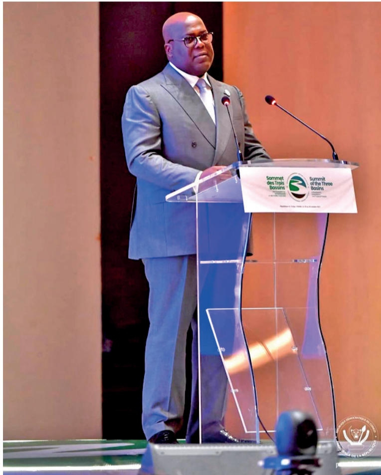
Le président Félix Tshisekedi à la tribune du sommet de Brazzaville

Tout en saluant l'initiative des trois grands massifs forestiers qui réunissent à eux seuls 80 % de la biodiversité mondiale