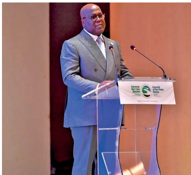
Le président Félix Tshisekedi à la tribune du sommet de Brazzaville

Au cours de son intervention au sommet de Brazzaville consacré aux trois grands bassins forestiers tropicaux mondiaux, le président Tshisekedi a dénoncé, samedi, l'activisme armé du Rwanda qui détruit la biodiversité congolaise du parc de Virunga. D'un ton ferme, il a chargé le régime de Kigali qui pille les richesses minérales congolaises.