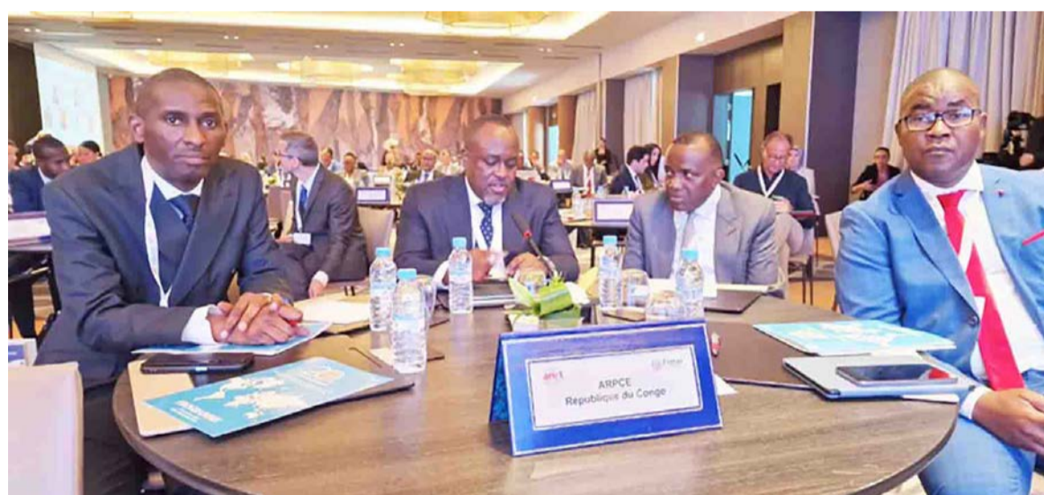
Le DG de l'ARPCE (au centre) avec une partie de la délégation congolaise

La réunion de Rabat, organisée sur l'invitation de l'Agence nationale de réglementation des télécommunications (ANRT) du royaume du Maroc, s'est donc penchée sur un objectif clair, celui de veiller à une meilleure prise en compte des intérêts des utilisateurs.