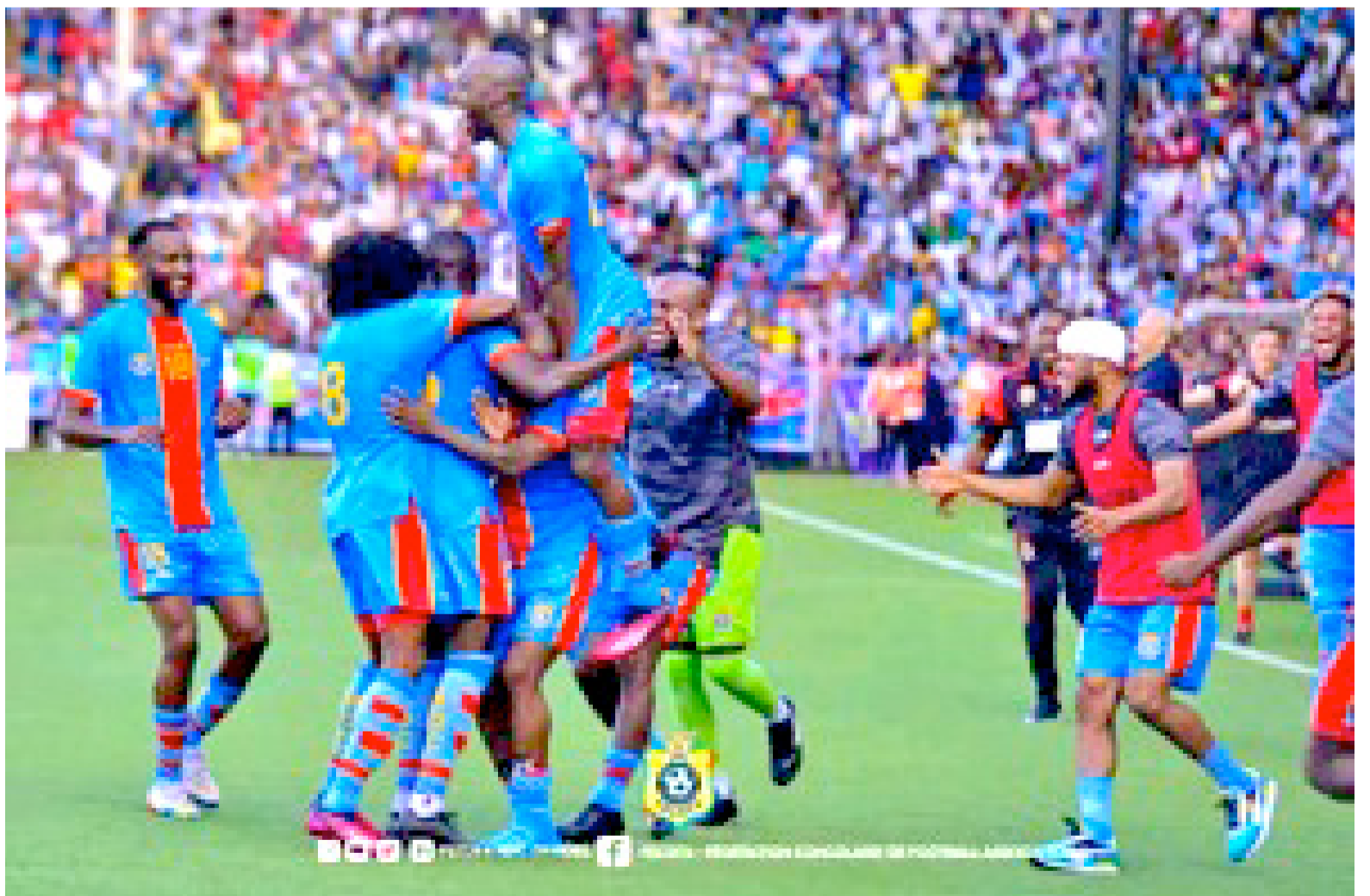
Les Léopards de la RDC

Outre la RDC, le Soudan recevra, trois jours plus tôt sur la même aire de jeu de Benina, le Togo en première journée des éliminatoires. Les Léopards de la RDC joueront le 15 novembre en première journée au stade des Martyrs de Kinshasa contre les Mourabitounes de la Mauritanie. En effet, la Confédération africaine de football a récemment autorisé l'organisation de cette confrontation au stade des Martyrs