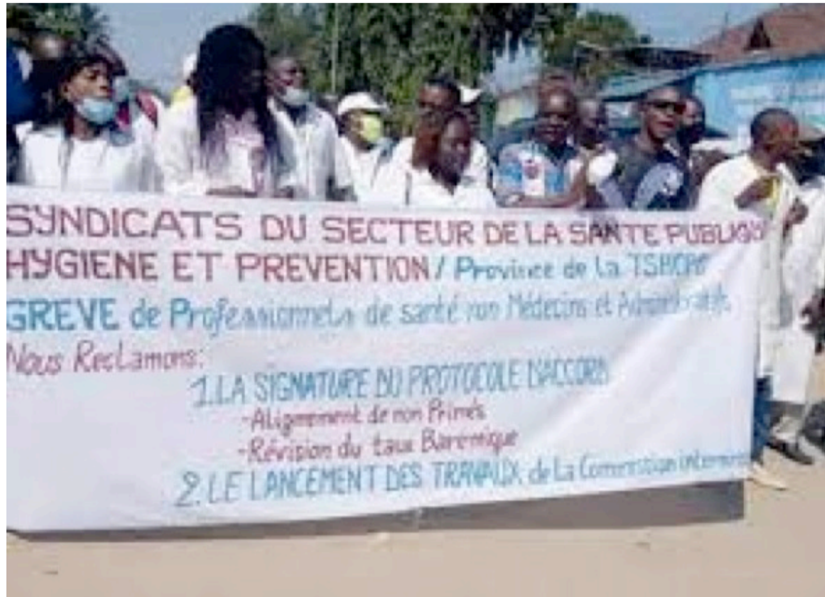
Des professionnels et administratifs de santé pendant leur mouvement de grève

Les organisations syndicales des professionnels et administratifs de la santé ont, cependant, fustigé des menaces proférées à leurs membres, qui ont participé à ce mouvement de grève commencé il y a plusieurs mois. « De