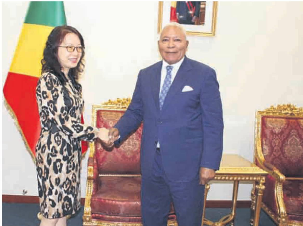
Li Yan reçue par Isidore Mvouba/Sylvestre Nkouka

Reçue en audience le 3 novembre à Brazzaville par le président de l'Assemblée nationale, Isidore Mvouba, l'ambassadrice de Chine au Congo, Li Yan, a souligné la nécessité de renforcer la coopération parlementaire entre les deux pays.