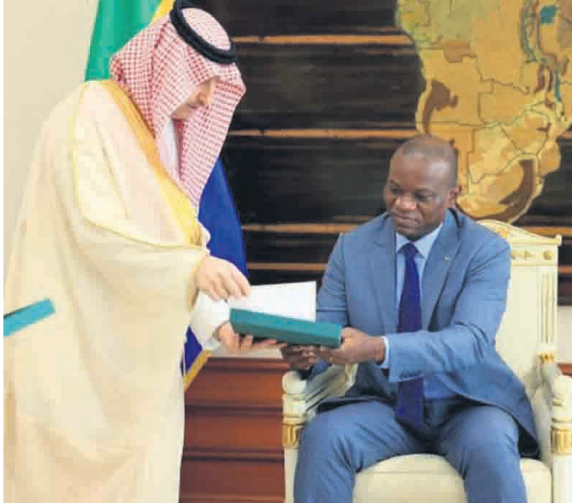
Brice Clotaire Oligui Nguema recevant des mains de Farraj Bin Nader l'invitation du roi Salmane

En attendant certainement d'aborder le sujet sur place avec le roi ou ses proches collaborateurs, Brice Clotaire Oligui Nguema a dit avoir évoqué, lors de son échange avec le diplomate saoudien, la question d'un éventuel « renforcement des relations de coopération entre nos deux pays ». En effet, le président de transition et son hôte ont