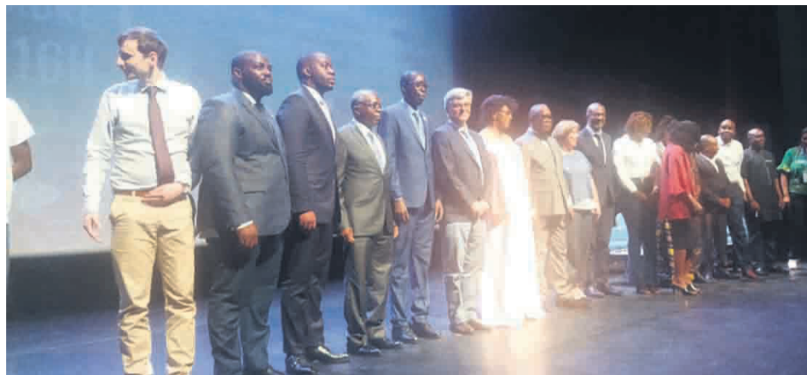
Les officiels posant ensemble à l'ouverture de la cérémonie Adiac

Développant la thématique, les organisateurs ont exhorté les jeunes à prendre leur destin en main en s'impliquant pleinement dans la gestion durable et efficiente des écosystèmes naturelles, afin de