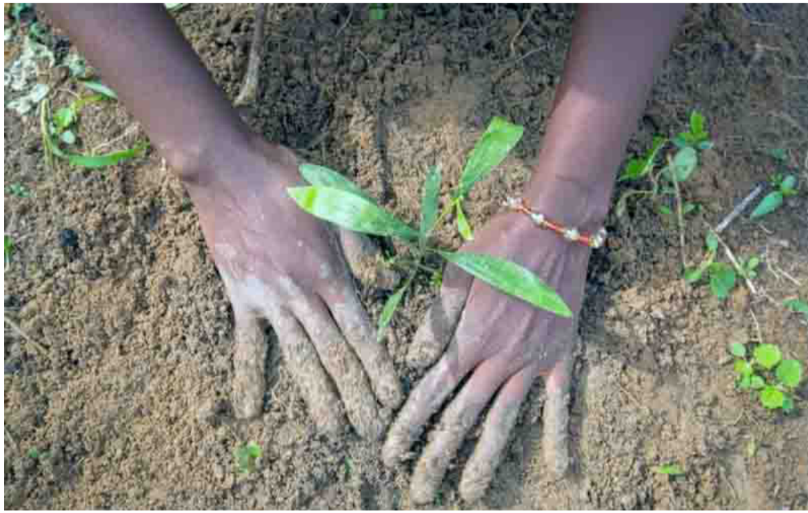
Le planting d'arbres

« Les érosions que nous vivons dans nos quartiers et dans nos villes grignotent de plus en plus nos terres, emportent nos ressources précieuses et menacent notre sécurité. Nous devons donc reconnaître que lutter contre les érosions est un défi qui exige la collaboration de tous. Il nous revient, par élan de survie, de renforcer