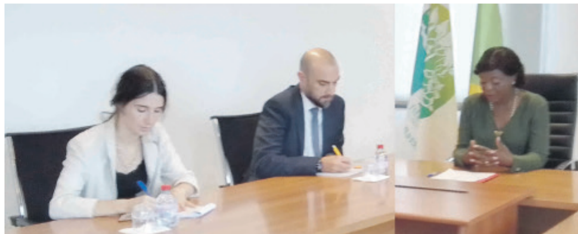
travaux de reconnaissance pour doter les tourbières d'un statut juridique qui permettra leur protection et leur valorisation

Le PUDT vise notamment à appuyer le Congo dans le développement d'un cadre d'aménagement durable du territoire, permettant de sécuriser les domaines forestier, agro-pastoral ainsi qu'halieutique, et mieux comprendre le complexe de tourbières tropicales congolaises. « Le ministère de l'Environnement a un rôle central à jouer dans cette dynamique. Nous avons pu définir avec la ministre les prochaines étapes qui portent sur les tourbières, la poursuite des