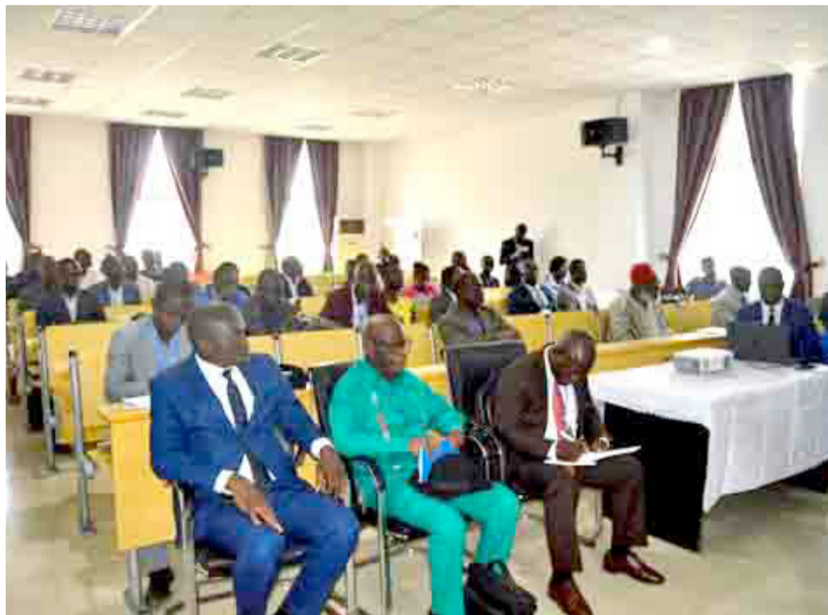
Les participants au colloque

En trois jours, plus de cinquante communications seront développées. Noms propres : lieu et histoire ; Noms propres : constructions des identités ; Noms propres : diversités sociales et ethniques ; Noms propres dans la créativité