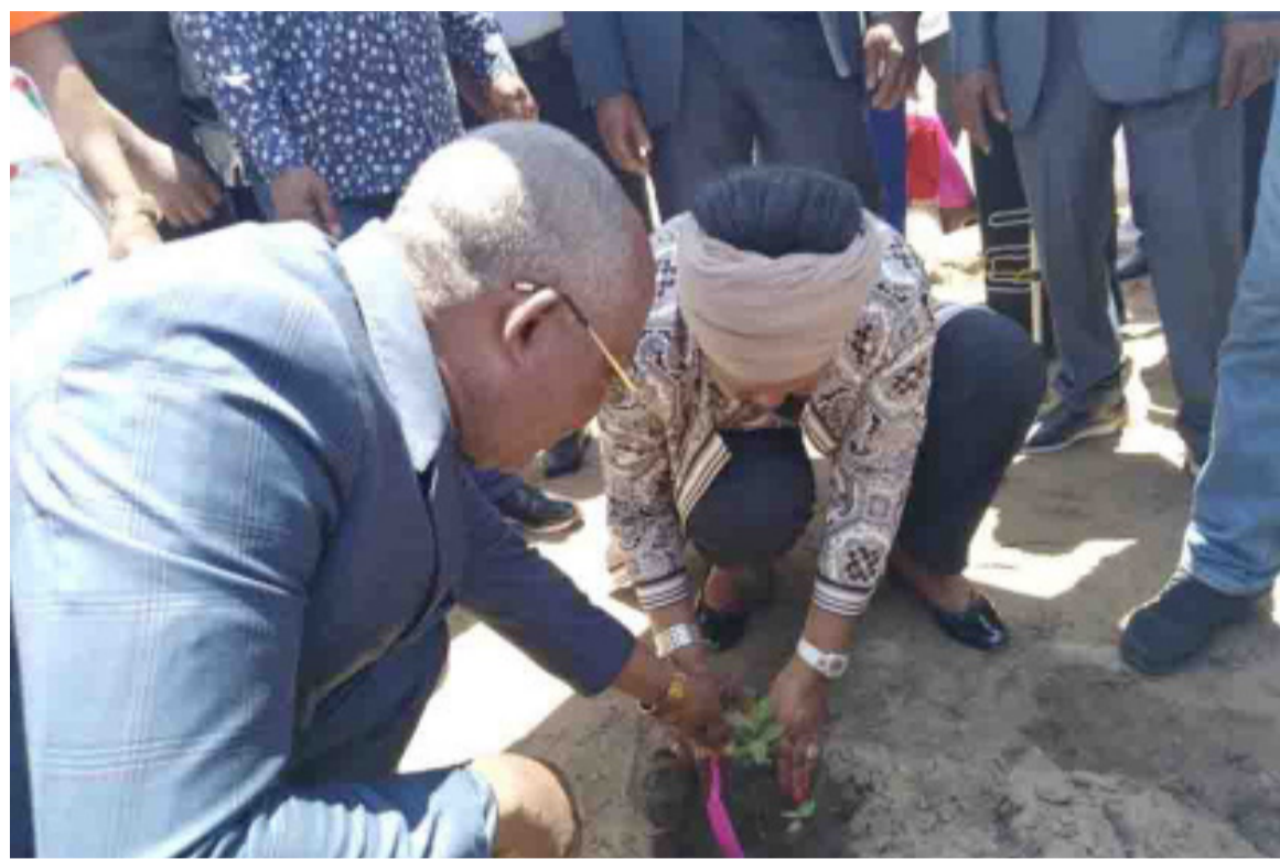
Antoinette Sassou N'Guesso procédant au planting d'arbres