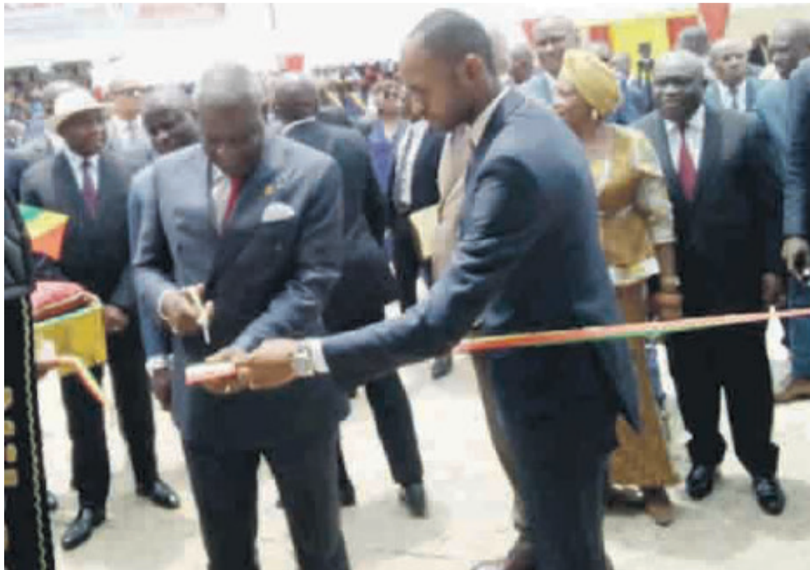
Le Premier ministre coupant le ruban symbolique

Une zone administrative composée d'un bâtiment de 153,28 m 2 avec des bureaux, une salle de professeurs et les latrines modernes de trois cabines ; un bloc de latrines à quatre cabines avec séparation filles et garçons. Une zone d'astreinte comprenant un bâtiment plain-pied destiné au personnel administratif, composé de trois logements modernes bâtis sur une superficie de 230,50 m 2 . A cela s'ajoutent un forage fonctionnel, un mât, un mur mitoyen entre l'école primaire et le lycée.