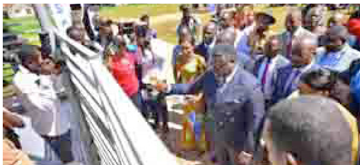
Coupure du ruban symbolique