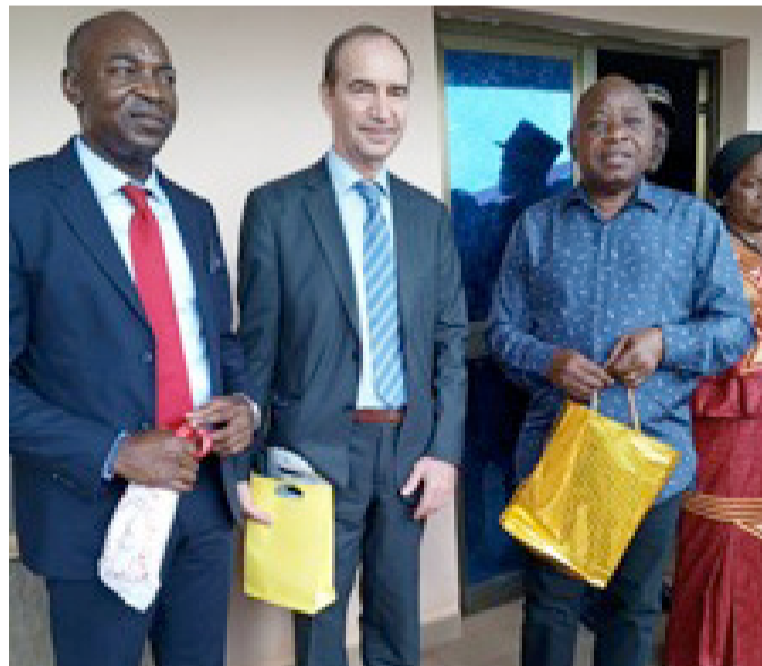
L'ambassadeur d'Allemagne posant avec le préfet de la Bouenza à sa gauche et le président du groupe de liaison Afrique Europe/Adiac

Mouyondzi, a-t-il dit, est l'une des localités qui travaille en agrumes et denrées de première nécessité pour alimenter les grandes villes à l'instar de Brazzaville et Pointe-Noire qui disposent des marchés spécifiques tels que le Marché de PK et celui de Fond Tié-Tié. Cette grande activité de production souffre cependant d'un manque d'unités de transformation. Ce qui entraîne des pertes considérables de production des agrumes (oranges, mangues, etc.).