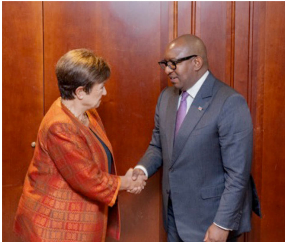
Le Premier ministre Sama Lukonde et la directrice générale du FMI, Kristalina Georgieva

Le Premier ministre a également dit profiter de différentes rencontres bilatérales pour appeler à plus d'investissements dans des secteurs novateurs où la RDC propose ses multiples ressources