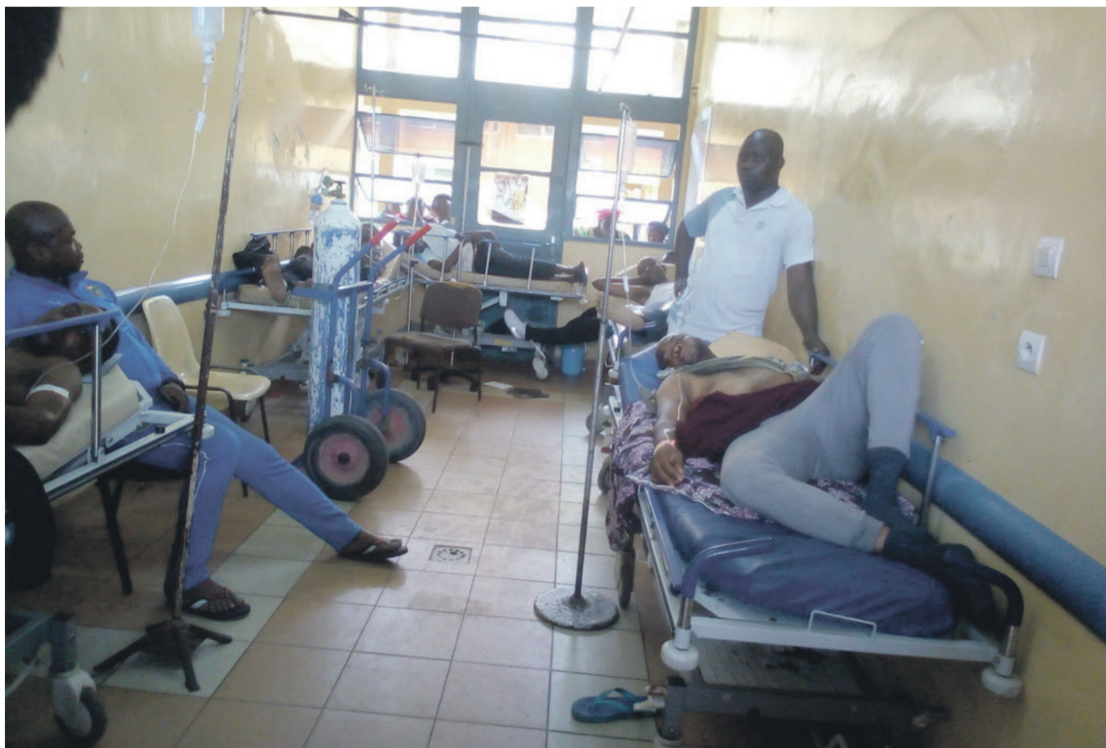
Une vue des blessés admis au CHU Adiac

A l'hôpital, ils étaient 64 blessés dont deux ont succombé de leurs blessures. Actuellement, seul un jeune homme qui a subi un traumatisme crânien y est hospitalisé. Reçue à la morgue municipale de Brazzaville par le directeur de cette structure, Yvon