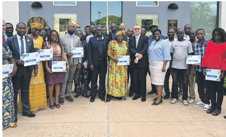
Les bénéficiaires posant avec l'ambassadeur Eugène Young

Il a expliqué que les subventions du Fonds d'auto-assistance de l'ambassadeur et du Programme de petites subventions du département de la diplomatie publique font partie des programmes