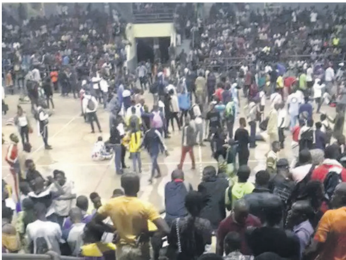
Les prétendants au recrutement au stade d'Ornano./FR

Le bilan pourrait donc s'alourdir parmi les victimes, hommes et femmes, dont l'âge varie entre 18 et 25 ans. Selon les témoignages, la bousculade a eu lieu le 20 novembre autour de 23 heures. Les prétendants au recrutement lancé par les Forces armées congolaises (FAC) avaient résolu de passer nuit au stade d'Ornano pour figurer parmi les premiers à être reçus tôt le lendemain. L'espace d'entrée ne pouvant pas contenir la masse des candidats qui se sont bousculés, ceux qui sont tombés ont été piétinés par d'autres entraînant morts, blessés et fracturés. Certains blessés encore en vie sont pris en charge au Centre hospitalier et universitaire de Brazzaville et à l'hôpital central des armées Pierre-Mobengo.