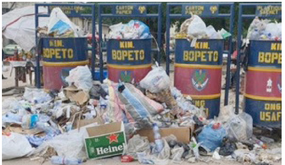
Des poubelles de l'opération «Kin Bopeto»