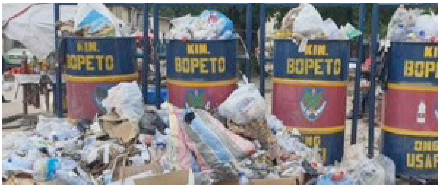
Des poubelles de l'opération «Kin Bopeto»

Le ministre de l'Industrie, Julien Paluku, et le gouverneur de Kinshasa, Gentiny Ngobila Mbaka, ont présidé, le 20 novembre, la première réunion de la task force sur la gestion et la valorisa-