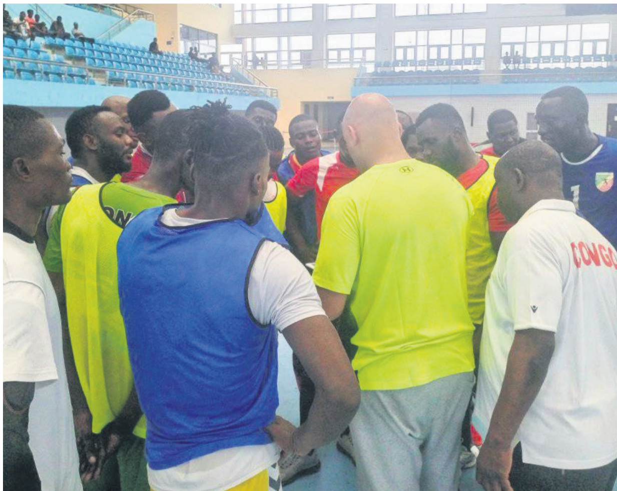
La sélection nationale du Congo après une séance d'entraînement

« Tous ici, nous sommes animés par l'esprit du patriotisme et nous voulons vraiment honorer le Congo à travers cette compétition. La fédération nous a mis dans le bain et nous travaillons dur pour rendre fier notre pays. Il va falloir que le gouvernement soit déjà à nos côtés afin que le travail soit bien fait. Du côté des dames, les choses bougent, nous voulons faire mieux afin de hisser le Congo parmi les meilleurs. Il est temps que toutes les conditions soient réunies », a indiqué un joueur.