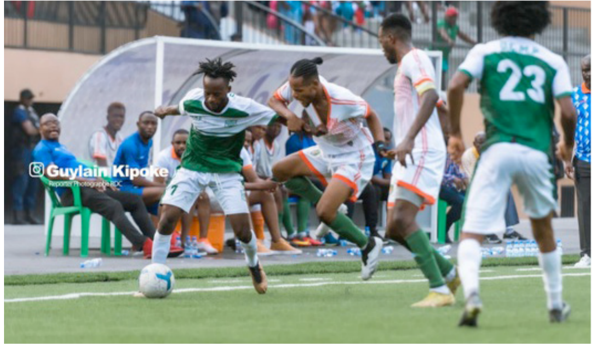
Vue du match entre DCMP et Renaissance du Congo.