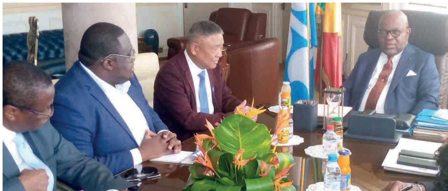
Le ministre des Hydrocarbures recevant la délégation de Yunnan/Adiac

Le nom du groupe Yunnan Linkun revient dans plusieurs projets dans le domaine de l'énergie et des infrastructures au Congo, notamment la construction du barrage hydroélectrique de Sounda (800 à 1 000 MW), dans le département du Kouilou; la construction d'une centrale hydroélectrique de 30 MW à Ngokeli, dans le district d'Okoyo; et d'une autre centrale de 20 MW à Motaba, dans le dé-