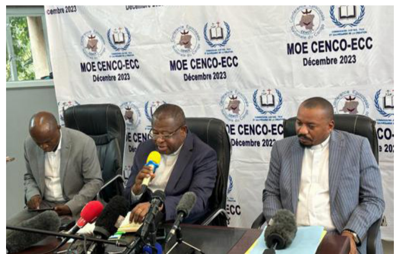
La MOE CENCO-ECC lors de la publication de son rapport d'observation électorale