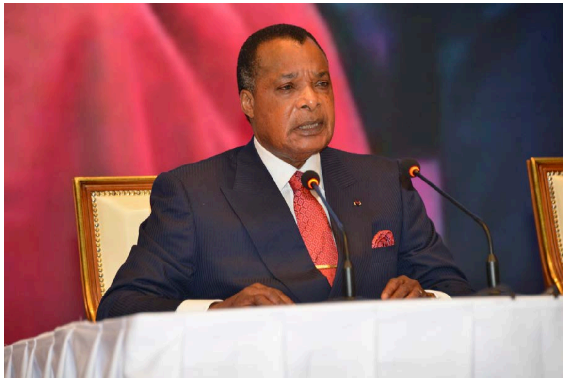
Le président de la République délivrant son discours

Après avoir décrété 2024 année de la jeunesse dans son message de vœux à la Nation, le 31 décembre 2023, le président de la République est revenu sur le sujet devant les forces vives de la Nation et les corps constitués nationaux. Il a, en effet, enjoint le gouvernement de prendre la juste mesure de