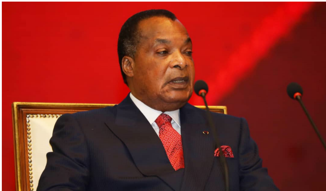
Le président de la République lors de son discours

À l'occasion de l'échange de vœux, le 5 janvier, au Palais des congrès de Brazzaville, avec les corps constitués nationaux, Denis Sassou N'Gusso a récusé la vague de « slogans sans suite » et instruit le gouvernement à prendre des mesures courageuses pour s'attaquer aux problèmes auxquels les Congolais sont confrontés.