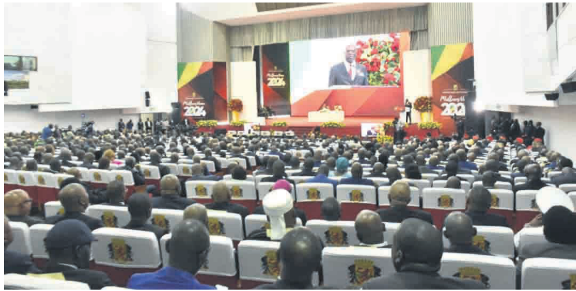
Une vue de la salle DR

S'appuyant sur le Plan national de développement 2022-2026, le programme qui s'inscrit dans le cadre de la mise en œuvre des instructions du chef de l'Etat, Denis Sassou N'Gusso, qui a décrété 2024 année de la jeunesse, permettra également au gouvernement de renforcer les structures existantes comme le Fonds d'impulsion, de garantie et d'accompagnement; le Fonds national d'appui à l'employabilité et à l'apprentissage; et l'Agence congolaise pour l'emploi. « A travers l'expérience en cours des Zones agricoles protégées, nous sommes convaincus que nos jeunes qui rêvent d'un avenir meilleur vont s'adonner à la vocation agropastorale. Ils sauront capter; à leur tour; une part considérable des centaines de milliards de francs CFA, consacrés annuellement à l'importation des vivres ou produits alimentaires », a déclaré le chef du gouvernement. Pour Anatole Collinet Makosso, la création du Centre africain de recherche en intelligence artificielle devrait conduire les jeunes congolais à mesurer la portée de ce choix et à s'approprier par le travail les retombées inhérentes au développement multiforme de l'économie numérique. « Nos jeunes doivent savoir que la valorisation de nos tourbières et de nos forêts en crédit carbone présente un fort potentiel en matière d'énergies propres, un poten-