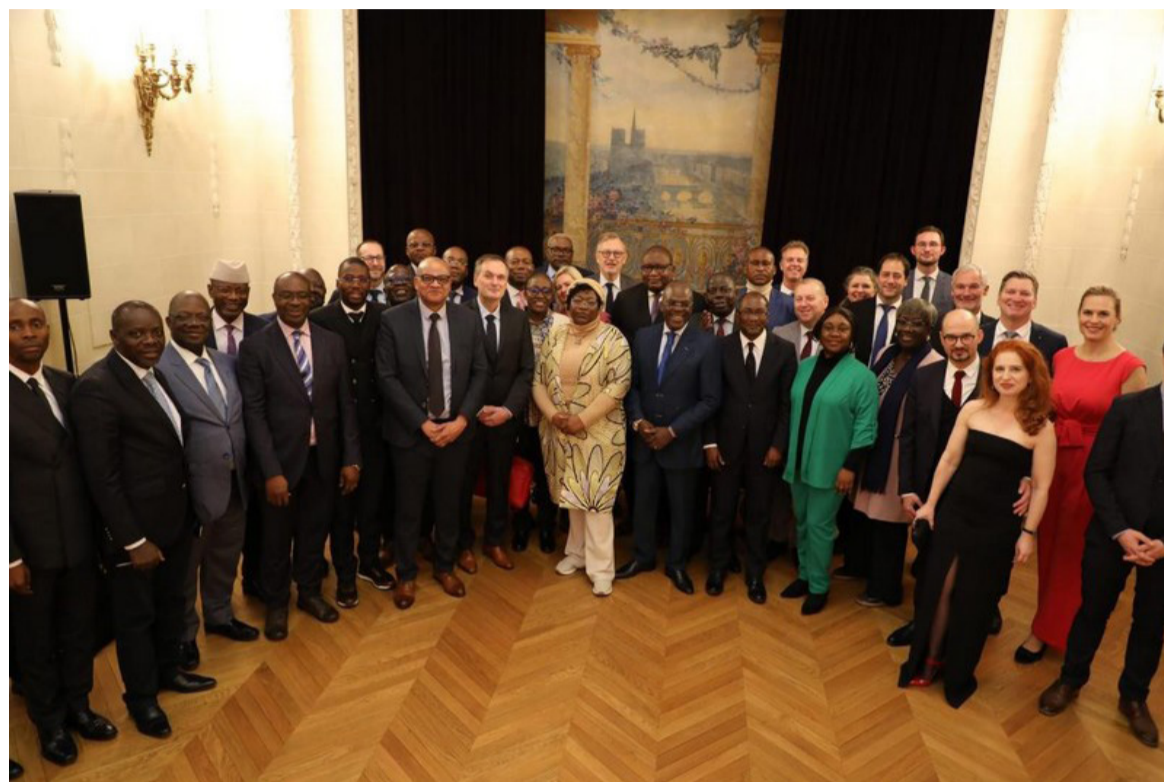
La photo de famille des participants à l'assemblée générale et aux assises du quatrième forum de l'Apref, Paris Ecole militaire, décembre 2023

Par la suite, une délégation composée de dix membres s'est rendue à l'assemblée générale et aux assises du quatrième forum de l'Apref. Parmi les délégués, les préfets, inspecteurs et directeurs généraux, ainsi que les préfets et secrétaires généraux des départements ayant participé, exceptionnellement avec voix délibérante, aux différentes rencontres statutaires (assemblée générale et réunions de l'exécutif). À l'issue de cette participation, le ministère de l'Intérieur du Congo est désormais membre institutionnel de l'Apref, rejoignant ainsi, entre autres,