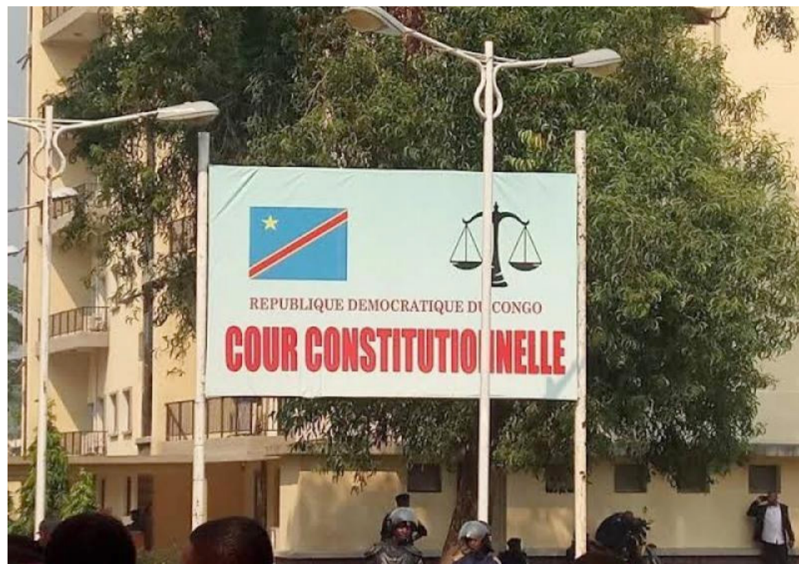
La Cour constitutionnelle appelée à examiner des cas d'irrégularités lors des élections de décembre 2023.

La Mission d'observation électorale des églises catholique et protestante (Moe Cenco-Ecc) a salué, dans un communiqué du 4 janvier, les efforts consentis par la Commission électorale nationale indépendante (Céni) dirigée par Denis Kadima et le gouvernement congolais, qui ont réussi l'organisation des élections générales du 20 décembre 2023.