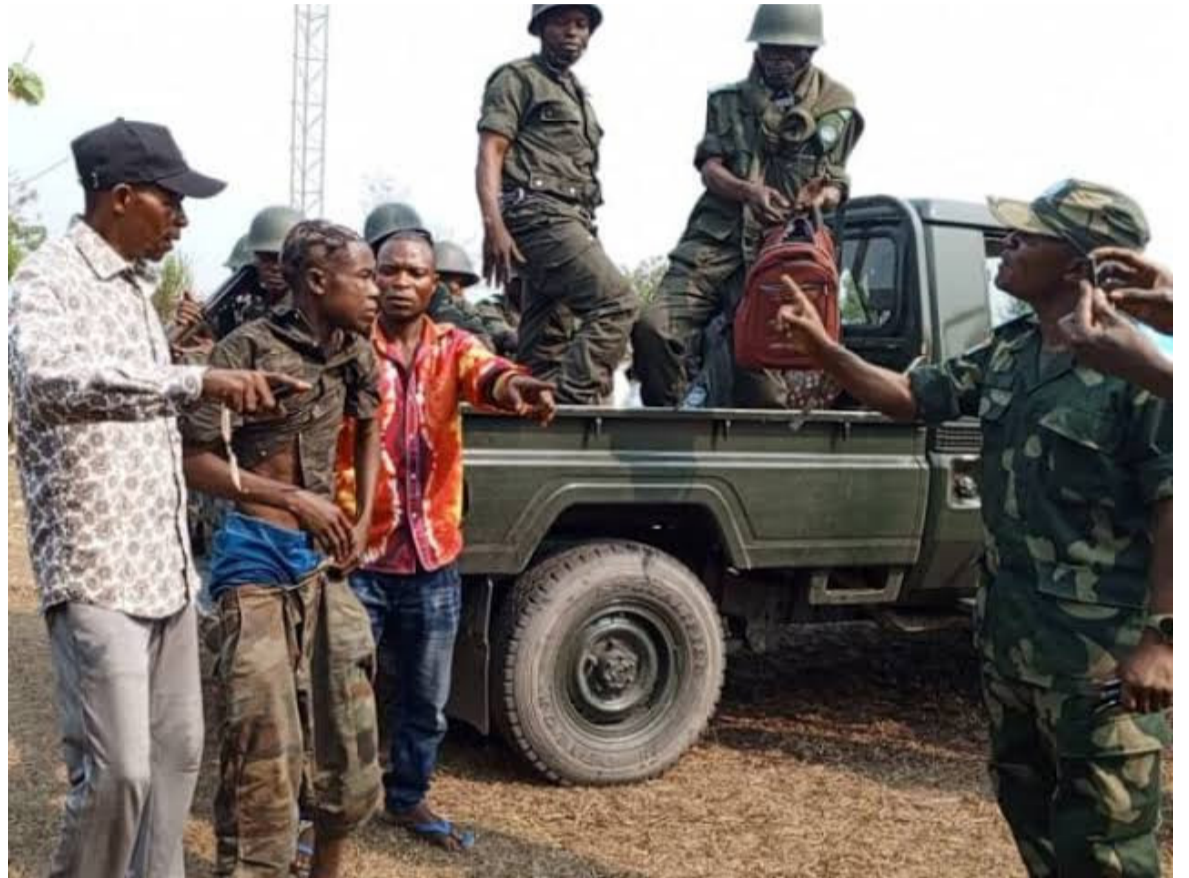
Un membre de la milice Mobondo attrapé par les FARDC à Kwamouth

Et une autre d'ajouter : « Grâce à Dieu, nous avons échappé à la mort lors de cet affrontement entre les Mobondo et les FARDC. Il y a eu des échanges des balles très nourris, comme dans des films de guerre. Nous l'avons vécu en live, sans pouvoir le supporter; des véhicules