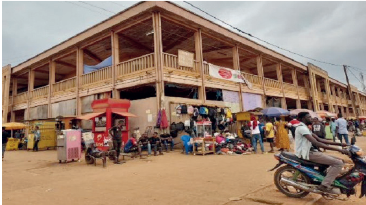
Une vue du marché central

Le chef lieu du département du Niari, Dolisie, entreprend les travaux du déguerpissement du domaine public autour du marché central.