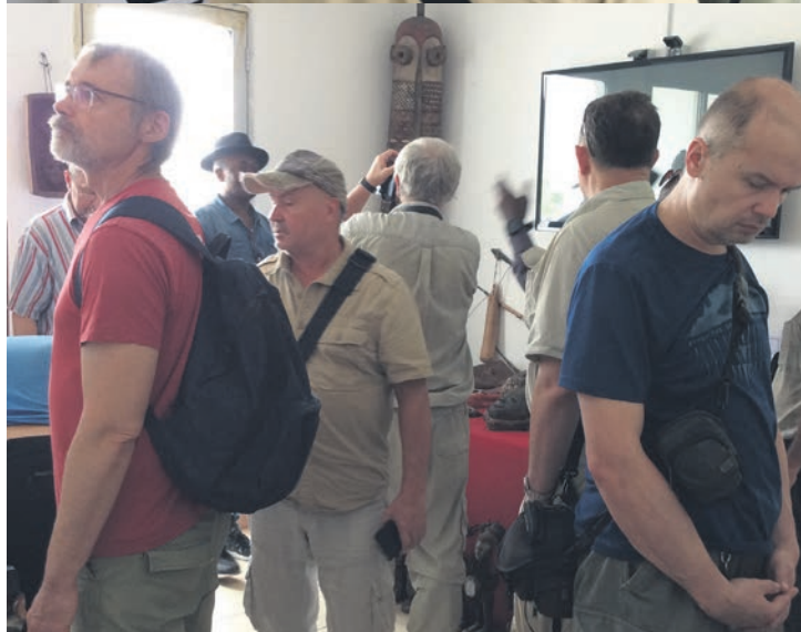
Une délégation des touristes tchèques et slovaques venant du parc d'Odzala a visité, le 16 janvier 2024, le Musée Galerie du Bassin du Congo à Brazzaville.