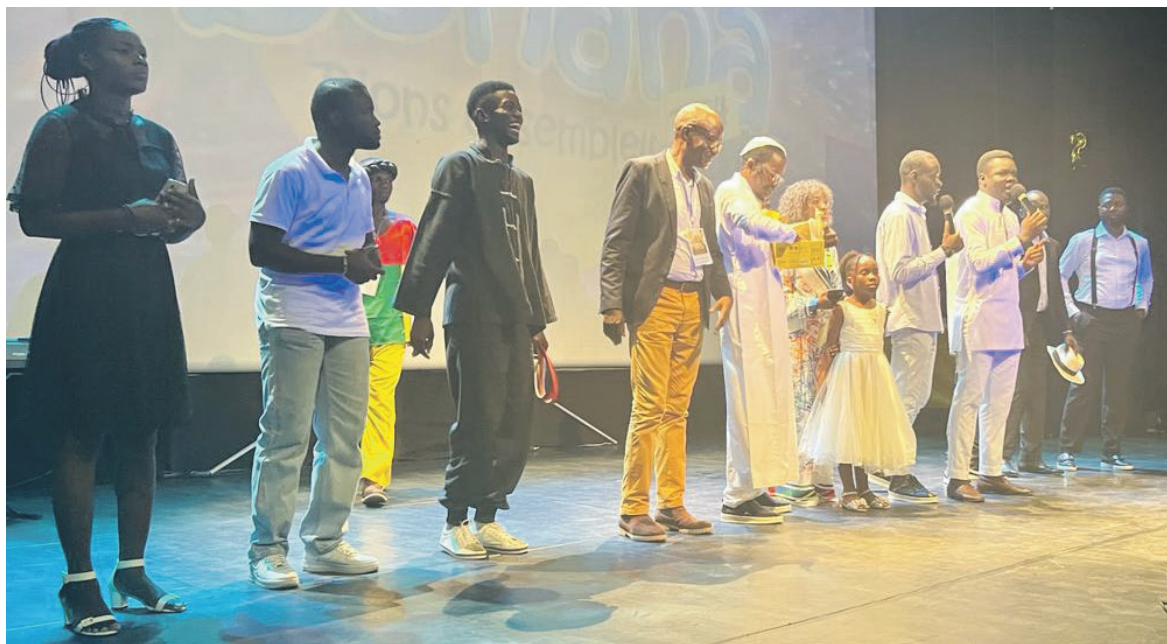
Les humoristes ayant presté à la dernière soirée de Bonana 2024 Adiac

Ouverte le 12 janvier, la 8e édition du festival Bonana s'est clôturée en beauté le 13. Entre rire et performance scénique, les dix artistes au programme ont fait valoir leur créativité et leur talent à travers des shows hilarants.