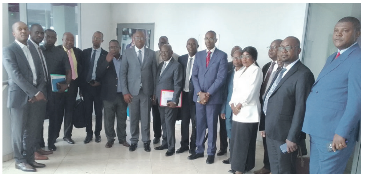
La photo souvenir

Malheureusement, après quatre ans de mise en œuvre, le taux de décaissement n'est que de 4,52%. « Les difficultés que le projet a connues a plutôt permis à ce que les différents ministères sectoriels prennent à bras le corps le projet. D'ailleurs, dans la conception du PTBA 2024, la plupart des actions à mener se font en collaboration avec les ministères sectoriels. Le Prodivac dans sa mise en œuvre 2024 sera le témoignage d'une