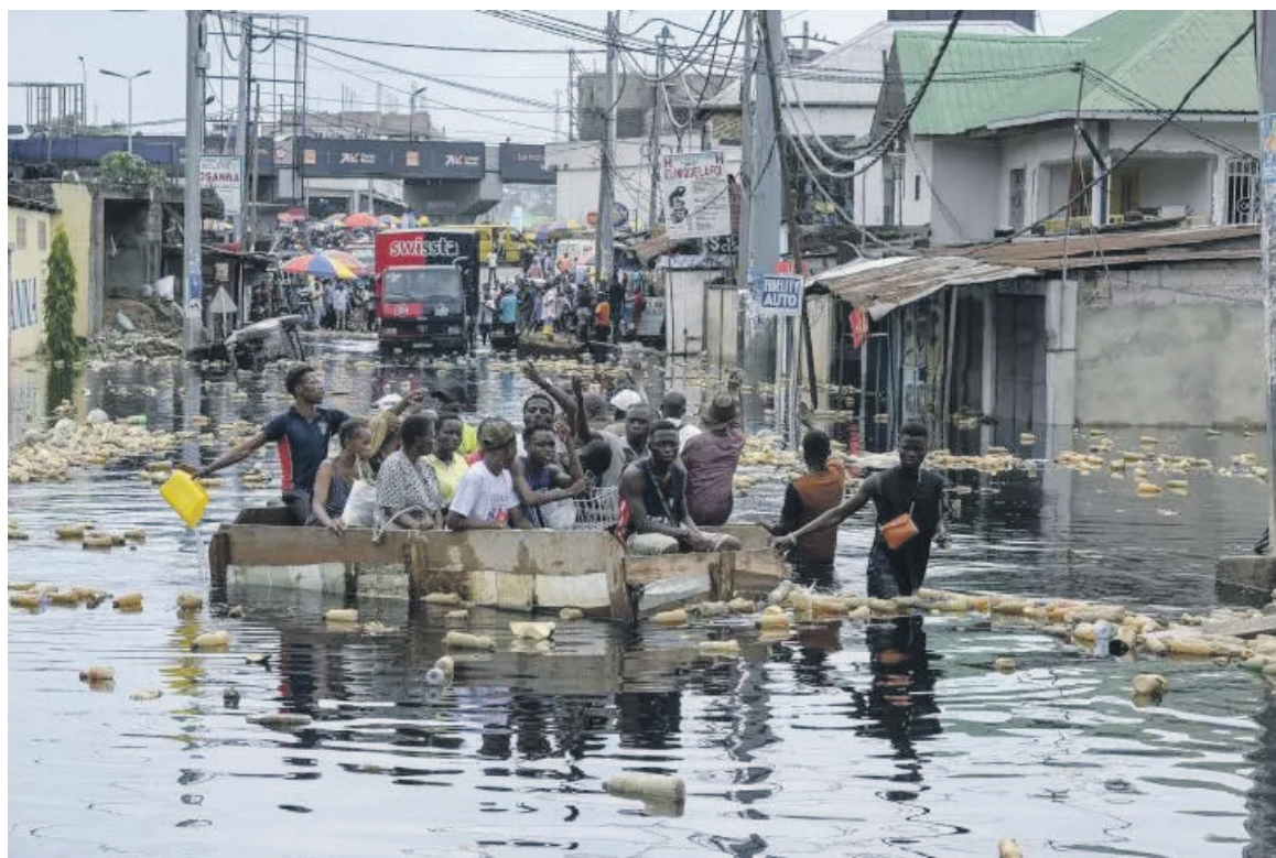
Des habitants traversent en pirogue un pont submergé par la crue du fleuve Congo, dans le district Pompage, le 9 janvier 2024 à Kinshasa, en RDC

Du côté du gouvernement, la question a constitué l'un des thèmes majeurs de la déclaration du président Tshisekedi au cours du 121e Conseil des ministres. Dans sa lecture du compte rendu, le porte-parole du gouvernement a annoncé le processus de décrue du fleuve Congo depuis le 11 janvier. Toutefois, il faudra du temps pour que le cours d'eau revienne