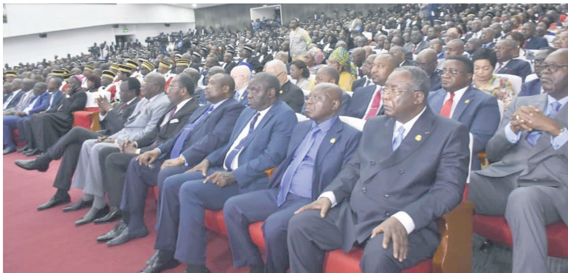
Une vue de la salle

Evoquant les données statistiques des juridictions d'instance et d'appels, il a annoncé que les cinq Cours d'appel ont jugé au total 1938 affaires en 2023, un travail insuffisant par rap-