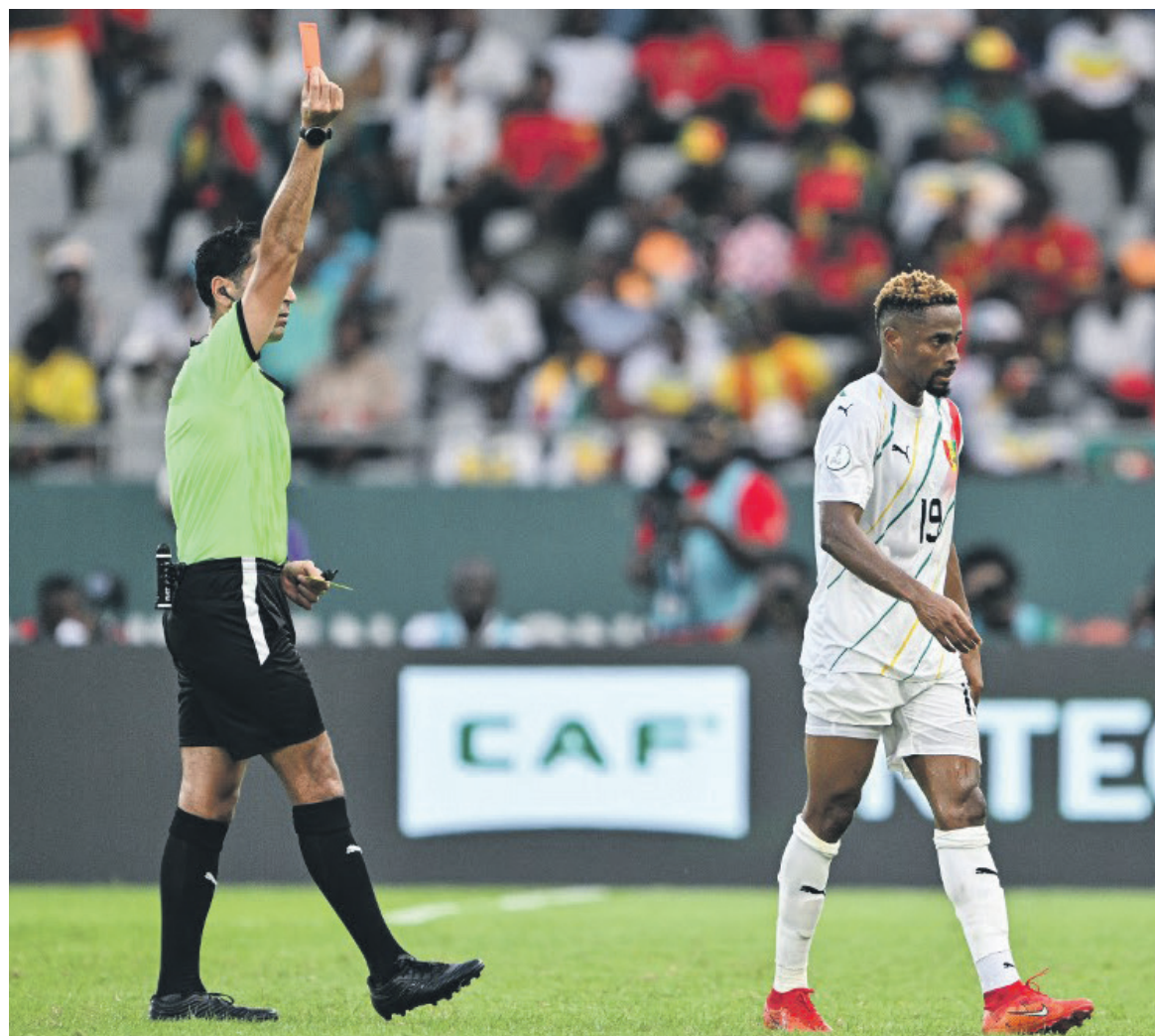
L'expulsion de François Kamano, le tournant du match?

Le scénario devenait cauchemardesque lorsque Mohamed Bayo ouvrait le score à la 10e min.