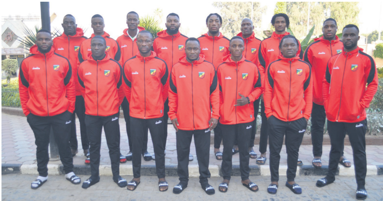
Les joueurs du Congo/Adiac

La capitale égyptienne vibrera du 17 au 27 janvier au rythme de la 26e CAN seniors mes-