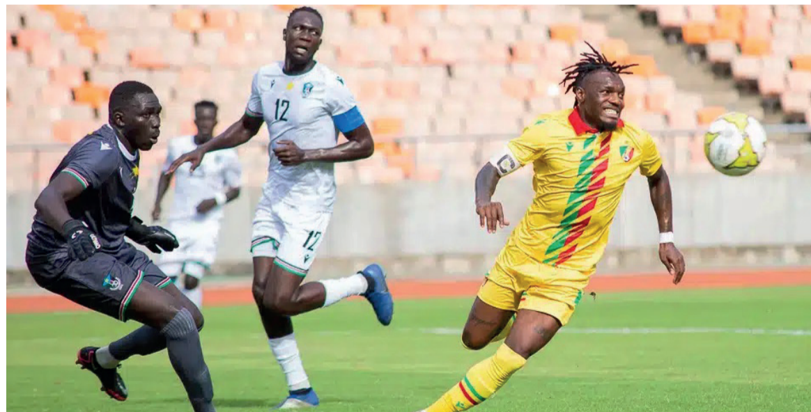
Les Diables rouges lors d'un match de football

Nos athlètes sont les héros qui incarnent l'esprit de victoire. Nous devons les soutenir et les entraîner afin qu'ils excellent tant au