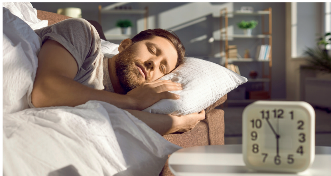
Un homme en plein sommeil

Voici d'emblée ce qu'en pense un spécialiste du sommeil, le Pr Pierre Philip, chef du service de médecine du sommeil du Centre hospitalier universitaire de Bordeaux : « C'est la période de lever qui est la plus importante, car c'est elle qui permet de calculer la "pression idéale de sommeil" pour favoriser un bon endormissement et, idéalement, éviter les éveils nocturnes ». La pression idéale de sommeil, également connue sous le nom de « pression homéostatique », régule la transition entre l'état de l'éveil à celui du sommeil. Elle est fonction du temps écoulé depuis le dernier réveil jusqu'au coucher. La pression de sommeil dépend donc de la longueur de notre journée, c'est-à-dire de la durée d'éveil, et non pas -comme on a tendance à le croire - du niveau d'activité, même si une activité physique est essentielle à un bon endormissement. Évidemment, les facteurs sociaux jouent un rôle crucial. Les pêcheurs, les boulangers, par exemple, n'adoptent pas le même rythme de sommeil que les serveurs, les infirmiers ou les routiers qui travaillent la nuit. C'est l'horloge biologique, réglée selon les gènes de chaque individu, qui détermine si celui-ci est plutôt du matin ou du soir.