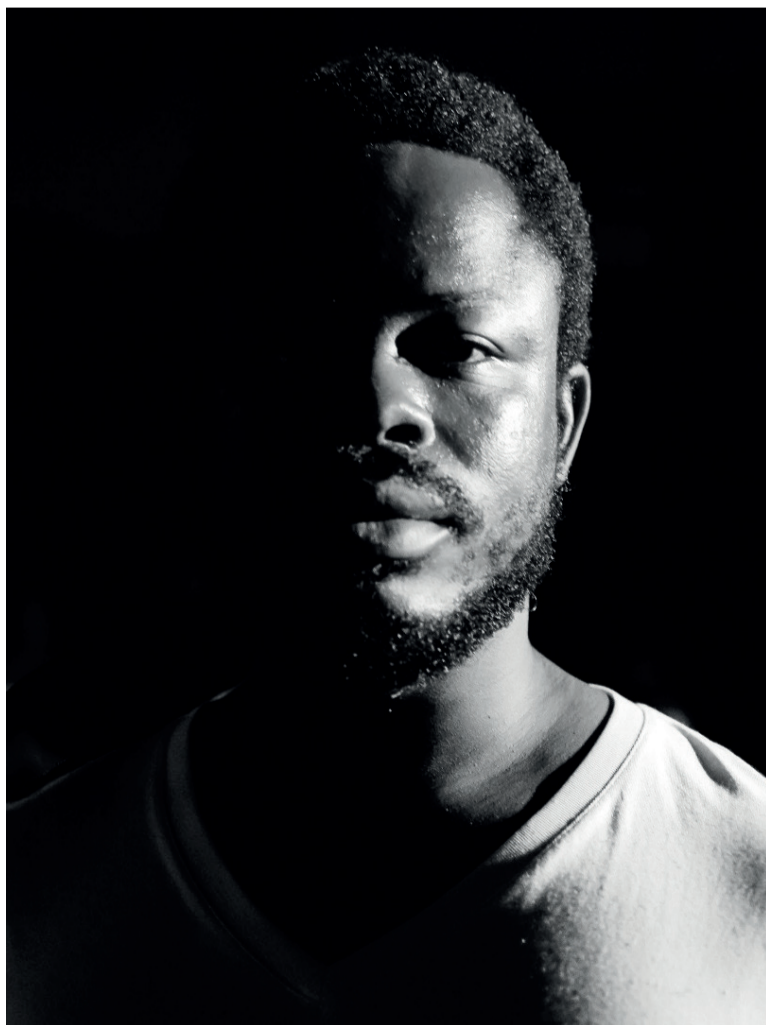
Le photographe congolais Lebon Zed

L.Z. : Il y en a plusieurs parmi lesquelles il faut d'abord définir son sujet ou son intention. Choisir l'équipement adéquat (appareil photo, objectifs, accessoires). Trouver le bon angle et la bonne composition, gérer l'exposition (ouverture, vitesse d'obturation, sensibilité ISO), capturer l'instant décisif, post-traitement et re-