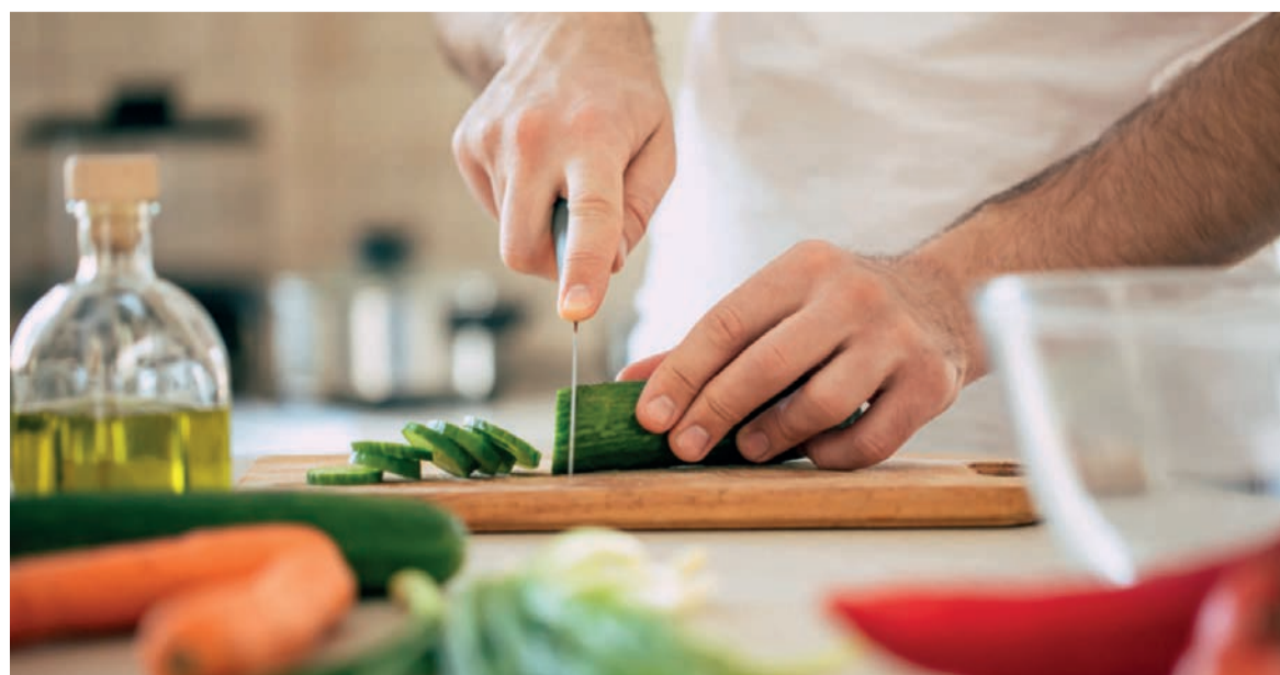
En pleine préparation d'un repas

Il est nécessaire au transport et à l'utilisation de l'oxygène par le sang vers les cellules. De ce fait, il constitue un précieux fournisseur d'énergie à notre orga-