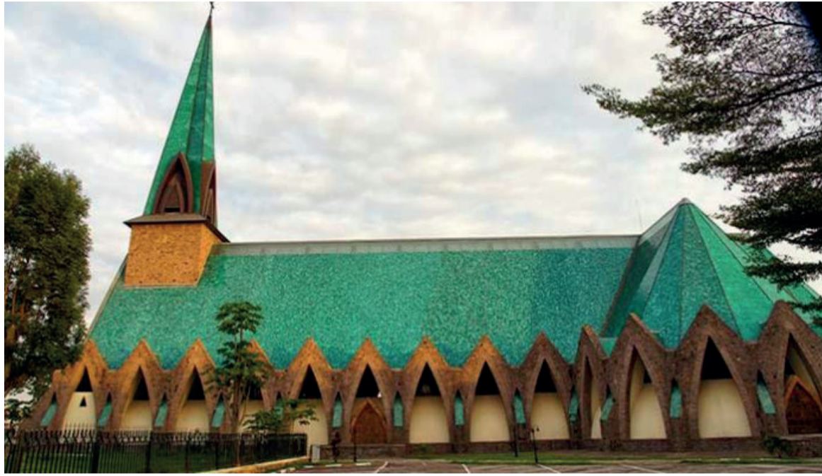
La basilique Saint-Anne du Congo

Brazzaville, à travers le temps, a toujours été un carrefour de croyances et de cultures lui conférant son melting-pot, la mixité de sa population. Ses baptêmes témoignent alors de la rencontre de ces influences culturelles et religieuses. Aussi loin que l'histoire a pu être archivée et transmise, c'est l'époque coloniale qui semble avoir donné à Brazzaville son visage actuel. Une histoire douloureuse faite de sang, de travaux forcés, de déshumanisation de l'Homme noir, Kongolais. C'est alors à tort ou à raison que certains renient la foi «héritée du colon», des pratiques religieuses parfois tout à fait coupées de la spiritualité qui ne reste en substance qu'une relation entre le Créateur et ses créatures. Pour autant, les églises, catholiques en particulier, restent des lieux de refuge, de réconfort, de dévotion, de ressourcement autant spirituel que naturel. On ne saurait si c'est le fait que les innombrables prières de foi ou de désespoir, ces exhal-