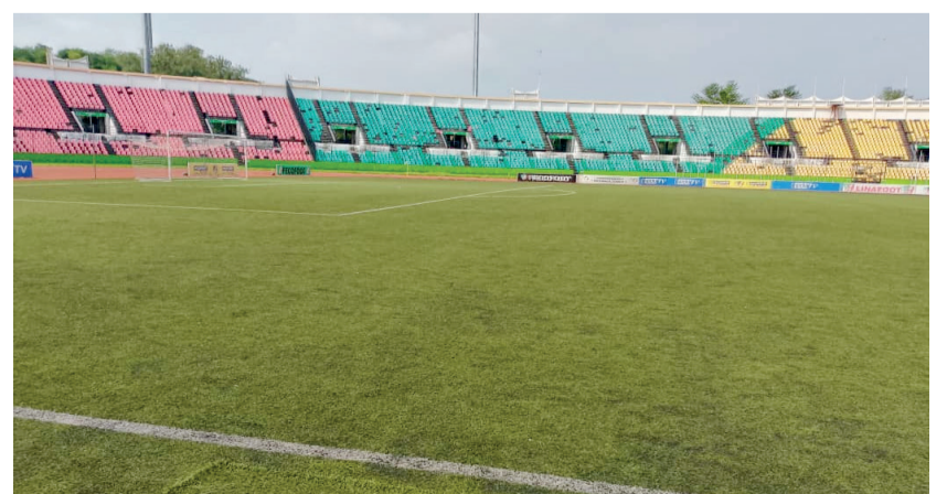
Le stade Alphonse-Massamba-Débat