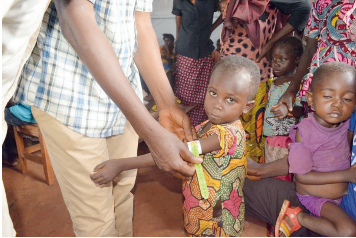
La prise en charge des enfants malnutris

Sur place, tous les enfants malnutris ont été admis dans le programme de prise en charge exécuté par Caritas Kongolo avec l'appui du Fonds des Nations unies pour l'enfance. « La zone de santé de Kongolo a pu récupérer cent quatorze enfants en conflit avec leur calendrier vaccinal. D'autres enfants malades, après avoir été diagnostiqués, ont bénéficié d'une prise en charge sani-