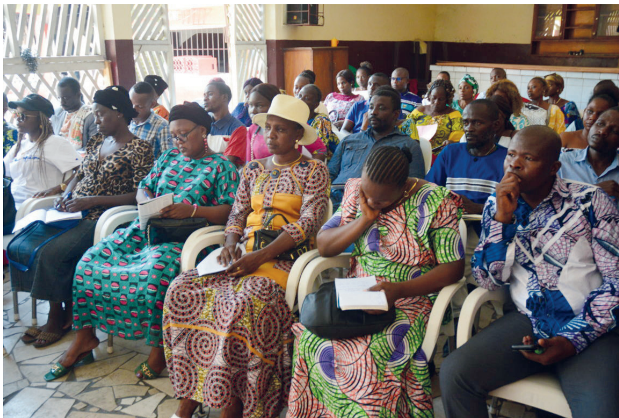
Les membres de l'association en assemblée générale Adiac

« Publier les textes d'intégration, campagne de recrutement 2023, dans un délai raisonnable ; régulariser le paiement de bourses des enseignants volontaires et communautaires du ministère de l'Enseignement préscolaire, primaire, secondaire et de l'Alphabétisation ; du ministère de l'Enseignement technique et professionnel », indique la déclaration,