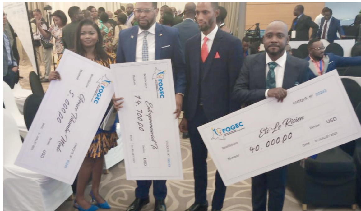
Des entrepreneurs avec les chèques remis par le FogecAdiac

Selon les informations qu'ils auraient reçues, c'est la descente des agents de l'IGF sous les ordres de Jules Alin-