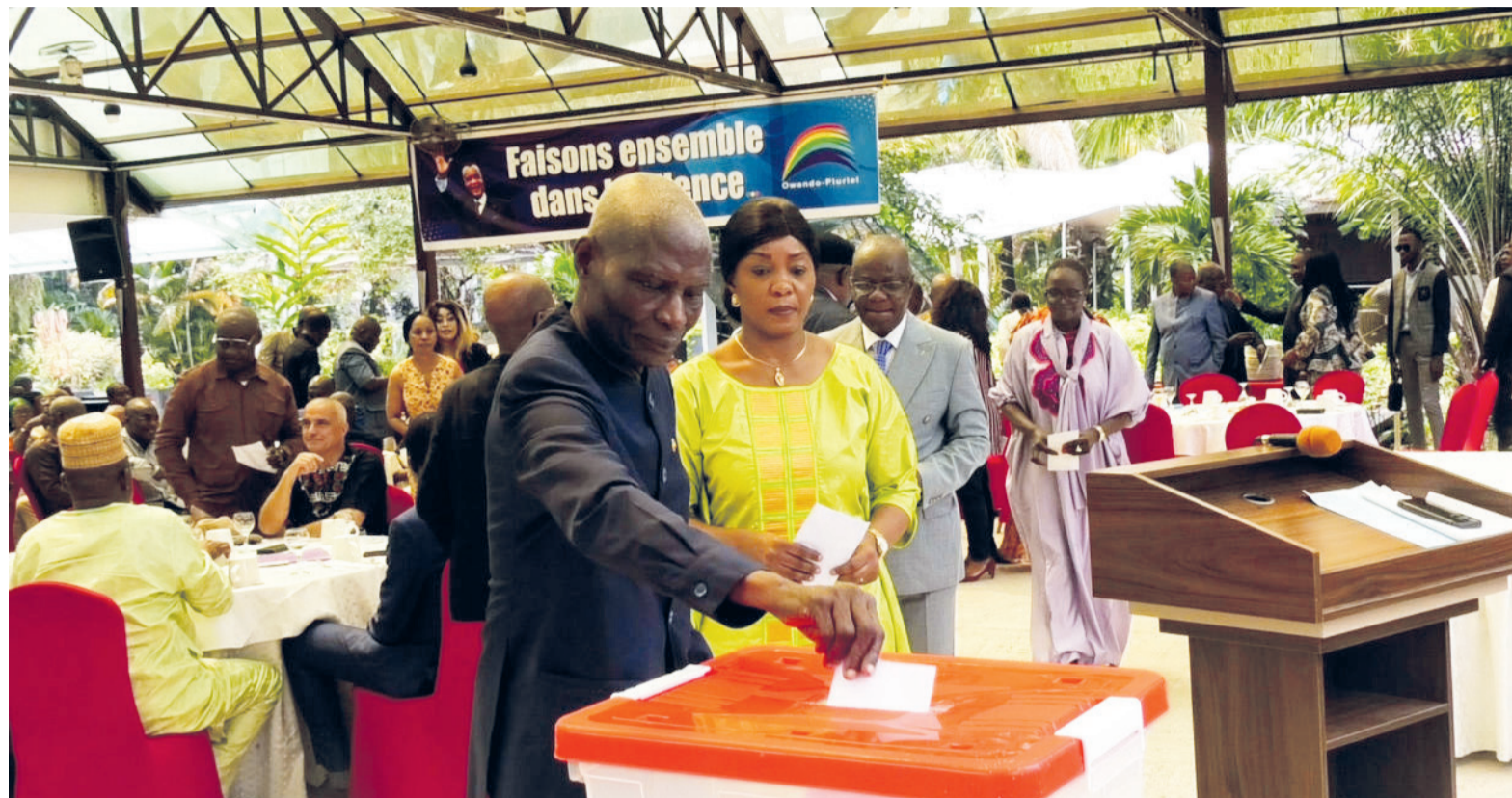
L'opération de collecte de fonds

Les résultats avaient montré 58,3% dont 84,4% pour les