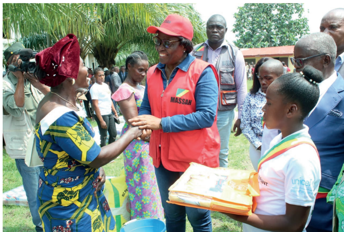
Remise des kits humanitaires aux sinistrés de Tokou/Adiac

A Tokou, en effet, 1500 personnes ont été touchées par les inondations, soit 250 ménages, les villages environnants y compris. L'aide humanitaire reçue par les sinistrés a été composée de vivres et de non-vivres dont les intrants de pêche pour permettre aux pêcheurs de renouer rapidement avec leur activité. Il faut souligner que les inondations à Tokou ont dévasté des plantations. « Au village quand la population n'a plus de champs et de manioc, la vie devient de plus en plus difficile », a déclaré Léopold Itoua, directeur départemental de l'Action humanitaire dans la