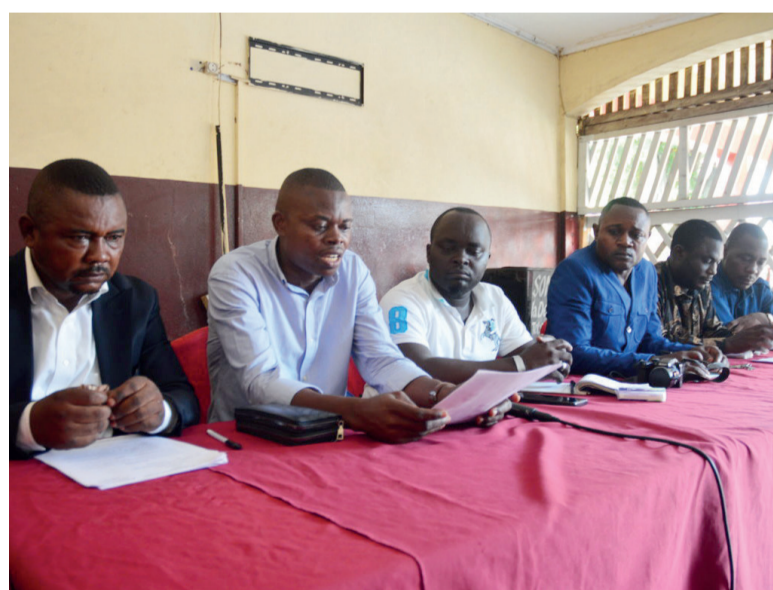
Le présidium donnant lecture de la déclaration

Les membres de l'Association libre des enseignants du Congo ont tenu une réunion, le 12 mai, à Brazzaville à l'issue de laquelle ils ont recommandé l'application du statut particulier des agents de l'éducation, la publication de l'arrêté interministériel fixant les montants et les conditions d'attribution des primes et indemnités accordées aux enseignants.