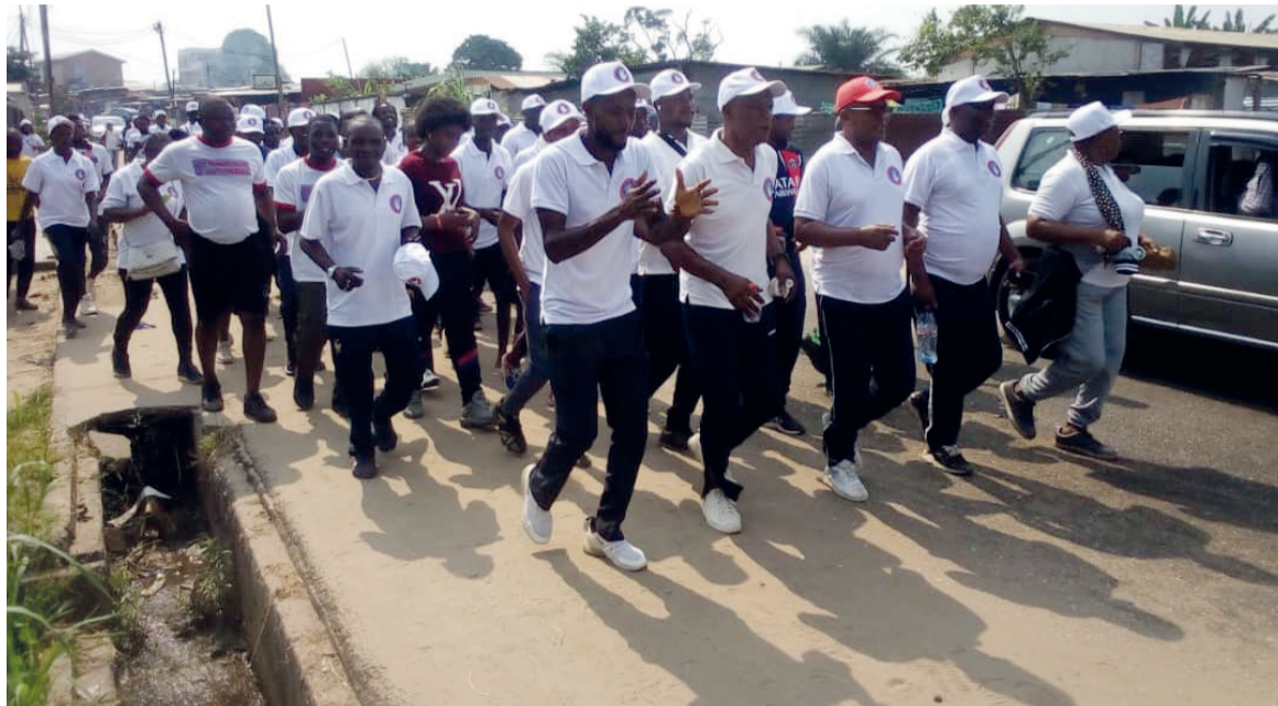
Les membres du RPDN lors de la marche sportive Adiac