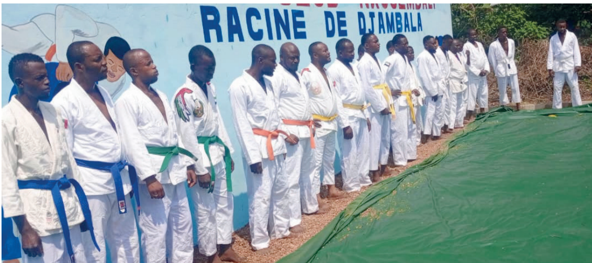
Les athlètes du judo club Nkouembali/Adiac