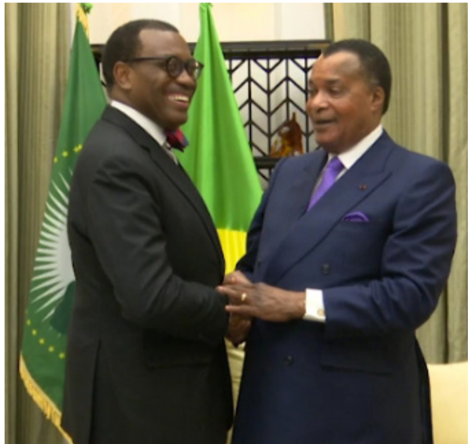
Akinwumi Adesina et Denis Sassou N'Guesso