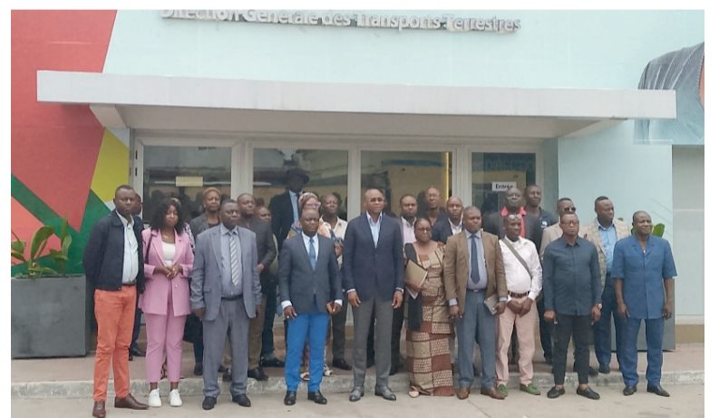
Les participants à la réunion Adiac