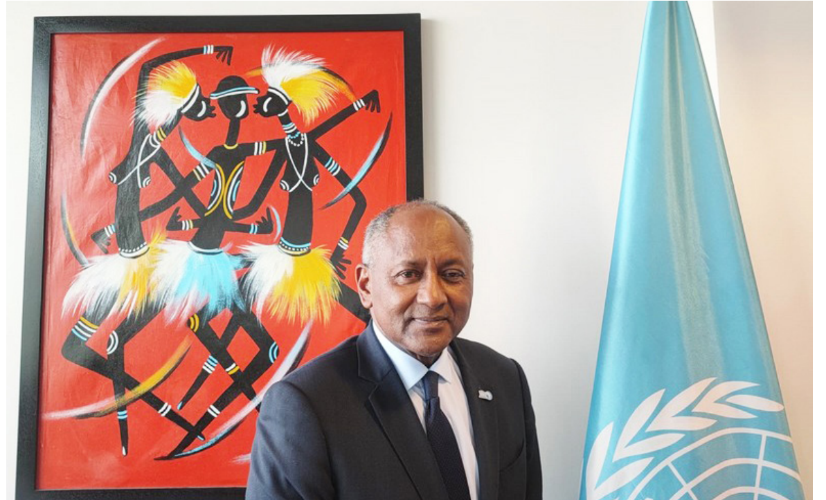
Firmin Édouard Matoko/DR

Après plus de trente années au service des idéaux de cette noble institution, il reste persuadé que cette idée perdure et que « cette vision que nous partageons tous, est celle qui prévaudra au milieu des incertitudes d'aujourd'hui qui interpellent plus que jamais la mission universelle de notre organisation : contribuer au maintien de la paix et de la sécurité en resserrant, par l'éducation, la science et la culture, la collaboration entre nations, afin d'assurer le respect universel de la justice, de la loi, des droits de l'homme et des libertés fondamentales pour tous, sans distinction de race, de sexe, de langue ou de religion... ».