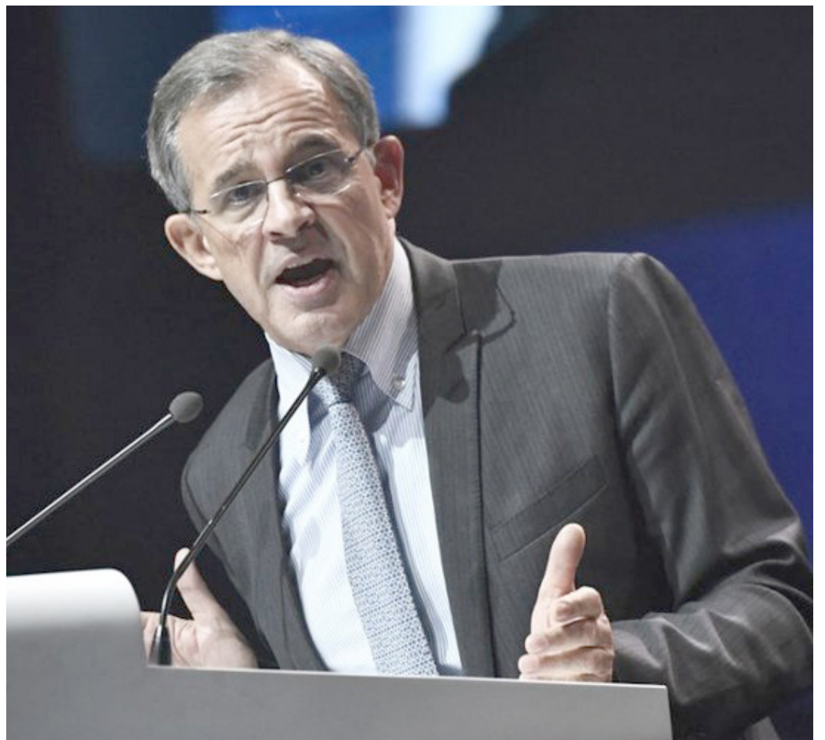
Thierry Mariani, député européen

Il explique : « Cet accord ne garantit rien. J'espère qu'il ne sera plus appliqué, même s'il n'a pas encore été officiel-