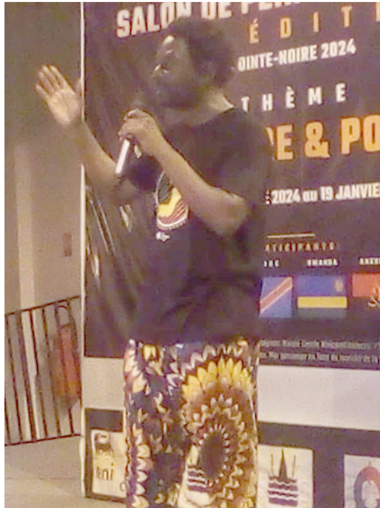
Le photographe Robert Nzaou/Adiac

Selon lui, la photographie est « L'envie de raconter, de partager des moments ordinaires ou insolites, de montrer au reste du monde d'où je viens est la base de mon travail et de ma créativité. » Son rêve est que des jeunes Africains partagent sa passion pour raconter leur vie, leur pays, leur continent. Aujourd'hui, ses cli-