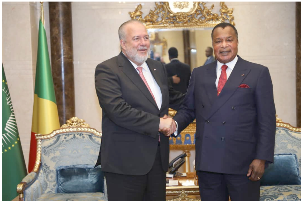
Manuel Marrero Cruz reçu par le président Denis Sassou N'Guesso

« Nous nous sommes accordés à actualiser tous nos potentiels de coopération entre les deux pays, de renforcer la coopération en matière de santé, de technologie, de formation des ressources humaines à Cuba, en matière de tourisme et de la culture, à la