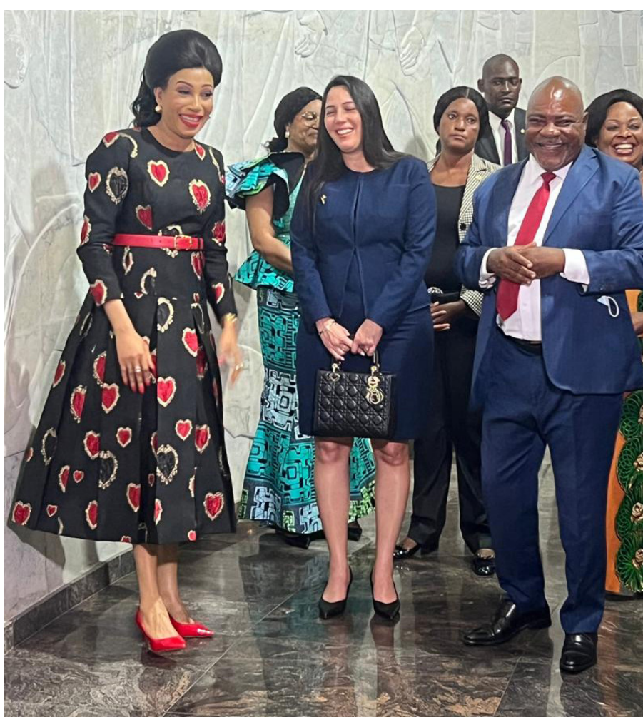
L'ambiance lors de la visite guidée au bas-relief

En effet, si la violence et le calvaire étaient le fer de lance de la quasi-totalité des explorateurs, cela n'a pas été le cas pour le Franco-Italien Pierre Savorgnan de Brazza, considéré comme un humaniste qui a apporté des valeurs universelles à l'Afrique. C'est un homme qui a eu des approches assez différentes avec d'autres explorateurs ou colonisateurs. Il était le père des esclaves, parce qu'il les