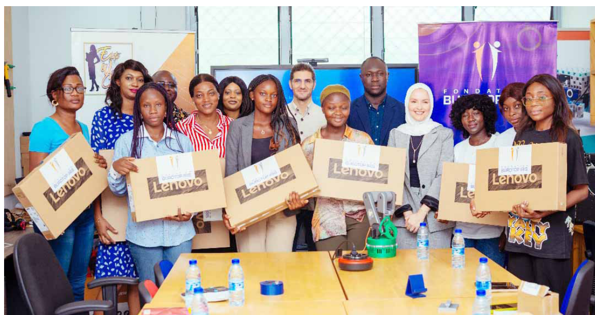
La joie des bénéficiaires et donateurs des ordinateurs

« Le numérique est aujourd'hui un levier incontournable pour l'émancipation économique. En investissant dans la formation des femmes aux compétences numériques et entrepreneuriales, nous leur donnons les moyens de créer, d'innover et de bâtir des solutions d'avenir. Notre engagement est donc naturel : accompagner les femmes pour qu'elles soient des actrices majeures du développement et de la transformation numérique. À