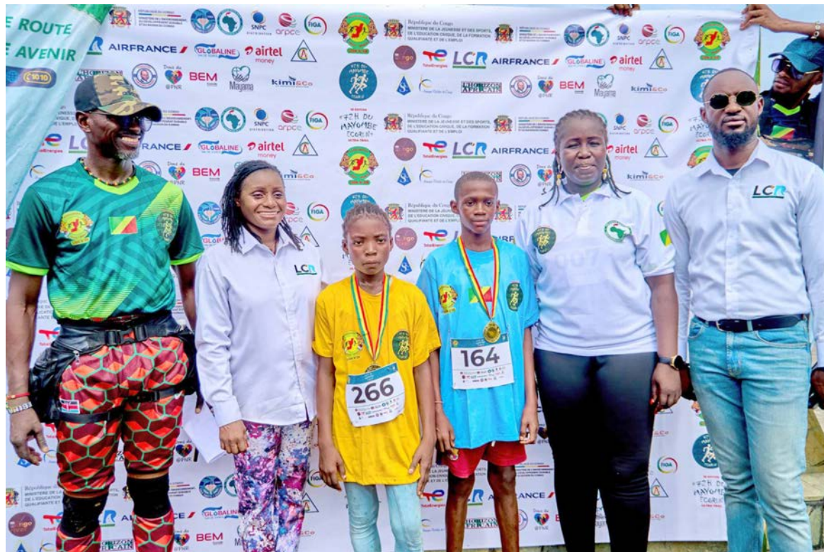
Les principaux acteurs des « 72 heures du Mayombe »

En assurant la sécurité de l'Ecorun et en soutenant ses objectifs