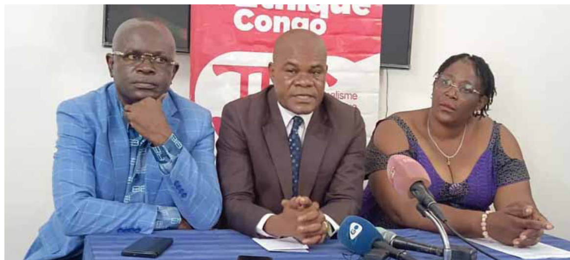
Les membres du JEC lors des échanges/Adiac

L'édition 2025 de cette journée est célébrée sur le thème « Informer dans un monde complexe-l'impact de l'intelligence