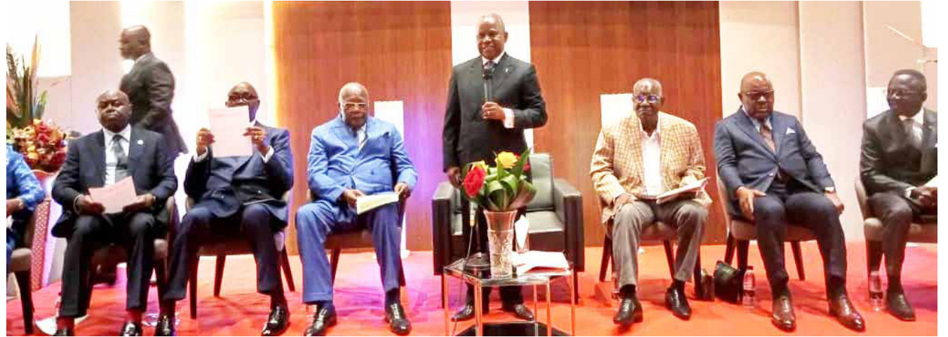
Le présidium

Réunis en assemblée générale le 1er mai à Kintélé, sous la direction du président du Sénat, Pierre Ngolo, les ressortissants de Nkeni-Alima ont mis en place un cadre d'échange avant d'appeler le gouvernement à tout mettre en œuvre pour le développement effectif de ce nouveau département.