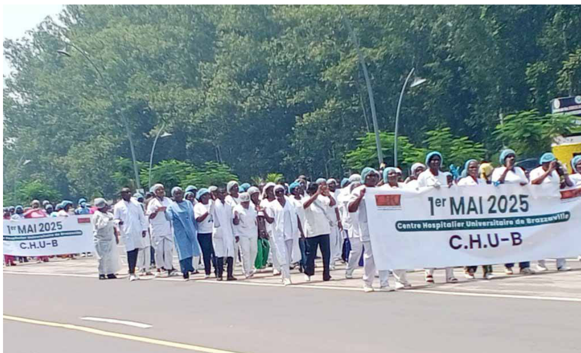
Des agents du CHU de Brazzaville lors du défilé.

cet effet, le sens de responsabilité dont les travailleurs ont fait montre ces derniers temps, en s'abstenant de paralyser le pays par des grèves à répétition.