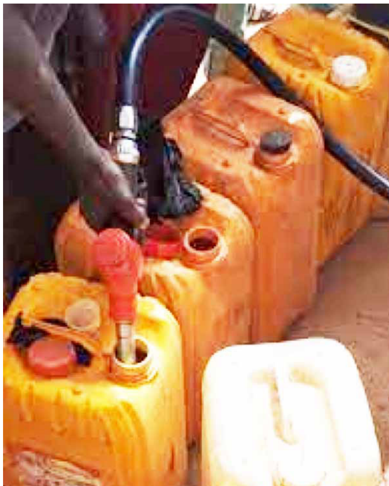
Des bidons alignés en attente de carburant

L'enquête renseigne que la vente de carburant en période de pénurie est réservée aux clients se présentant avec des bidons, moyennant des pots-de-vin. Pour la livraison d'un bidon de 10 litres, le pompiste demande entre 1000 et 2000 FCFA, et entre 2000 et 3000 FCFA pour un bidon de 25 litres. « Ce mode de vente est particulièrement répandu dans les stations-service de TotalEnergies, ali-