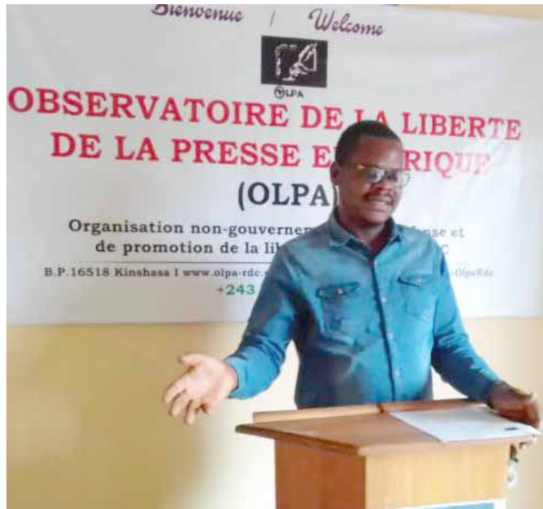
Le secrétaire exécutif d'Olpa lors d'une activité

Olpa a indiqué que la situation de la liberté de la presse est tributaire du contexte socio-politique du pays caractérisé par l'occupation de plusieurs territoires par des milices armées et l'absence de l'autorité de l'Etat. Mais, au cours de ce premier semestre de l'année 2025, l'organisation a noté une baisse de cas d'atteintes à la liberté de la presse comparativement