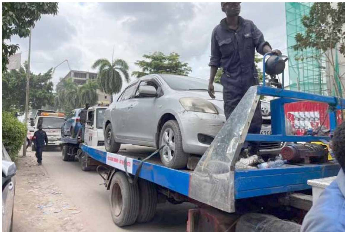
Un véhicule porte-toutVDR

Les véhicules embarqués étaient conduits au Camp Lufungula, dans la commune de Lingwala, où se situe le quartier général de cette brigade, obligeant les propriétaires à s'acquitter des fortes amendes pour les récupérer. Mais, sur le plan pratique, il y a eu beaucoup de plaintes liées aux bévues commises par les différentes équipes envoyées sur