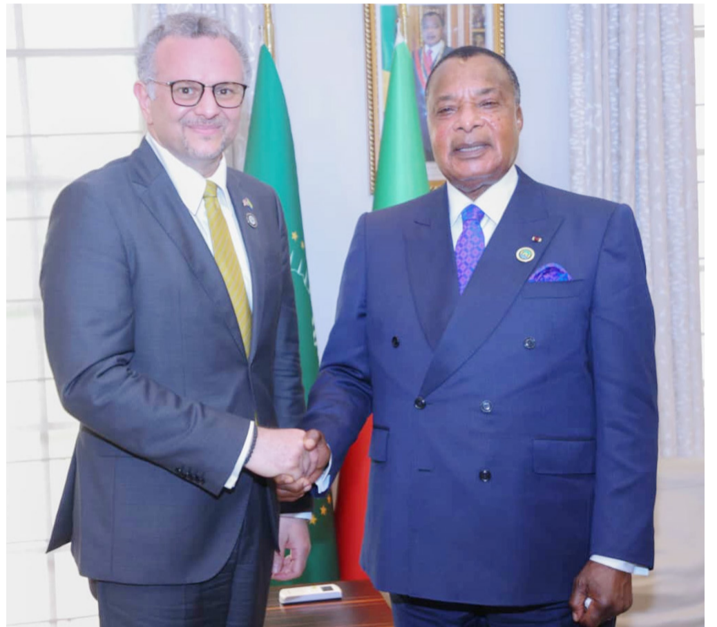
Poignée de main entre Denis Sassou N'Guesso et Massad Boulos