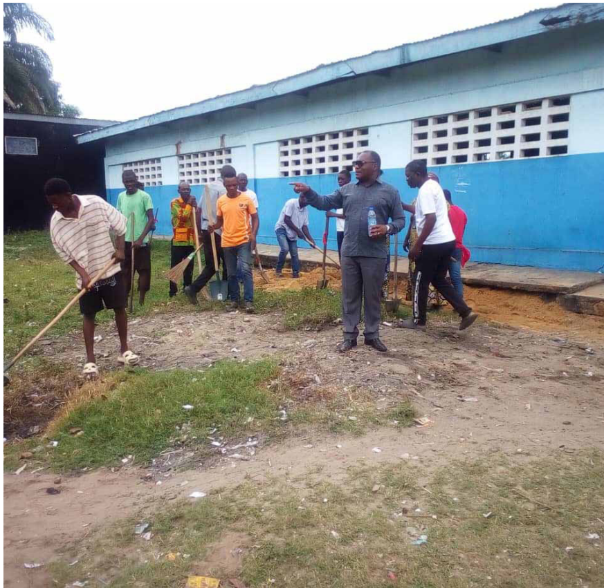
Le maire de Ngoyo à l'école Ernest-Bayonne de Tchivoundou/Adiac

« Cette ronde nous a permis d'abord d'évaluer notre système d'organisation et voir si notre appel a été suivi par la population. Après cette ronde, nous savons maintenant ce qu'il faut faire pour améliorer cette action à l'avenir et intéresser davantage les citoyens au mot d'ordre de garder et de préserver notre environnement », a dit le maire de Ngoyo. « C'est maintenant à nous de lui doter en matériel suffisant pour que le travail d'assainissement se fasse comme nous le souhaitons. Nous devons donc ajouter les pelles, les râteaux,