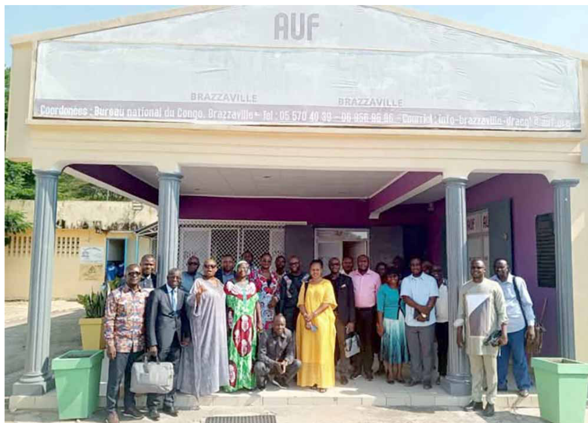
La photo souvenir

Les enseignants ont exploré des outils numériques innovants pour l'enseignement à distance, la rédaction et la présentation des cours, l'utilisation des tableaux numériques, l'intelligence artificielle, les