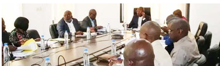
La Fédération congolaise de football en pleine session

Pour la même raison, concernant les éliminatoires de la CAN 2027 dont la date limite d'engagement