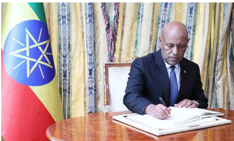
Le nouvel ambassadeur de l'Éthiopie