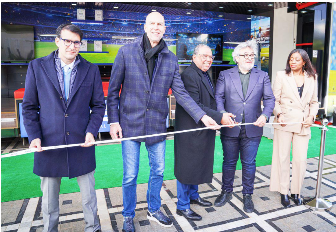
La coupure du ruban symbolique de la mise en service du «Moving Tour d'AGL»