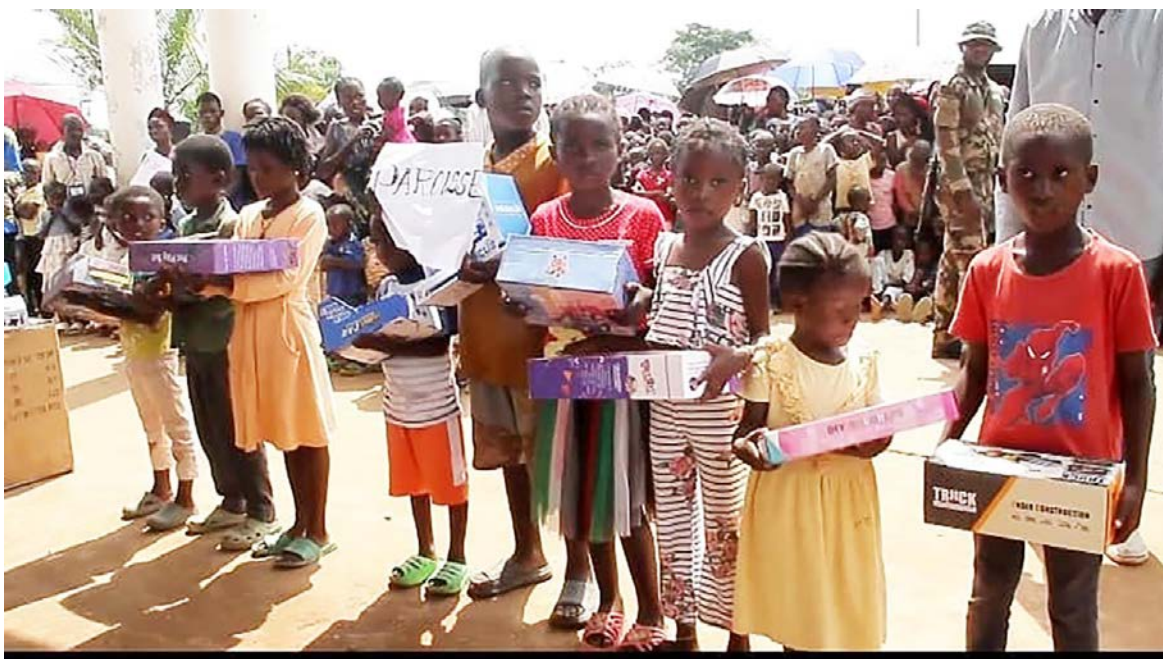
Des enfants savourant leurs jouets ; une vue de l'échantillon du don

En effet, cette remise de jouets s'inscrit dans la continuité des nombreuses actions sociales menées tout au long de cette année par le président de l'Assemblée nationale, Isidore Mvouba, dans sa