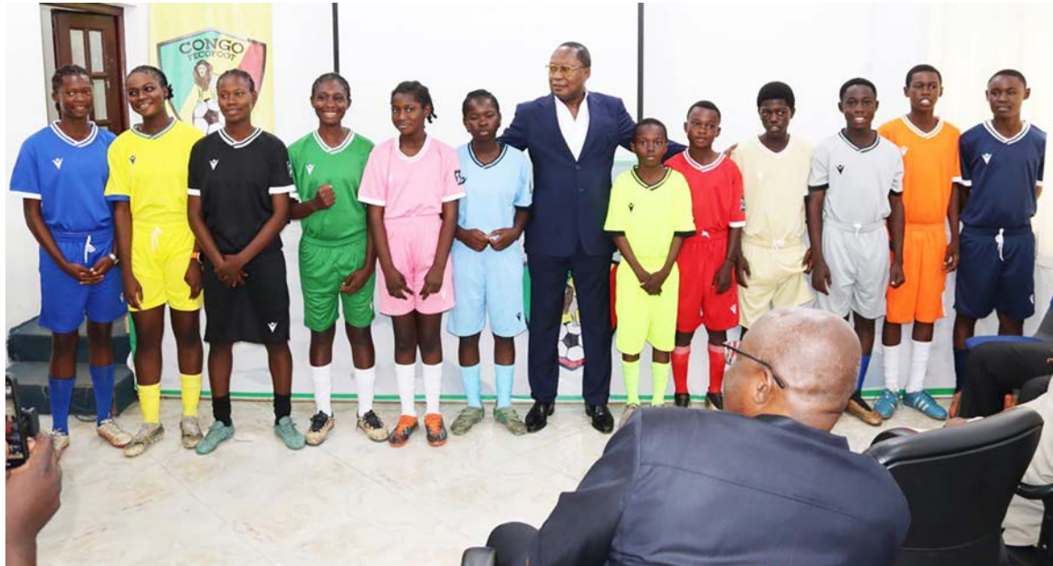
Le président de la Fécofoot et l'échantillon des jeunes Adiac

Sur le plan pratique, chaque ligue départementale se présentera avec une équipe dans chaque version : une chez les garçons et une