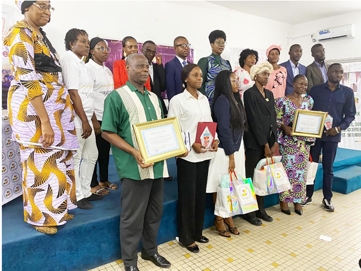
Les lauréats posant pour la postérité

A cet effet, chaque étudiant ou équipe participant a présenté une exposition littéraire ou artistique mettant en lumière: ce qu'ils ont apprécié dans l'ouvrage, en particulier la manière dont il aborde la problématique des violences basées sur le genre; ce qu'ils ont moins apprécié, avec une analyse argumentée portant sur la narration, les