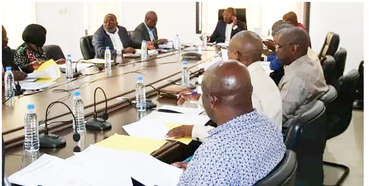
La Fédération congolaise de football en pleine session DR

té exécutif a expliqué que le manque de compétitions locales « impose l'option d'une mise en place d'une équipe constituée majoritairement des joueurs de la diaspora. Mais à condition d'avoir un sélectionneur. D'où la nécessité de procéder rapidement à un appel à candidatures », a-t-elle insisté. Le tour préliminaire débutera du 23 au 31 mars. Le Comité exécutif a par ailleurs révélé qu'un budget d'un montant de 209167 dollars US a été validé par la Fifa pour des travaux prévus au Centre d'Igné. Il a assuré qu'il a obtenu de la CAF la validation de l'organisation de la Licence A CAF à Brazzaville dont la première session se tiendra à partir du premier trimestre de l'année 2026. Il s'est félicité d'avoir cinq officiels retenus à la phase finale de la CAN 2025