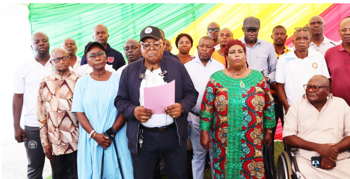
Les dirigeants des clubs de handball du CongoAdiac

La Fécohand a, en effet, décidé d'infliger des sanctions à la Dynamique le Réveil du handball congolais et les commissions du tournoi national de cohésion et de fraternité organisé par ladite Dynamique. Une amende de 15 000 000 FCFA a été infligée à la Dynamique. De même, elle a étendu ses sanctions par le retrait de l'affiliation à 25 clubs de handball. Les