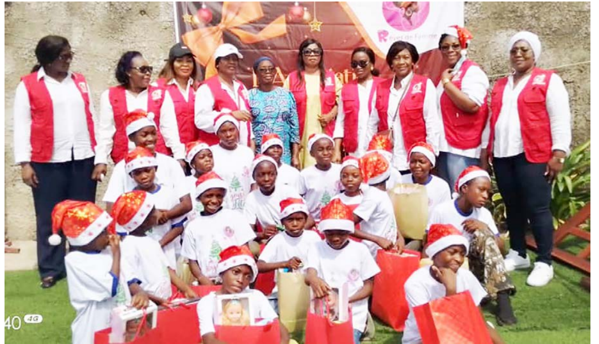
Les membres de Rêves de femme posant avec les orphelins

La présidente de l'association a placé ce geste sous le signe du partage, de la charité et de l'amour. « Nous sommes des jeunes femmes qui ont en commun cet amour des autres, l'envie de partager, de donner du bonheur aux enfants, en particulier aux orphelins parce que la plupart d'entre nous vivent avec des enfants en famille, savent ce que signifie cette période de Noël. C'est un moment qui se passe en famille, les orphelins n'ont pas de parents, ils sont