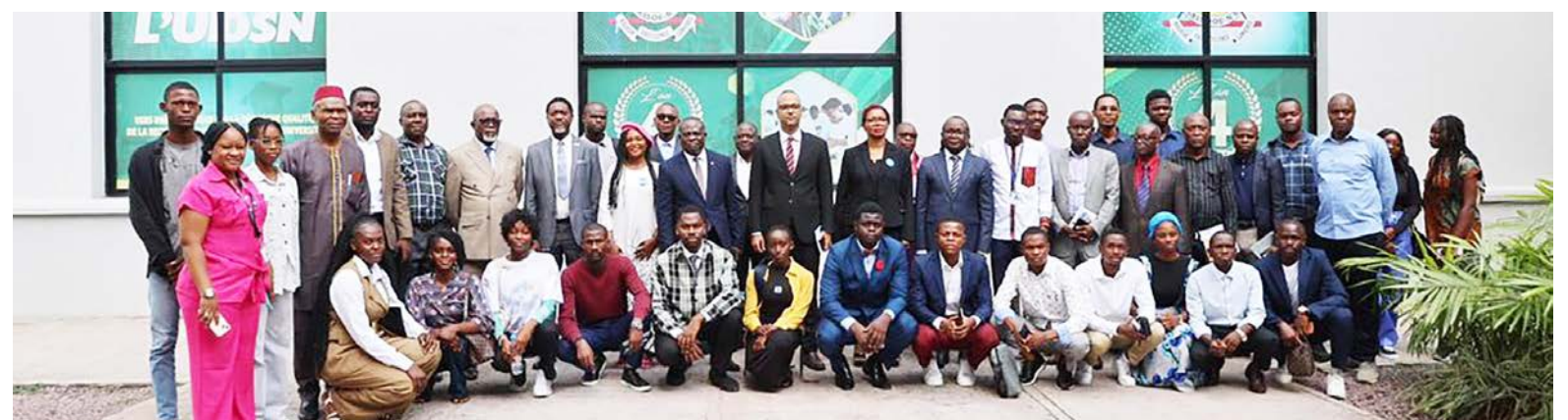
Photo de famille des responsables des agences onusiennes et de l'Université de Kintélé

« La causerie de ce jour qui s'inscrit dans le cadre du 80 e anniversaire des Nations unies constitue une