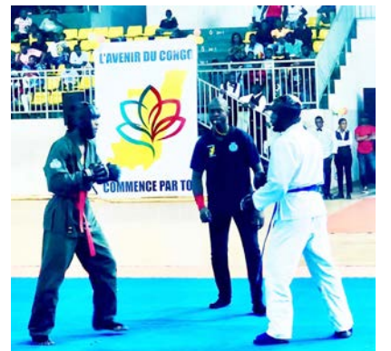
Des combattants en pleine action