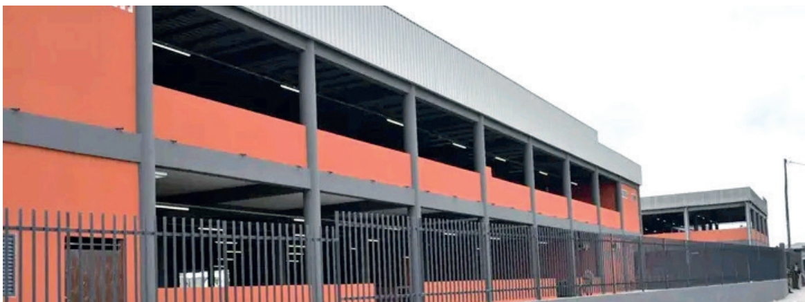
Une vue du marché inauguré

Le chef de l'Etat, Denis Sassou N'Guesso, a mis en service, le 9 février, le grand marché Ndji-Ndji situé dans le premier arrondissement de Pointe-Noire. Un ouvrage constitué de deux modules qui permet