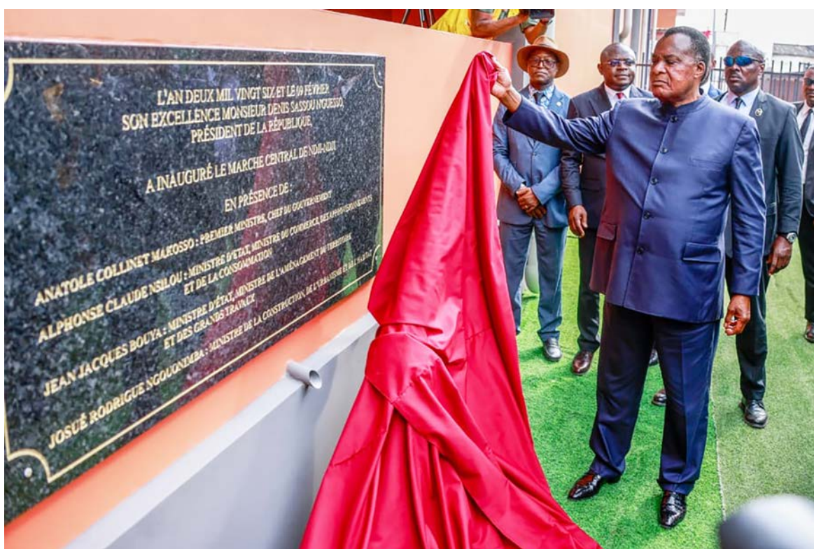
Dévoilement de la plaque du marché Ndji-Ndji par le président de la République

L'ouvrage qui est constitué de deux modules (en étage) permet désormais à 5200 personnes d'y exercer les activités commerciales. Il compte des boutiques, des cybercafés, une infirmerie et une unité de production de pains de glaces, des bureaux, des entrepôts, des locaux techniques, des équipements de mobilité, un poste de police, une salle de réunion, une garderie d'enfants, un local de sécurité incendie, des chambres froides,