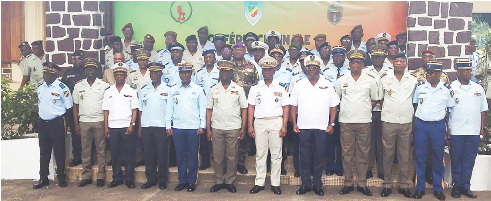
La photo de famille après l'ouverture de la conférence

La rencontre qui s'achève le 11 février réunit les membres du GAS, les autorités du ministère de la Défense nationale, celles du ministère de l'intérieur et de la Décentralisation ainsi que les commandants des secteurs opérationnels chargés de la sécurisation du scrutin. Elle vise à finaliser et à valider les documents directeurs relatifs à la planification des engagements administratifs et opérationnels. Il s'agit d'assurer une harmonisation complète des appréciations et des dispositifs entre les niveaux stratégique et opératif ; enfin, consolider la cohérence inter-composantes et interservices de la force publique. « La paix est la meilleure arme pour le développement qu'un peuple peut avoir. Ainsi, les travaux de la conférence de planification initiale tenue du 15 au 16 décembre 2025, dans cette même salle, ont permis d'atteindre les résultats suivants : une situation générale particulière dûment évaluée ; des menaces et risques sécuritaires clairement identifiés et appréciés ; des opérations administratives préliminaires relatives au vote anticipé