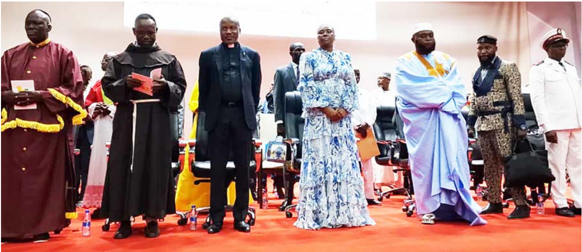
Les participants à la pour la paix.

Le culte religieux pour la paix s'inscrivait dans le cadre des actions consistant à implorer la miséricorde de Dieu afin que l'élection présidentielle des 12 et 15 mars prochain se déroule dans la paix et la tranquillité. Les représentants de chaque congrégation religieuse qui se sont succédé à la tribune ont délivré chacun un message allant dans le sens de demander à l'Eternel de bénir la République du Congo pendant la période électorale ; sachant que celle-ci est souvent en Afrique, en général, et au Congo, en particulier, un moment de troubles et de perturbation de la paix. En effet, ils ont rappelé qu'à l'occasion de la célébration du 65e anniversaire de l'indépendance de la République