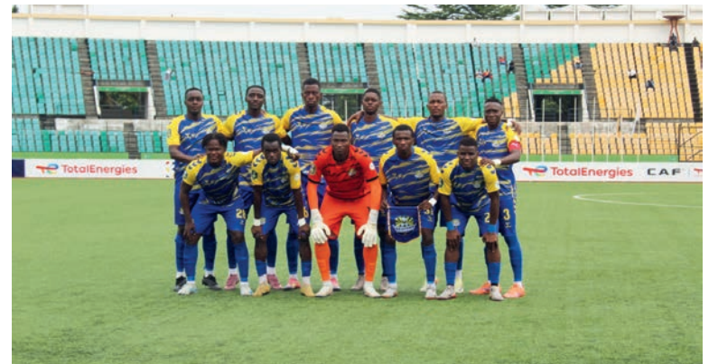
L'AS Otho qualifiée pour les quarts de finale trois buts à zéro les Sud-Africains de Stellenbosch.