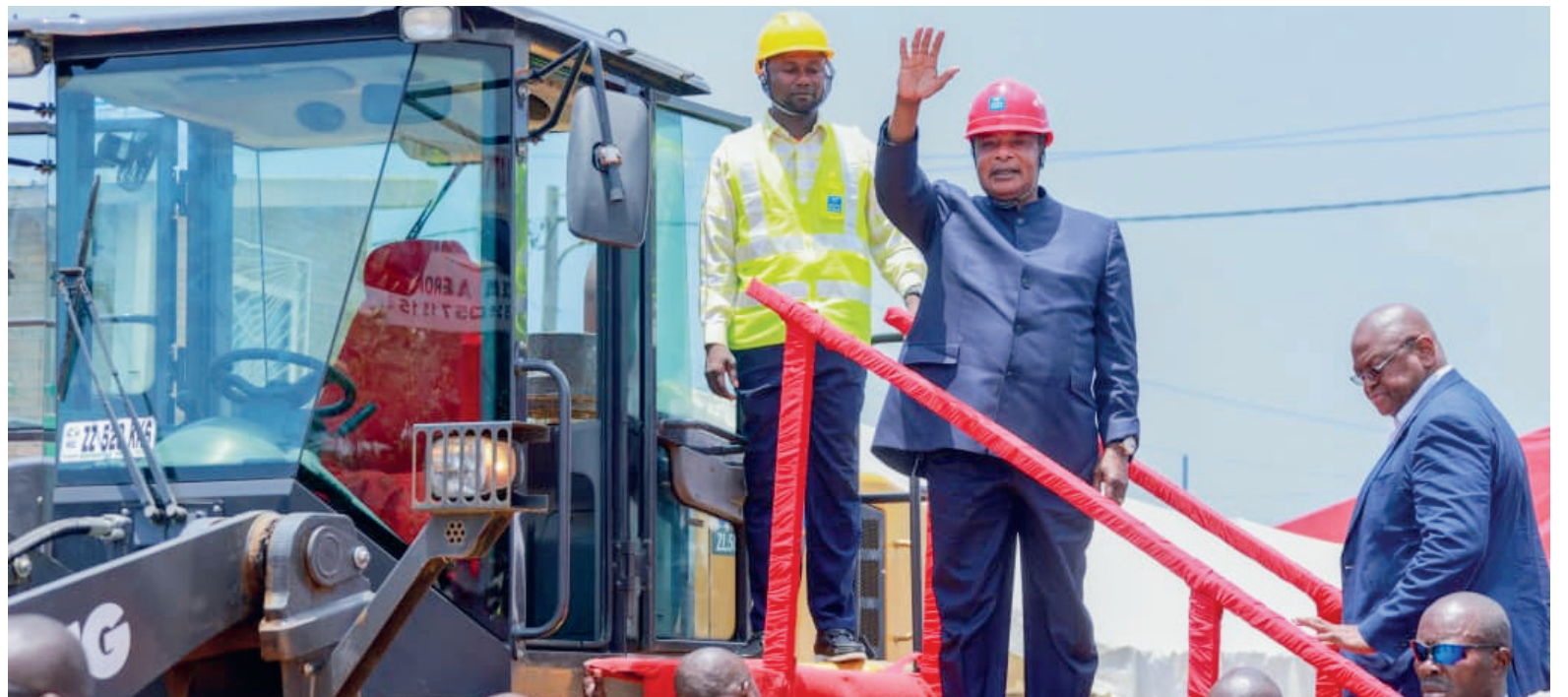
Lancement des travaux par le président de la République