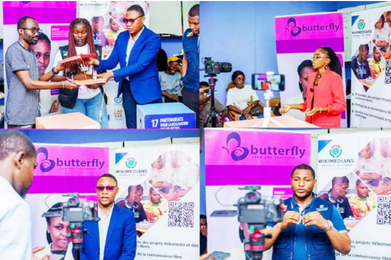
La signature de partenariat entre Wikipédia Congo et Butterfly

La Banque africaine de développement (BAD) lance une nouvelle phase d’appui aux réformes énergétiques africaines afin de transformer les engagements des États en raccords effectifs à l’électricité, dans le cadre de la Mission 300 qui vise 300 millions de nouveaux usagers d’ici à 2030.