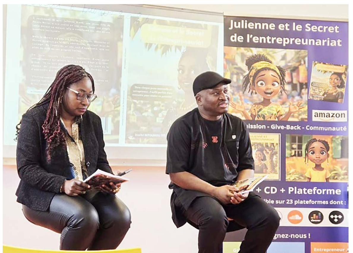
Les présentateurs du livre au lycée Lucas de Nehou à Paris

et mère-fille. Le public a pu découvrir cette œuvre comme un support permettant, tant aux parents qu'aux enfants, d'apprendre ensemble en chanson, et d'inspirer par l'action, jusqu'à vulgariser l'idée de l'entrepreneuriat. Les textes sont écrits en vue de véhiculer et de transmettre les valeurs, l'audace, la bienveillance