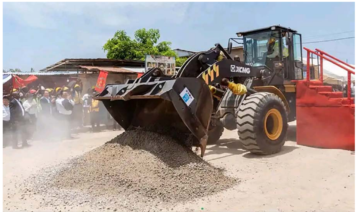
Lancement des travaux par le président de la République

Les travaux seront menés par la société chinoise China state construction engineering corporation. A l'issue de ceux-ci, cette voie sera en mesure de