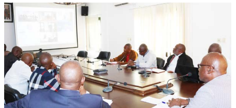
La Fécofoot en session de travail avec la Fifa

La Fédération internationale de football association (Fifa) a encouragé, le 3 avril, au cours d'une séance de travail par visioconférence, le Comité exécutif de la Fédération congolaise de football (Fécotot) de poursuivre ses activités conformément aux statuts, notwithstanding la condamnation du pré-