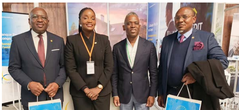
Déambulation au Salon Immobilier Africain de Paris 2026

quant à elle son stand, composé, entre autres, de représentants de la Banque postale, de la Société d'exploitation et de développement des infrastructures du Congo-Sedic et d'Afro Book.