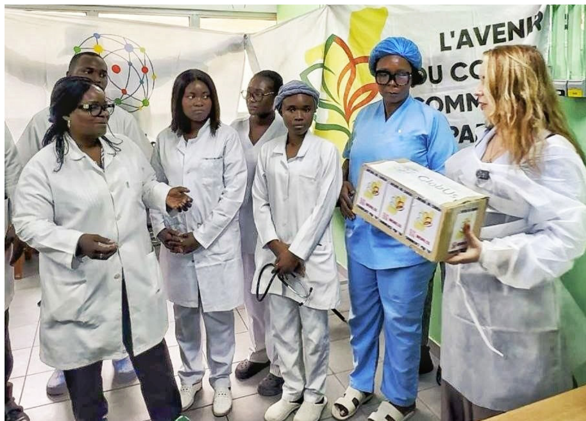
La présidente de Globus remettant le don aux infirmières

Selon les responsables, les besoins seraient énormes dans le service et il manquerait presque de tout pour pouvoir