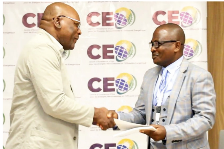
Remise du rapport du CEO/DR

Le rapport du Centre d'excellence d'Oyo (CEO) sur le diagnostic des politiques, cadre légal et réglementaire des énergies renouvelables et l'efficacité énergétique en République du Congo, remis officiellement à la direction générale de l'énergie, contient des recommandations visant à améliorer la réglementation du secteur.