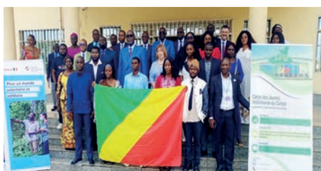
Les jeunes volontaires posant avec les officiels