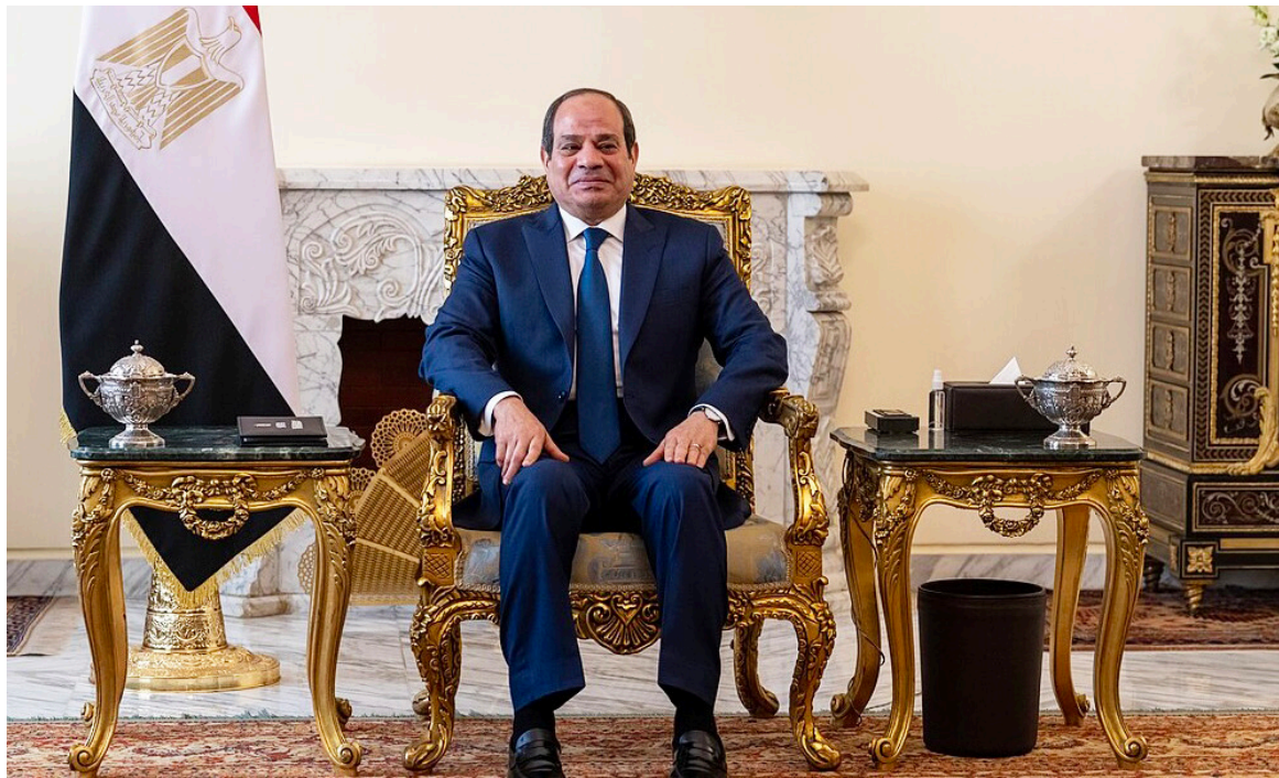
Le président de la République arabe d'Égypte, Abdel Fattah Al-Sissi

« Le président Al-Sissi a également exprimé le souhait de l'Égypte de poursuivre sa collaboration avec la République du Congo afin de renforcer les liens de coopération entre les deux pays, conformément aux aspirations et aux intérêts des deux peuples frères, et de maintenir la coordination bilatérale dans les cadres régionaux et internationaux », rapporte le porte-parole. De son côté, souligne le porte-parole, le président Denis Sassou