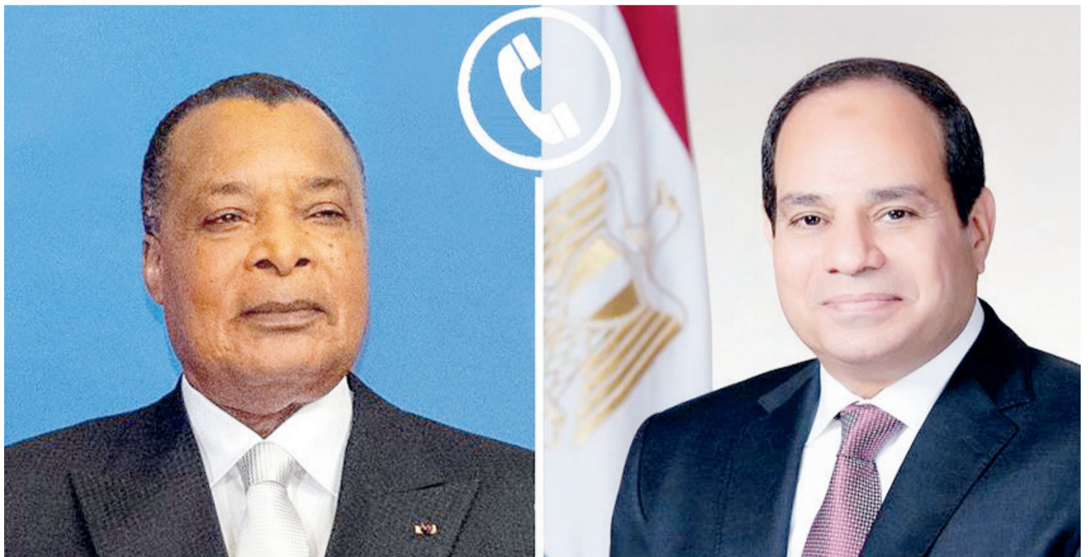
Les présidents Denis Sassou N'Gueso et Abdel Fattah Al-Sisi