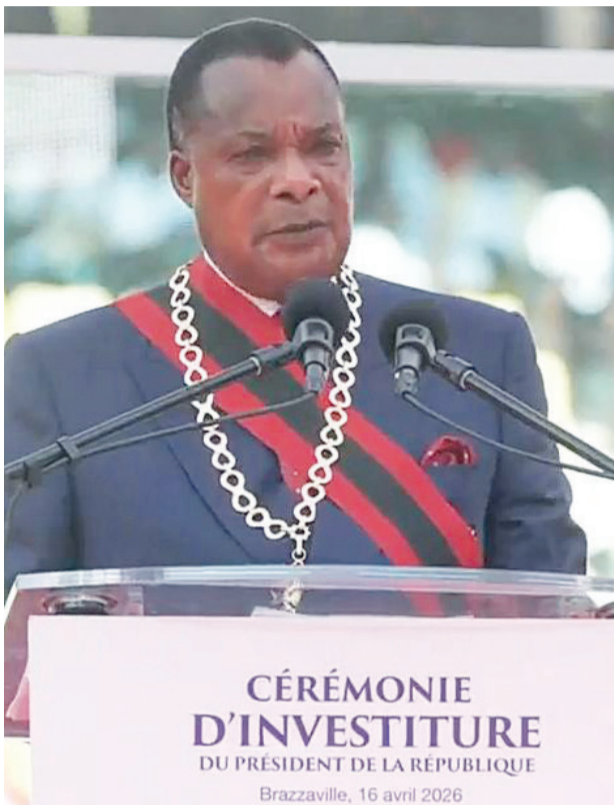
Le président de la République délivrant son message d'investiture