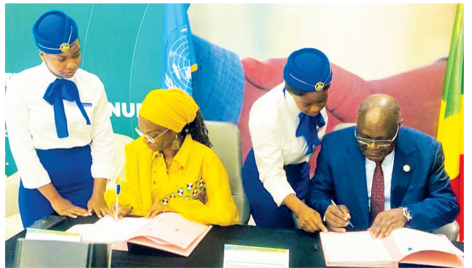
Signature du partenariat par le président de la CNTR et la représentante résidente du Pnud au Congo

La Commission nationale de transparence et de responsabilité (CNTR) et le Programme des Nations unies pour le développement (Pnud) ont conclu, le 14 avril à Brazzaville, un partenariat stratégique visant à renforcer la transparence et la gouvernance financière des finances publiques. Soutenu par un financement de plus de 4,4 milliards FCFA, le partenariat représente une nouvelle étape dans