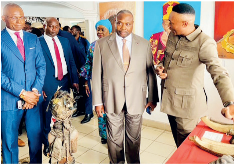
Le ministre d'Etat en immersion au Musée du bassin du Congo

Le ministre d'État en charge des Grands Travaux, Jean-Jacques Bouya, a visité le 15 avril, en compagnie de la ministre en charge de l'Industrie culturelle, Lydie Pongault, le Musée Galerie du Bassin du Congo situé dans les locaux des Dépêches de Brazzaville. Selon le ministre Jean Jacques