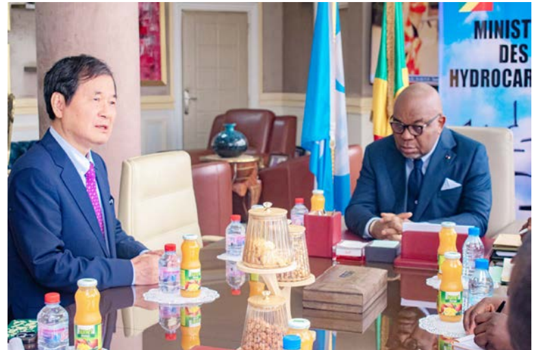
Les deux parties lors de la séance de travail

Selon lui, cette complémentarité ouvre la voie à des partenariats prometteurs. « Nous