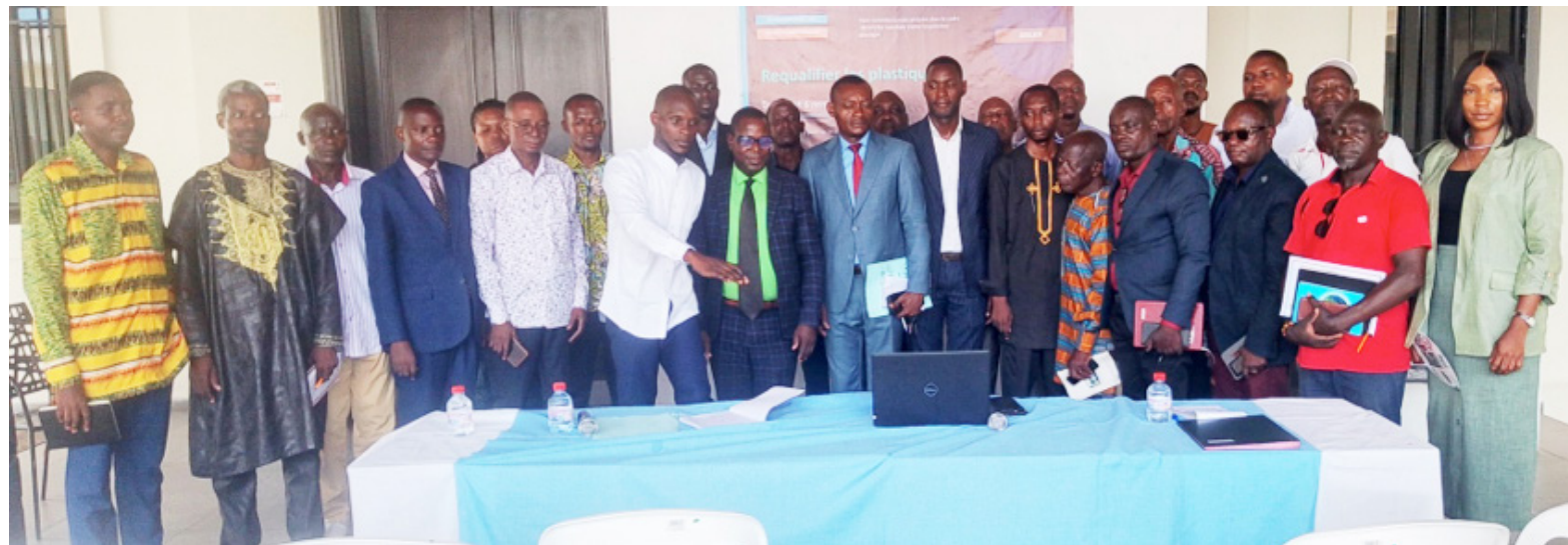
Les participants à l'atelier «Requalifier les déchets plastiques «

Eu égard aux limites constatées par les approches actuelles, no-