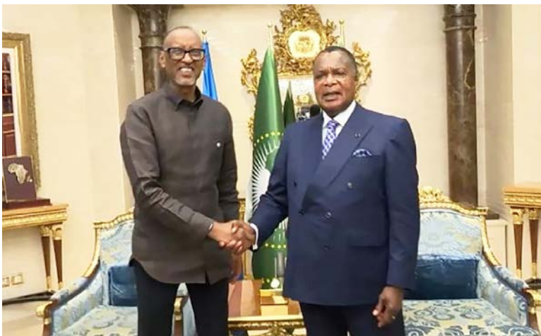
Poignée de main entre Denis Sassou N'Guesso et Paul Kagame.

Arrivé à Brazzaville pour assister à la cérémonie d'investiture de son homologue congolais, le président rwandais, Paul Kagame, a été reçu le 15 avril par Denis Sassou N'Guesso avec lequel il a discuté, entre autres, des affaires courantes, notamment de la Zone de libre-échange continentale africaine (Zlécfa).