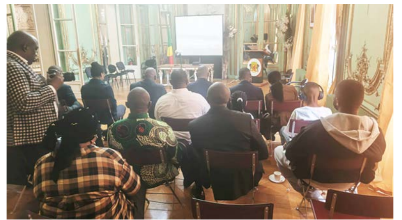
Vue partielle de la salle verte lors de la retransmission de la cérémonie d'investiture du 16 avril 2026 au complexe sportif de Kintélé.

Le grand moment attendu a été l'apparition du nouveau président dans l'arène aux alentours de 13h. Appelé à se présenter devant la Cour constitutionnelle, il a prêté serment en s'engageant à « respecter et de faire respecter la Constitution et les lois ; de défendre la Nation et la forme républicaine de l'État ; de remplir loyalement les hautes fonctions que la Nation et le peuple m'ont confiées ; de garantir la paix et la justice à tous ; de pré-