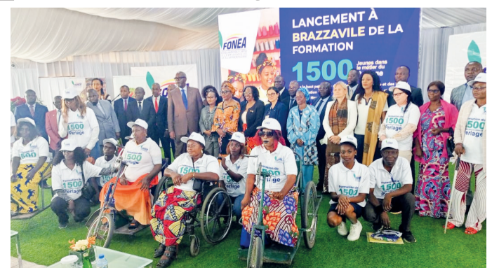
Les autorités posant avec les apprenants