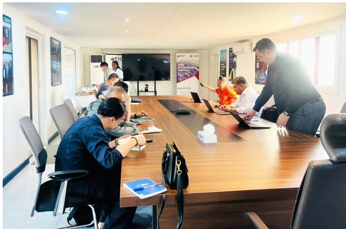
Réunion des experts/Adiac

Avec cette fonderie, le Congo va se positionner parmi les producteurs d'acier. La posi-