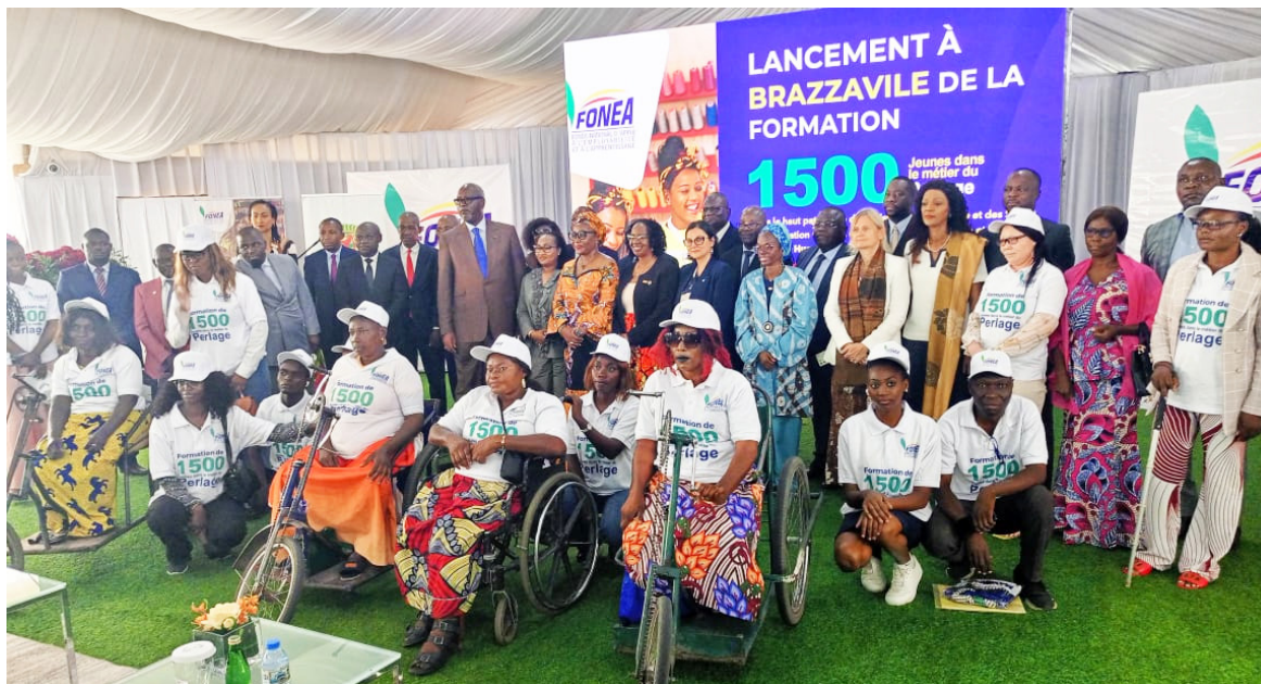
Les autorités posant avec les apprenants

« Nous avons reçu de nombreuses candidatures de jeunes hommes pour ce métier traditionnellement féminin, ainsi que de personnes vivant avec handicap. C'est un métier qui nourrit son artisan, pourvu que la créativité et l'ingéniosité soient au rendez-vous », a-t-il indiqué.