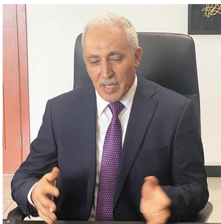
L'ambassadeur d'Algérie au Congo, Riache Azeddine.

L'autre point abordé entre l'ambassadeur et les présidents des chambres parlementaires a été la candidature de l'Algérie à la présidence du parlement panafricain. « A travers cette candidature, l'Algérie a l'ambition de travailler avec les pays africains et plus particulièrement les pays frères et amis tels que le Congo pour dy-