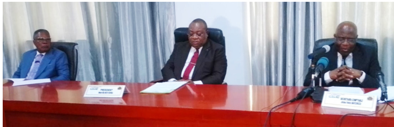
Des membres du bureau du CSLC/Adiac

L'un des acteurs clés du processus électoral en République du Congo, le Conseil supérieur de la liberté de communication (CSLC) a constaté qu'il n'a pas pu remplir correctement sa mission de réguler la couverture médiatique de l'élection présidentielle, faute de moyens financiers ou de leur affectation tardive.