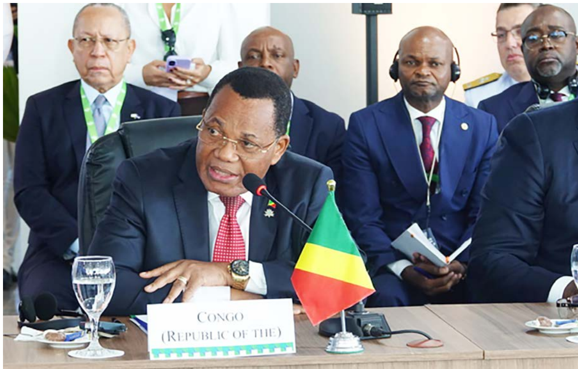
Jean-Claude Gakosso délivrant le message de la délégation congolaise.

Analysant l'actualité internationale, le ministre congolais des Affaires étrangères a déploré le fait que « la loi de la force supplante allègrement la force de la loi ». L'orgueil et la vanité sèment la terreur et la désolation, sous les yeux de la Zopacas. Une organisation qu'il considère comme étant un cadre privilégié de dialogue, de solidarité et d'action