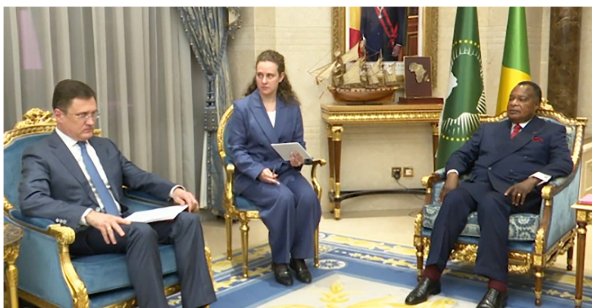
Alexandre Novak reçu par Denis Sassou N'Guesso

Les perspectives de coopération évoquées couvrent un large éventail de domaines. Outre l'exploitation des hydrocarbures et le développement énergétique, incluant l'électricité et des projets de mini-centrales, les deux pays entendent collaborer dans les transports, l'industrie, l'agriculture et les technologies numériques. Les secteurs sociaux tels que l'éducation, la santé et le sport figurent également parmi les priorités. Dans