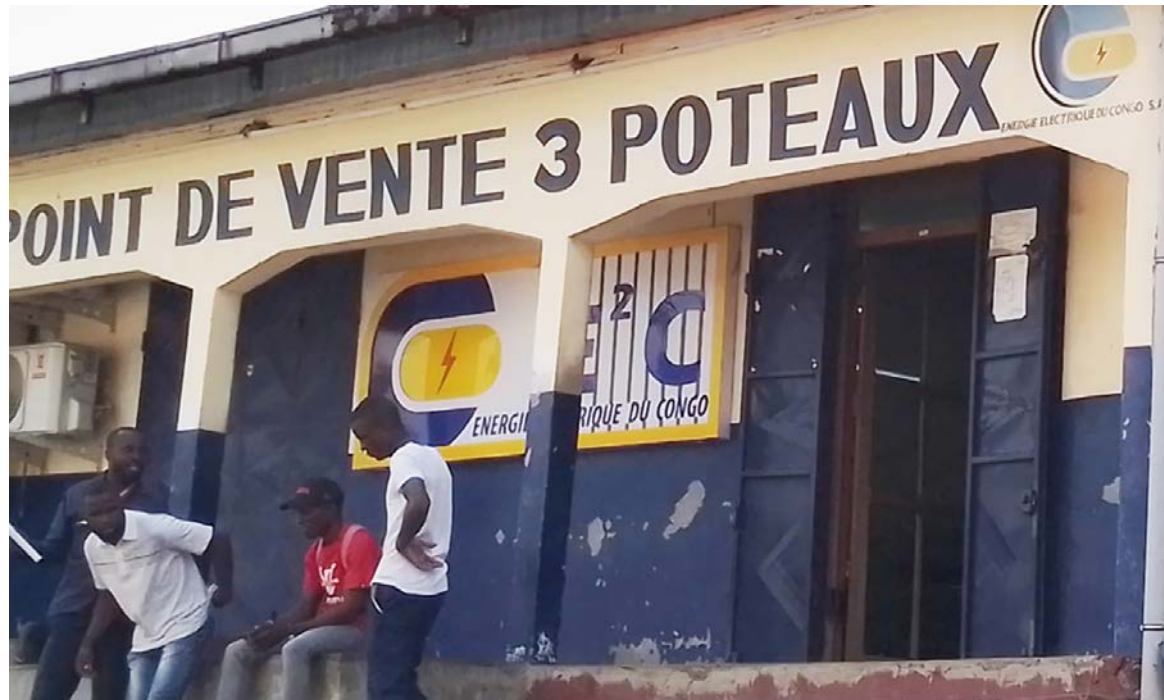
L'agence E 2 C Trois poteaux

Un fait curieux : ce transformateur est installé à moins d'une centaine de mètres du poste de police avancé du quartier Trois poteaux. De plus, l'agence, située tout juste à côté, est gardée par des sentinelles. « Ces gens opèrent