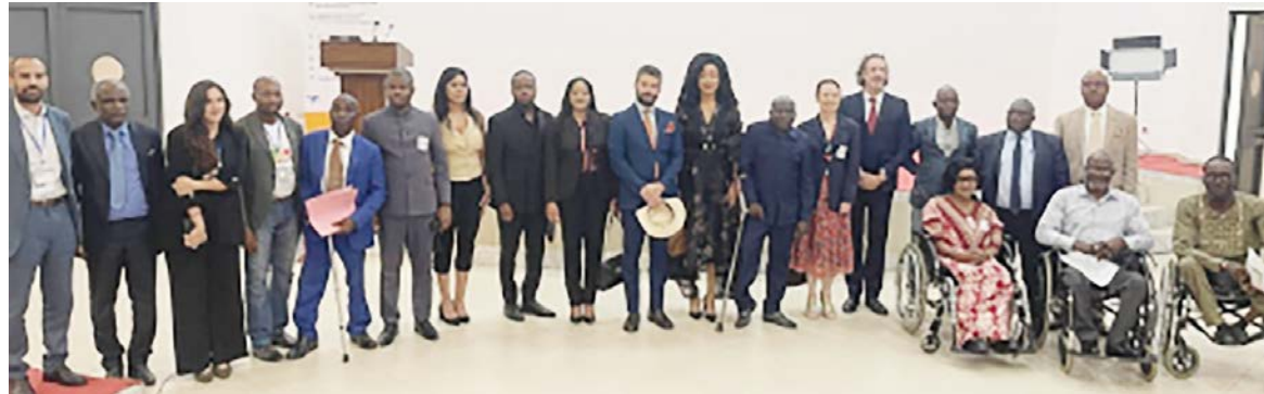
Les parties prenantes du projet ReAcTI-PVHAdiac

Porté par l'ONG italienne CPS et financé par l'AICS, ce projet sera mis en œuvre pendant trente-six mois dans deux arrondissements de la capitale, Ouenzé et Makélékélé. Avec un budget de plus de 827 000 euros, soit environ 542 millions FCFA, ReAcTI-PVH ambitionne d'accompagner deux cents personnes en situation de handicap vers une insertion professionnelle durable. Selon la cheffe de