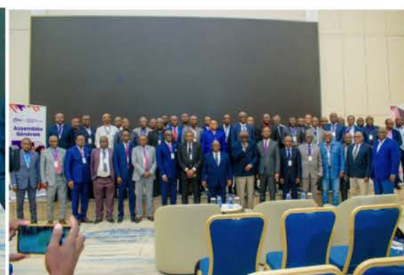
Photo de famille des membres de l'ONEC-C avec le Commissaire du Gouvernement, à la fin de l'Assemblée Générale, 17 avril 2026, à Hilton Hôtel (Brazzaville)