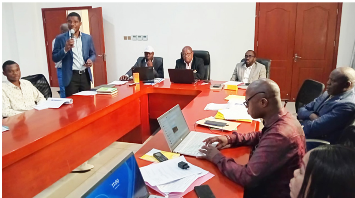
Les acteurs de société civile en atelier en faveur des droits des autochtones dans la gouvernance forestière

« L'objectif de l'atelier est de créer les conditions d'une compréhension commune des enjeux pour des solutions durables. L'OCDH souligne l'importance de la participation effective de la population autochtone et communautaire locale dont les voix doivent être entendues et prises en compte dans les décisions qui affectent leurs terres, leurs ressources et leurs emplois », a-t-il expliqué. Pour Lassana Koné, représentant de "Forest people programm", la forêt n'est pas seulement une richesse écologique ou économique, c'est aussi un espace de vie, de mé-