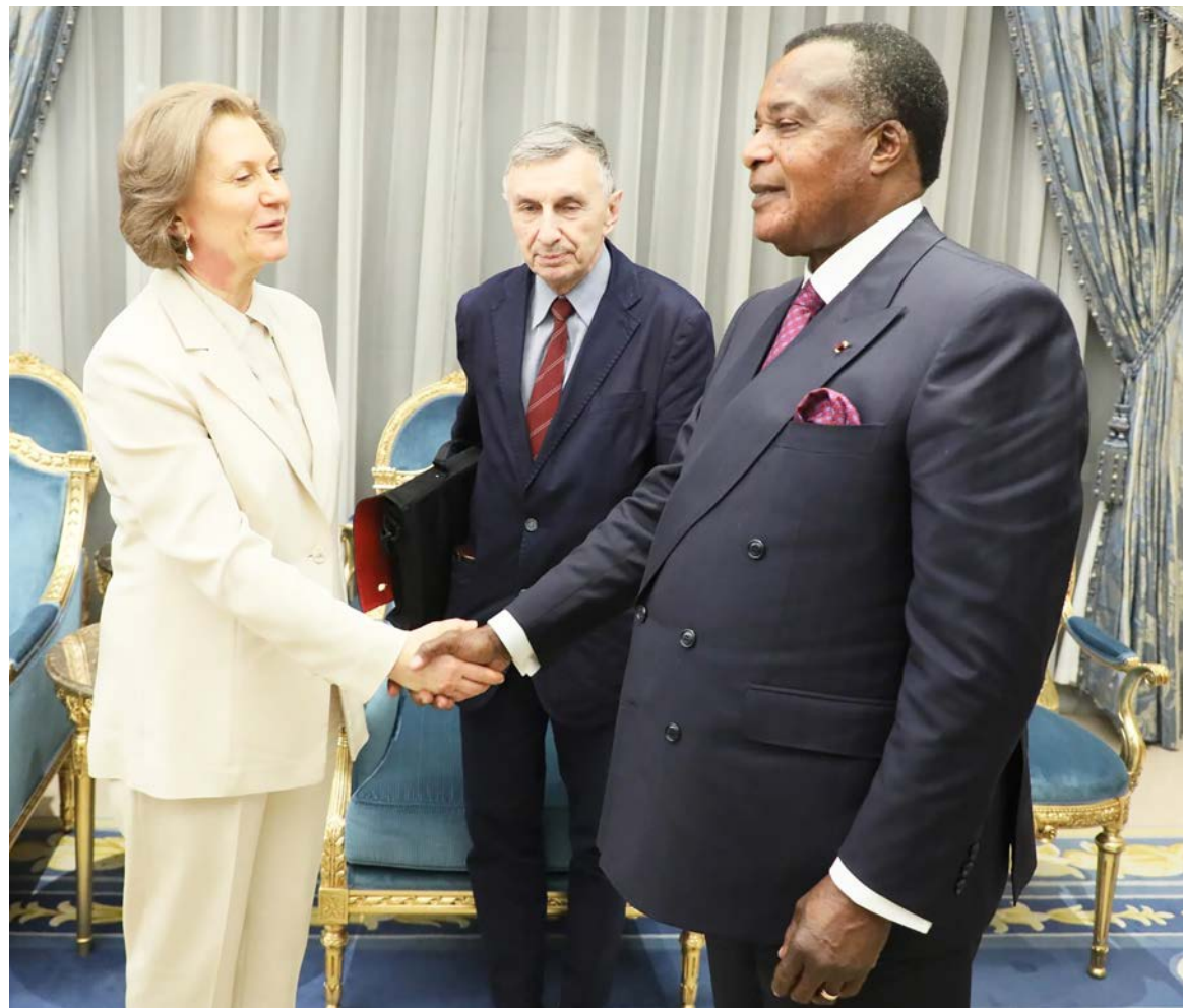
Le président Denis Sassou N'Guesso recevant la délégation

La Russie a déjà remis au Congo un laboratoire mobile installé sur châssis automobile, capable de réaliser jusqu'à 300 types d'analyses. Cet équipement per-