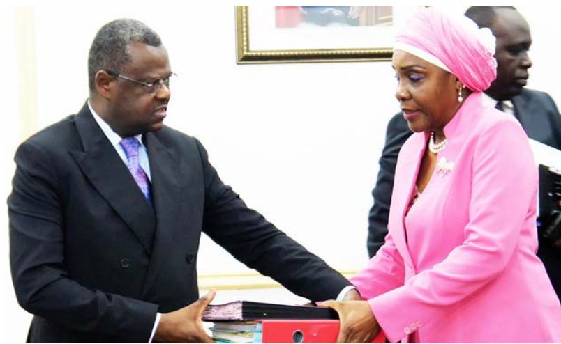
Echange des parapheurs entre les deux ministres

Pour sa part, le ministre Josué Rodrigue Nguonimba, dans une allocution brève, a dit que « (...) c'est le résultat qui compte. (...)