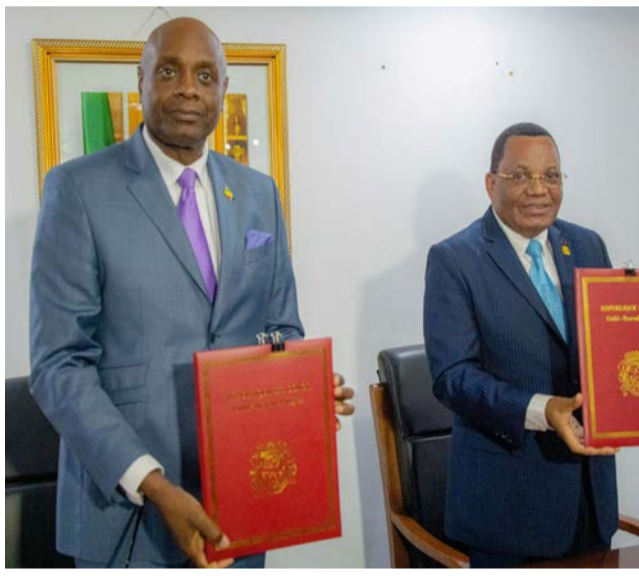
Les ministres Jean-Claude Gakosso et Constant-Serge Bounda à l'issue de la passation de service