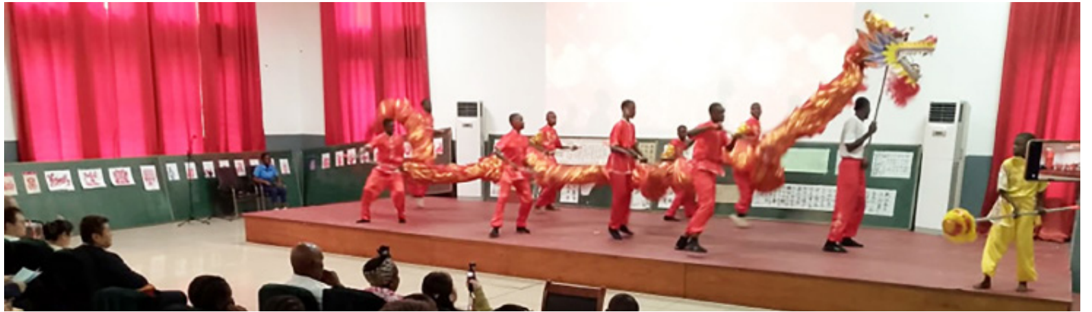
Lors de la démonstration de la danse du dragon

Instituée par l'Organisation des Nations unies, la Journée internationale de la langue chinoise a réuni au Complexe scolaire Révolution et Gampo-Olilou, dans le cinquième arrondissement Ouenzé, des élèves venus de plusieurs établissements de la capitale, parmi lesquels l'École internationale chinoise, le lycée Moukoundzi-Ngouaka, le lycée de la Révolution ainsi que la classe Confucius. Les élèves ont tour à tour interprété des chansons chinoises, exécuté des spectacles acrobatiques et proposé des démonstrations d'arts martiaux. Les moments forts ont été marqués par la danse du dragon et la danse d'épées, témoignant d'une immersion dans une tradition millénaire. Pour les encadreurs, l'objectif dépasse le simple cadre linguistique. « La langue chinoise permet de promouvoir une culture présente dans le monde entier », a expliqué la formatrice Wei Xiaotong, soulignant l'intérêt croissant des élèves congolais pour cet apprentissage. Même constat du côté