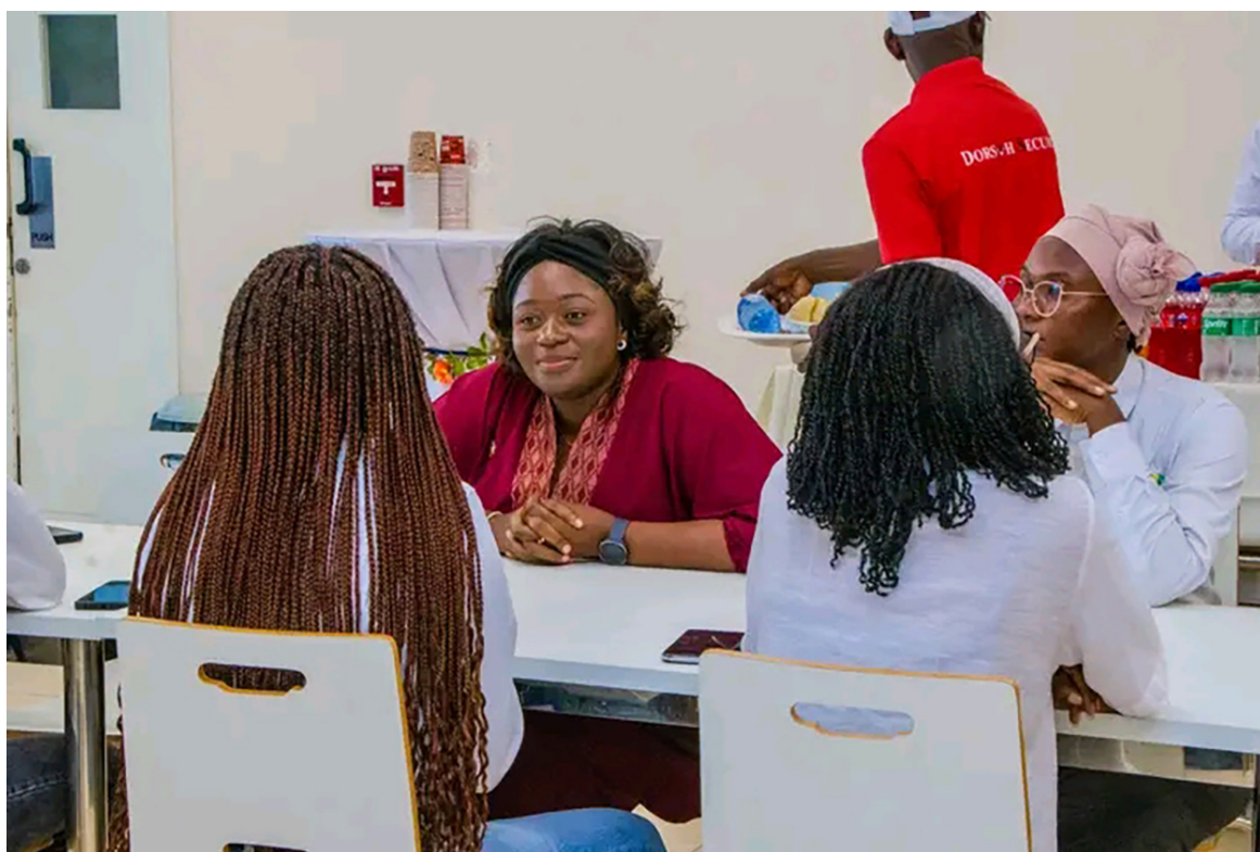
La directrice exécutive du CEO échangeant avec les étudiants chercheurs.