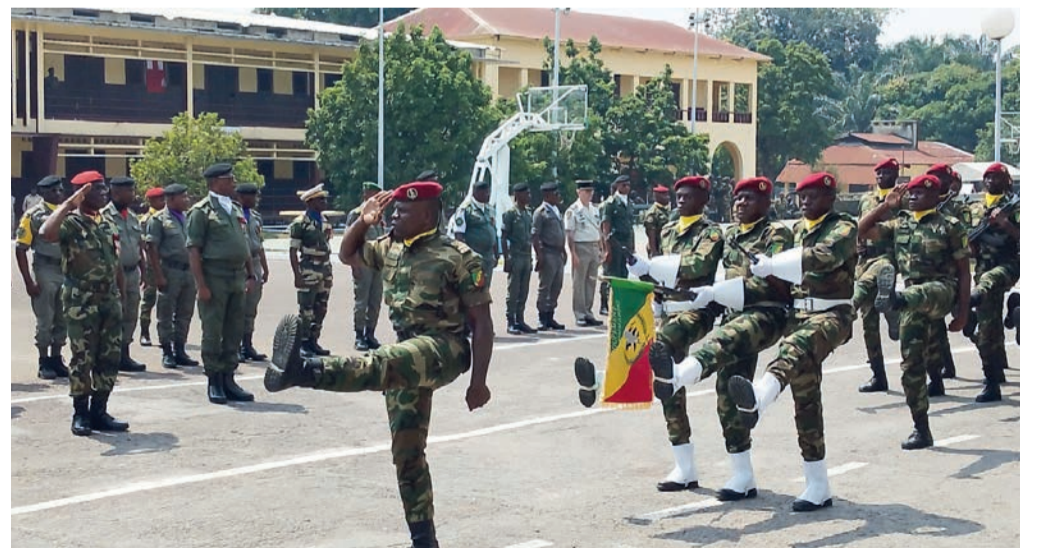
Une vue du défilé militaire

de la République, afin d'assurer la libre circulation des personnes et de leurs biens en maîtrisant toutes sortes de violence, dans le strict respect des règles d'engagement et de comportement propres aux Forces armées congolaises. Page 16