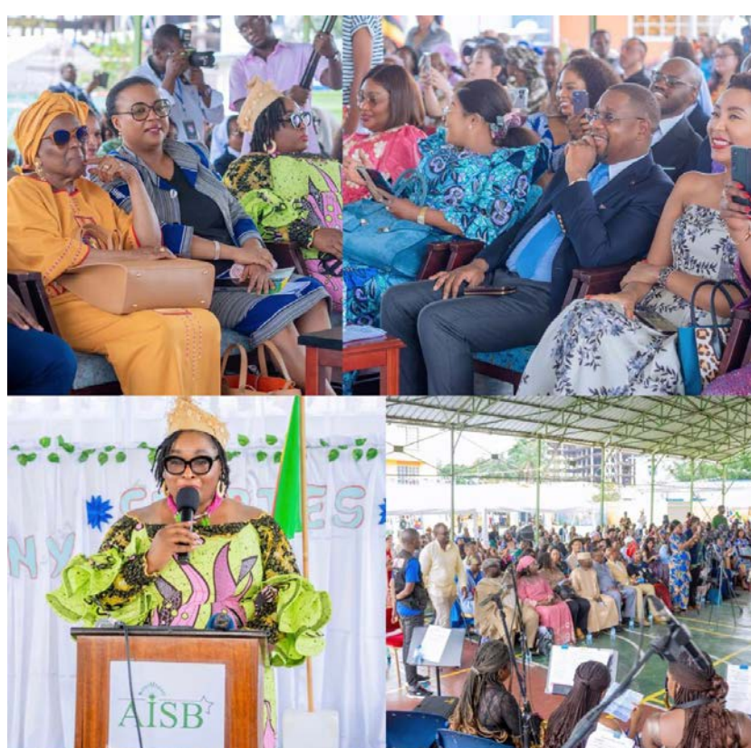
Retour en images de quelques moments phares de la célébration de la Journée internationale à l'AISB par la danse, la musique, la gastronomie et l'exposition/DR

Au-delà de la scène, l'expérience s'est prolongée dans les salles de classe, métamorphosées pour l'occasion en vitrines culturelles. Rwanda, Chine ou encore France : autant de pays explorés à travers des recherches, des objets artisanaux, des reproductions de sites emblématiques et des spé-